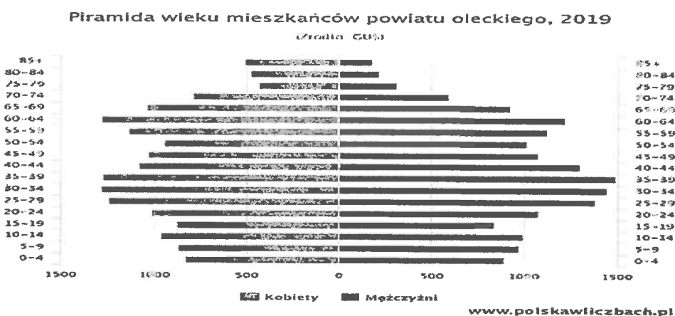
Tabela nr 1. Przedstawia Piramida wieku mieszkańców powiatu oleckiego

Powiat olecki położony jest w północno – wschodniej części województwa warmińsko - mazurskiego. W granicach administracyjnych powiatu znajduje się gmina miejsko-wiejska Olecko, gmina wiejska Kowale Oleckie , gmina wiejska Świętajno, gmina wiejska Wieliczki. Powiat zajmuje powierzchnię 874 km 2 , co stanowi 3,61 % obszaru województwa warmińsko – mazurskiego. Liczba mieszkańców powiatu wynosi 34 148, z czego 50,1 % stanowią kobiety, a mężczyźni 49,9 %. Średni wiek mieszkańców wynosi 40,6 lat i jest porównywany do średniego wieku mieszkańców województwa warmińsko – mazurskiego (dane GUS). W 2019 roku mieszkańcy powiatu oleckiego zawarli 128 małżeństw, co odpowiada 3,7 małżeństwom na 1000 mieszkańców. W tym samym okresie odnotowano 2,1 % rozwodów przypadających na 1000 mieszkańców. Jest to znacznie więcej od wartości dla województwa warmińsko – mazurskiego (dane GUS). 31,5% mieszkańców powiatu oleckiego jest stanu wolnego, 52,3% żyje w małżeństwie, 5,3% mieszkańców jest po rozwodzie, a 9,2% to wdowy/wdowcy. Powiat olecki ma ujemny przyrost naturalny wynoszący - 86. Odpowiada to przyrostowi naturalnemu -2,51 na 1000 mieszkańców powiatu oleckiego. W 2019 roku urodziło się 327 dzieci, w tym 51,4% dziewczynek i 48,6% chłopców. Współczynnik dynamiki demograficznej, czyli stosunek liczby urodzeń żywych do liczby zgonów, wynosi 0,79 i jest mniejszy od średniej dla województwa oraz znacznie mniejszy od współczynnika dynamiki demograficznej dla całego kraju.