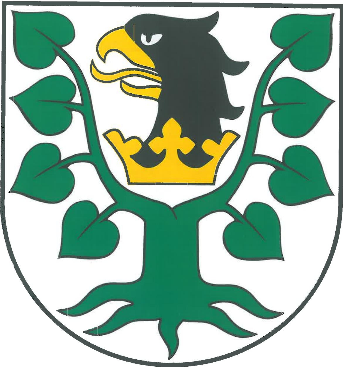
Paleta barw CMYK (do zastosowań poligraficznych)