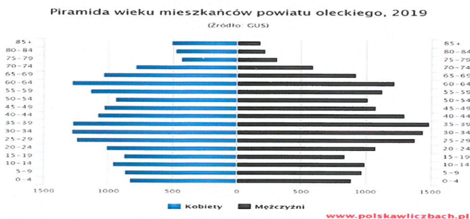
Tabela nr 1. Przedstawia Piramida wieku mieszkańców powiatu oleckiego

Powiat olecki położony jest w północno – wschodniej części województwa warmińsko - mazurskiego. W granicach administracyjnych powiatu znajduje się gmina miejsko-wiejska Olecko, gmina wiejska Kowale Oleckie , gmina wiejska Świętajno, gmina wiejska Wieliczki. Powiat zajmuje powierzchnię 874 km 2 , co stanowi 3,61 % obszaru województwa warmińsko – mazurskiego. Liczba mieszkańców powiatu wynosi 34 148, z czego 50,1 % stanowią kobiety, a mężczyźni 49,9 %. Średni wiek mieszkańców wynosi 40,6 lat i jest porównywany do średniego wieku mieszkańców województwa warmińsko – mazurskiego (dane GUS). W 2019 roku mieszkańcy powiatu oleckiego zawarli 128 małżeństw, co odpowiada 3,7 małżeństwom na 1000 mieszkańców. W tym samym okresie odnotowano 2,1 % rozwodów przypadających na 1000 mieszkańców. Jest to znacznie więcej od wartości dla województwa warmińsko – mazurskiego (dane GUS). 31,5% mieszkańców powiatu oleckiego jest stanu wolnego, 52,3% żyje w małżeństwie, 5,3% mieszkańców jest po rozwodzie, a 9,2% to wdowy/wdowcy. Powiat olecki ma ujemny przyrost naturalny wynoszący - 86. Odpowiada to przyrostowi naturalnemu -2,51 na 1000 mieszkańców powiatu oleckiego. W 2019 roku urodziło się 327 dzieci, w tym 51,4% dziewczynek i 48,6% chłopców. Współczynnik dynamiki demograficznej, czyli stosunek liczby urodzeń żywych do liczby zgonów, wynosi 0,79 i jest mniejszy od średniej dla województwa oraz znacznie mniejszy od współczynnika dynamiki demograficznej dla całego kraju.