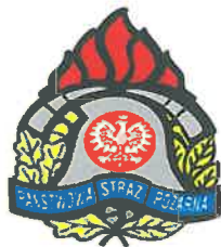
KP PSP Olecko