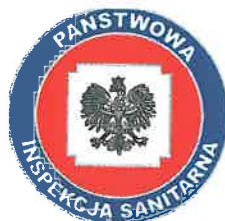
PSS – E Olecko