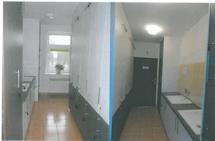
Pomieszczenie do prania, suszenia SOW