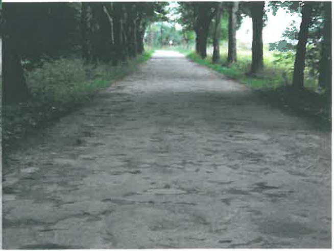
Droga nr 1877 N Boćwinka (dr. woj. 650 – Leśny Zakątek (dr. nr 1746 N) – Borki – Gryzy (dr. nr 1887 N), na odcinku Boćwinka – Leśny Zakątek,