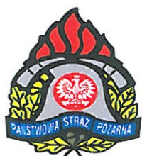
KP PSP Olecko