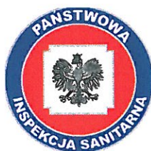
PSS – E Olecko