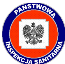
PSS – E Olecko