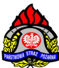
KP PSP Olecko