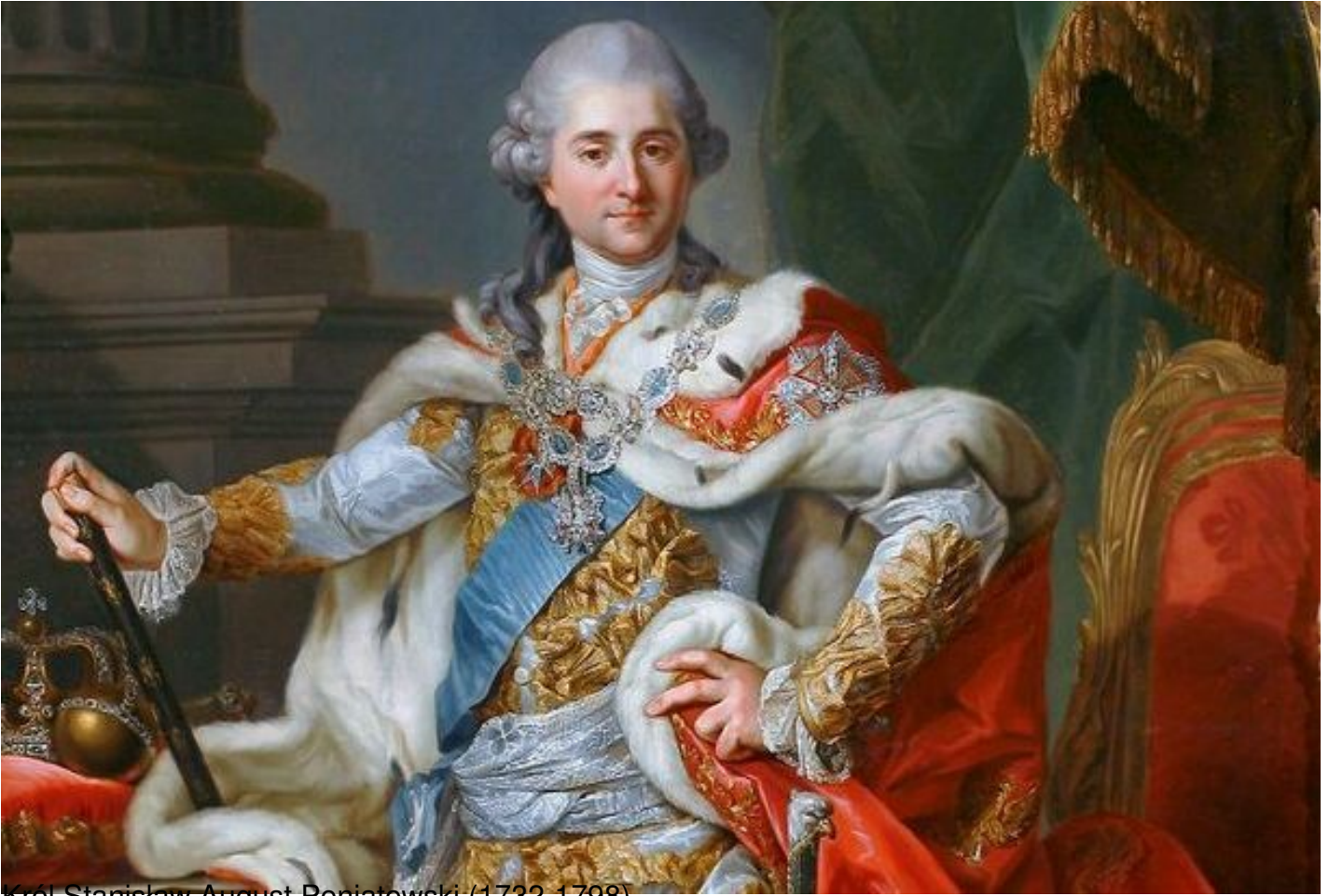
Król Stanisław August Poniatowski (1732-1798)