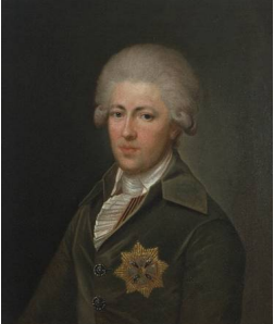
Ignacy Potocki (1750-1809)