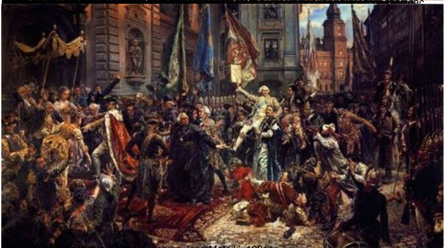
Uchwalenie Konstytucji 3 maja – obraz Jana Matejki, 1891