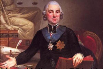
Hugo Kołłątaj (1750-1812)