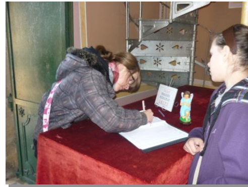
Przy cudownym źródleku na stoku Zaśpit