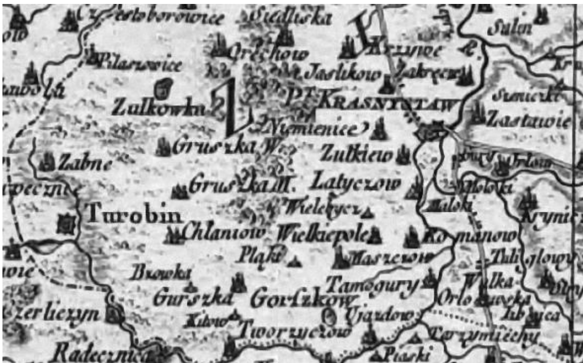
Okolice Krasnegostawu na mapie z 1772 roku (Carte de la Pologne)

kategorie chłopów: kmiecie – dzierżawiący grunty dziedzicznie oraz zagrodnicy, chałupnicy i komornicy stanowiący różne kategorie chłopów od posiadających dożywotnio kawałek grunt, poprzez dzierżawiących grunt dożywotnio, po robotników rolnych. Gromada wiejska stanowiła też własne sądownictwo pod przewodnictwem ławy wiejskiej. Na tak zwanych sądach „rugowych” wybierany przez gromadę ławnik musiał oddawać rug, co oznaczało, że stawał się oskarżycielem publicznym we wszystkich przestępstwach popełnianych przez mieszkańców gromady od czasu ostatniego sądu. Kary były pieniężne lub chłosty. Za zabójstwo stosowano karę śmierci przez ścięcie. Za zdradę pana lub gromady odebranie gruntu. Karę oznaczała ława wiejska, a dziedzic ją zatwierdzał lub łagodził. Jak pisał F. Konieczny: Wieś polska była doprawdy małym państwem sama w sobie. Wszelkie potrzeb, tak materialne, jakież społeczne, zaspokajała sobie sama u siebie. Chłop uważał stosunek swój do dziedzica i gromady za naturalny, a związek ten za konieczny; związek zaś wsi swojej do państwa tylko za dodatkowy ciężar. O potrzebie związku z państwem nie miał najmniejszego pojęcia. Istnienie takiego związku dostrzegał chyba aż dopiero wtenczas gdy przypadła na wieś czasem tak zwana stacja żołnierska. On sam ani wojskowo nie służył, ani podatku do kasy państwowej nie odnosił. Lata całej nic o istnieniu państwa nie słyszał!