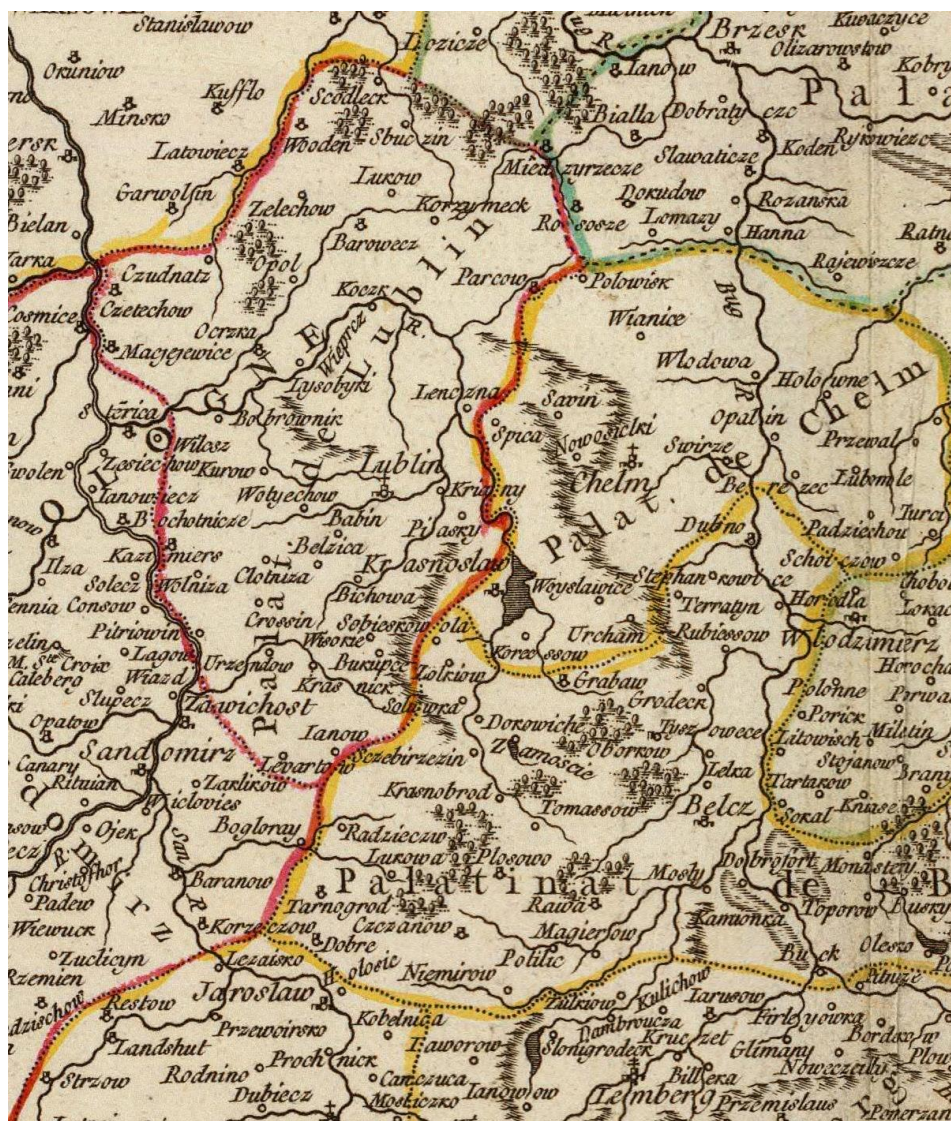
Województwo lubelskie i sąsiednie na mapie z połowy XVIII wieku

włączono powiat krasnostawski. Ten stan nie trwał długo, ponieważ w 1795 roku tereny województwa lubelskiego i chełmskiego znalazły się w III zaborze austriackim 7 .