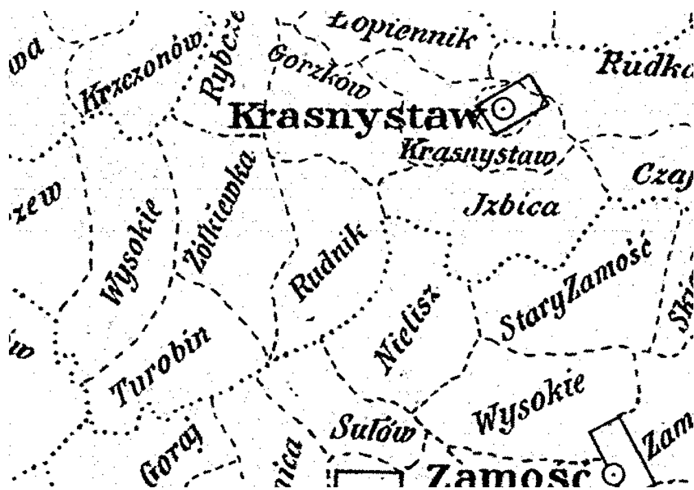
ADMINISTRACYJNA MAPA KRÓLESTWA POLSKIEGO Z POCZĄTKU XX WIEKU

W 1912 roku Rosja wydzieliła wschodnie tereny guberni siedleckiej oraz lubelskiej tworząc nową gubernię chełmską, którą z czasem zamierzano włączyć do Rosji. W jej skład weszły powiaty: bialski (z guberni siedleckiej), część włodawskiego, konstantynowskiego i radzyńskiego. Z guberni lubelskiej: hrubieszowski, tomaszowski, część chełmskiego, biłgorajskiego, zamojskiego, krasnostawskiego i lubartowskiego.