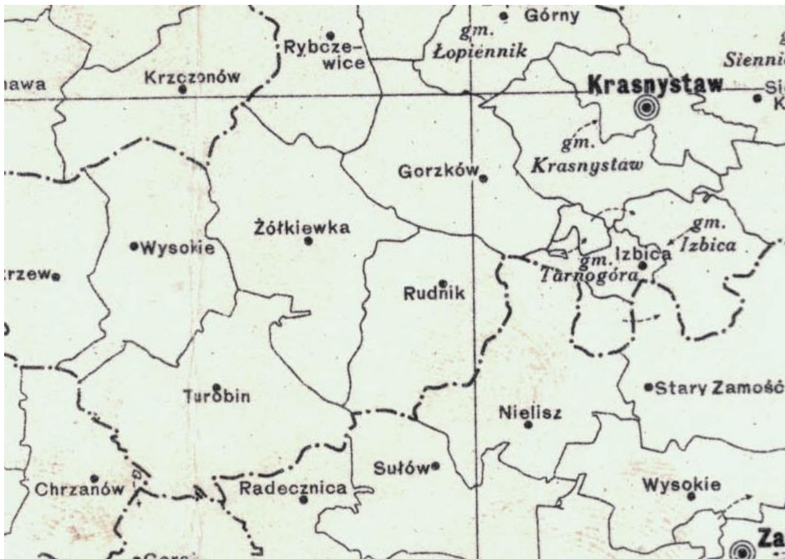
FRAGMENT ADMINISTRACYJNEJ MAPY RP Z 1938 ROKU

W 1933 roku dokonano wielu zmian w funkcjonowaniu gmin wiejskich w Polsce. Według nowej ustawy gminnej 35 z 23 marca 1933 roku zniesiono Zebranie Gminne, czyli zgromadzenie ogółu gospodarzy z terenu gminy. Uprawnienia zniesionego organu przekazano częściowo Radzie Gminnej. Mimo to według nowych przepisów rada gminy miała mniejsze uprawnienia. Wyboru radnych dokonywało kolegium złożone z delegatów rad gromadzkich, sołtysów i podsołtysów wszystkich gromad. Istniał cenzus wieku przy prawie wyborczym czynnym 25 lat (wcześniej 21) i w prawie wyborczym biernym wynoszący 30 lat (wcześniej 25).