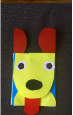
Kinga i Radosław