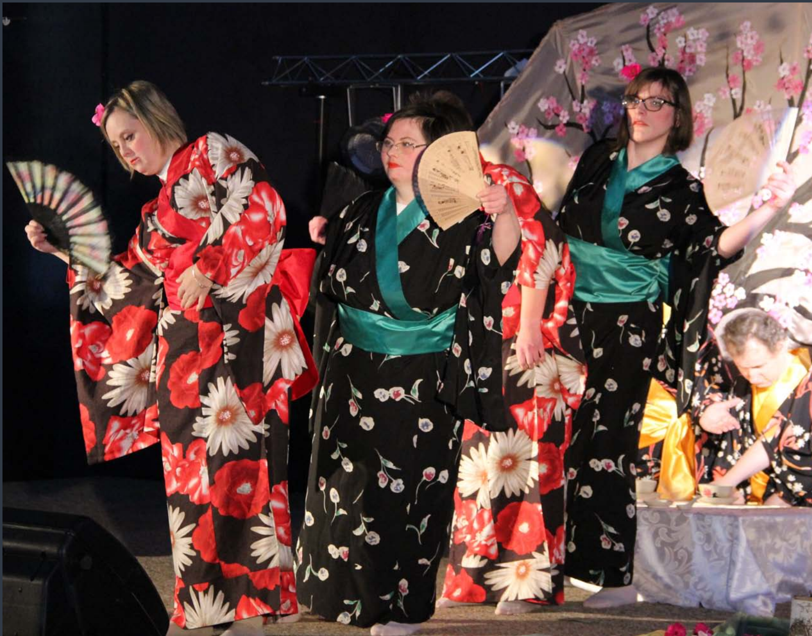
■ Regionalne eliminacje do Ogólnopolskiego Festiwalu Twórczości Teatralno - Muzycznej Osób Niepełnosprawnych „Albertiana” ■ Taneczne Wiktorie w Głownie