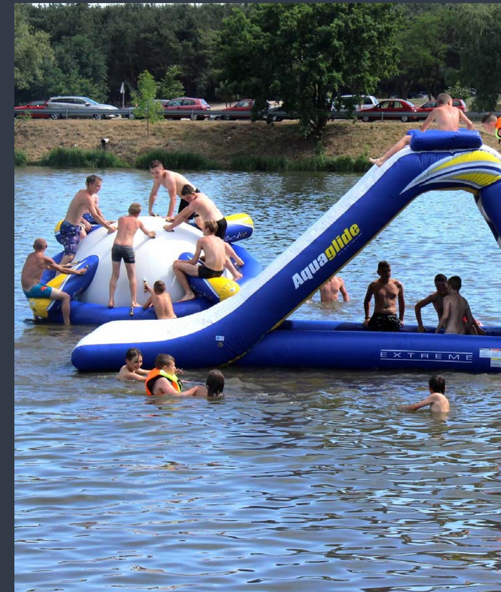
■ Boisko do siatkówki w Głownie ■ Wystawa lalek „Dzieciocy Świat, zabawki z dawnych lat” – Muzeum Miasta Zgierza ■ Atrakcje wodne nad zalewem Mroźyczka w Głownie