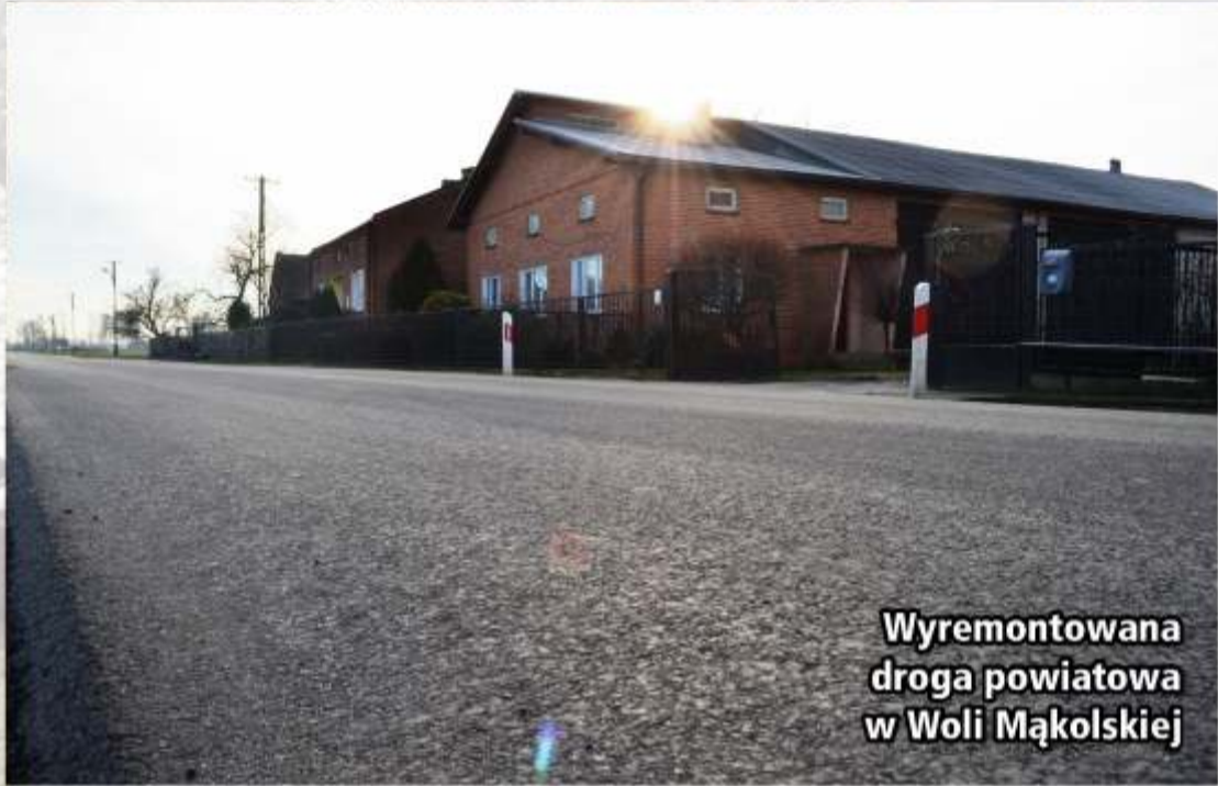
Wyremontowana droga powiatowa w Woli Mąkolskiej

Od ostatnich wyborów samorządowych minęły już dwa lata. Czas na podsumowanie. 11 mln zł, natomiast w tym jest to kwota o 2,5 mln zł wyższa. Znaczna część tej kwoty gminami oraz pozyskaniu funduszy zewnętrznych, w ciągu dwóch lat, możliwe było p