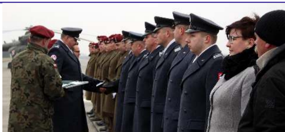
Święto było także okazją do przyznania okolicznościowych nagród i odznaczeń dla najlepszych żołnierzy

Oprócz obowiązkowej defilady, dla gości zostały przygotowane także niespodzianki w postaci koncertu Orkiestry Wojskowej z Radomia oraz pokazu wyszkolenia żołnierzy podczas walki w tzw. bliskim kontakcie. [JŁ]