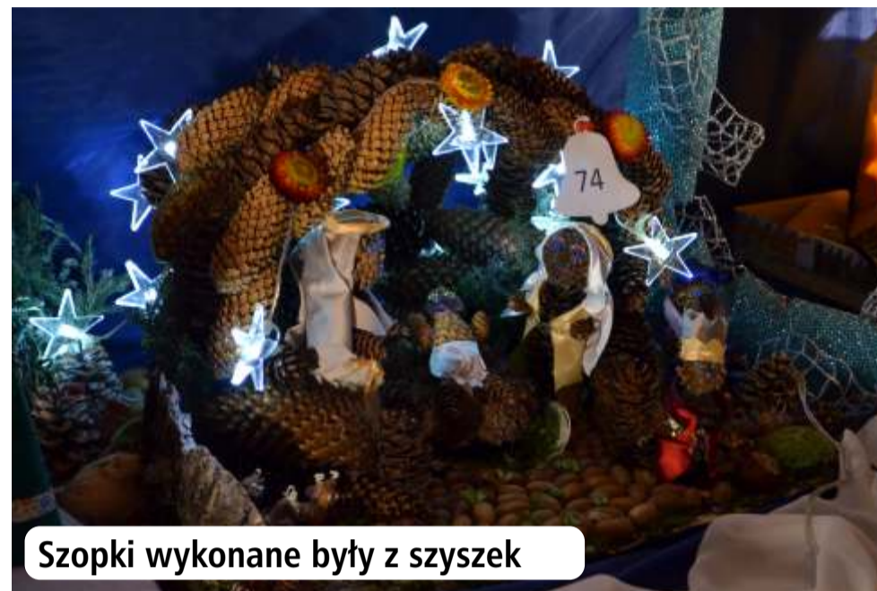
Szopki wykonane były z szyszek