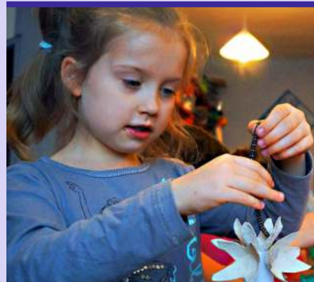
Przykład zgierskiego MDK-u pokazuje, że zimową przerwę szkolną można spędzić kreatywnie