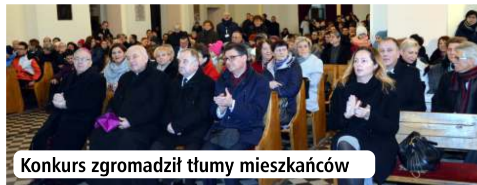
Konkurs zgromadził tłumy mieszkańców