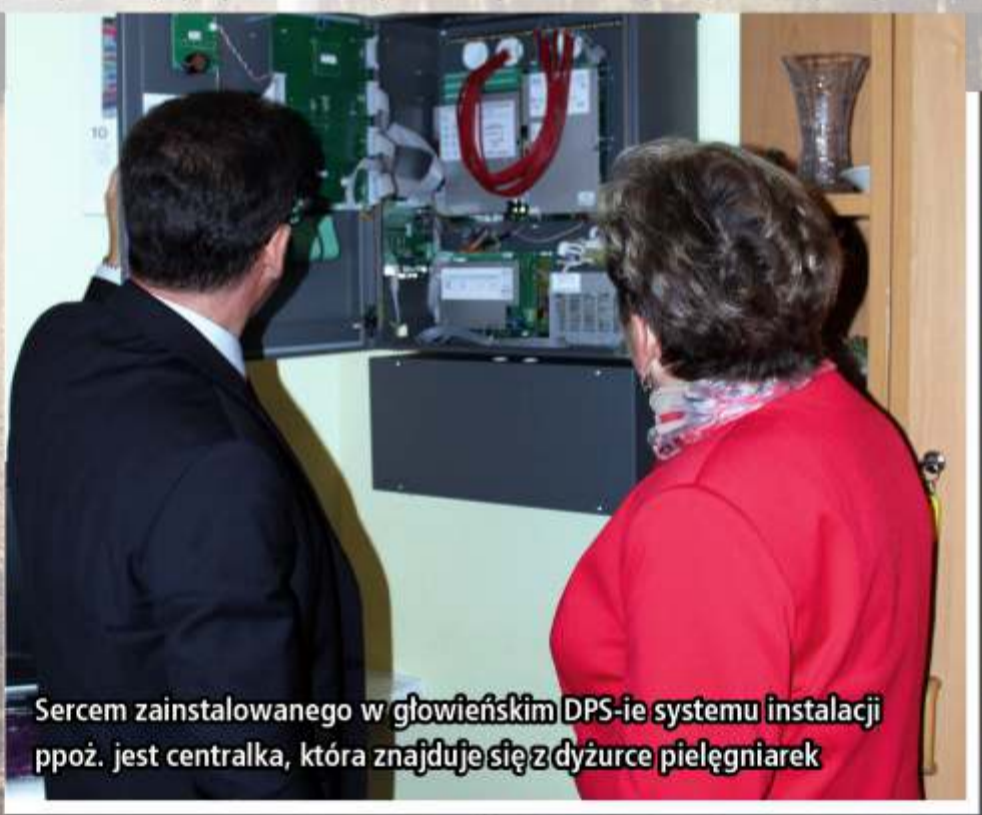
Sercem zainstalowanego w głowieńskim DPS-ie systemu instalacji ppoż. jest centralka, która znajduje się z dyżurce pielęgniarek

Z kolei w głowieńskim DPS-ie zostały zrealizowane dwa projekty, mające na celu poprawę bezpieczeństwa w placówce. Modernizacja źródeł ciepła, to projekt zrealizowany przy wsparciu funduszy WFOŚiGW w Łodzi za kwotę prawie 370 tys. zł, w ramach którego została zmodernizowana kotłownia, zainstalowano pompy ciepła oraz węzeł cieplny z pełną automatyką pogodową i sterowaniem. Zainstalowano również instalację przeciwpożarową. Ze środków przekazanych przez Starostwo Powiatowe w Zgierzu, za blisko 130 tys. zł, zostały zamontowane drzwi przeciwpożarowe oraz system optycznych i temperaturowych czujek dymu zainstalowanych w każdym pomieszczeniu wraz z centralką, która w razie pożaru automatycznie łączy się z Powiatową Komendą Państwowej Straży Pożarnej w Zgierzu.