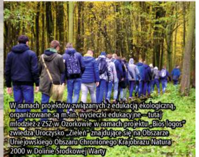
W ramach projektów związanych z edukacją ekologiczną, organizowane są m.in. wycieczki edukacyjne – tutaj młodzież z ZSZ w Ozorkowie w ramach projektu „Bios logos” zwiedza Uroczysko „Zieleń” znajdujące się na Obszarze Uniejowskiego Obszaru Chronionego Krajobrazu Natura 2000 w Dolinie Środkowej Warty

„Utworzenie EKO – pracowni” przy Zespole Szkół Zawodowych w Ozorkowie, za kwotę ok. 30 tys. zł. i cykl zajęć proekologicznych „Bios logos” – to dwa projekty w ramach których uczniowie zyskali nowoczesną pracownię, a także odwiedzili m. in. uroczysko „Zieleń” w dolinie Warty oraz „Arboretum” w Rogowie. Dofinansowanie