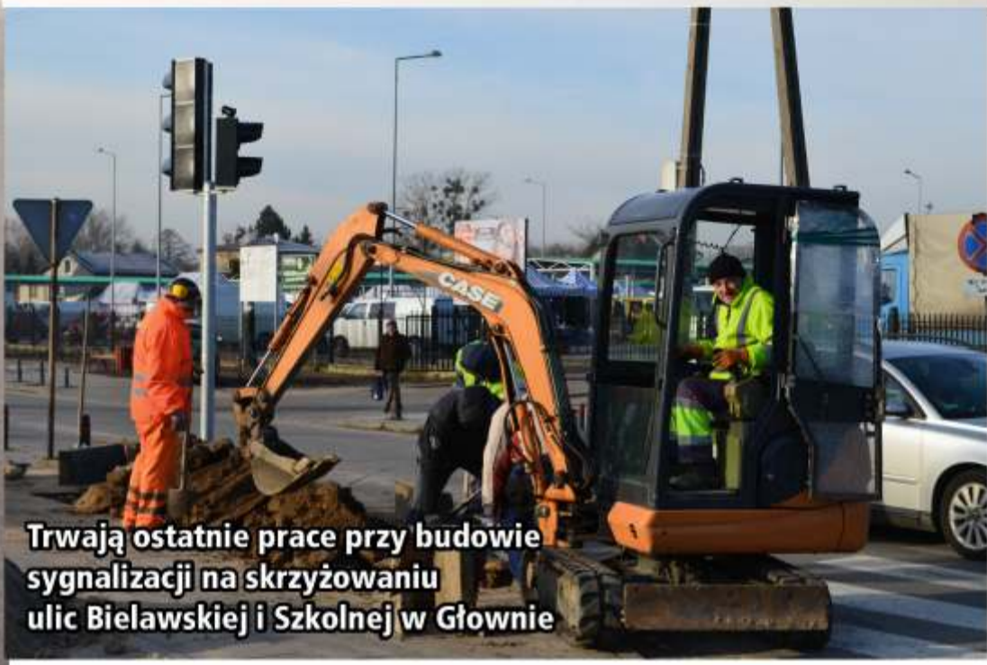
Trwają ostatnie prace przy budowie sygnalizacji na skrzyżowaniu ulic Bielawskiej i Szkolnej w Głownie

Wszystkie inwestycje drogowe w 2016 roku pochłonęły ponad 7 mln zł, za które zostały wyremontowane prawie 23 km dróg powiatowych oraz 1,5 km chodników, znajdujących się w pasach dróg powiatowych.