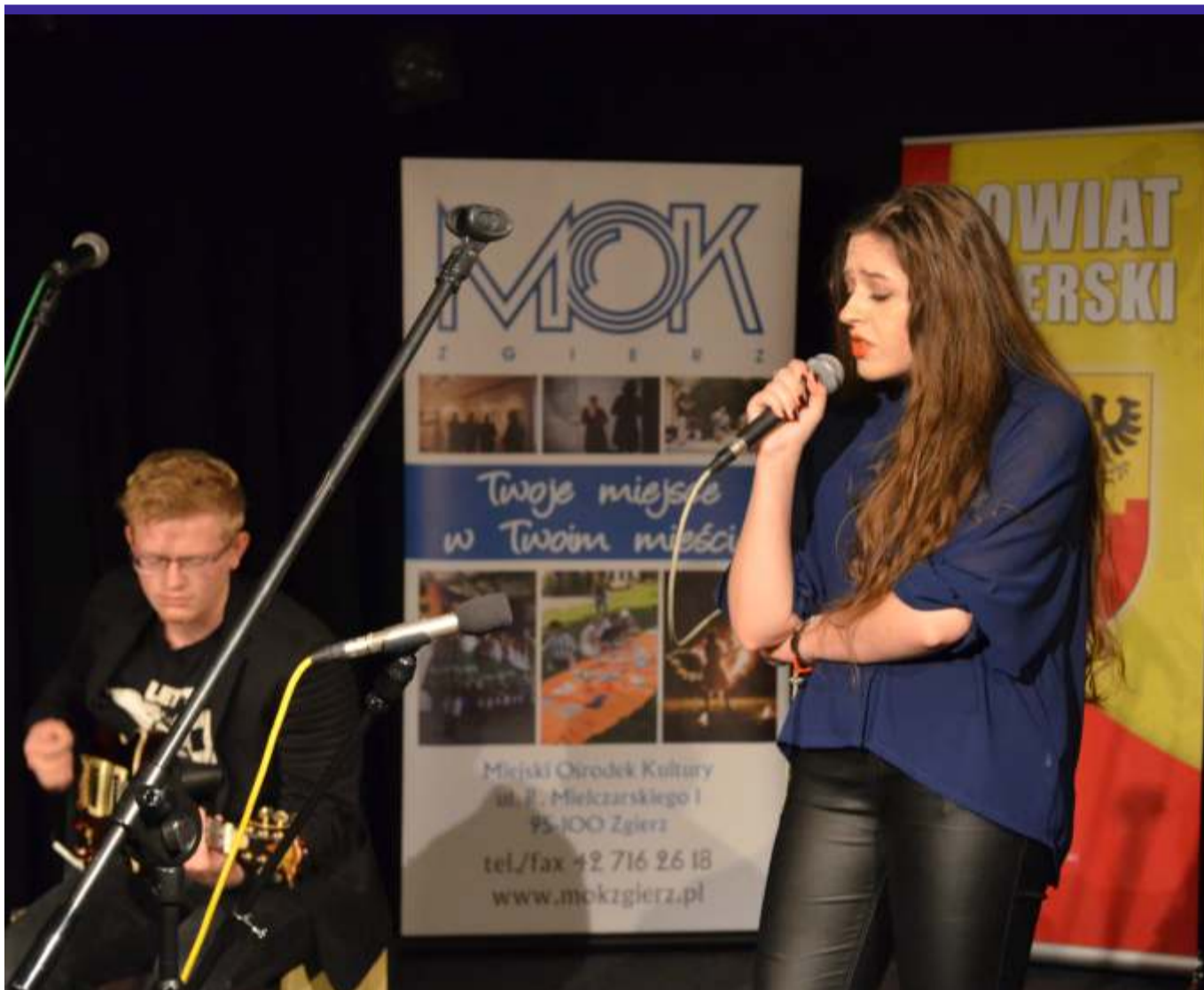
Jak co roku w „Turnieju Piosenki Poetyckiej” zaprezentowali się zarówno zgierzanie, jak i osoby z odległych krańców Polski