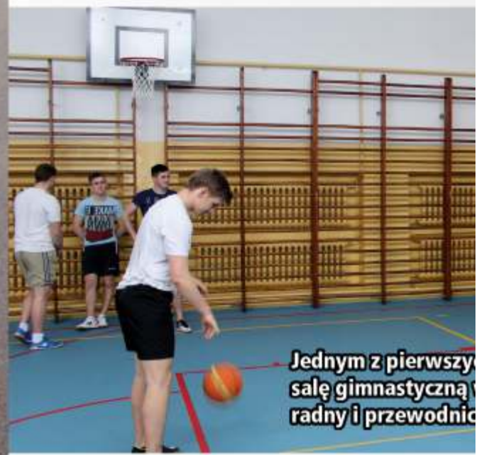
Jednym z pierwszych zadań było wybudowanie i wyposażenie sali gimnastycznej i pracowni

„Edukacja Ekologiczna w szkołach i przedszkolach na rok szkolny 2016/2017” – to projekt, w ramach którego ze środków WFOŚiGW i powiatu zgierskiego, za kwotę