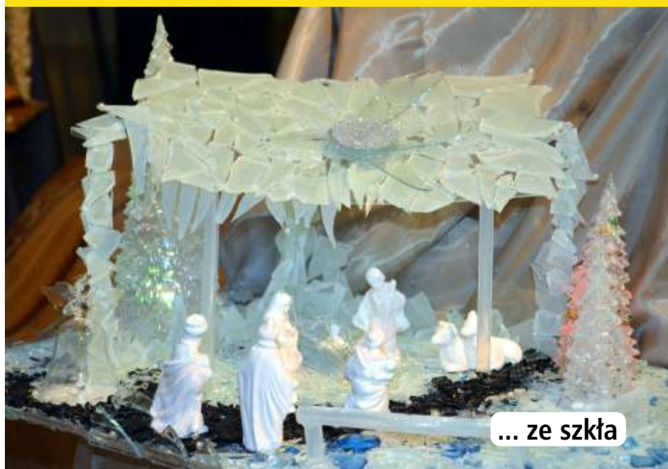
... ze szkła