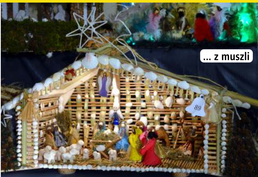
... z muszli