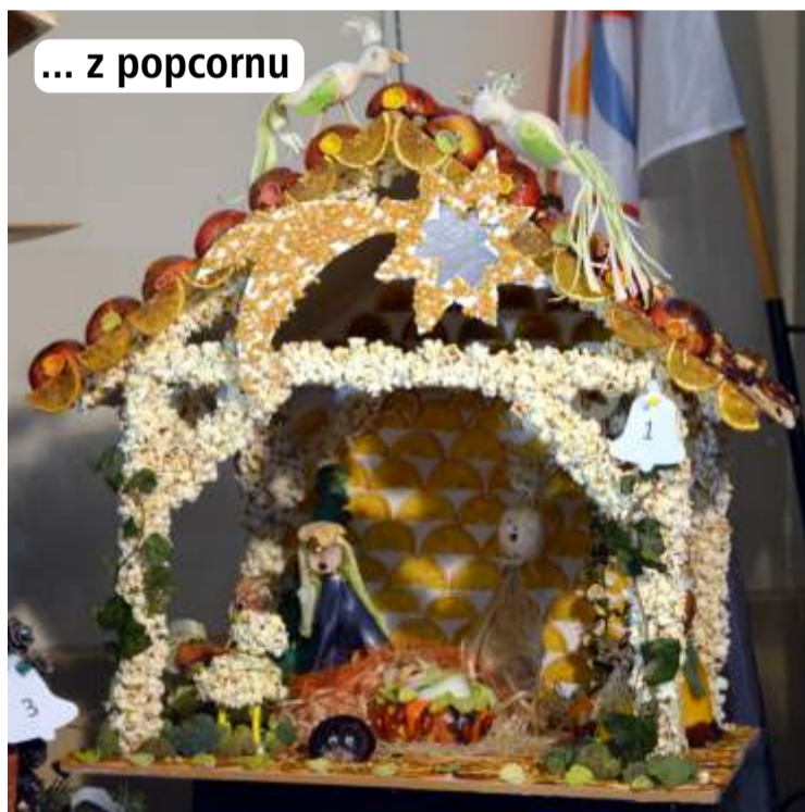
... z popcornu