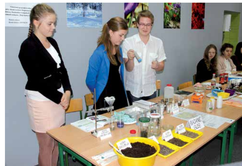
Przed młodymi ekologami najpierw zajęcia teoretyczne, a później badania w terenie

W 2013 r. cztery powiatowe szkoły wzięły udział w projekcie „Ekoszkola-Ekopowiat”. W ramach programu w placówkach powstały specjalne „Ekokluby”, w których uczniowie edukowali się z zakresu ochrony środowiska i przekazywali tę wiedzę mieszkańcom naszego powiatu m.in. podczas prelekcji w szkołach, w trakcie regionalnych festynów, targów oraz imprez plenerowych. Projekt cieszył się tak dużym zainteresowaniem wśród młodzieży, że postanowiono kontynuować działalność ekoklubów. Dzięki dofinansowaniu z Wojewódzkiego Funduszu Ochrony Środowiska i Gospodarki Wodnej w Łodzi, powiatowe „ekokluby” wzbogaciły się o nowe pomoce dydaktyczne, które urozmaicą i uatrakcyjnią proekologiczną edukację.