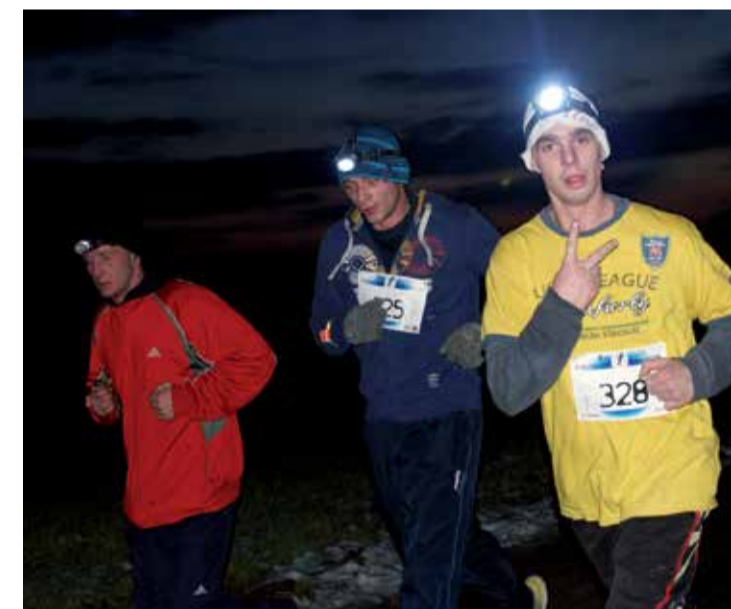
Mimo mroźnej aury biegaczom dopisywał humor