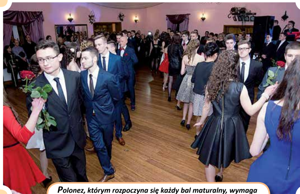
Polonez, którym rozpoczyna się każdy bal maturalny, wymaga odtączenia wielu figur (ZSL-G w Głownie)

Dziękujemy szkołom za udostępnienie zdjęć.