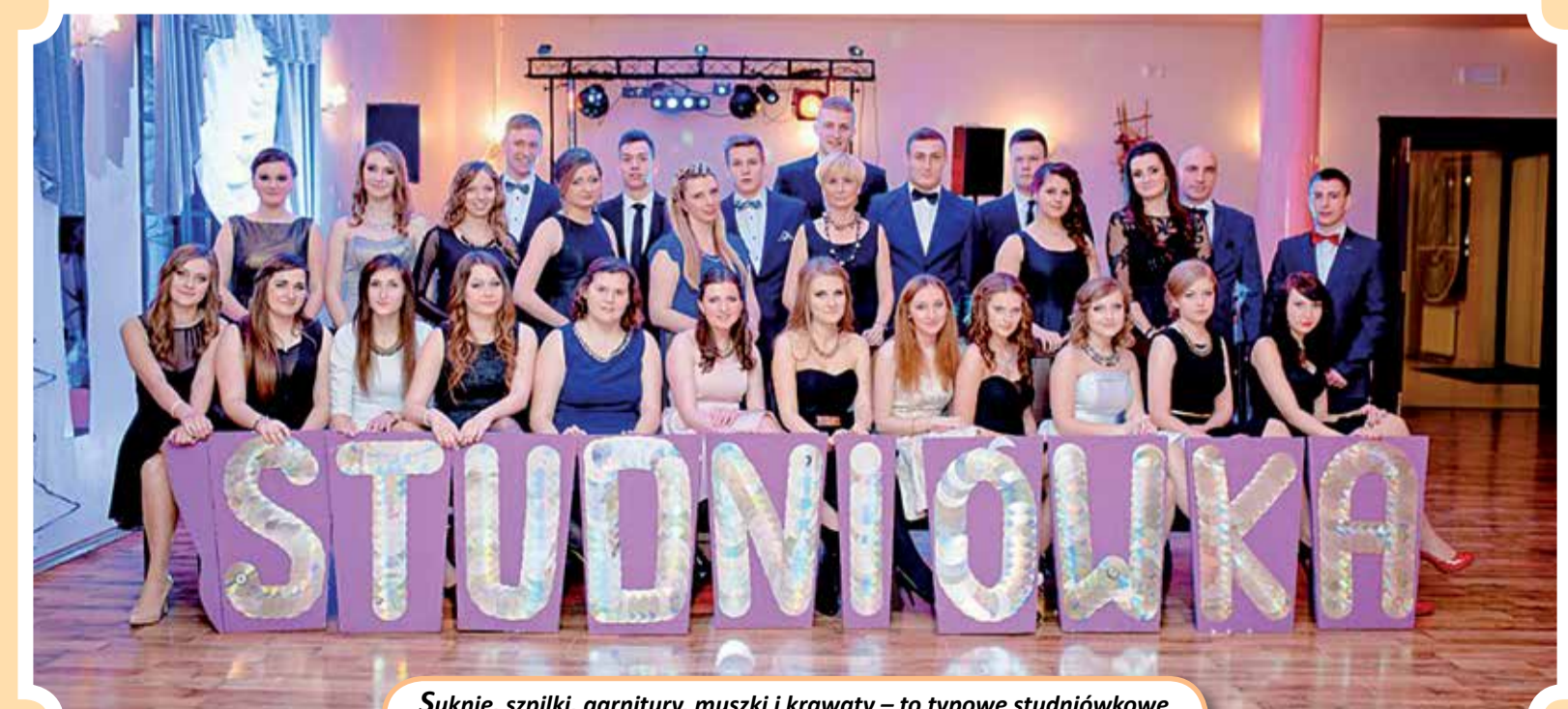
Suknie, szpilki, garnitury, muszki i krawaty – to typowe studniówkowe atrybuty, które ubrali także uczniowie klasy III d z ZSO w Ozorkowie