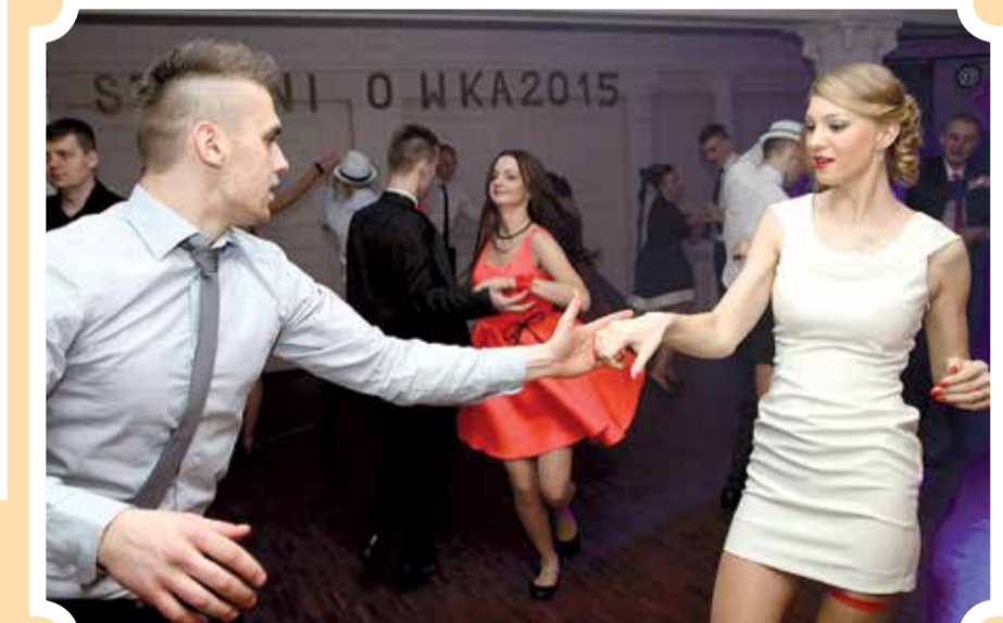
Tańce i zabawa trwały do świtu (ZSZ Aleksandrów Łódzki)