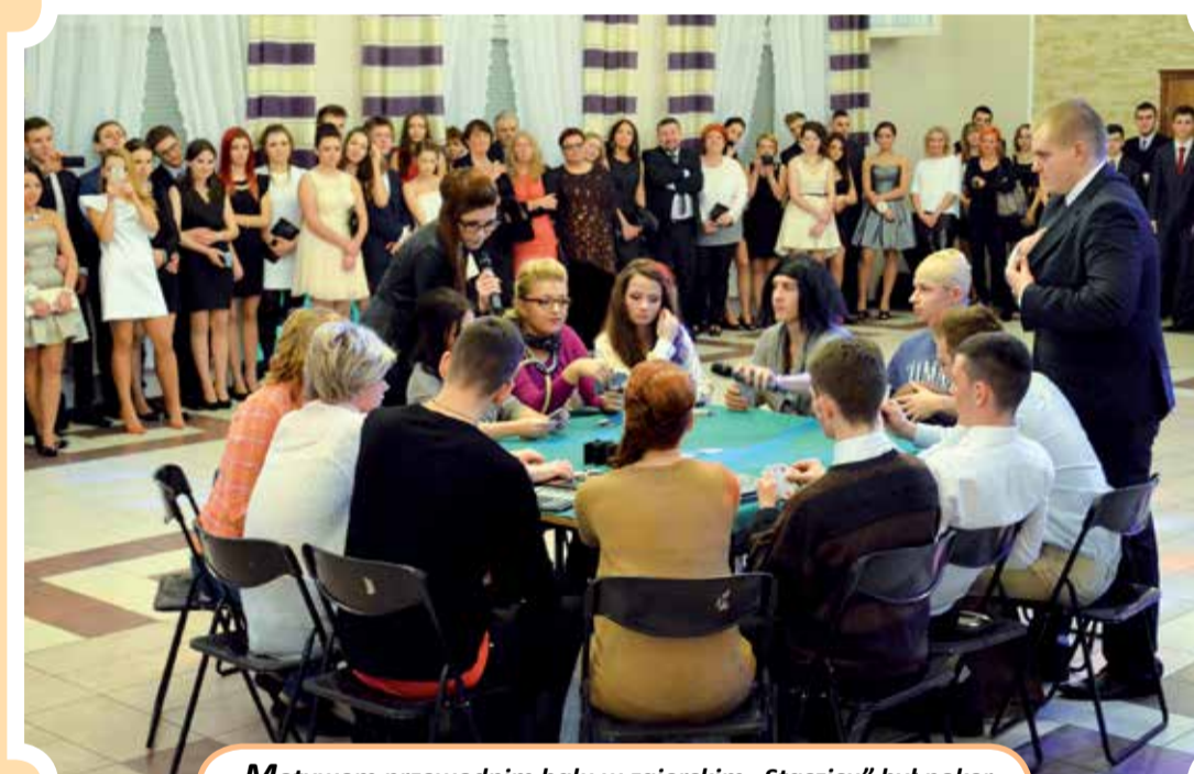
Motywem przewodnim balu w zgierskim „Staszicu” był poker, w którym życie rozdaje karty