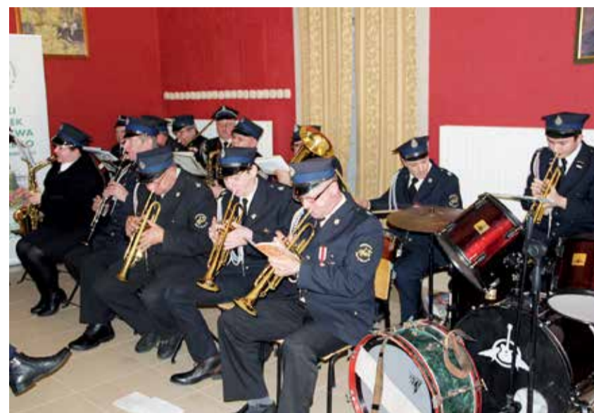
Jak na prawdziwej biesiadzie było głośno i rytmicznie, dzięki strażakom ochotnikom z Solcy Wielkiej

Tradycyjnie ostatki w powiecie zgierskim upłynęły przy biesiadnym stole. W tym roku podczas XI Powiatowej Biesiady Karnawałowej Łódzki Ośrodek Doradztwa Rolniczego z siedzibą w Bratoszewicach oraz Wójt Gminy Ozorków zaprosili polityków, samorządowców, lokalne instytucje, stowarzyszenia oraz koła gospodyń wiejskich na zapustową ucztę. Dla ducha program artystyczny przygotował Gminny Ośrodek Kultury w Leśmierzu, a dla ciała były stoły uginające się pod potrawami przygotowanymi przez powiatowe gospodynie.