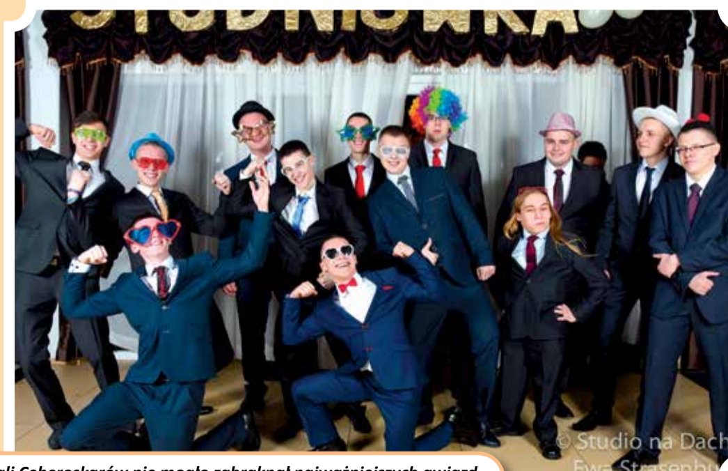
Podczas Gali Ceberoskarów nie mogło zabraknąć najważniejszych gwiazd – tegorocznych maturzystów z ZS nr 1 im. Cebertowicza w Głownie