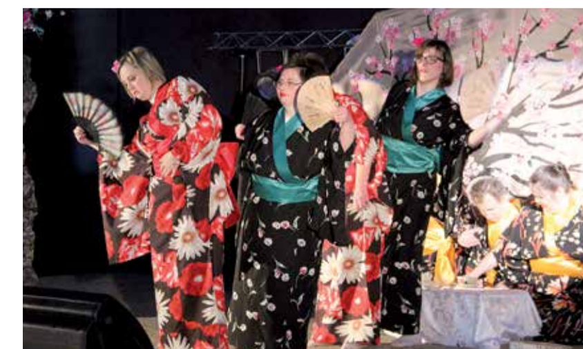
Zespół „Akcent” swoim przedstawieniem starał się uświadomić innym jak ważne jest dbanie o środowisko i jakie mogą być konsekwencje niszczenia przyrody