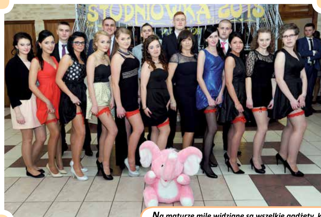
Na maturze mile widziane są wszelkie gadżety, które mają przynieść szczęście (ZS nr 1 im. Cezaka w Zgierzu)