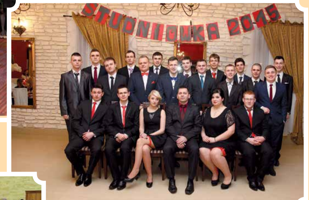
Klasa o profilu informatycznym w ozorkowskim ZSZ jest zdecydowanie zdominowana przez mężczyzn