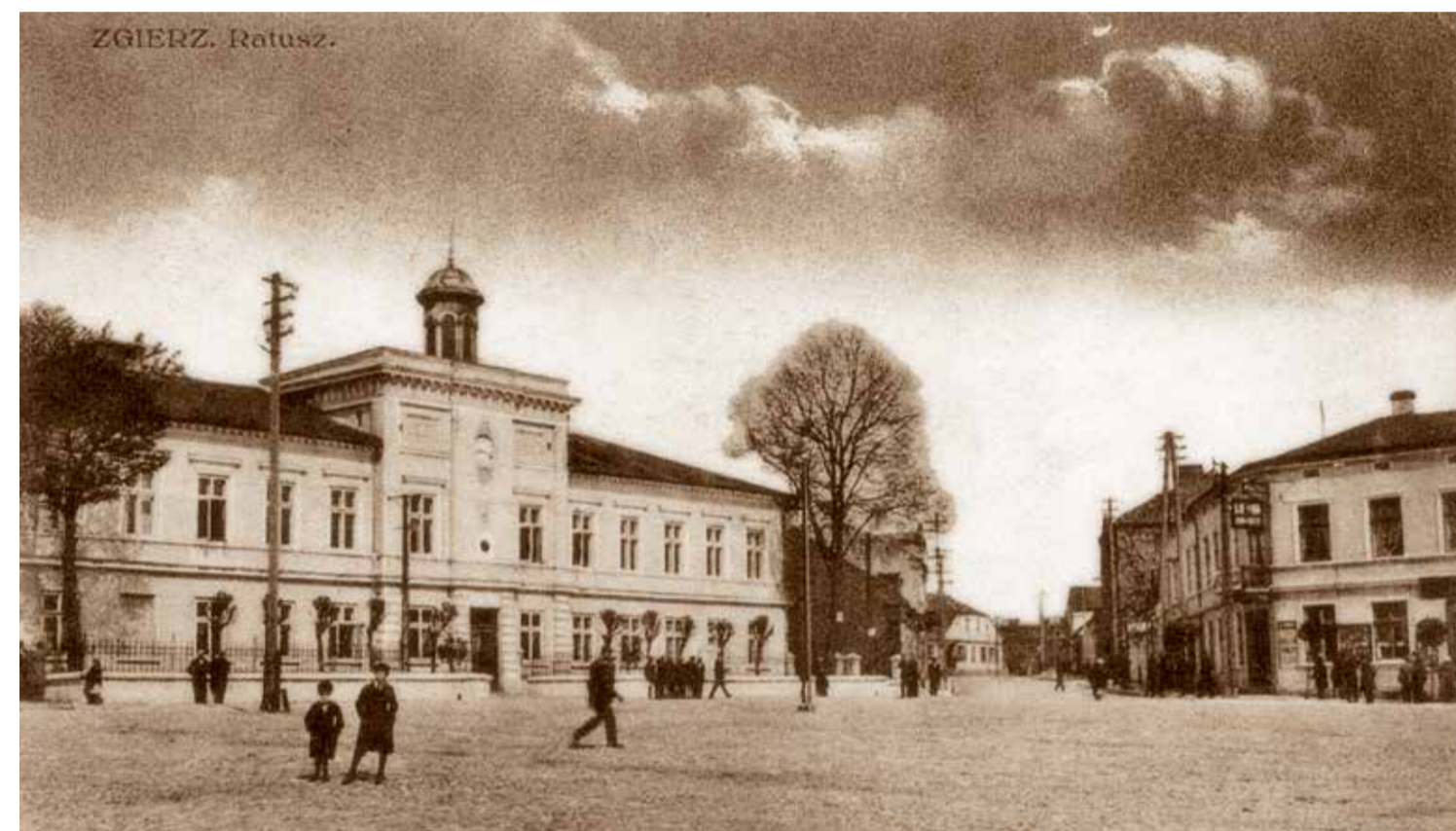
Radni za swoją pracę nie otrzymywali wynagrodzenia, pełniąc funkcję honorowo. Radni nie mogli pracować jako urzędnik w magistracie, ani prowadzić biznesu z gminą jako „przedsiębiorca, dostawca lub dzierżawca”

W początkach Drugiej Rzeczypospolitej, na ziemiach byłego Królestwa Polskiego, postanowiono dokonać radykalnych zmian w funkcjonowaniu samorządu miejskiego. Miał temu służyć dekret z 4 lutego 1919 r. wydany przez Naczelnika Państwa Józefa Piłsudskiego i ówczesnego premiera Ignacego Paderewskiego. Dekret miał obowiązywać tylko w 150 miastach, które były wymienione w dołączonym wykazie, a jednym z nich był Zgierz.