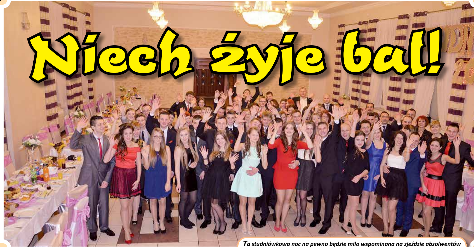
Ta studniówkowa noc na pewno będzie miło wspomniana na zjeździe absolwentów przez maturzystów ZSP im. Jana Pawła II w Zgierzu

Na 100 dni przed najważniejszym egzaminem w życiu każdego ucznia, przychodzi czas na huczną zabawę. W styczniu dziewięć powiatowych szkół: Zespół Szkół Ogólnokształcących im. S. Staszica w Zgierzu, Zespół Szkół nr 1 im. J.S. Cezaka w Zgierzu, Zgierski Zespół Szkół Ponadgimnazjalnych im. Jana Pawła II, Szkoła Mistrzostwa Sportowego – Liceum Ogólnokształcące im. Mikołaja Kopernika w Aleksandrowie Łódzkim, Zespół Szkół Zawodowych im. S. Staszica w Aleksandrowie Łódzkim, Zespół Szkół nr 1 im. prof. R.A. Cebertowicza w Głownie, Zespół Szkół Licealno-Gimnazjalnych w Głownie, Zespół Szkół Ogólnokształcących w Ozorkowie oraz Zespół Szkół Zawodowych w Ozorkowie zorganizowało studniówkę.