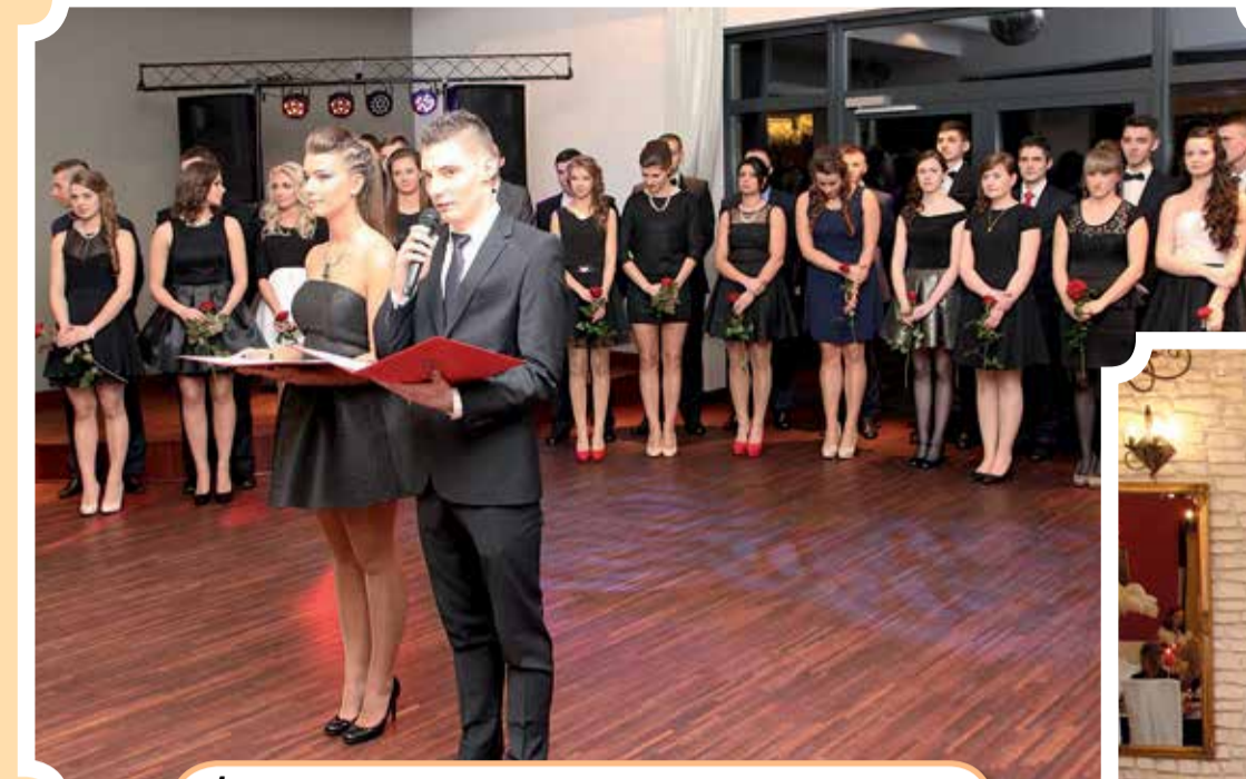
Jeszcze tylko trzeba przywitać gości, i ... poloneza czas zacząć (SMS – LO im. M. Kopernika w Aleksandrowie Łódzkim)