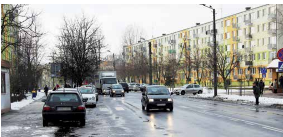
Drogowcy zajmą się ustawianiem oznakowań jak tylko pozwolą na to warunki atmosferyczne – przewiduje się, że będzie to w kwietniu

O zmianie organizacji ruchu będą informować 42 znaki i tablice ustawione nie tylko na ulicy objętej zakazem, ale także już na drogach wojewódzkich i krajowych. Ponieważ plan ma na celu wyprowadzenie ruchu tranzytowego poza obszar ul. Gałczyńskiego, konieczne jest ustawienie odpowiednich znaków informujących kierowców zanim jeszcze wjadą do centrum Zgierza. MT