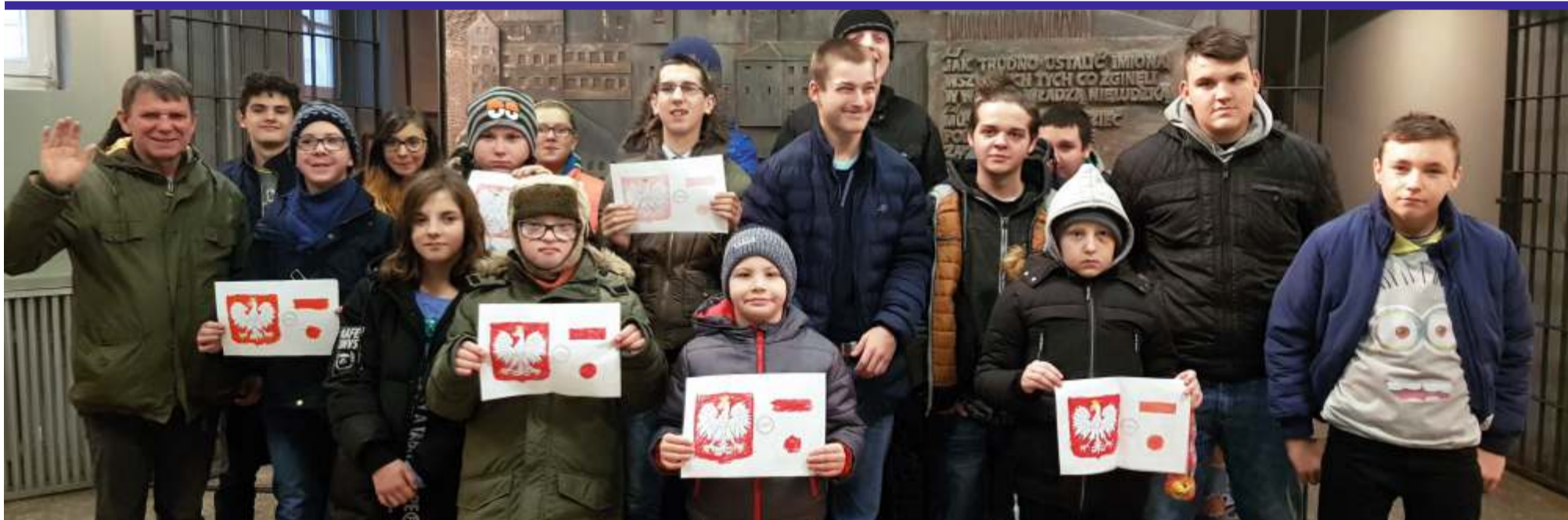
W ramach projektu, uczniowie Zespołu Szkół Specjalnych w Głownie zwiedzali Warszawę. W programie wycieczki nie zabrakło miejsc męczeństwa narodu polskiego, zwiedzania więzienia na Pawiaku, Wojskowego Cmentarza na Powązkach, Grobu Nieznanego Żołnierza oraz spaceru po Starówce, dzięki któremu uczniowie mogli podziwiać i docenić pracę włożoną w odbudowę stolicy po zniszczeniach wojennych.

cy projektu wzięli udział w wycieczce edukacyjnej do Łodzi przebiegającej pod hasłem „Droga ku niepodległości”. W ramach obchodów Święta Niepodległości przygotowano również uroczystą akademię, podczas której Specjalnemu Ośrodkowi Szkolno-Wychowawczemu im. K. Makuszyńskiego w Zgierzu nadano medal „Pro Patria”.