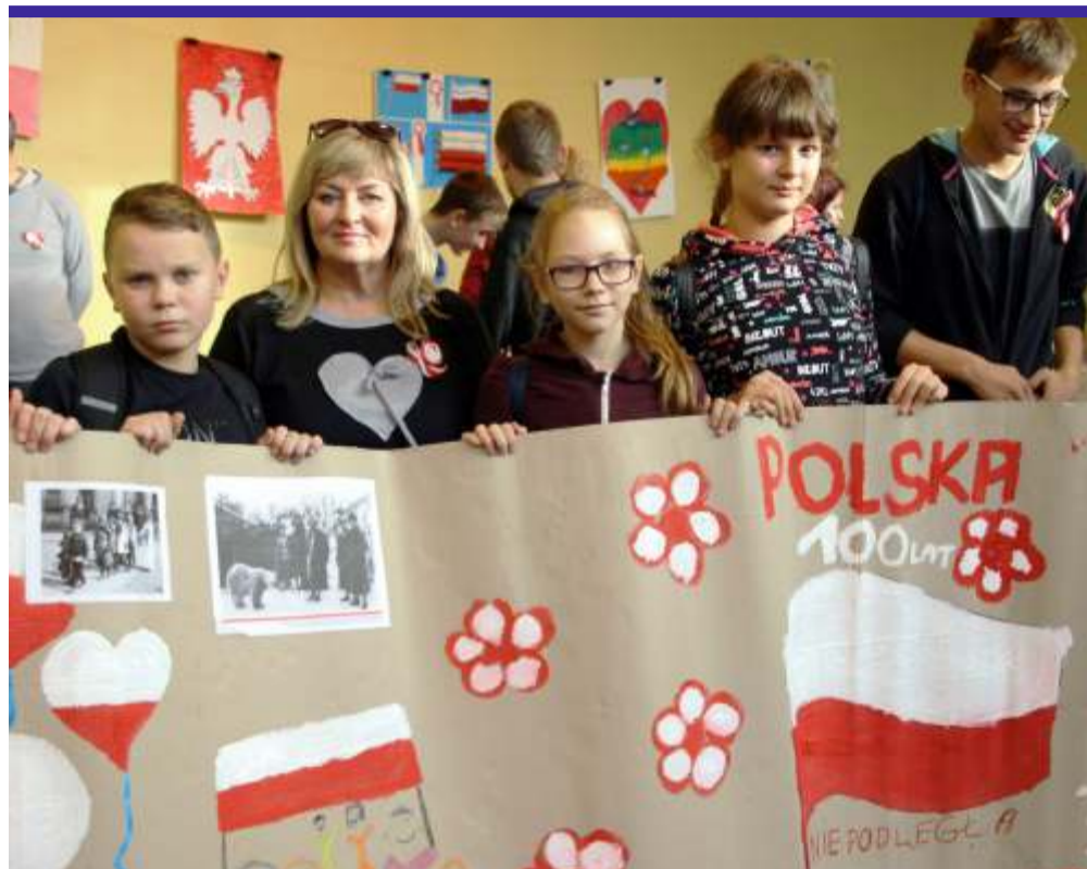
Było trochę ruchu, trochę historii, a wszystko zwieńczone wspólnym malowaniem plakatu z okazji 100-lecia odzyskania przez Polskę Niepodległości – tak wyglądał I Integracyjny Rajd Niepodległościowy Powiatu Zgierskiego

We wrześniu uczniowie brali udział w miejskiej grze terenowej pt. „Szlakiem miejsc pamięci narodowej”. 6 drużyn z wychowawcami na czele rozwiązywało zadania o różnym stopniu trudności dotyczące historii i życia codziennego Głowna. Wszyscy uczestnicy starali się zdobyć jak najwięcej punktów, ale tylko drużyna klas starszych szkoły podsta-