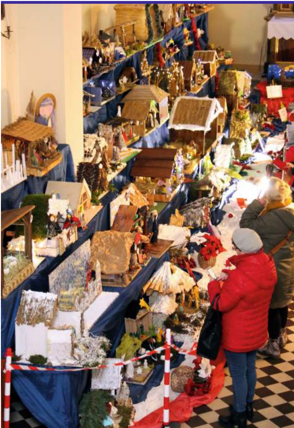
Jak co roku, podczas konkursu można było zobaczyć tradycyjne, a także niezwykle i nowoczesne szopki bożonarodzeniowe