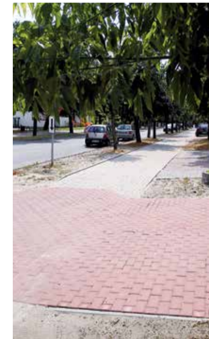
Tak teraz prezentują się chodniki przy ul. Swoboda w Głownie

Do końca tego roku władze powiatu zgierskiego mają w planach przebudować jeszcze kilka kolejnych dróg: drogę dojazdową relacji Solca Wielka – Wielka Wieś (w gm. Ozorków), ulice Targową i Parzęczewską w Zgierzu (na odcinku od ul. Targowej do bloku nr 7), ul. Wolską w Rąbieniu, ul. Średnią w Ozorkowie (od ul. Maszkowskiej do ul. Partyzantów), drogę relacji Wola Branicka – Besiekierz Rudny w gminie Zgierz, oraz chodniki: na ul. Piłsudskiego w Zgierzu i w miejscowości Kania Góra w gminie Zgierz. Przebudowy doczekają się także 3 drogi dojazdowe do gruntów rolnych relacji: Solca Wielka – Wielka Wieś w gminie Ozorków, Aleksandrów Łódzki – Grotniki w gminie Aleksandrów Łódzki i Florianki – Adamówek – Ozorków w gminie Parzęczew. MT