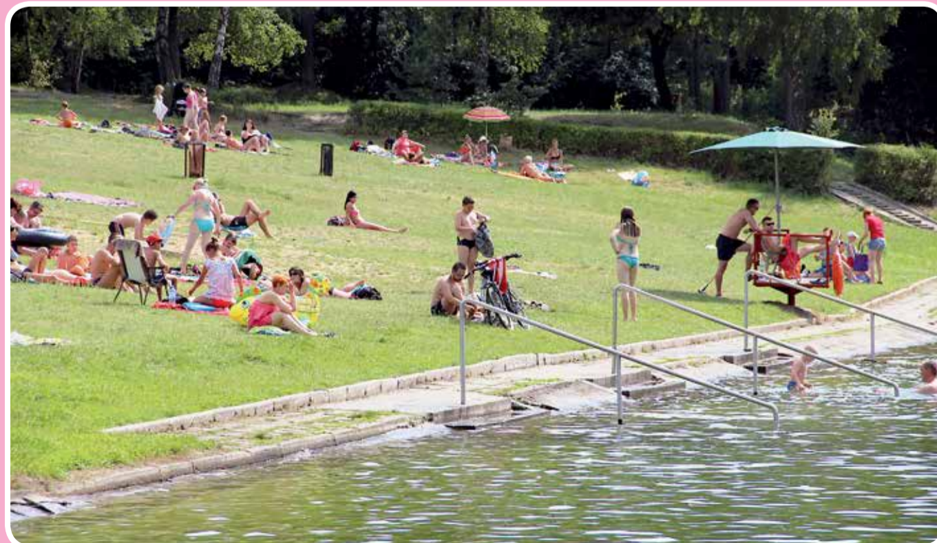
Ośrodek Sportowo-Wypoczynkowy „Malinka” w Zgierzu

Jak co roku mieszkańcy Zgierza w upalne dni mogą wybrać się na popularną „Malinkę”. Dla wszystkich wypoczywających czeka m.in. przystań, przy której znajdują się kajaki, rowery wodne i łódki. Do dyspozycji są również boiska do piłki nożnej, siatkówki i koszykówki. Plażowicze mogą popalać się nad kąpieliskiem lub skorzystać ze ścieżki rowerowej biegnącej wokół stawu.