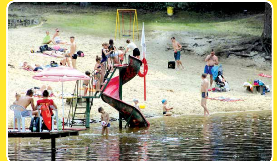
Kąpielisko „Nad Lindą” w Grotnikach

Otoczone lasem, nad sztucznym zalewem rzeki Lindy, kąpielisko w Grotnikach przyciąga wspaniałym miejscem do wypoczynku. Na terenie znajduje się kilkudziesięciometrowa plaża, wypożyczalnia sprzętu wodnego, pole namiotowe oraz boisko do siatkówki. Najmłodszy plażowicze mogą zjechać ze spiralnej zjeżdżalni wprost do wody.