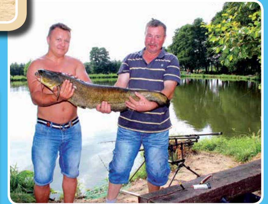
Gospodarstwo Agroturystyczne w Ciosnach

Położone nad rzeką Ciosenką, w sąsiedztwie kilku stawów, gospodarstwo, przyciąga miłośników wędkarstwa. Od rana do wieczora na fanów łowienia ryb, wśród meandrów rzeki, czekają m.in. liny, amury, karpie czy sandacze. Podczas wędkowania można natrafić na takie okazy jak 10 kg sum. W czasie wakacji, od czwartku do niedzieli, na terenie gospodarstwa działa smażalnia, w której można zjeść smaczną rybę.