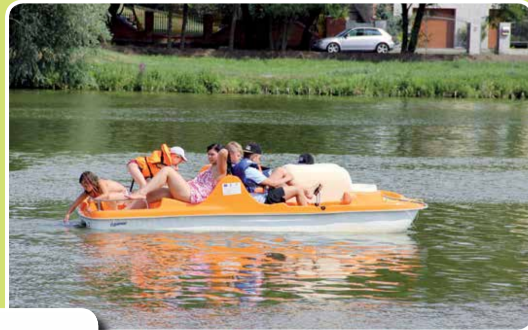
Zalew Miejski w Strykowie

Do wypoczynku nad strykowskiem zalewem zachęca kompleks sportowo-rekreacyjny. Najmłodszy mogą poszaleć na 4 nowoczesnych placach zabaw, ci nieco starsi spróbować swoich sił na skateparku. Miłośnicy aktywnego wypoczynku mogą skorzystać ze ścieżki pieszo-rowerowej lub zadbać o swoją sylwetkę korzystając z placu z urządzeniami typu fitness. Pobyt nad zalewem umili także przejażdżka rowerem wodnym lub kajakiem.