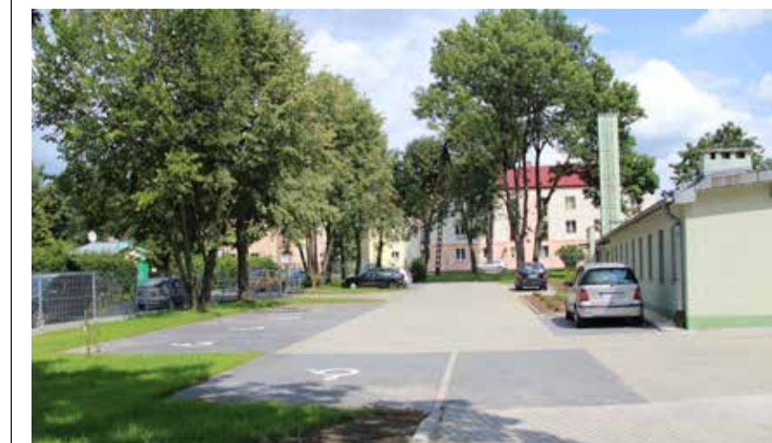
Jako ostatnie zostało zrealizowane zadanie polegające na budowie nowego ogrodzenia z bramami wjazdowymi oraz utwardzeniu terenu kostką brukową wraz z wydzieleniem miejsc parkingowych dla osób niepełnosprawnych