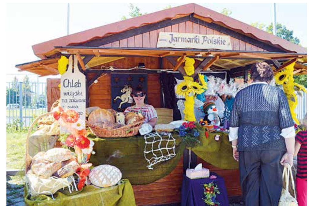
Do stoiska Gminy Zgierz przyciągał zapach świeżego, chrupiącego chleba

Gmina Zgierz zaprosiła w swoje gościnne progi, rozdając zwiedzającym materiały informacyjno-promocyjne: mapę, przewodnik turystyczny, materiały o historii regionu. Ponadto można było zapoznać się z rękodziełem ludowym, obejrzeć pokaz szydełkowania, a także zakupić przygotowane wyroby. Lokalna piekarnia z Białej koło Zgierza zaprosiła na degustację tradycyjnego chleba na zakwasie pieczonego w starym piecu opalonym drewnem, jedynego takiego w całym województwie łódzkim. Można było kupić chrupiący chleb i zjeść kromkę ze smalcem lub z miodem z pasieki w Łagiewnikach Nowych. Stoiska powiatu zgierskiego odwiedziło kilkuset gości. Byli wśród nich: Wojewoda Łódzki Jolanta Chelmińska, poseł na Sejm Artur Dunin i Starosta Zgierski Krzysztof Kozanecki. Wszyscy zasiedli w zgierskim salonie na filiżankę herbaty, a potem skosztowali gminnych specjalów. KK