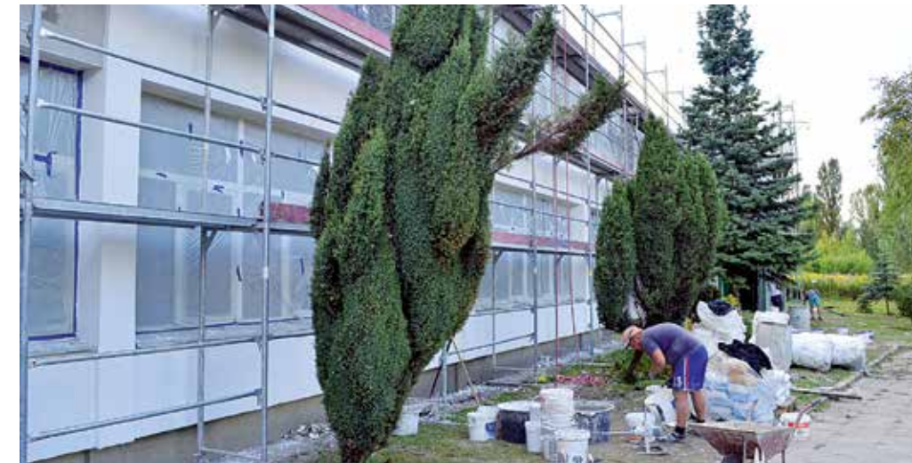
Dzięki termomodernizacji zmniejszą się koszty ogrzewania szkolnych placówek oraz emisja zanieczyszczeń do atmosfery

W trakcie wakacji w powiatowych placówkach oświatowych nie było młodzieży, co nie oznacza, że w szkołach było cicho i spokojnie. Czas letniego wytchnienia dla uczniów, dla szkoły jest doskonałym momentem na przeprowadzenie niezbędnych remontów.