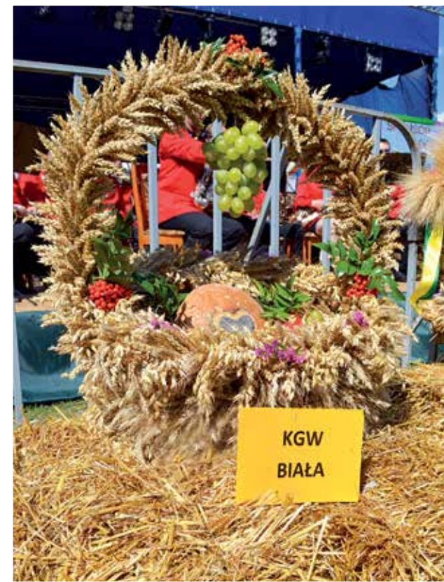
Wieniec dożynkowy Koła Gospodyń Wiejskich w Białej zachwycał przepychem. – Sześć pań plottło wieniec z różnych gatunków zbóż przez całą niedzielę – mówiła jedna z autorek