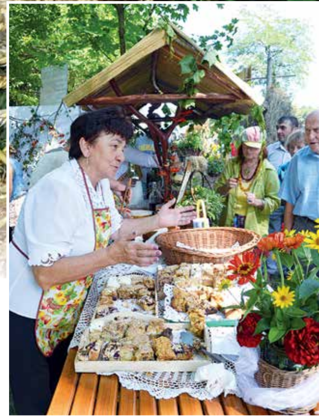
Domowe wypieki czy chleb ze smalcem? Sołectwo Czaplinek z radością witało gości