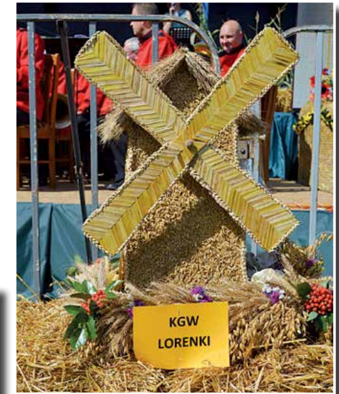
Zbożowy wiatrak, przygotowany przez Koło Gospodyń Wiejskich w Lorenkach, otrzymał pierwszą nagrodę w konkursie „Współczesny Wieniec Dożynkowy”. Jury doceniło go za niezwykłą konstrukcję i staranność wykonania