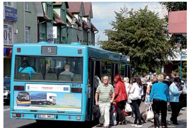
W nieco ponad godzinę autobus nr 3A pokona trasę 33 kilometrów

Linia będzie obsługiwana autobusami zgierskiej komunikacji miejskiej i początkowo będzie liczyła 7 kursów – po dwa w godzinach rannych, popołudniowych i nocnych oraz jeden około południa. Szczegółowy rozkład jazdy znajdą Państwo na str. 8. MT