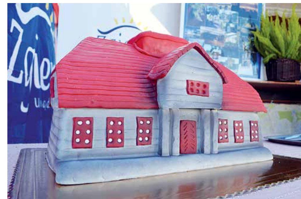
Tort w kształcie domu tkacza był jedną z wielu atrakcji stoiska Miasta Zgierza