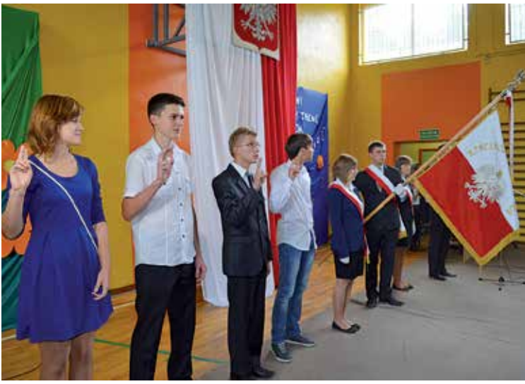
Uczniowie rozpoczęli kolejny rok szkolny w bratoszewickiej szkole, strykowscy radni będą zaś niebawem dyskutować nad przyszłością placówki