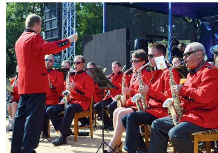
Uroczystość dożynkową uświetnił występ Orkiestry Dętej przy Gminnym Ośrodku Kultury w Dzierżąnej wraz z Orkiestrą Dętą Ochotniczej Straży Pożarnej w Brzezinach

Od lata do wiosny rządzą Panie ze Wsi Ciosny. Na stoisku Sołectwa Ciosny można było się nie tylko posilić, ale również wzmocnić regionalnym napitkiem