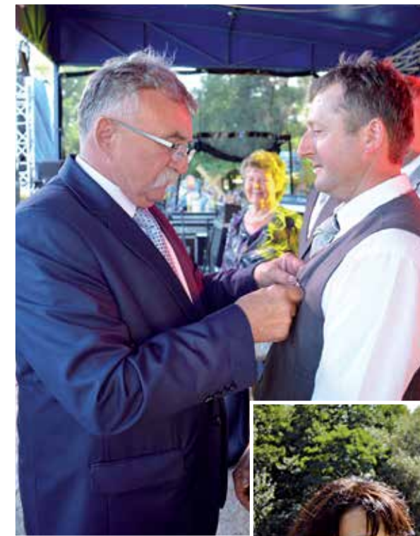
W czasie uroczystości wręczono odznaki honorowe „Zasłużony dla Rolnictwa” przyznane przez Ministra Rolnictwa i Rozwoju Wsi