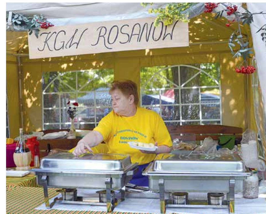
Stoiska sołectkie zapraszały na gorące specjalty wiejskiej kuchni. Goście ustawiali się w długich kolejkach, aby spróbować klusek śląskich przygotowanych przez Koło Gospodyń Wiejskich w Rosanowie