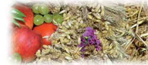
Starostwie dożynek otworzyli korowód niosąc tradycyjne produkty