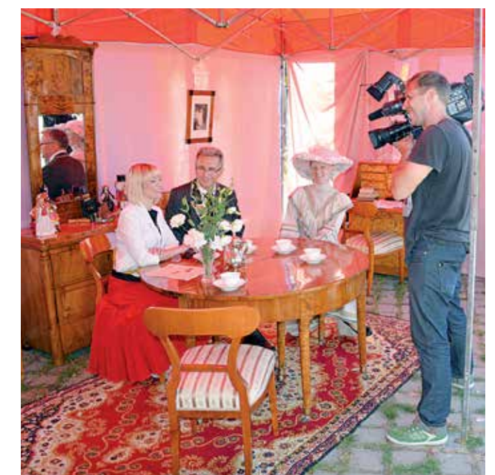
Do zabytkowego salonu chętnie zaglądali media. Relację na żywo można było zobaczyć w TVP Łódź i Telewizji TOYA, oraz usłyszeć w Radiu Łódź