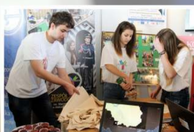
Uczniowie Zespołu Szkół Zawodowych w Aleksandrowie Łódzkim wykonywali specjalne nadruki na torbach