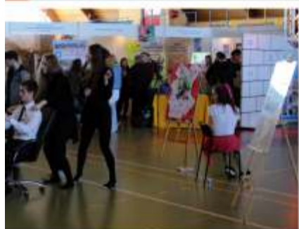
kół Ogólnokształcących w Ozorkowie "Sztuka i Sport"