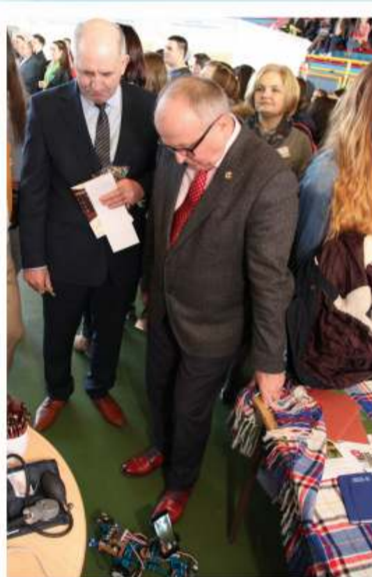
ZSL-G w Głownie pokazał, zbudowany przez uczniów klasy informatyczno-matematycznej, sterowany pojazd