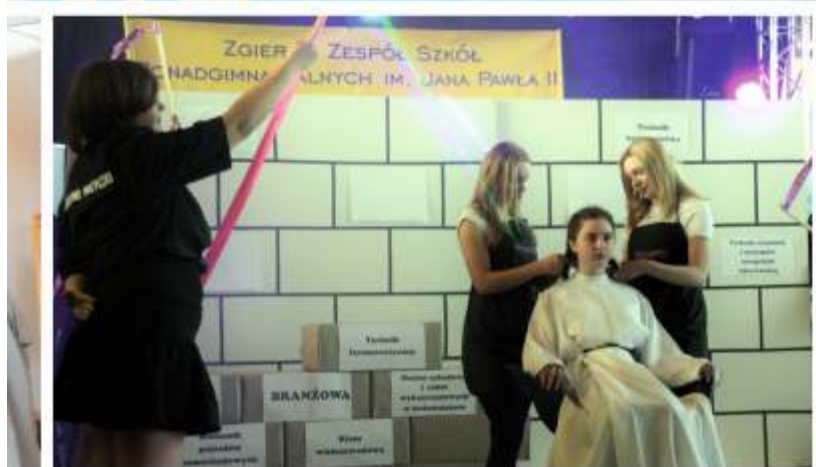
Aby zachęcić do nauki w wybranej placówce, niektóre ze szkół korzystały z pomocy kultowych postaci. I tak, Zgierski Zespół Szkół Ponadgimnazjalnych promował się przy pomocy sagi "Gwiezdnych Wojen", gdzie np. księżniczka Leia skorzystała z usług fryzjerskich, zaś Sherlock Holmes i dr Watson przekonywali, że nauka w zgierskim "Staszicu" to fajny wybór