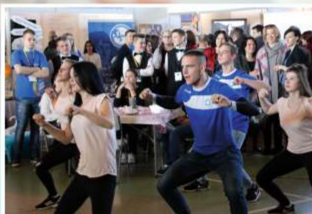
Tanecznie promowali swoją szkołę uczniowie z Zespołu Szkół Nr 1 im. Cebertowicza w Głownie