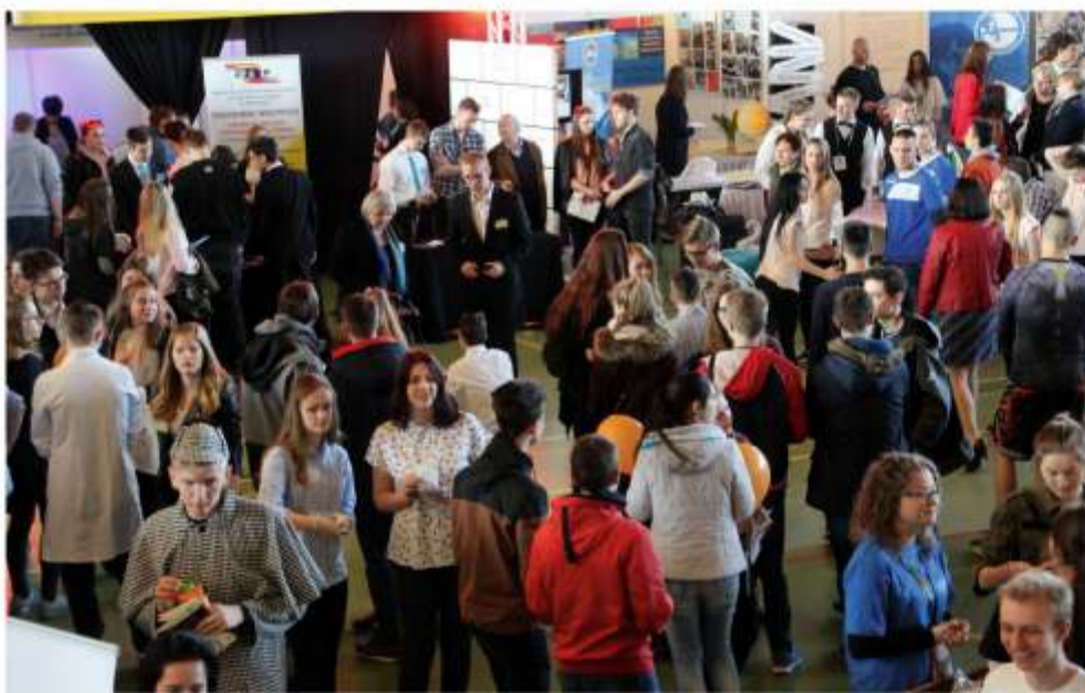
Jubileuszowe X Powiatowe Targi Edukacyjne odwiedziło blisko 1000 uczniów