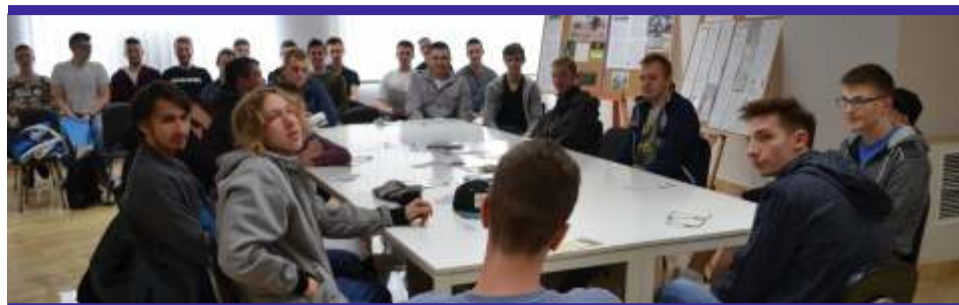
Kilkadziesiąt osób dziennie stawia się przed oblicze komisji lekarskiej w Zgierzu

Kwalifikacja ma na celu ustalenie zdolności do czynnej służby wojskowej i wstęp-