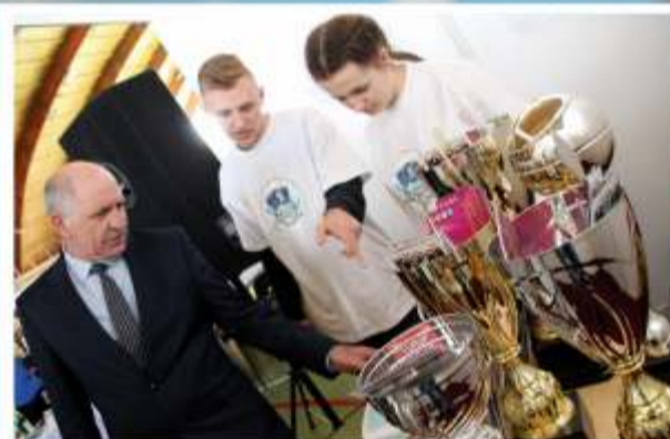
Stoiska przyciągały różnorodnością prezentowanych ofert, np. uczniowie z Zespołu Szkół Nr 1 im. J.S. Cezaka w Zgierzu, pokazami sztuki kelnerskiej i dekoracyjnej promowali klasę o profilu hotelarskim, z kolei LO w Aleksandrowie Łódzkim, jak przystało na Szkołę Mistrzostwa Sportowego, zaprezentowało trofea zdobyte w ostatnim czasie