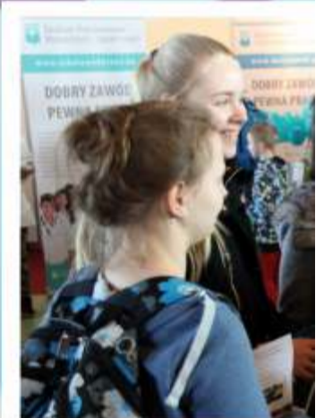
Jednak najlepszą formą promocji z uczniami oświatowych placówek o profilu humanistycznym – może z Zespołu Szkolno-Gimnazjalnej edukację i ścieżkę zawodową w