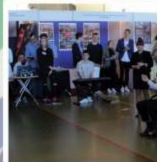
Młodzi aktorzy z Zespołu Szkół zaprezentowali spektakl "G"