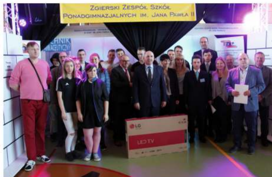
Podczas targów wybrano także najciekawsze stoiska promocyjne. Głosujący uznali, że najlepiej zaprezentował się Zgierski Zespół Szkół Ponadgimnazjalnych