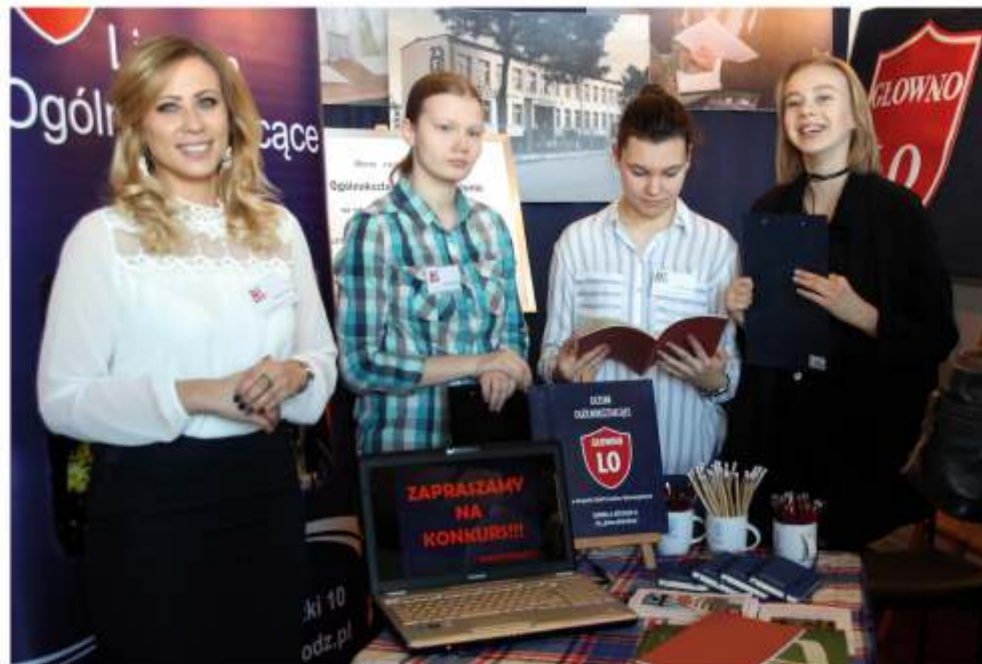
Swoją ofertę prezentowały m.in. szkoły prowadzone przez powiatowy samorząd