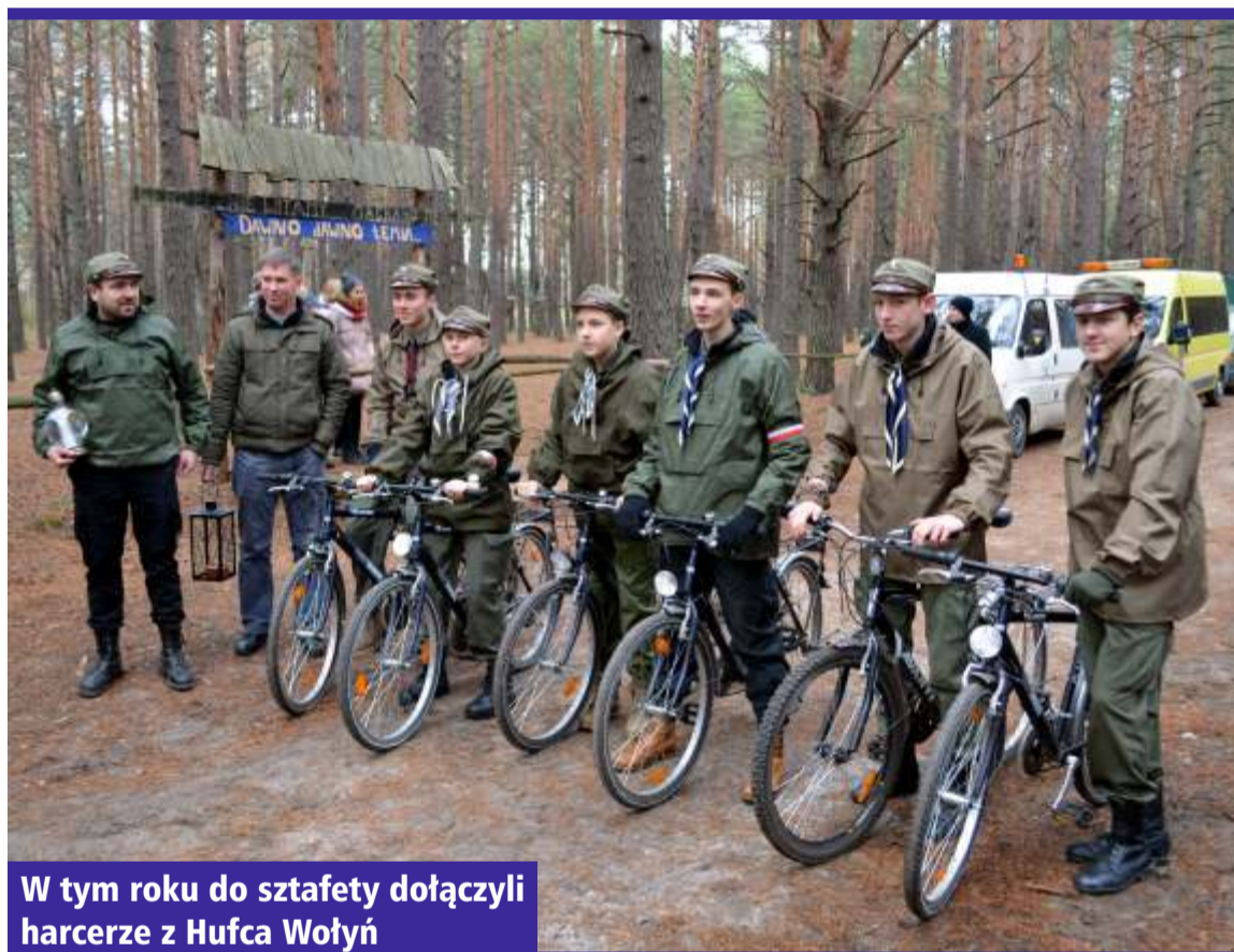
W tym roku do sztafety dołączyli harcerze z Hufca Wołyń