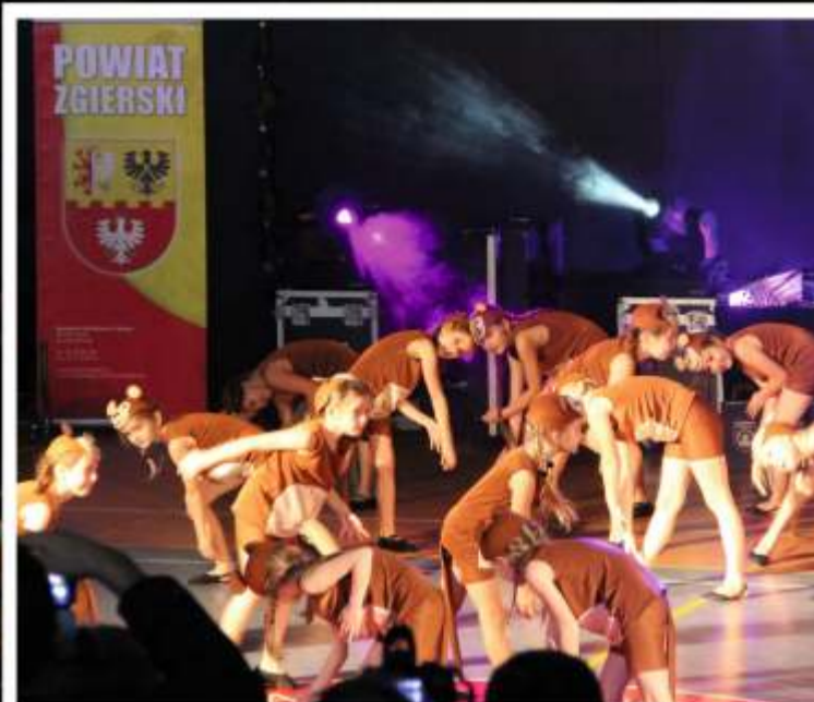
Zespół Gold 4 układem „Małpki” wytańczył sobie III miejsce