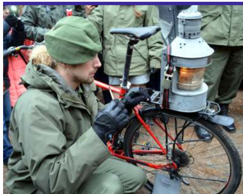
Harcerze ze Zgierza od 16 lat przewożą Ogień Niepodległości do Polski