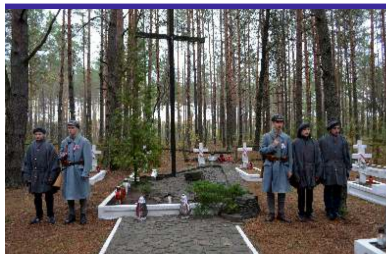
Cmentarz w Polskim Lasku