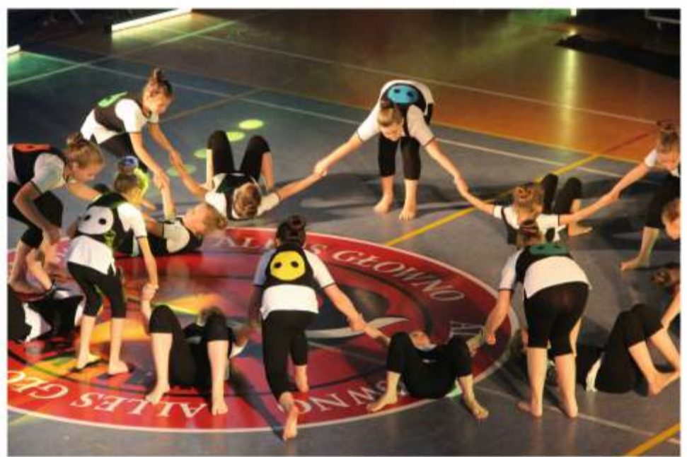
Strykowskie tancerki otrzymały wyróżnienie nie tylko za „Guziki” na kamizelkach