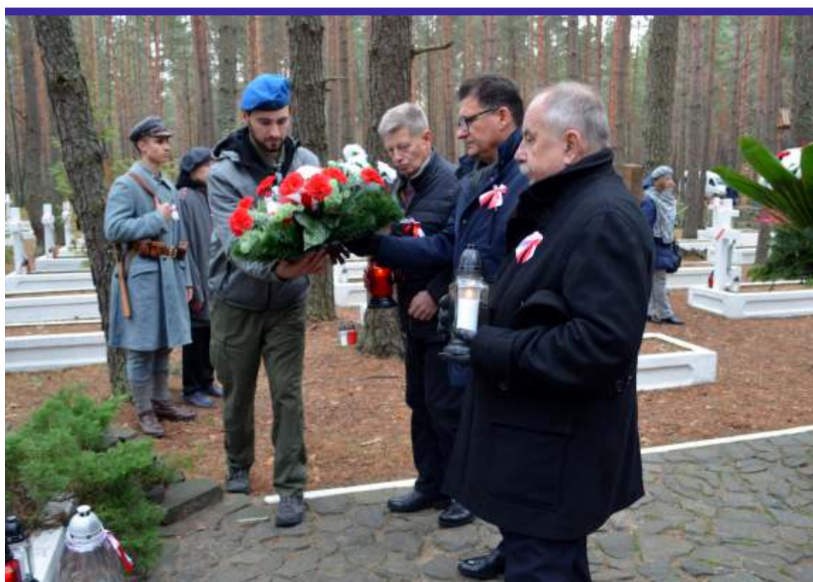
Delegacja powiatu zgierskiego złożyła kwiaty na grobach poległych w bitwie pod Kostiuchnówką