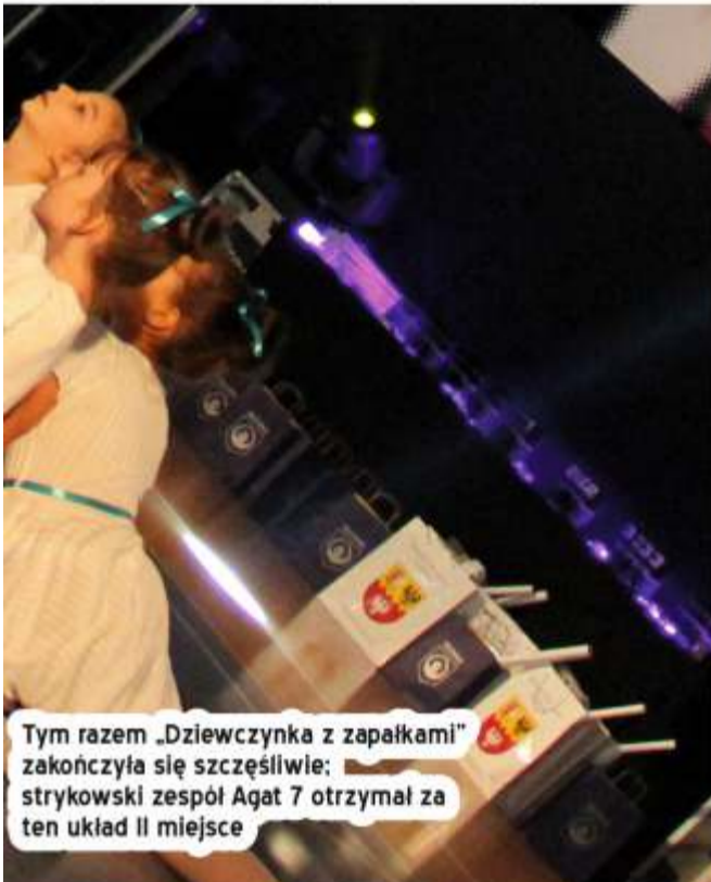
Tym razem „Dziewczynka z zapałkami” zakończyła się szczęśliwie; strykowski zespół Agat 7 otrzymał za ten układ II miejsce