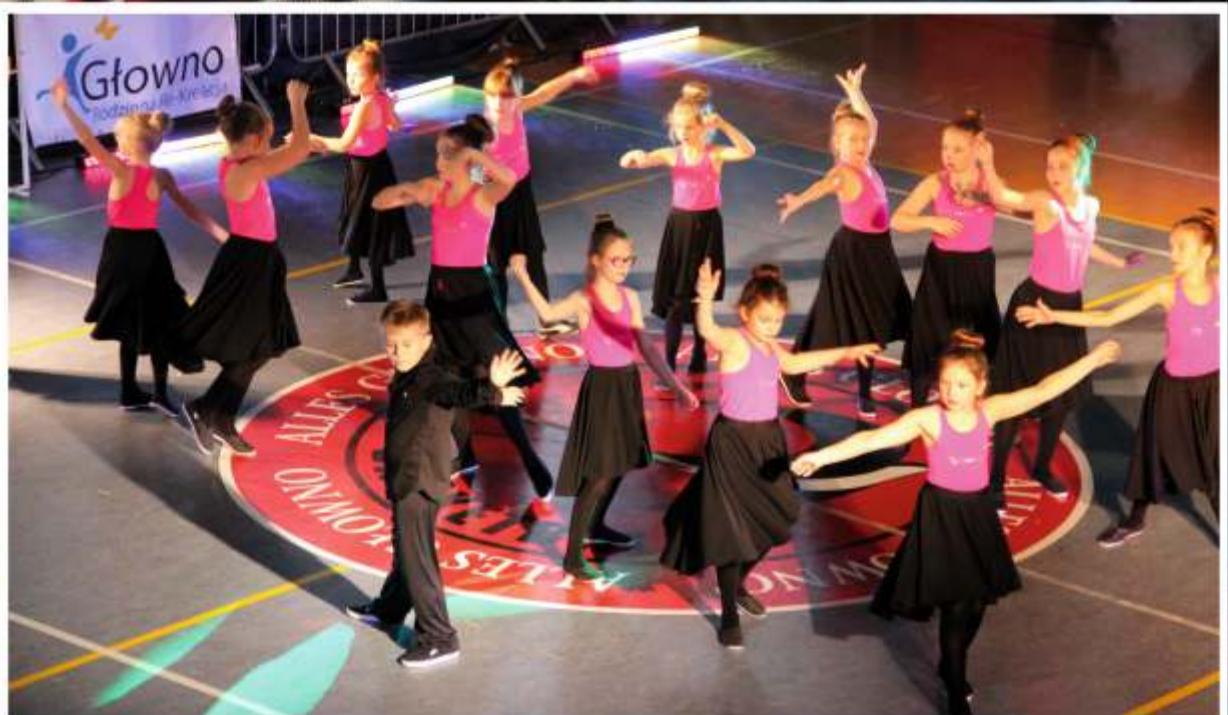
Rąbieński zespół UKS GG Dance wyszedł na pakiet „Tanecznym krokiem”