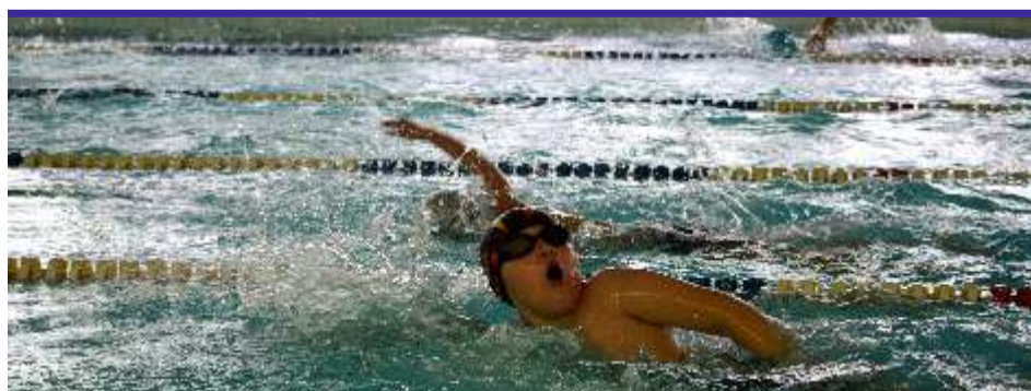
Udział w zawodach z cyklu „Family Cup” to doskonały sposób na uprawianie sportu amatorskiego, który jest najlepszą, a zarazem najtańszą formą ochrony zdrowia oraz utrzymania dobrej kondycji fizycznej i psychicznej

Po zakończeniu zawodów przyszedł czas nagrodzić najlepszych, którzy, będą reprezentować nasze województwo w finale ogólnopolskim. Nikt jednak nie opuścił zawodów z pustymi rękami. Wśród wszystkich zawodników rozlosowano nagrody rzeczowe, ufundowane m.in. przez powiatowy samorząd. [LR]