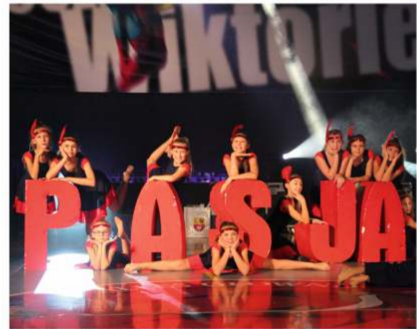
Jurorzy docenili „Naszę Pasję” w wykonaniu Agatu 5