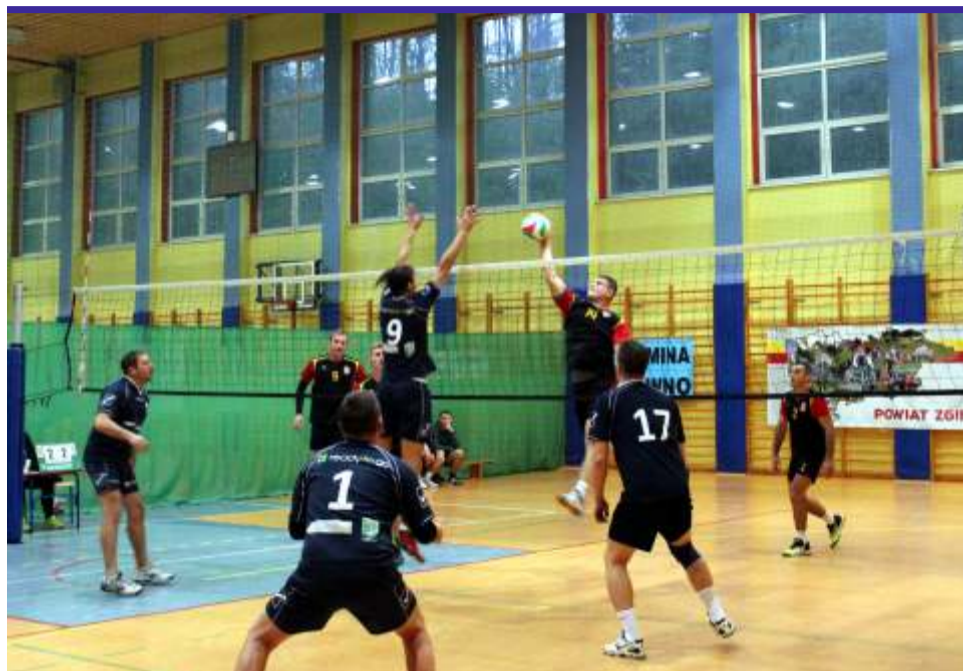
Finałowe starcie było tak zacięte, że sędzia musiał wielokrotnie rozstrzygać sporne kwestie