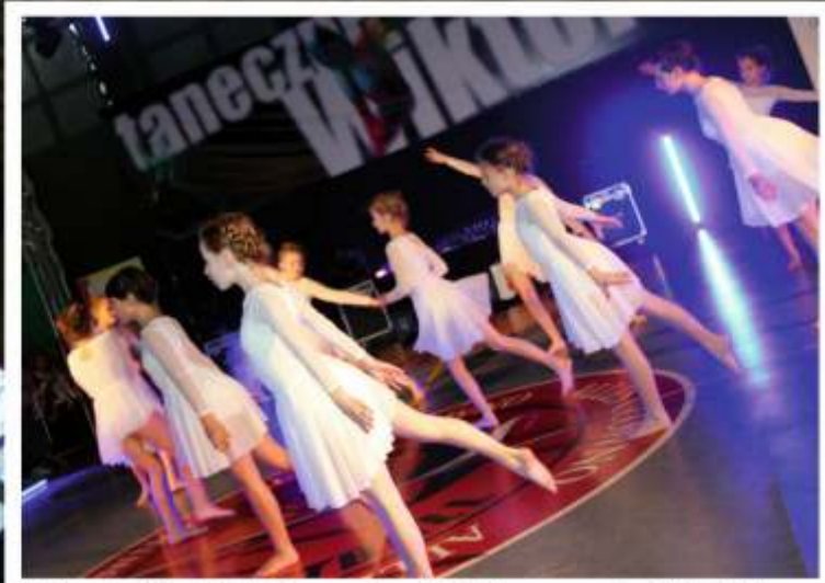
Najwyraźniej nad łódzkim zespołem DNA Plus czuwa „Anioł stróż”, bo za ten układ tancerki otrzymały I miejsce