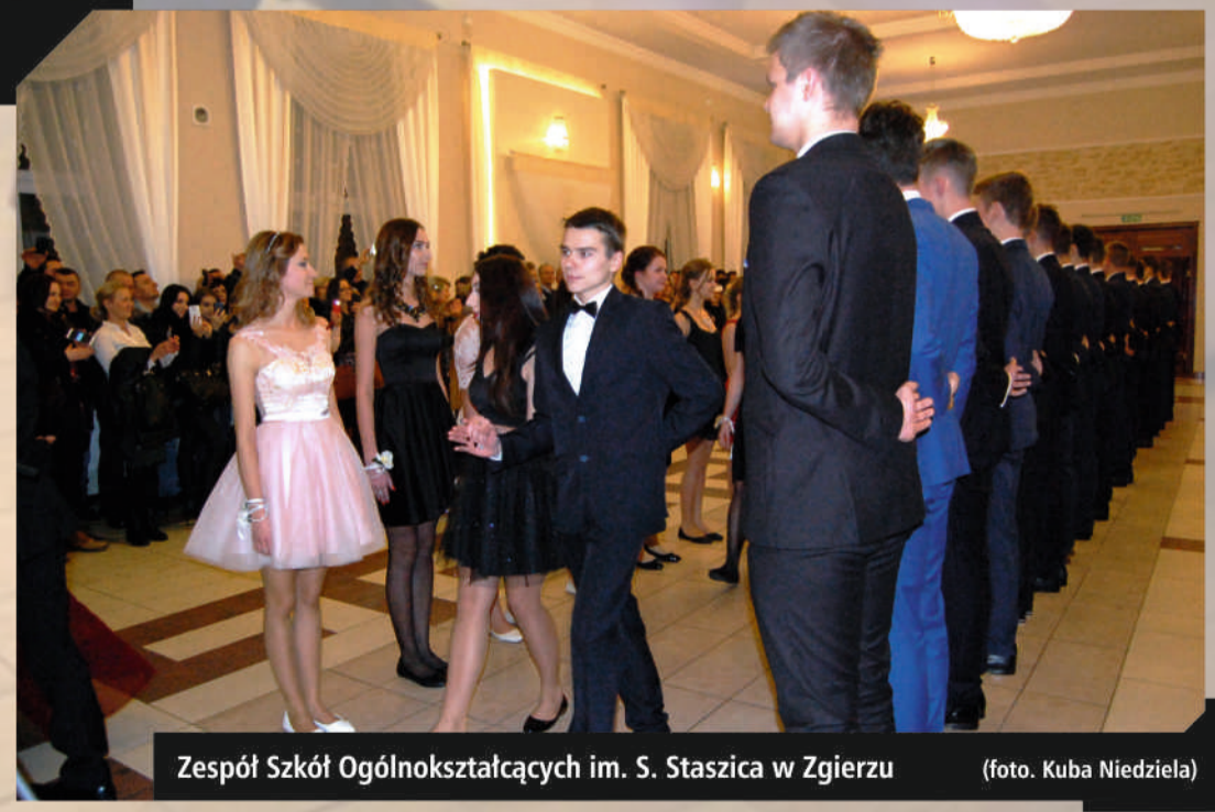
Zespół Szkół Ogólnokształcących im. S. Staszica w Zgierzu