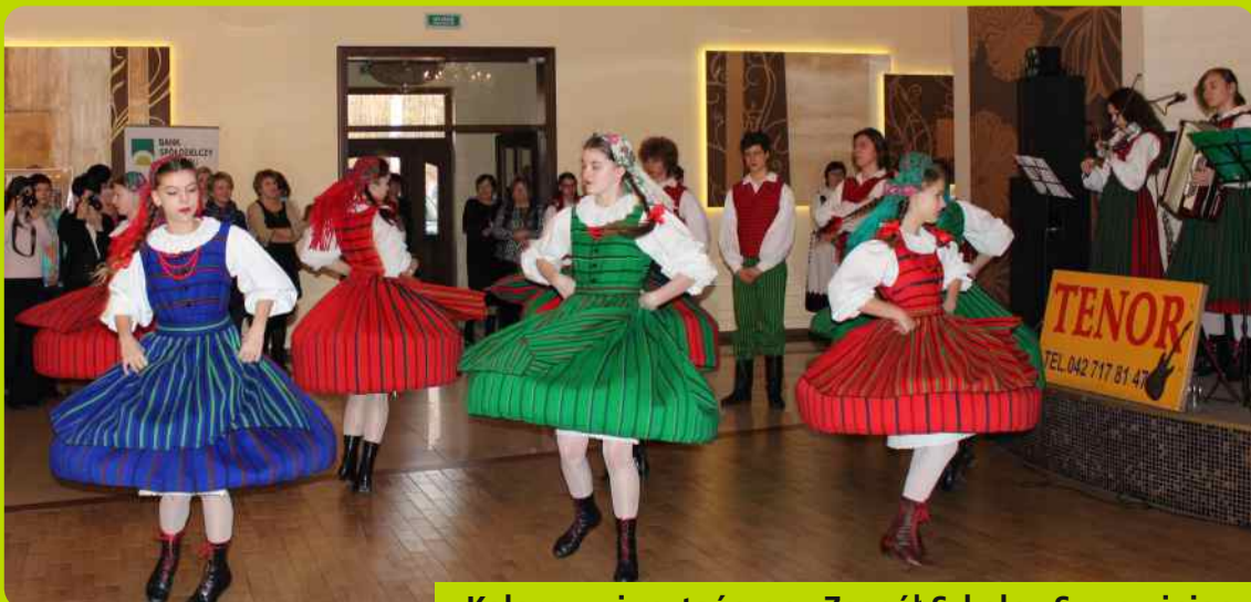
Kolorowy i roztańczony Zespół Szkolny Szczawiniacy