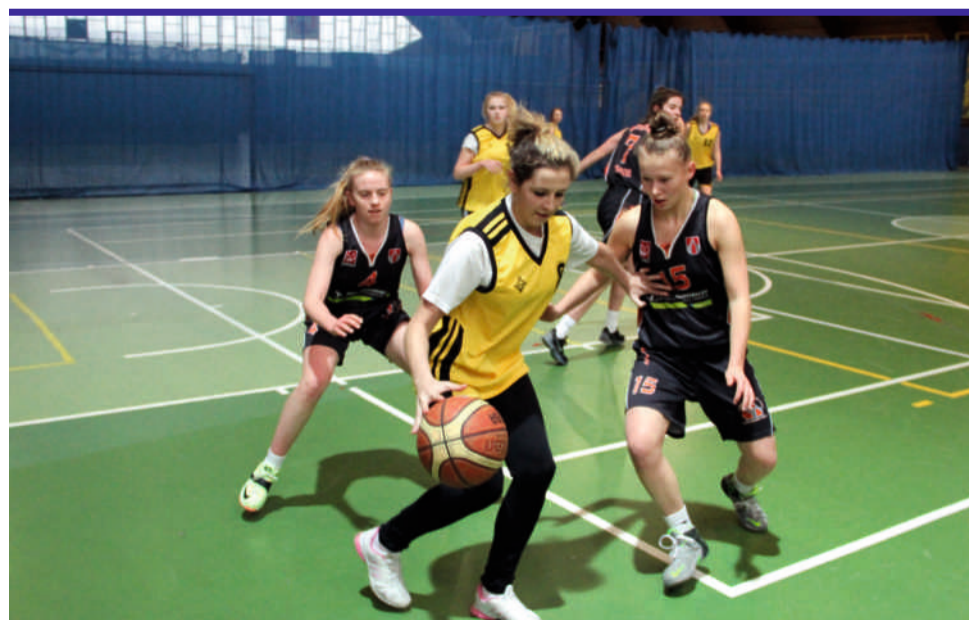
Niektóre zawodniczki aleksandrowskiego Kopernika (czarne stroje) co dzień reprezentują barwy UKS „Basket”, który obecnie rywalizuje w I lidze kobiet, co wyraźnie było widać w trakcie powiatowego finału.