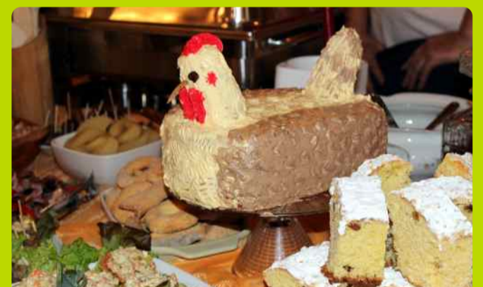
Tort – kwoka wykonany przez panie z Modłej