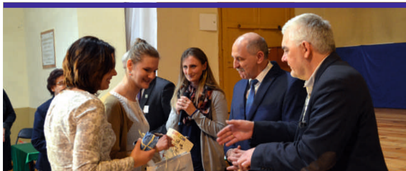
Od początku starosta zgierski kibicował uczestnikom przeglądu twórczości teatralno – muzycznej, a także wręczał ufundowane przez siebie nagrody

Teatr, muzyka, śpiew – tak w dużym skrócie można określić Ogólnopolski Festiwal Twórczości Teatralno – Muzycznej Osób Niepełnosprawnych Inteligentnie „Albertiana”. Tegoroczny przegląd artystyczny odbywał się po raz szesnasty w Polsce, a w Zgierzu dwunasty. W międzywojewódzkiej rywalizacji, na deskach zgierskiej sceny, w Zespole Szkół i Placówek Kwalifikacji Zawodowej, zaprezentowało się 9 zespołów i 4 solistów: ze Zgierza, Konstanczyna Łódzkiego, Pabianic, Ozorkowa, Łodzi, Koluśzek, Warszawy, Pruszkowa i Wierzbic.