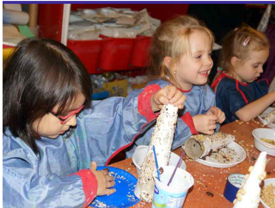
Przykład zgierskiego MDK-u pokazuje, że zimową przerwę szkolną można spędzić kreatywnie