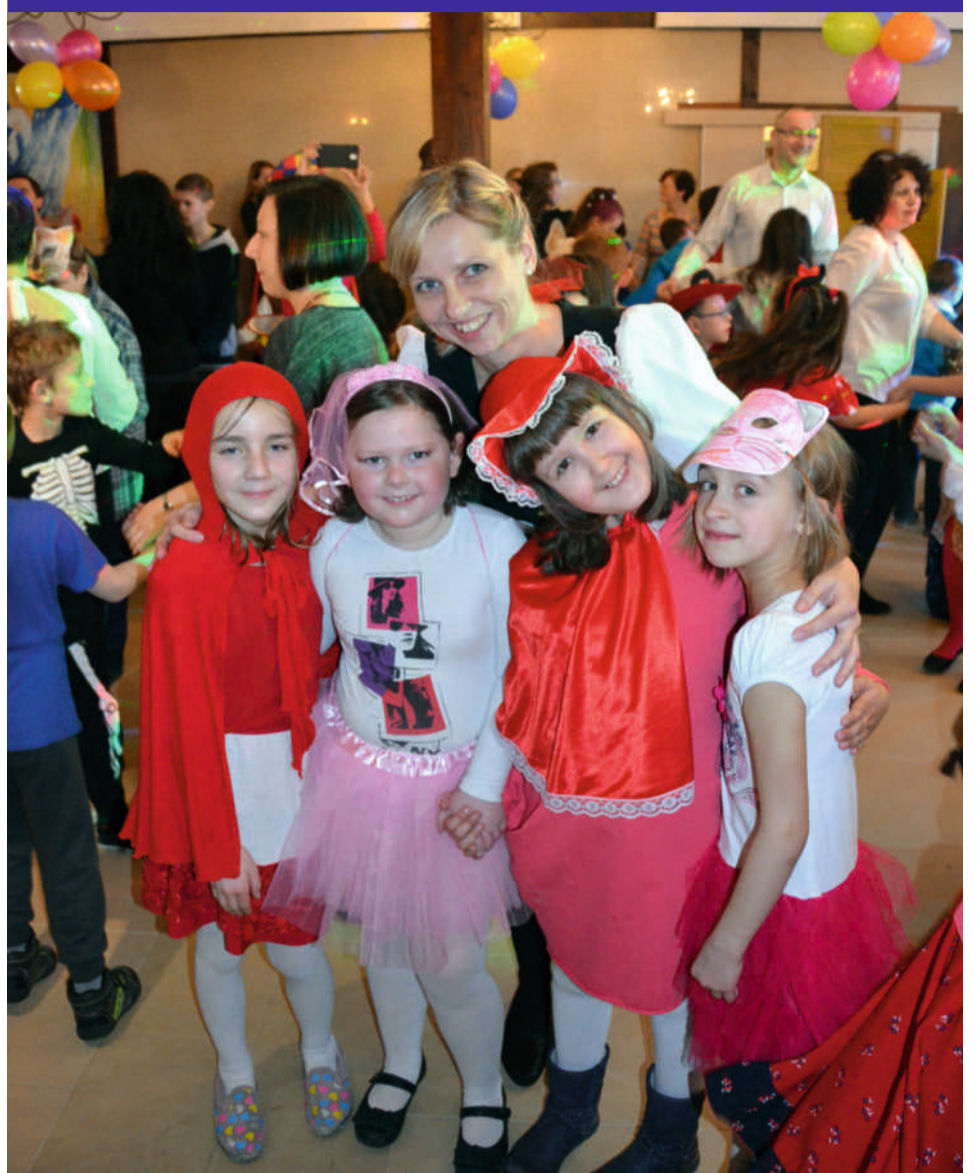
Po uśmiechach na twarzach dzieci widać, że bal karnawałowy będzie jeszcze długo wspomniany