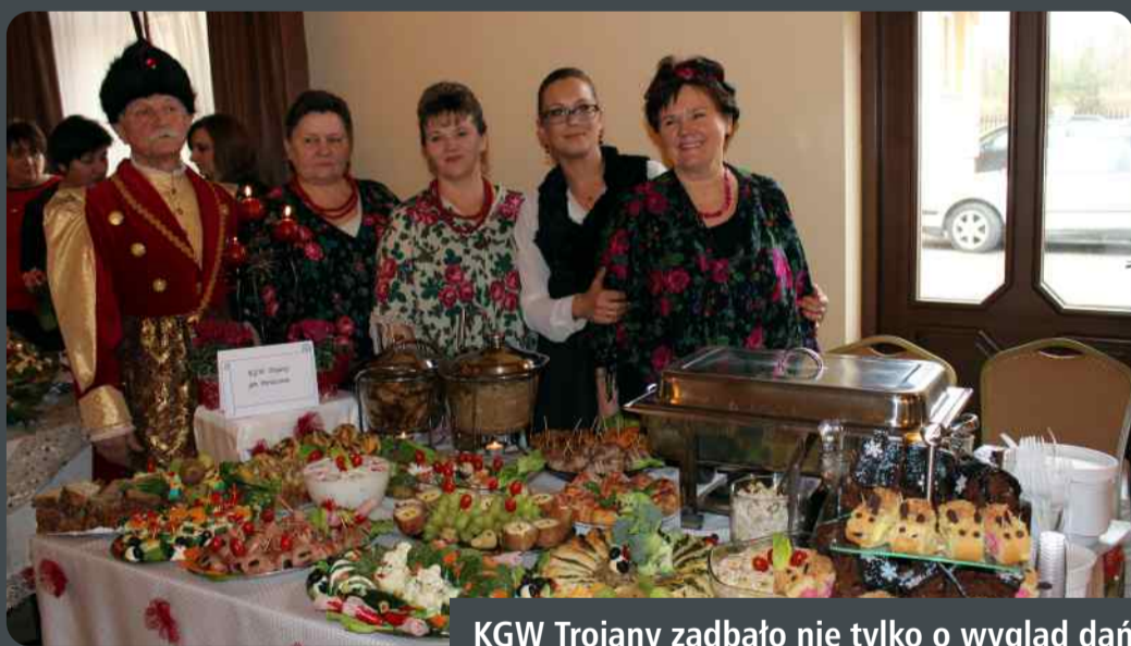
KGW Trojany zadbało nie tylko o wygląd dań