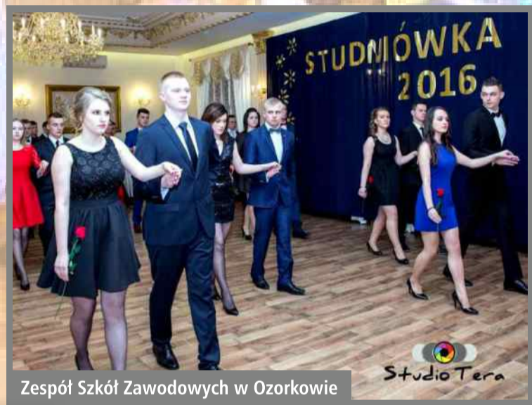
Zespół Szkół Zawodowych w Ozorkowie