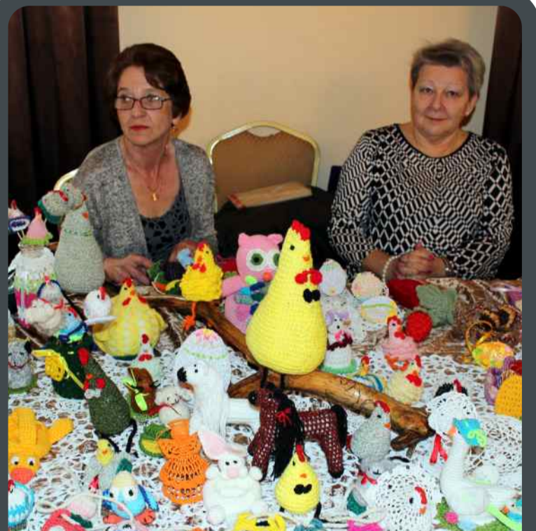
Szydełkowe cudeńka w wykonaniu pań z koła hobbystycznego działającego w GOK w Dzierżąnej