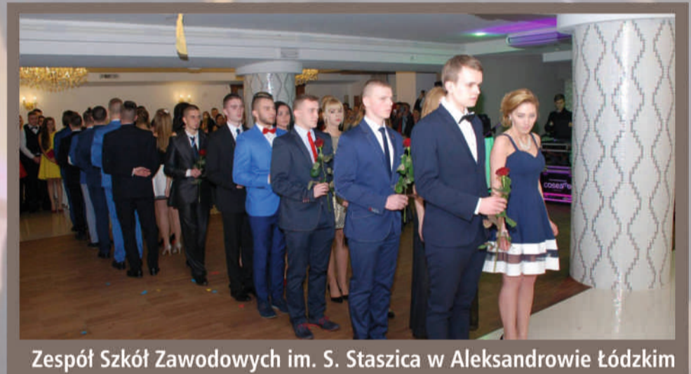
Zespół Szkół Zawodowych im. S. Staszica w Aleksandrowie Łódzkim