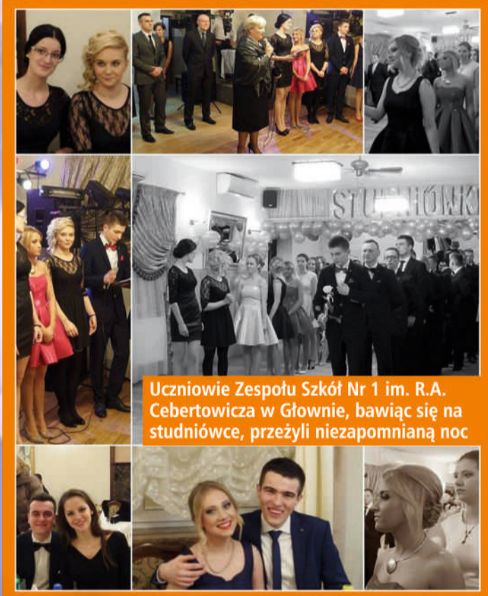
Uczniowie Zespołu Szkół Nr 1 im. R.A. Cebertowicza w Głownie, bawiąc się na studniówce, przeżyli niezapomnianą noc