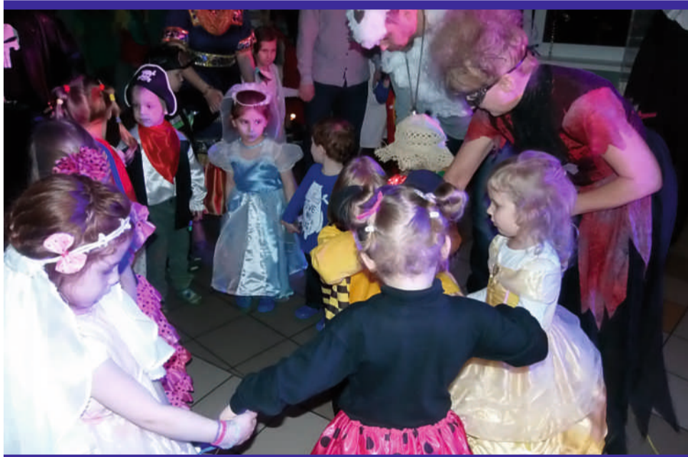
Zabawa potrwała do późnych godzin i była tym przyjemniejsza, że poprzedziła dwutygodniowy okres ferii