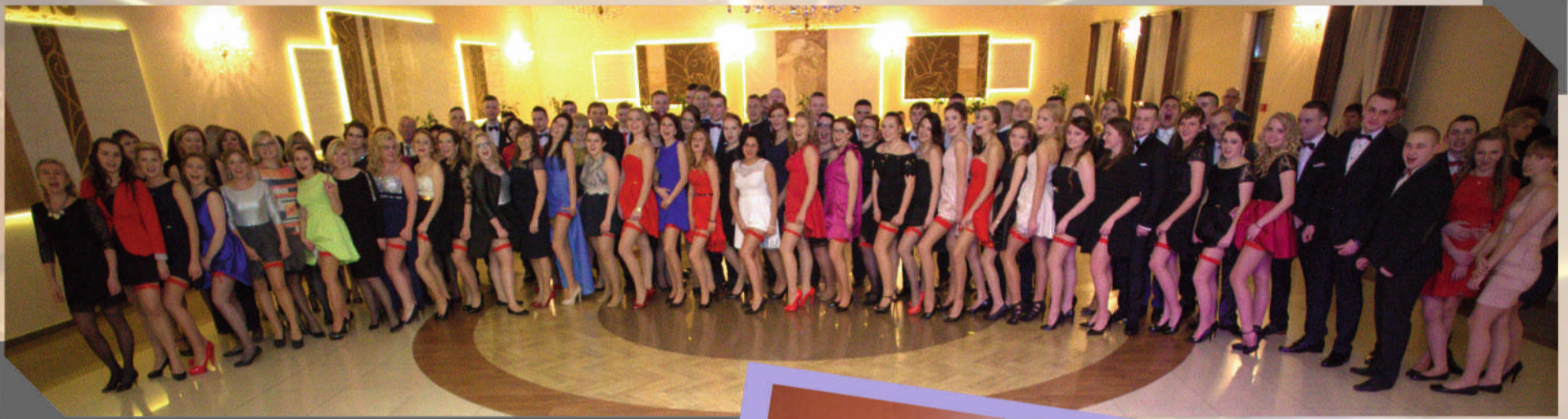
Sukienka, czerwona podwiązka, garnitur i mucha, ewentualnie krawat – to obowiązkowy zestaw studniówkowy. Wiedzą o tym także maturzyści z Zespołu Szkół Nr 1 im. J.S. Cezaka w Zgierzu