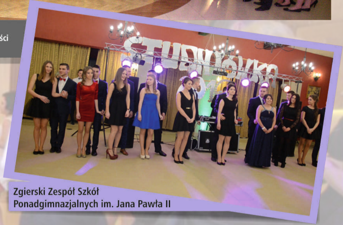
Zgierski Zespół Szkół Ponadgimnazjalnych im. Jana Pawła II