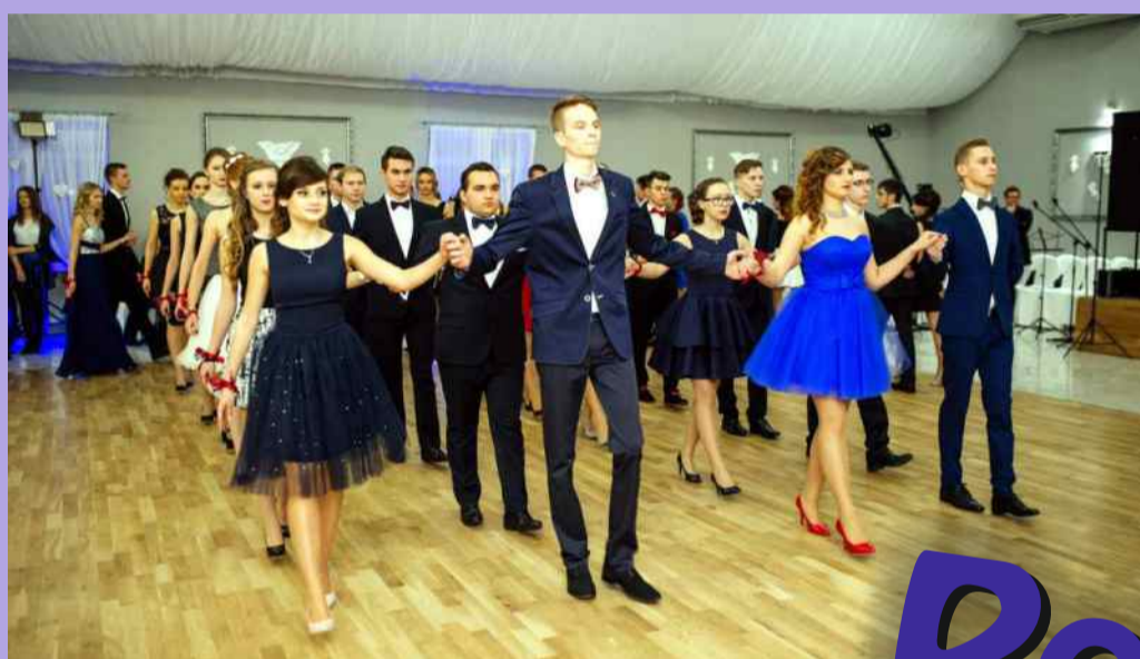
Zespół Szkół Licealno-Gimnazjalnych w Głownie

Zanim tegoroczni maturzyści zasiądą w szkolnych ławkach, by przystąpić do pierwszego, najważniejszego egzaminu w ich życiu, czeka ich jeszcze wspólna zabawa. Tradycyjnie na sto dni przed maturą, szkoły ponadgimnazjalne organizują bale studniówkowe. Na przełomie stycznia i lutego w dziewięciu powiatowych szkołach uczniowie bawili się na parkiecie wspólnie z gronem pedagogicznym oraz zaproszonymi gośćmi, wśród nich nie zabrakło przedstawicieli Zarządu Powiatu Zgierskiego.