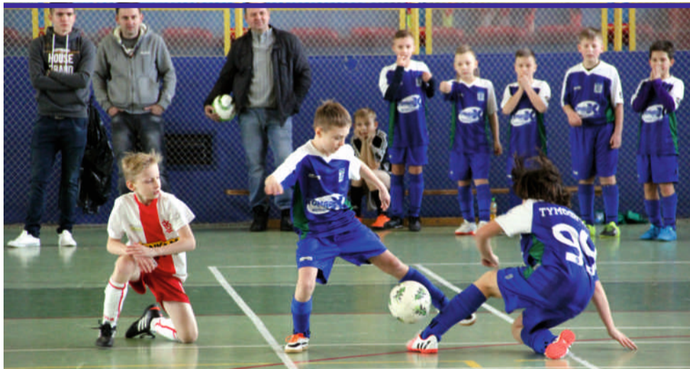
Dla wielu młodych zawodników zdobyte doświadczenie, w tego typu turniejach, z pewnością zaprocentuje w przyszłości.

Emocji nie zabrakło podczas samego finału. Po upływie regulaminowych 20 minut, na tablicy wyników widniał remis 1:1. O tym kto wyjedzie ze Zgierza jako zwycięzca musiały zdecydować karne, które lepiej wykonywali zawodnicy Widzewa. W podobny sposób zakończyła się rywalizacja o najniższy stopień podium, między Bzurą a Sokółem. Celniej z sześciu metrów trafiali zawodnicy z Ozorkowa, i to oni odebrali puchar za zdobycie trzeciego miejsca. Ekipa gospodarzy zajęła szóste miejsce. [ŁR]