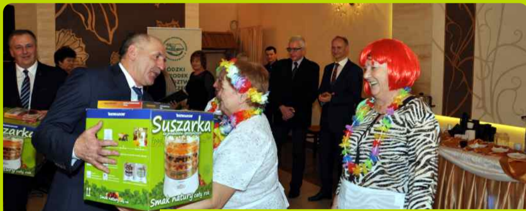
Suszarki do produktów spożywczych ufundowanie m. in. przez starostę zgierskiego z pewnością przydadzą się paniom z kół gospodyń wiejskich