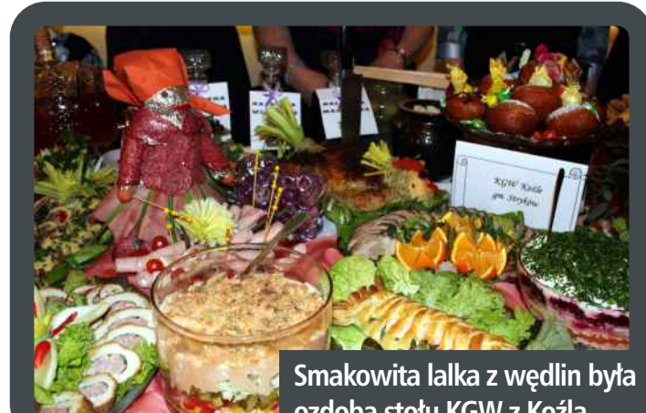
Smakowita lalka z wędlin była ozdobą stołu KGW z Koźła