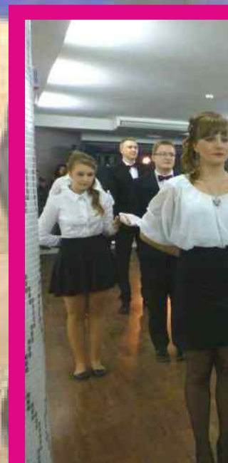
Szkoła im. M.