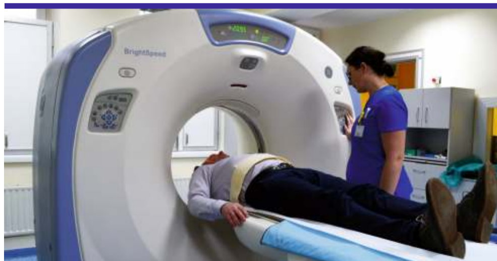
Badanie tomografem służy nie tylko wczesnemu wykrywaniu nowotworów, pokazuje także wszelkie urazy kostne, zmiany w obrębie klatki piersiowej, diagnozuje zaburzenia neurologiczne oraz zmiany zwyrodnieniowe kręgosłupa

Aby umówić się na wizytę, wystarczy skontaktować się z rejestracją szpitala, pod numerem telefonu (42) 714 35 24 i w ciągu kilku dni przyjść na badanie. [LR]