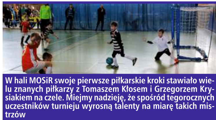
W hali MOSiR swoje pierwsze piłkarskie kroki stawiało wielu znanych piłkarzy z Tomaszem Kłosem i Grzegorzem Krysiakiem na czele. Miejmy nadzieję, że spośród tegorocznych uczestników turnieju wyrosną talenty na miarę takich mistrzów