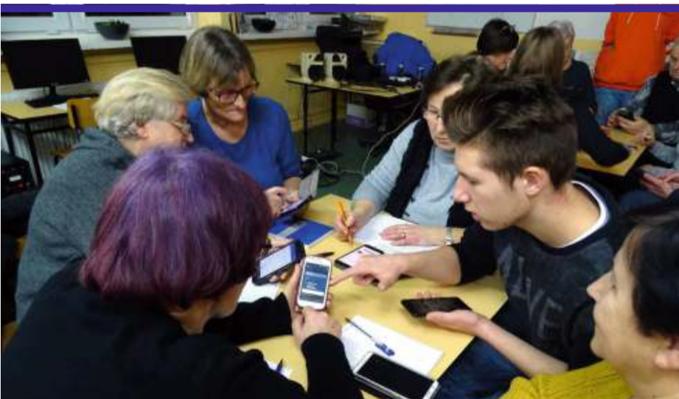
Udział w „Zwolnieni z teorii” to nie tylko okazja na zdobycie konkretnych, cennych umiejętności i doświadczenia, ale również szansa na zrobienie czegoś dobrego

musi przejść operację oka, wynikającą z powikłań po chorobie nowotworowej – mówią uczennice.