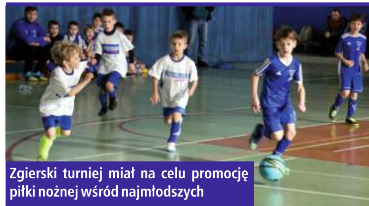
Zgierski turniej miał na celu promocję piłki nożnej wśród najmłodszych