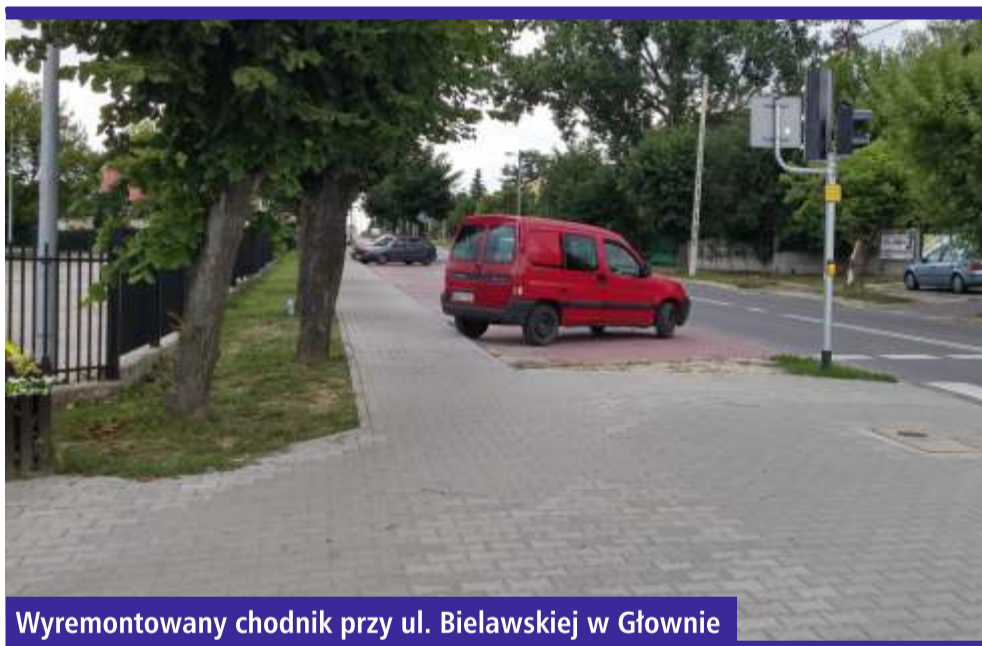
Wyremontowany chodnik przy ul. Bielawskiej w Głownie