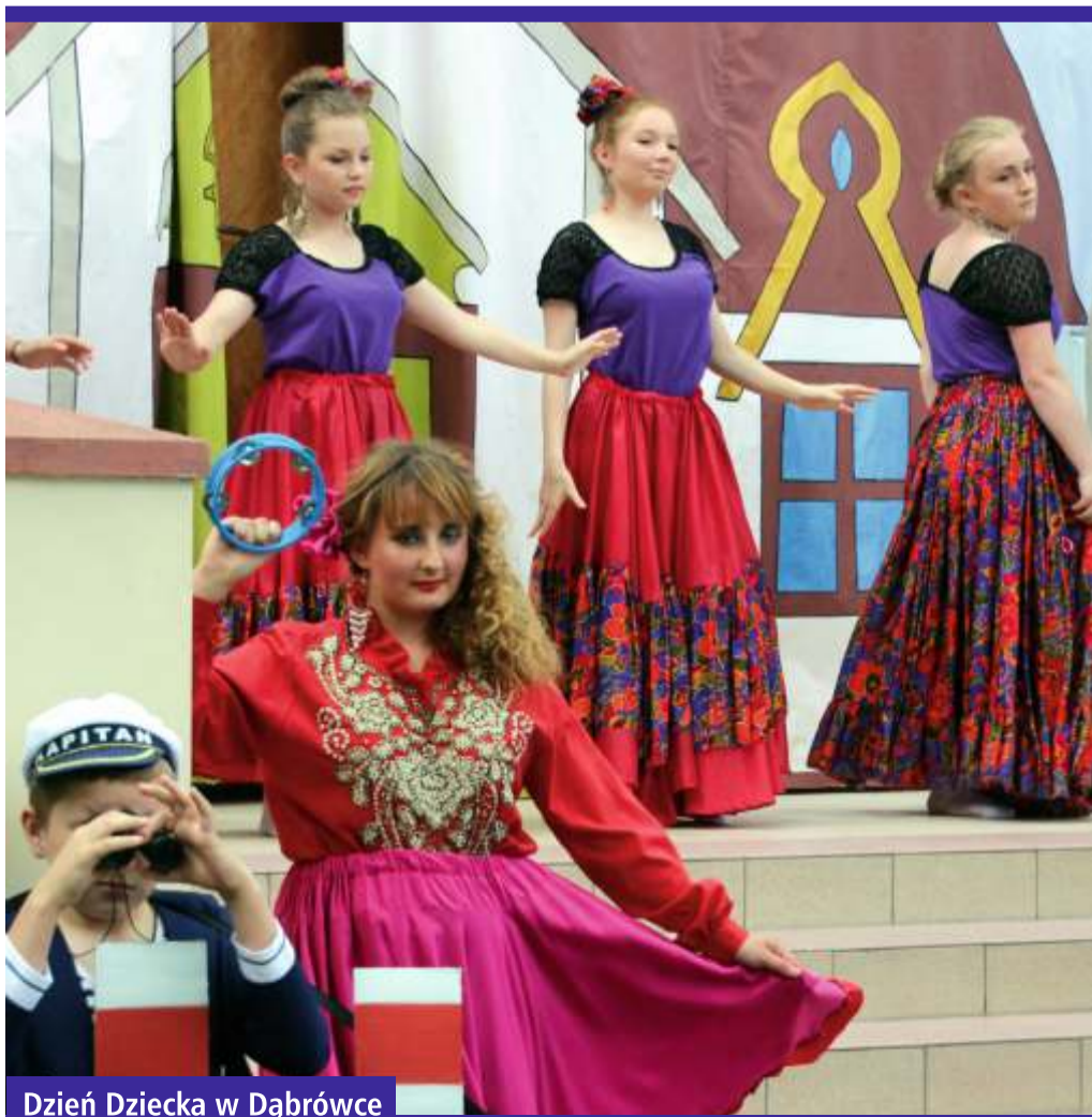
Dzień Dziecka w Dąbrowce