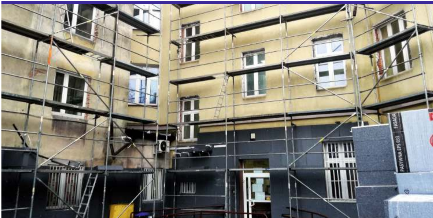
Termomodernizacja budynku Starostwa Powiatowego w Zgierzu przy ul. Długiej

Trwa także budowa nowego Domu Dziecka w Dąbrowce-Strumiany. Obiekt będzie dwukondygnacyjny o powierzchni 500 m kw. Nowy dom dla 14 podopiecznych będzie wyposażony w 7 sypialni dwuosobowych, łazienki i kuchnię z jadalnią. Część budynku przeznaczona będzie na potrzeby nauki usamodzielniania się. Zostaną w niej ulokowane gabinety terapii, odwiedzin dla rodziny oraz pokój integracji. Wszystko po to, aby w przyszłości, wychodzący stąd młodzi ludzie, byli przygotowani do samodzielnego, dorosłego życia. Aby dostosować budynek do potrzeb osób niepełnosprawnych, zainstalowana zostanie również winda. Koszt inwestycji to blisko 2,2 mln zł, z czego 85 % to środki z budżetu województwa łódzkiego, reszta pochodzi z budżetu powiatu. [JŁ/ŁR]