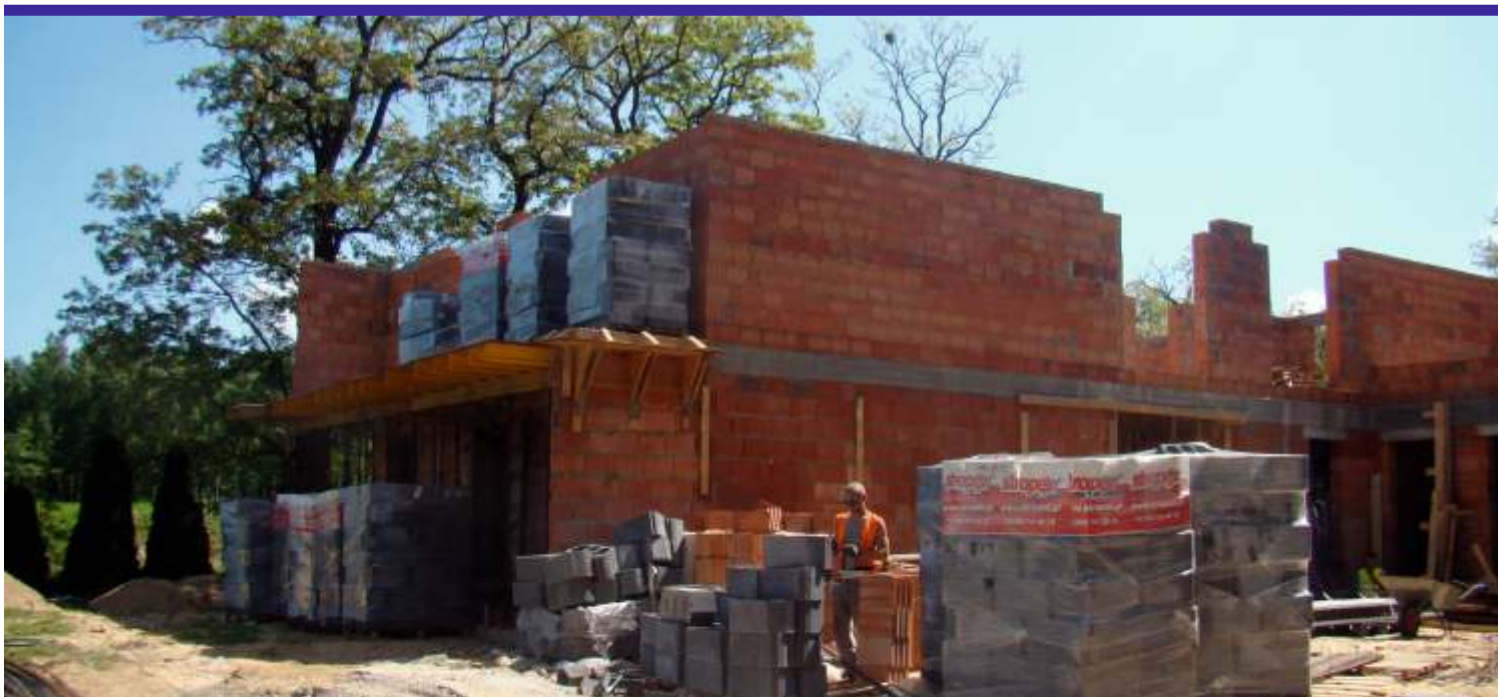
Budowa Domu Dziecka w Dąbrowce ma potrwać do końca listopada