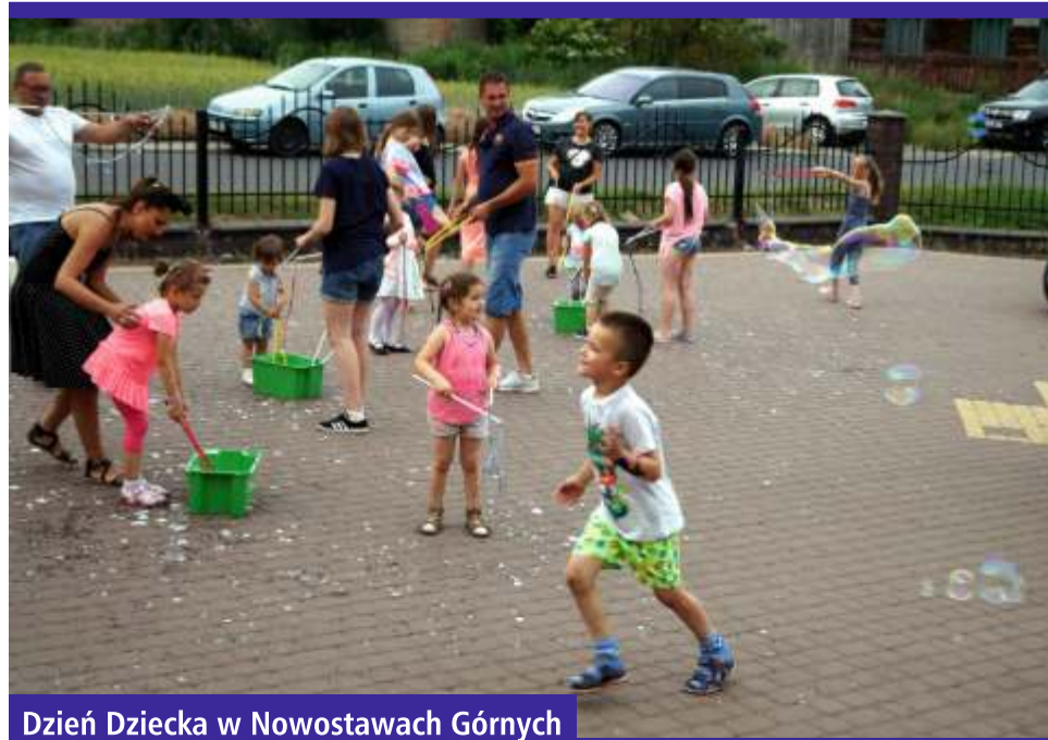
Dzień Dziecka w Nowostawach Górnych