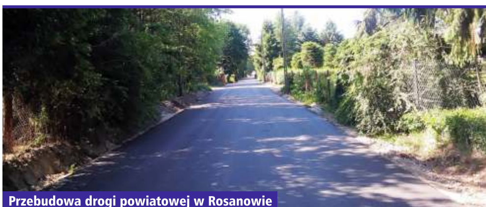
Przebudowa drogi powiatowej w Rosanowie