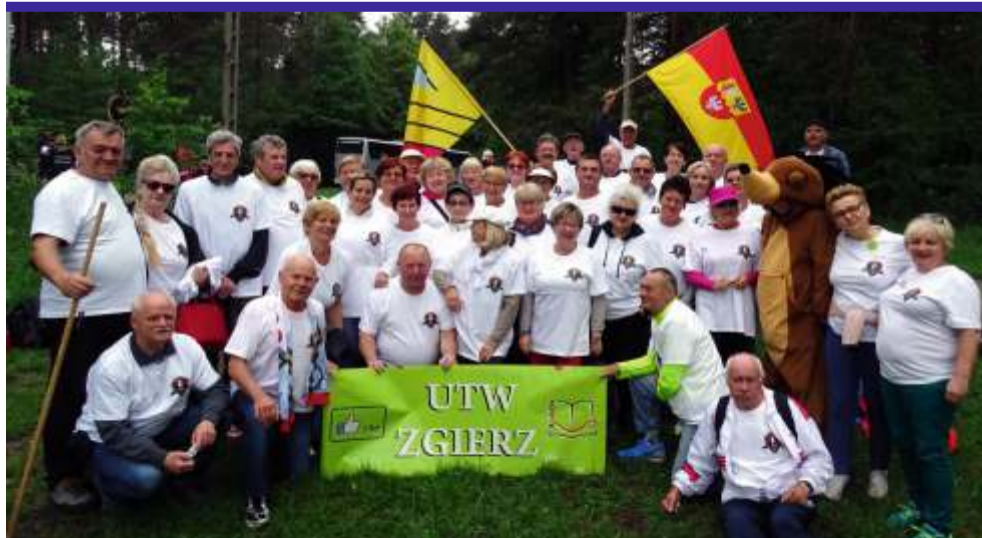
Swoją sportową postawą nasi seniorzy jeszcze raz potwierdzili, że znane od pokoleń powiedzenie – w zdrowym ciele – zdrowy duch, to nie mit

Taki wynik spowodował, że drużyna ze stolicy naszego powiatu, w klasyfikacji generalnej, zajęła czwarte miejsce. [LR]