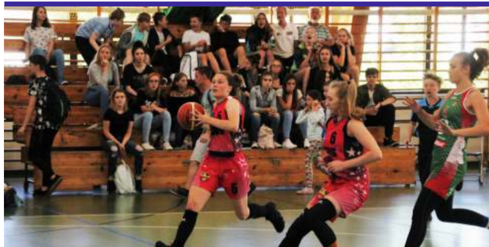
Wysoki poziom sportowy, emocje do ostatniej akcji oraz gorący doping publiczności – tak w skrócie wyglądał finałowy turniej w Aleksandrowie Łódzkim

W meczu z mistrzyniami województwa śląskiego – VII LO w Sosnowcu, bardzo dobra gra w kontrataku oraz pod koszem zaowocowała tym, że w pewnym momencie SMS-ianki