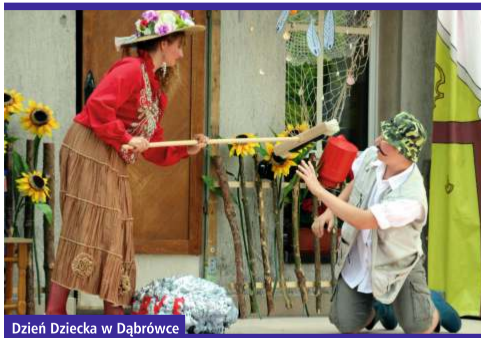
Dzień Dziecka w Dąbrowce