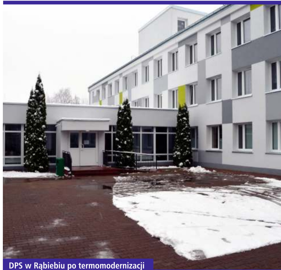
DPS w Rąbieniu po termomodernizacji

W 2017 roku w budżecie powiatu zgierskiego znalazły się również pieniądze na inwestycje związane z termomodernizacją budynków użyteczności publicznej, rozbudową bazy sportowo-oświatowej, czy kulturalnej powiatu zgierskiego. W ramach dwuetapowego projektu „Termomodernizacja budynków użyteczności publicznej powiatu zgierskiego”, za łączną kwotę prawie 9,4 mln zł, poddano termomodernizacji Zespoły Szkół Specjalnych w Ozorkowie oraz Głownie oraz Domy Pomocy Społecznej w Rąbieniu oraz w Ozorkowie.