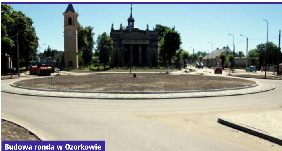
Budowa ronda w Ozorkowie