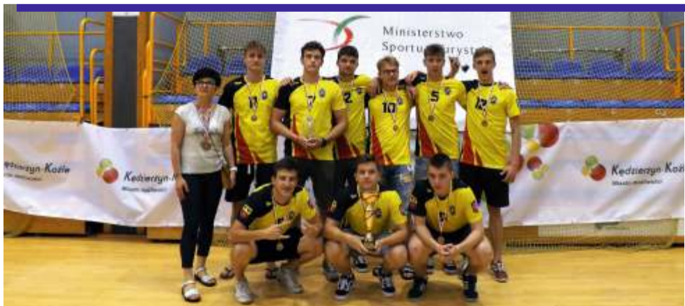
Młodzi zawodnicy z I LO w Ozorkowie udowodnili, że należą do ścisłej, siatkarskiej czołówki

Mistrzowski tytuł wywalczyli licealiści z LXII LO im. gen. Andersa w Warszawie, którzy pokonali w finale I LO w Kędzierzynie-Koźlu. [LR] na podst. info. I LO w Ozorkowie