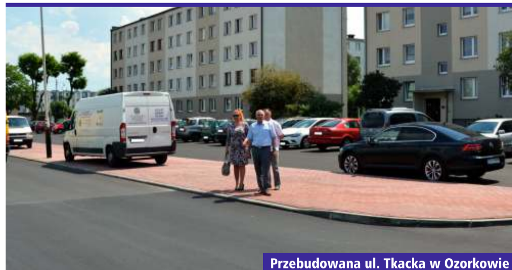
Przebudowana ul. Tkacka w Ozorkowie