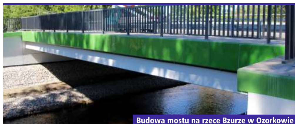
Budowa mostu na rzece Bzurze w Ozorkowie