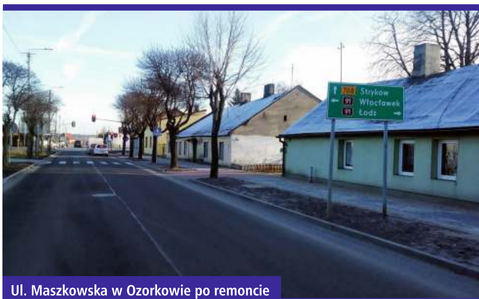
Ul. Maszkowska w Ozorkowie po remoncie