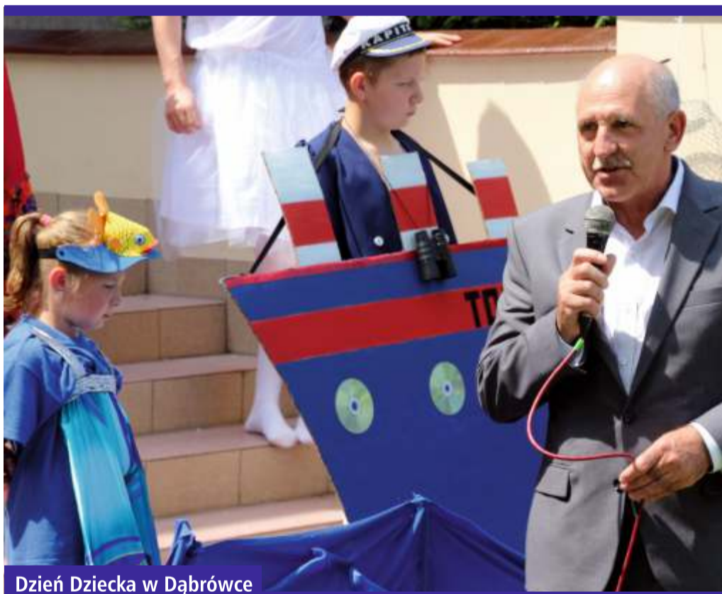
Dzień Dziecka w Dąbrowce