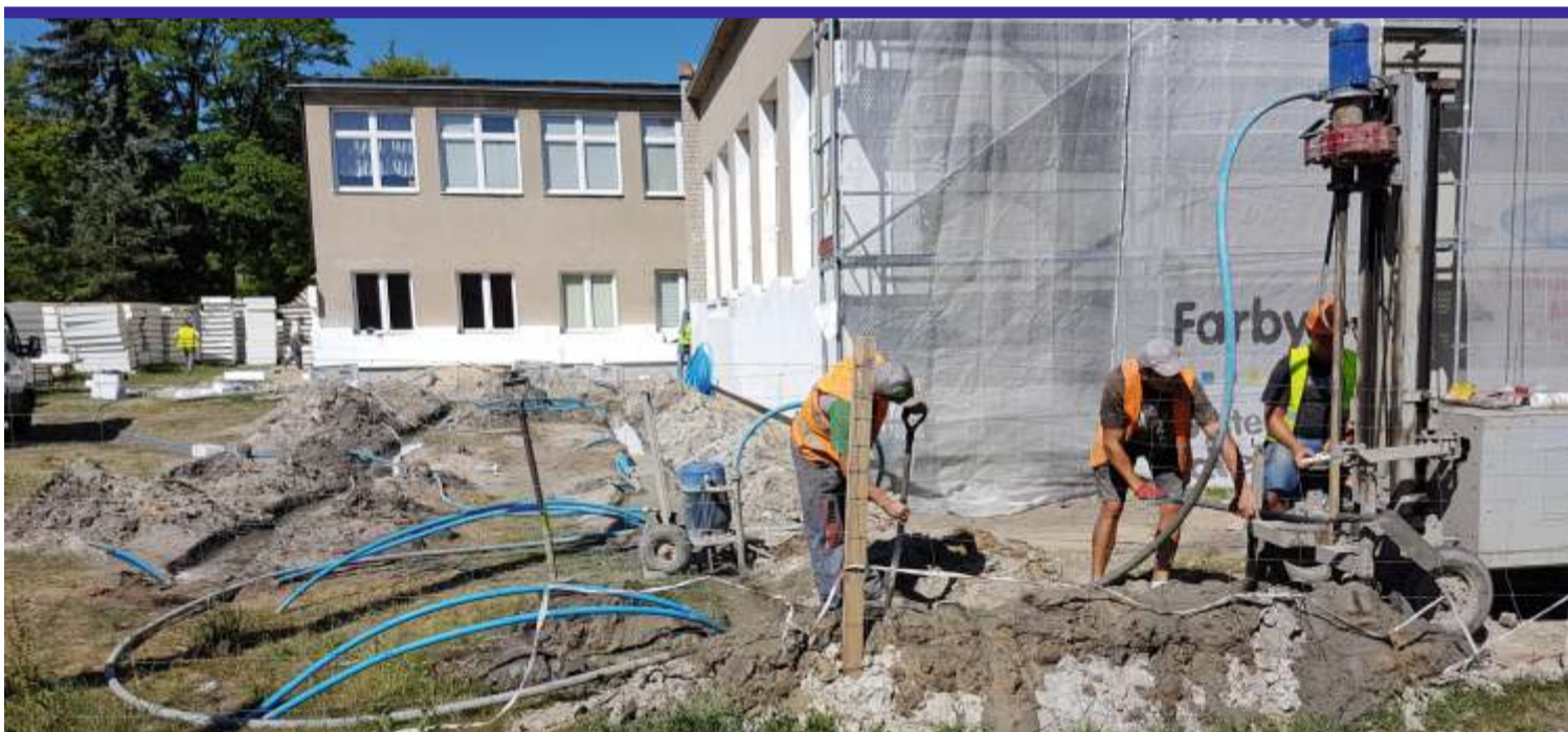
Ekipa budowlana właśnie wykonuje odwierty pod pompy ciepła w głowieńskim Cebertowiczu