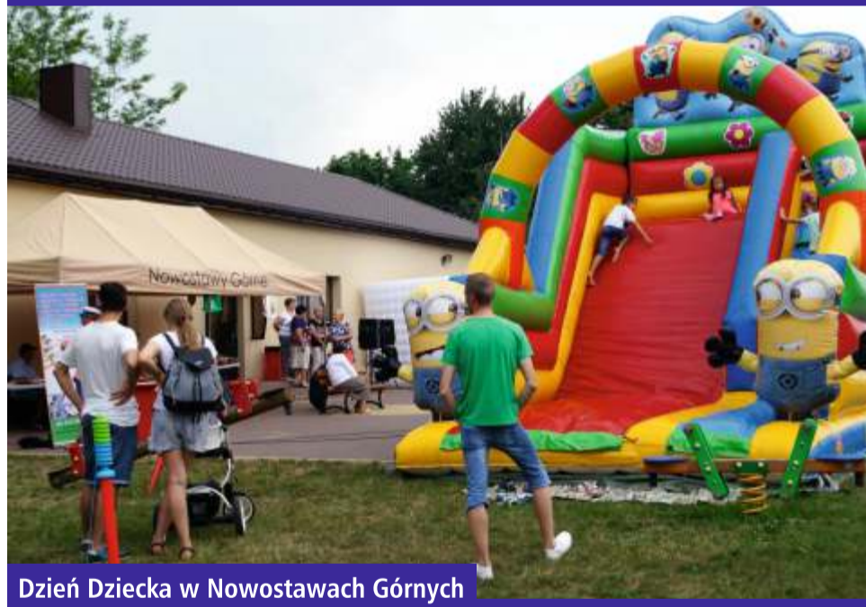
Dzień Dziecka w Nowostawach Górnych