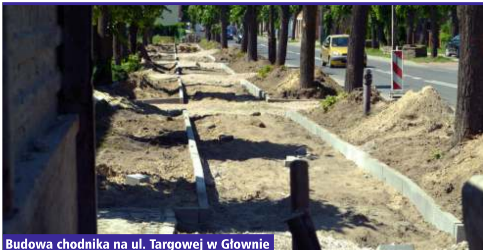
Budowa chodnika na ul. Targowej w Głownie