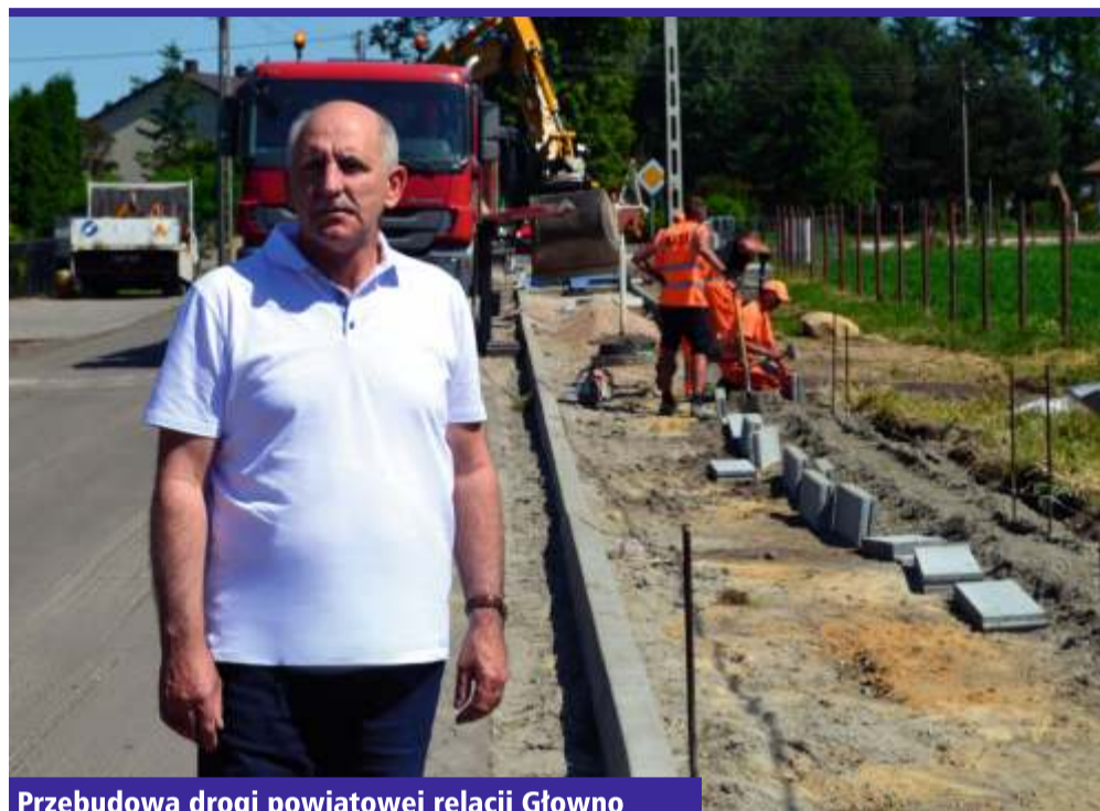
Przebudowa drogi powiatowej relacji Głowno - Antoniew - Bronisławów - Domaradzyn

Jeszcze w tym roku nowe chodniki pojawią się: na ul. Chełmskiej, na odcinku od drogi krajowej nr 91 w kierunku ul. Sadowej, a także na ul. Piotra Skargi – odcinek od ul. Łęczyckiej do ul. Parzęczewskiej, po prawej stronie. Z kolei na ul. Musierowicza powstanie nowa nakładka. W planach jest również przebudowa skrzyżowania ul. Parzęczewskiej z ul. Gałczyńskiego. Aby prace były jak najmniej uciążliwe dla mieszkańców, zostaną one prowadzone w okresie wakacyjnym, gdy ruch w mieście jest mniejszy. [LR]