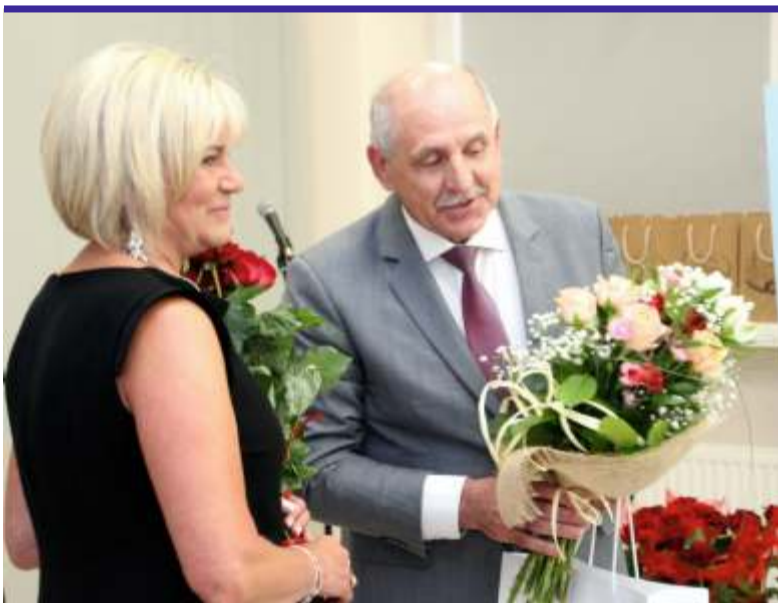
Pracownicy Miejsko-Powiatowej Biblioteki Publicznej w Zgierzu, są doskonałym przykładem na to, że pomysłów na promowanie czytelnictwa jest wiele

W trakcie uroczystości goście mogli także wysłuchać koncertu w wykonaniu utalentowanych solistów z grupy wokalne Julii Szwajcer, a także skosztować tortu, przygotowanego specjalnie z okazji święta. [LR]