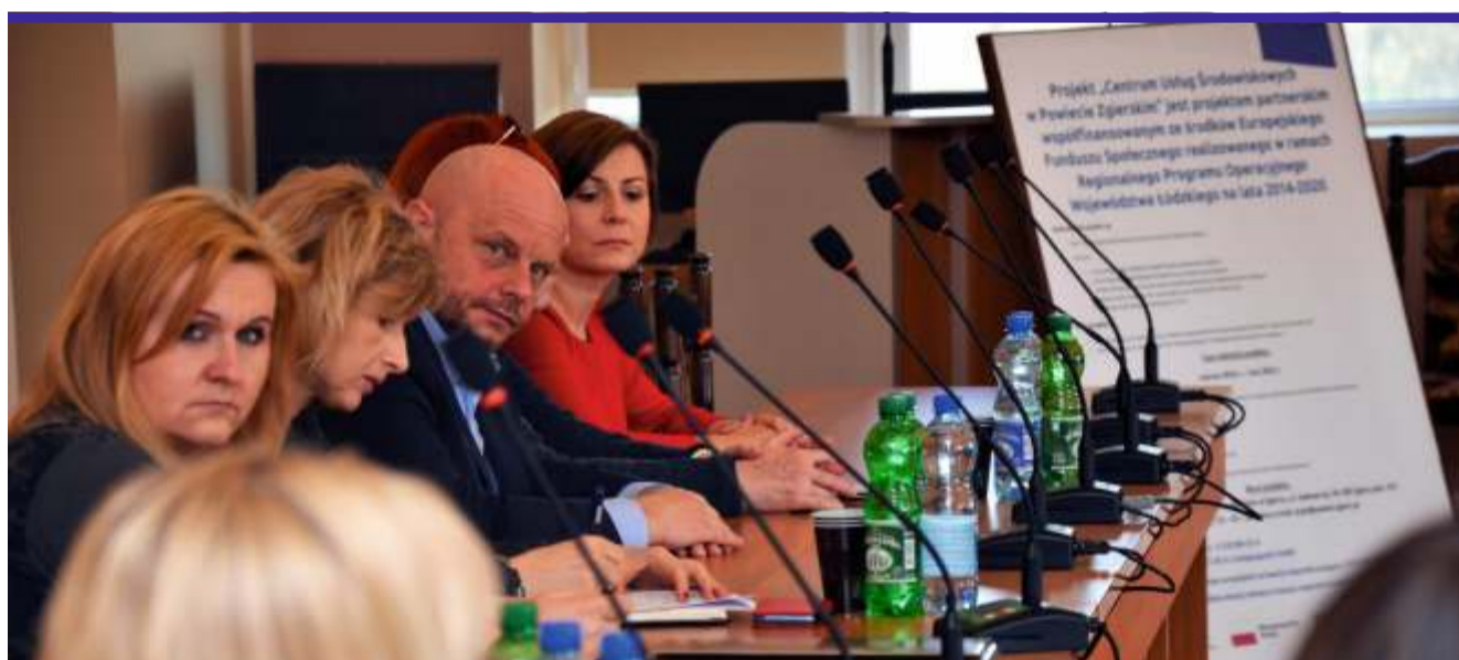
CUŚ ma wesprzeć osoby niesamodzielne i niepełnosprawne w ich codziennym życiu

Z kolei Miejski Ośrodek Pomocy Społecznej w Zgierzu, oprócz porad prawnych, zapewni usługi asystenta osobom, które nie są w stanie ani samodzielnie pójść do lekarza, ani wyjść z domu czy zrobić zakupy. Osoby zainteresowane