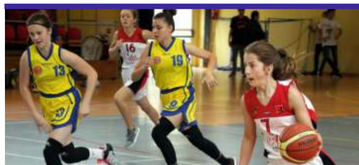
Młode, zdolne i niezwykle waleczne – tak w skrócie można określić koszykarki Alles Basket Głowno