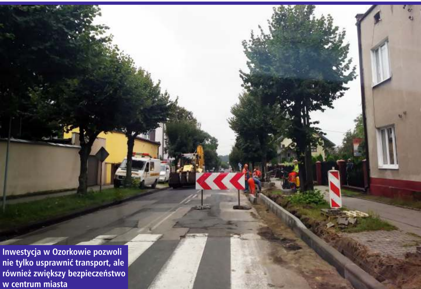
Inwestycja w Ozorkowie pozwoli nie tylko usprawnić transport, ale również zwiększy bezpieczeństwo w centrum miasta

W ubiegłym roku informowaliśmy o potężnym zastrzyku gotówki, który otrzymał powiatowy samorząd wraz z miastem Ozorków, na remonty dróg właśnie w tym mieście. W ramach Regionalnego Programu Operacyjnego Województwa Łódzkiego na lata 2014-2020, udało się pozyskać dofinansowanie na przebudowę blisko 4,4 km dróg powiatowych i miejskich, za łączną kwotę blisko 18 mln zł. W połowie sierpnia rozpoczął się I etap przebudowy, czyli remont ul. Maszkowskiej, gdzie drogowcy wymieniają chodniki i pobocza oraz kładą nowy asfalt. Jeszcze we wrześniu ma rozpocząć się przebudowa ul. Południowej, na odcinku od ul. Unii Europejskiej do ul. Zgierskiej wraz z przebudową mostu oraz dwóch skrzyżowań: ul. Południowej/Wyszyńskiego/ Zgierskiej oraz Wyszyńskiego/Średniej/Maszkowskiej na skrzyżowanie typu rondo.