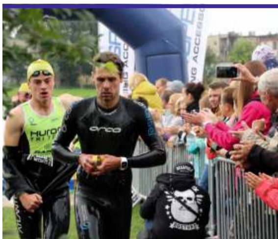
W wodzie, na szosie a na koniec bieg – tak w skrócie wyglądała II edycja strykowski triathlonu

W połowie września nad Zalewem Miejskim w Strykowie spotkało się blisko 400 miłośników triathlonu, którzy rywalizowali w drugiej edycji "Triathlon Stryków" na dystansie 1/4 Ironman.