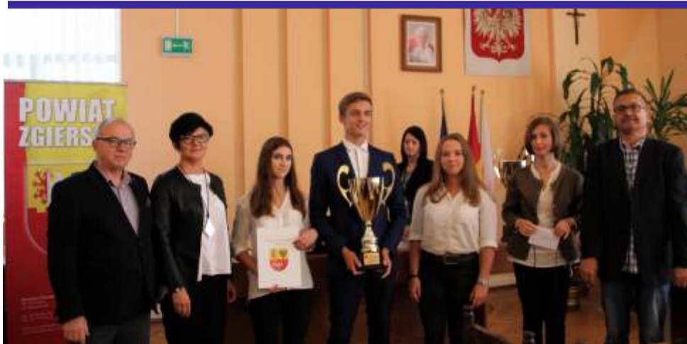
Podczas podsumowania najlepszym szkołom zostały wręczone puchary, dyplomy i talony na zakup sprzętu sportowego o łącznej wartości 10 tys. zł

– Cieszy mnie fakt, że uczniowie naszych szkół osiągają tak liczne sukcesy na arenie