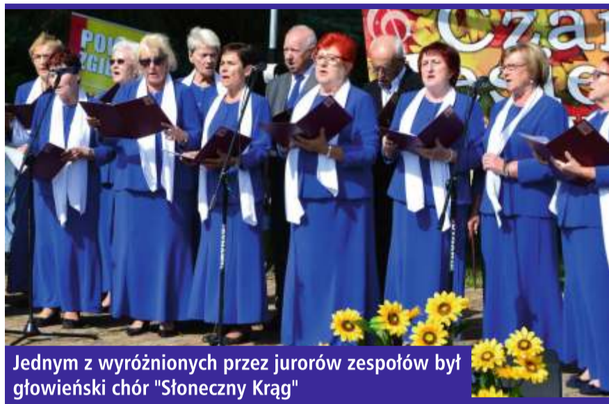
Jednym z wyróżnionych przez jurorów zespołów był głowienieński chór "Słoneczny Krąg"

Już po raz kolejny początek jesieni rozpoczynają Artystyczne Spotkania Seniorów „Czar Jesieni”. Tegoroczna 10. Edycja przyciągnęła do Miejskiego Ośrodka Kultury w Głownie – organizatora przeglądu, utalentowanych mieszkańców z całego województwa, m. in. z Radomska, Krośniewic, Łowicza, Pabianic, Zduńskiej Woli, Koruszek, Brzezina, Łowicza, Rawy Mazowieckiej czy Skierniewic. Głównie reprezentowały zespoły: Związku Nauczycielstwa Polskiego Słoneczny Krąg oraz Miejskiego Ośrodka Kultury „Głownianki”. W jubileuszowej edycji Czar Jesieni zaprezentowali się także członkowie „Chóru Męskiego” z niemieckiej gminy Remptendorf, którzy przyjechali do Głowna w ramach rewizyty. Łącznie w przeglądzie wzięło udział 30 zespołów, 16 solistów, 6 duetów oraz 8 gawędziarzy. Wpłynęło też 18 wierszy na konkurs literacki.