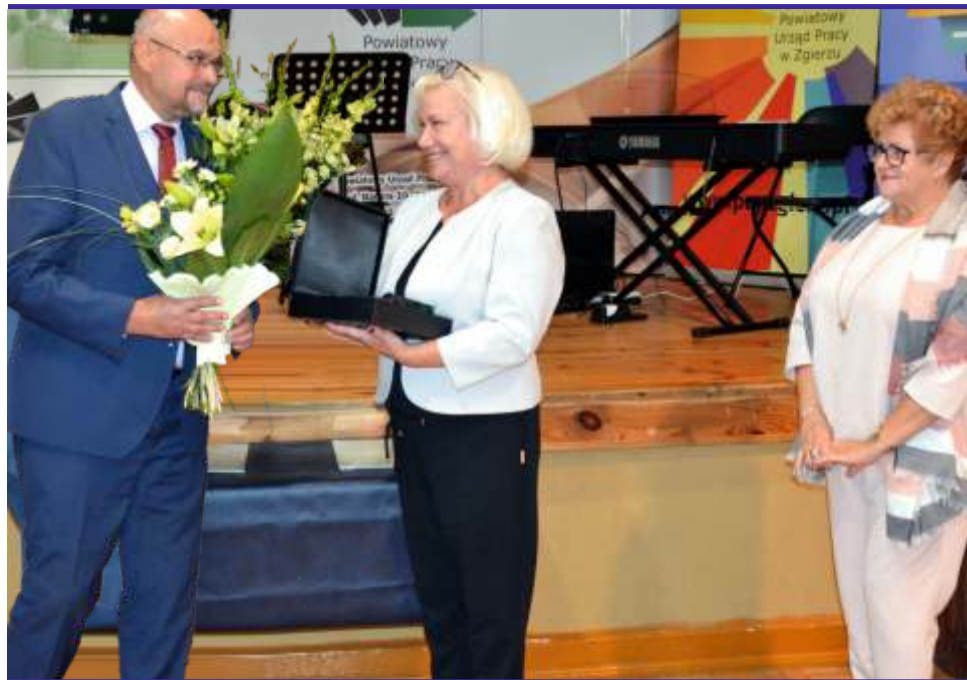
Specjalnymi wyróżnieniami „Lidera Rynku Pracy” podczas Targów nagrodzono firmy: Adrian ze Zgierza i Alles z Głowna, które na swoim koncie mają już po trzy tytuły „Pracodawcy Roku”