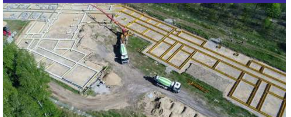
Położenie fundamentów pod cały obiekt