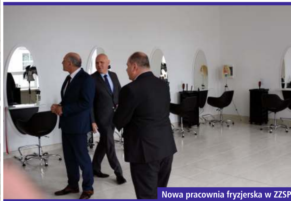
Nowa pracownia fryzjerska w ZZSP