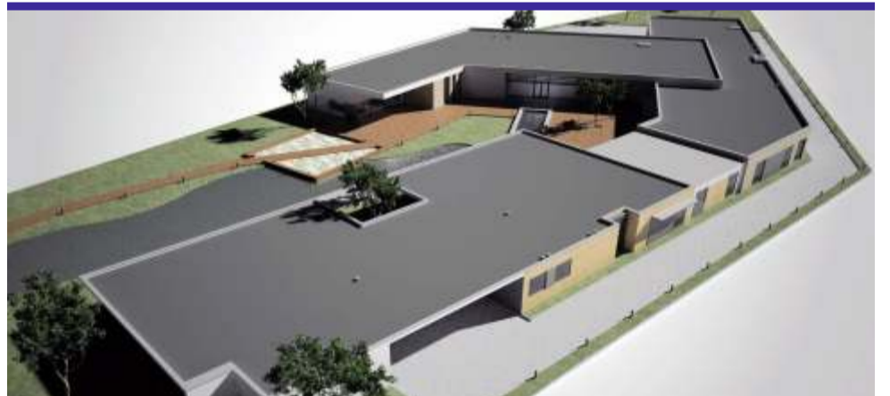
Wizualizacja powstającego budynku Hospicjum im. Jana Pawła II w Zgierzu