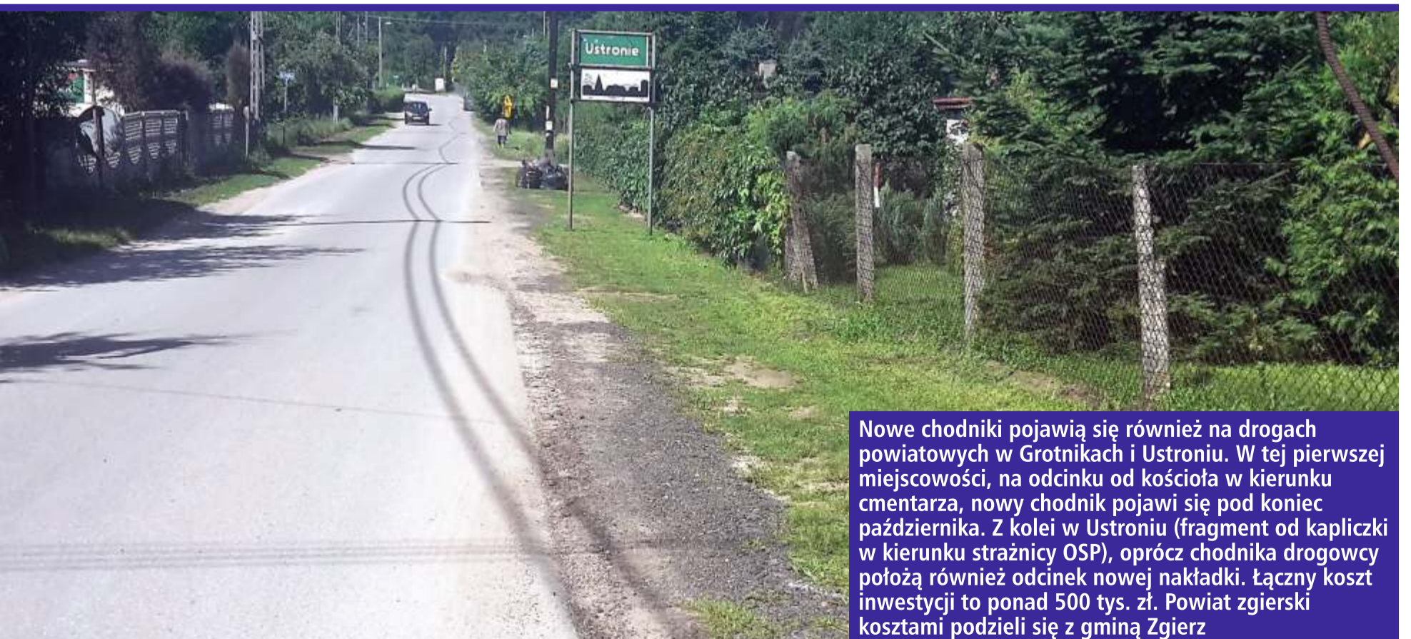
Nowe chodniki pojawią się również na drogach powiatowych w Grotnikach i Ustroniu. W tej pierwszej miejscowości, na odcinku od kościoła w kierunku cmentarza, nowy chodnik pojawi się pod koniec października. Z kolei w Ustroniu (fragment od kapliczki w kierunku strażnicy OSP), oprócz chodnika drogowcy położą również odcinek nowej nakładki. Łączny koszt inwestycji to ponad 500 tys. zł. Powiat zgierski kosztami podzieli się z gminą Zgierz

Remonty planowane są również w Sokolnikach. Pod koniec października, na odcinku od drogi wojewódzkiej nr 708 do samej miejscowości, pojawi się nowy asfalt, za ponad 550 tys. zł. Obecnie trwają prace nad dokumentacją związaną z przebudową innych dróg powiatowych m.in. wymianą nawierzchni na drodze w Pludwinach, ul. Kolejową w Strykowie, ul. Kolejową w Bratoszewicach wraz z wymianą chodników oraz ul. Tkacką w Ozorkowie. [ŁR]