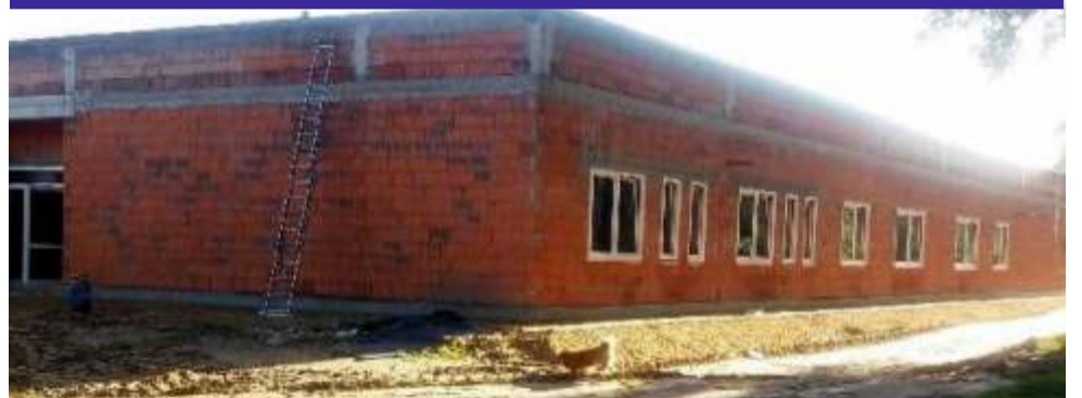
Zakończony I etap budowy hospicjum – stan surowy zamknięty części administracyjnej i poradni paliatywnej