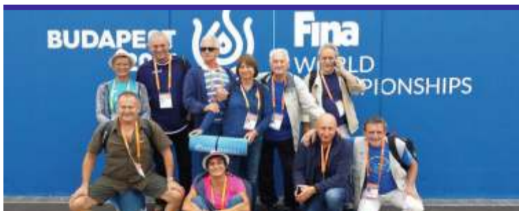
Za rok Mistrzostwa Europy w Słowenii i kolejna szansa na medale. Trzymamy kciuki!

Sukcesem zakończył się start ośmiorga zawodników Zgierskiego Uniwersytetu Trzeciego Wieku, podczas Mistrzostw Świata w Pływaniu Mastersów w Budapeszcie. Ze stolicy Węgier, zgierscy seniorzy przywieźli cztery złote i jeden srebrny medal oraz trzy rekordy świata i dziesięć krajowych. Jak co roku zgierską ekipę finansowo wspomógł m.in. powiatowy samorząd.