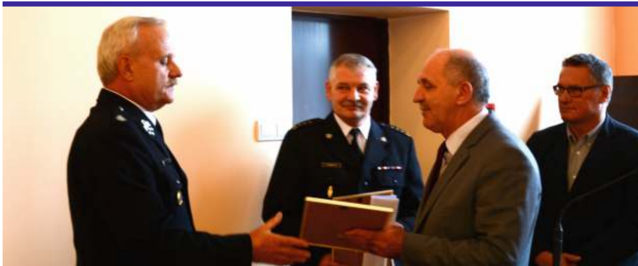
Do podziękowań i życzeń przyłączyli się także obecni na sesji powiatowi radni, którzy brawami na stojąco nagrodzili wysiłek strażaków

Wasz wysiłek na rzecz niesienia pomocy mieszkańcom powiatu zgierskiego i udroźnianiu dróg, przyczynił się do ustabilizowania sytuacji w naszym regionie. Dlatego dzisiaj dziękuję i życzę wszystkim strażakom satysfakcji ze służby dla dobra powiatu zgierskiego i jego mieszkańców, szczęśliwych powrotów z akcji ratowniczych oraz wszelkiej pomocy w życiu osobistym – mówił starosta Jarota. [JL]