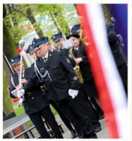
Uroczystości rozpoczęły się od odegrania pieśni patriotycznych w wykonaniu orkiestry dętej OSP w Aleksandrowie Łódzkim