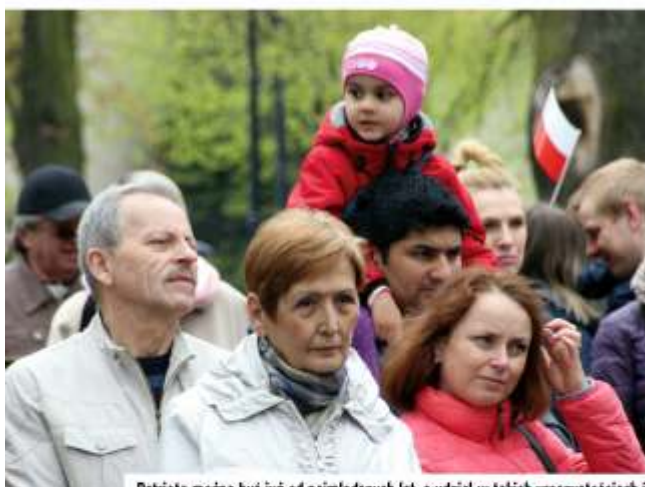
Patriotą można być już od najmłodszych lat, a udział w takich uroczystościach jak obchody Święta Uchwalenia Konstytucji 3 Maja, stanowi dla młodzieży świetną lekcję historii na żywo