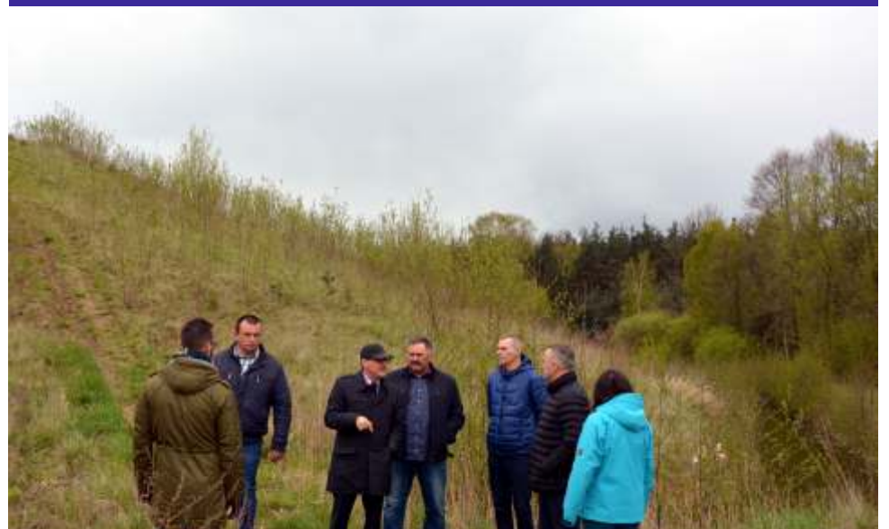
... a tak wygląda ten teren dzisiaj

towej delegacji, było składowisko w Ziewanicach, na które trafiały odpady z terenu gminy i miasta Głowno, którego rekultywacja została zakończona ponad 3 lata temu. W tym momencie, gdyby nie tablice informacyjne oraz wysoka i zalesiona na kilkanaście metrów góra, nie można by dostrzec żadnych śladów po wysypisku. Jest to wzorcowe przedsięwzięcie na terenie powiatu zgierskiego. W tym miej-