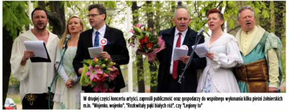
W drugiej części koncertu artyści, zaprosili publiczność oraz gospodarzy do wspólnego wykonania kilku piosenek żołnierskich m.in. "Wojenka, wojenka", "Rozkwitły pąki białych róż", czy "Legiony to"