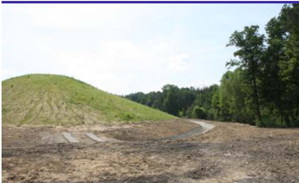
Tak wyglądało składowisko w Ziewanicach zaraz po rekultywacji, ....

Jeżeli zaś chodzi o składowisko odpadów komunalnych przy ul. Szczawińskiej, to należy ono do Gminy-Miasto Zgierz, która rozpoczęła działania zmierzające do jego rekultywacji. [JŁ]