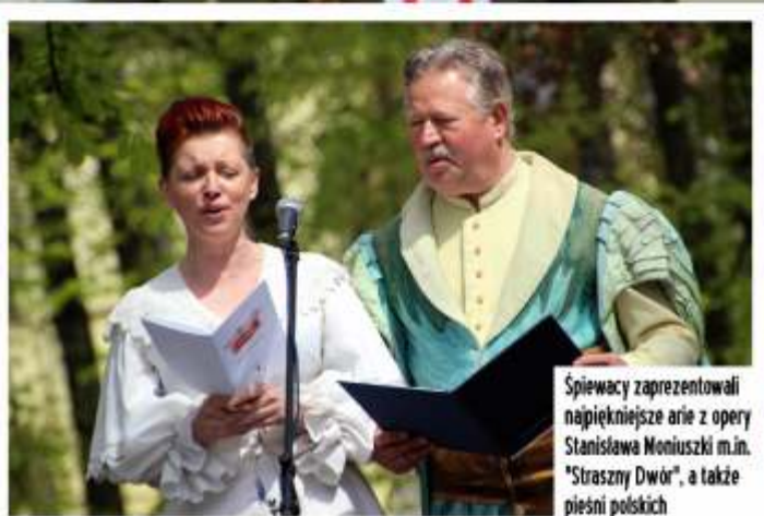
Śpiewacy zaprezentowali najpiękniejsze arie z opery Stanisława Moniuszki m.in. "Straszny Dwór", a także pieśni polskich kompozytorów tj. Fryderyka Chopina, Stanisława Niewiadomskiego czy Mieczysława Karłowicza