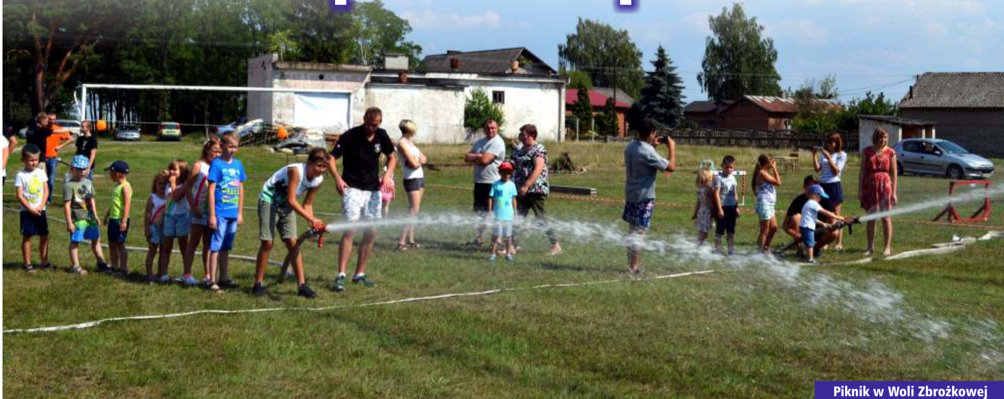
Piknik w Woli Zbrożkowej

Lipiec, w wielu miejscowościach powiatu zgierskiego, upływał pod hasłem wspólnej zabawy i integracji mieszkańców. W Zelgoszczy, Bronisławowie czy Woli Zbrożkowej lokalne stowarzyszenia, m. in. przy wsparciu powiatowego samorządu, zorganizowały pikniki, które oprócz rodzinnej zabawy, promowały patriotyzm i bezpieczeństwo podczas letniego wypoczynku.