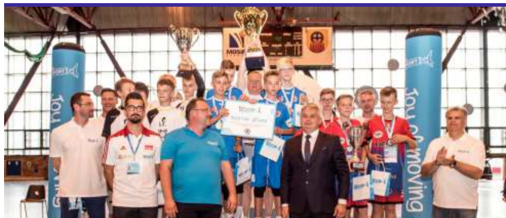
Ciężka praca i hektolitry potu wylanych na treningach, przeniosły młodym zawodnikom z Ozorkowa wymarzony sukces, złoto w turnieju „Trójek” (na zdjęciu) i brąz „Dwójek”