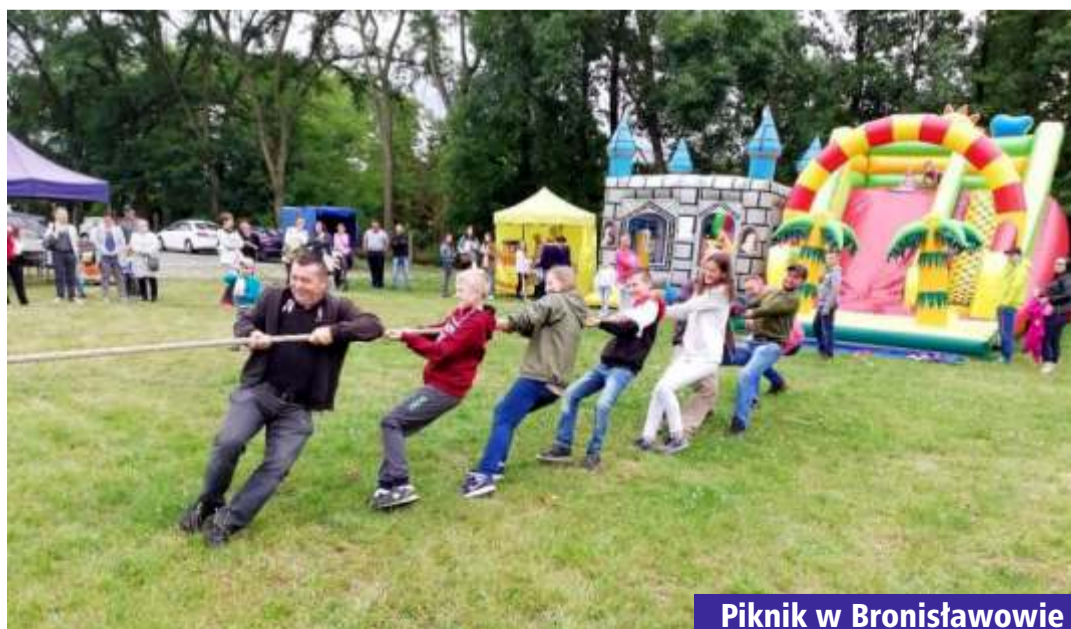
Piknik w Bronisławowie