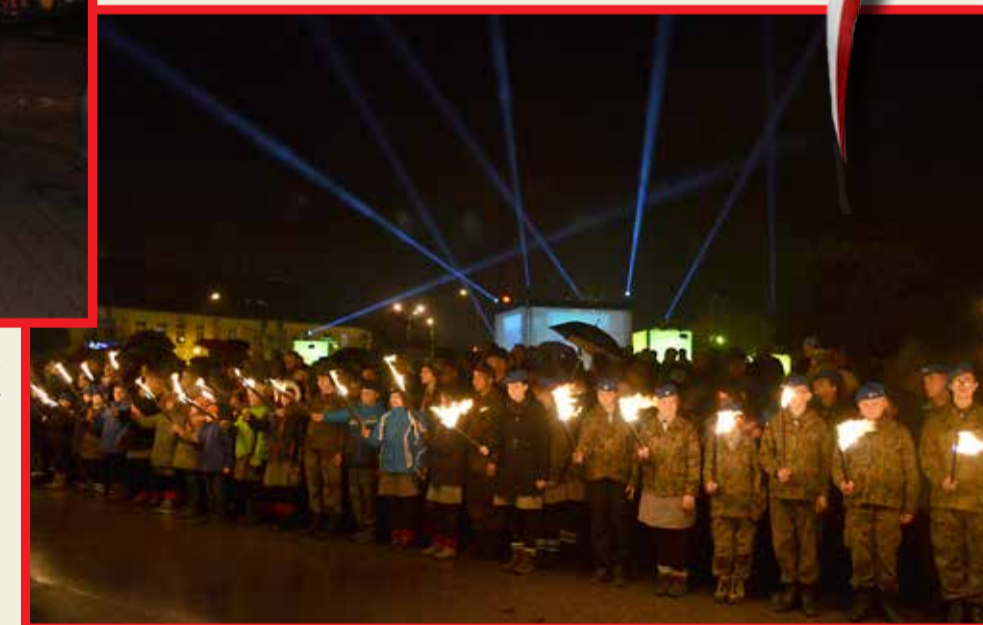
Harcerze ze zgierskiego hufca z pochodniami w dłoniach stworzyli niesamowity nastrój do zadumy