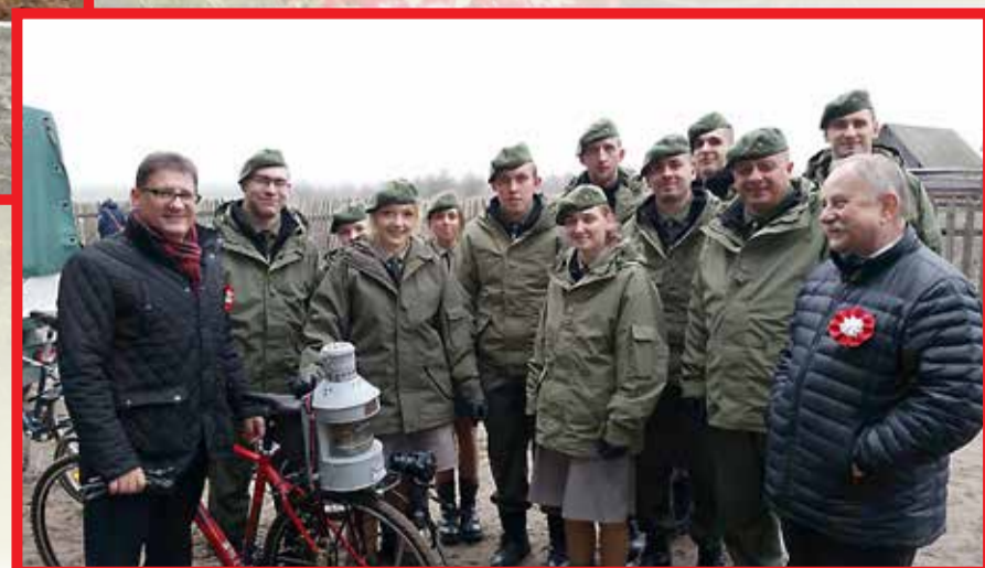
Ogień niepodległości pokonał, wraz ze zgierskimi harcerzami, setki kilometrów, by 11 listopada zapłonąć w stolicy naszego powiatu