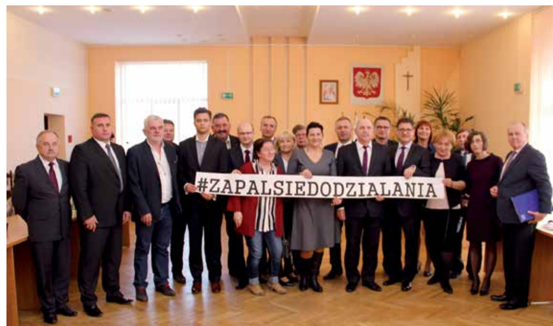
Powiatowi radni bardzo chętnie włączyli się w zbiórkę i zapalają do działania następne osoby, którym nie jest obojętny los Kasi

Pieniądze na leczenie Kasi można wpłacać na konto: 06 1140 2017 0000 4302 1309 9082 Fundacja Rak'n'Roll. Wygraj Życie ul. Bagatela 10/17 00-585 Warszawa Tytuł: Dla Kasi C.