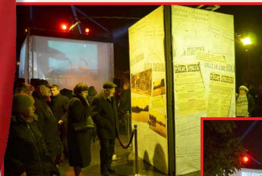
Obecni na placu Jana Pawła II mieli okazję przeczytać „Gazetę Zgierską” w oryginale