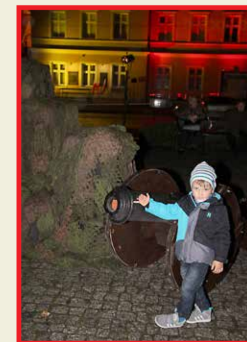
4-letniego Kubę najbardziej interesowały dekoracje, w tym repliki dwóch armat z tamtego okresu