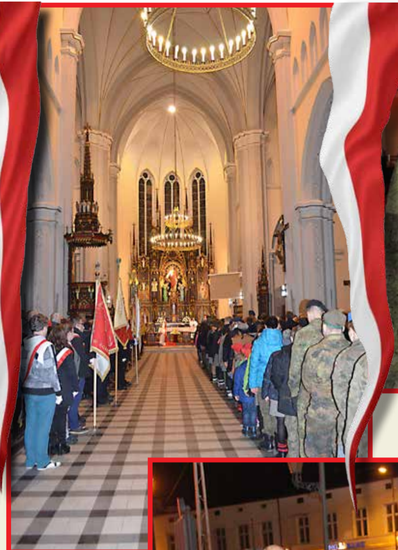
Podczas mszy świętej swoje poczyty sztandarowe wystawiły zgierskie szkoły, harcerze i przedstawiciele „Solidarności”