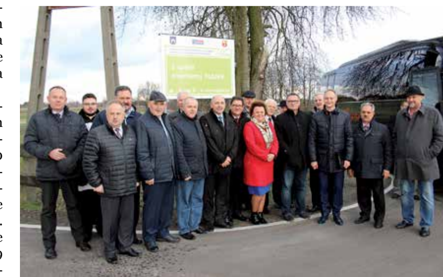
Oddane do użytku drogi w Parzęczewie to zaledwie dwie z kilkunastu powiatowych inwestycji drogowych właśnie ukończonych lub będących w trakcie realizacji

w Aleksandrowie Łódzkim (ponad 1 km za ponad 237,3 tys. zł). Prace na nich mają zakończyć się jeszcze w tym roku. MT