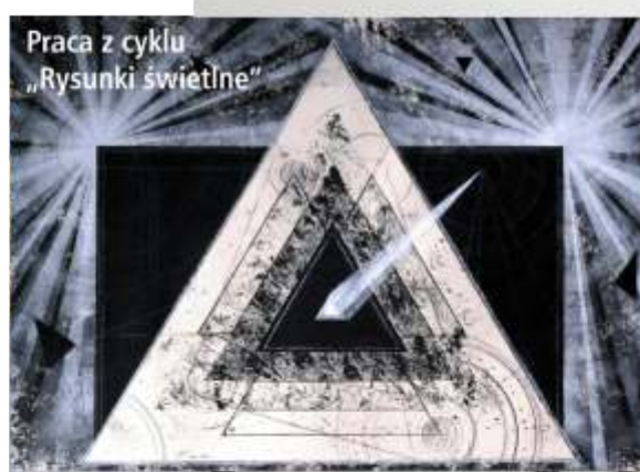
Praca z cyklu „Rysunki świetlne”