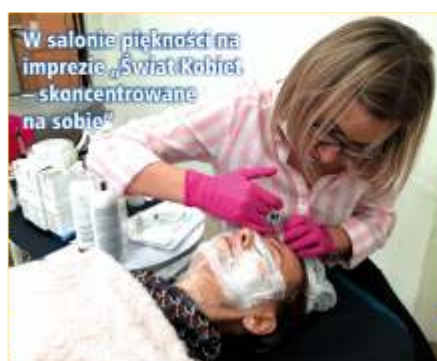
W salonie piękności na imprezie „Świat Kobiet - skoncentrowane na sobie”