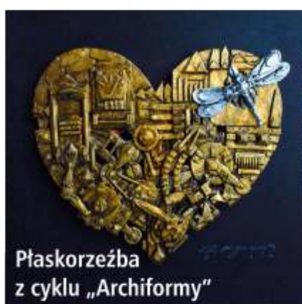
Płaskorzeźba z cyklu „Archiformy”