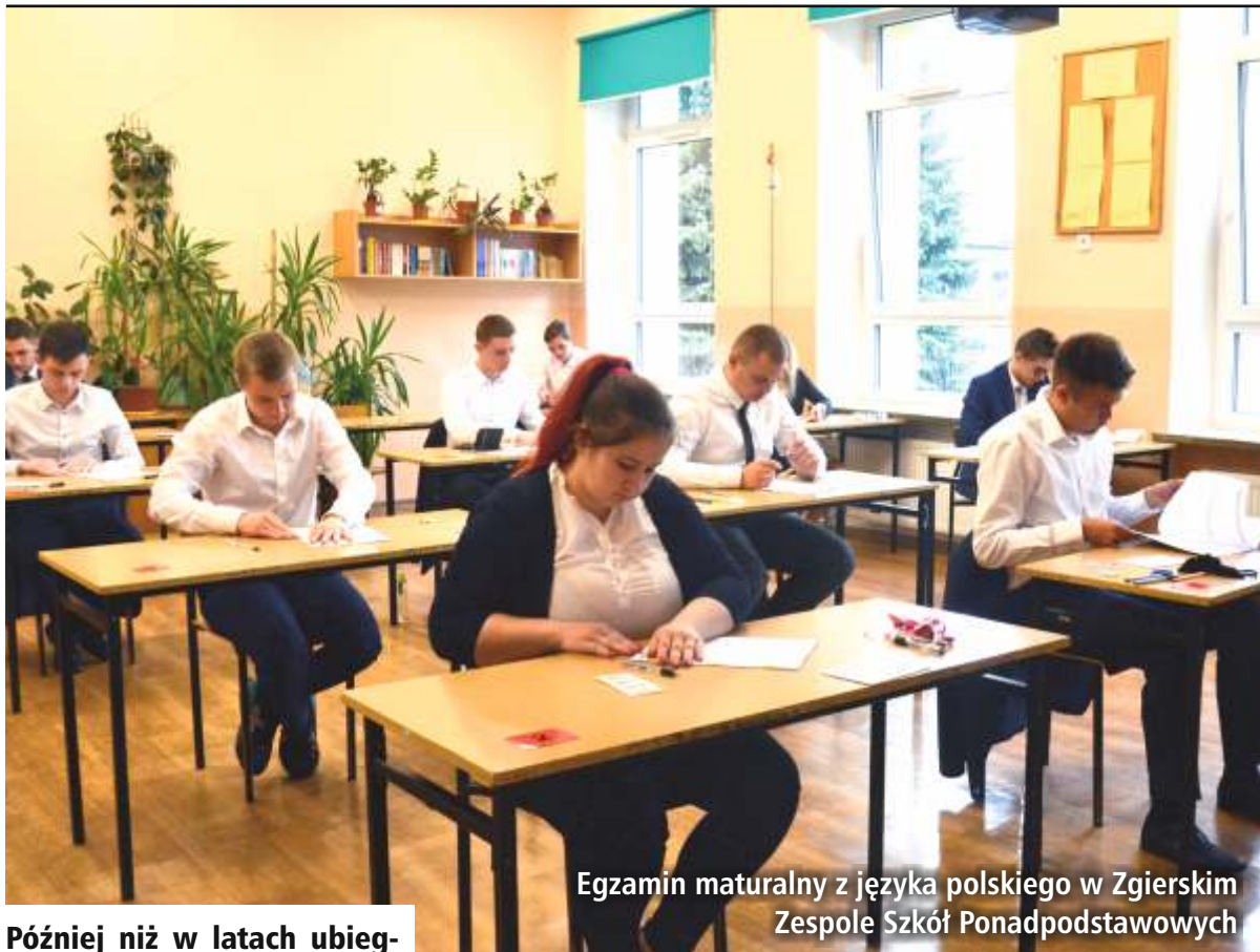
Egzamin maturalny z języka polskiego w Zgierskim Zespole Szkół Ponadpodstawowych

Później niż w latach ubiegłych, bo nie w maju, a w czerwcu ruszył tegoroczny maturalny maraton. Przesunięcie to, a także rezygnację z egzaminów ustnych, wymusiła trwająca epidemia.