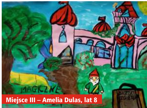
Miejsce III – Amelia Dulas, lat 8