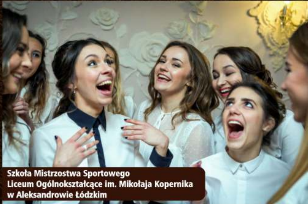
Szkoła Mistrzostwa Sportowego Liceum Ogólnokształcące im. Mikołaja Kopernika w Aleksandrowie Łódzkim

Uczniowie szkół ponadgimna powiatowy samorząd na dług