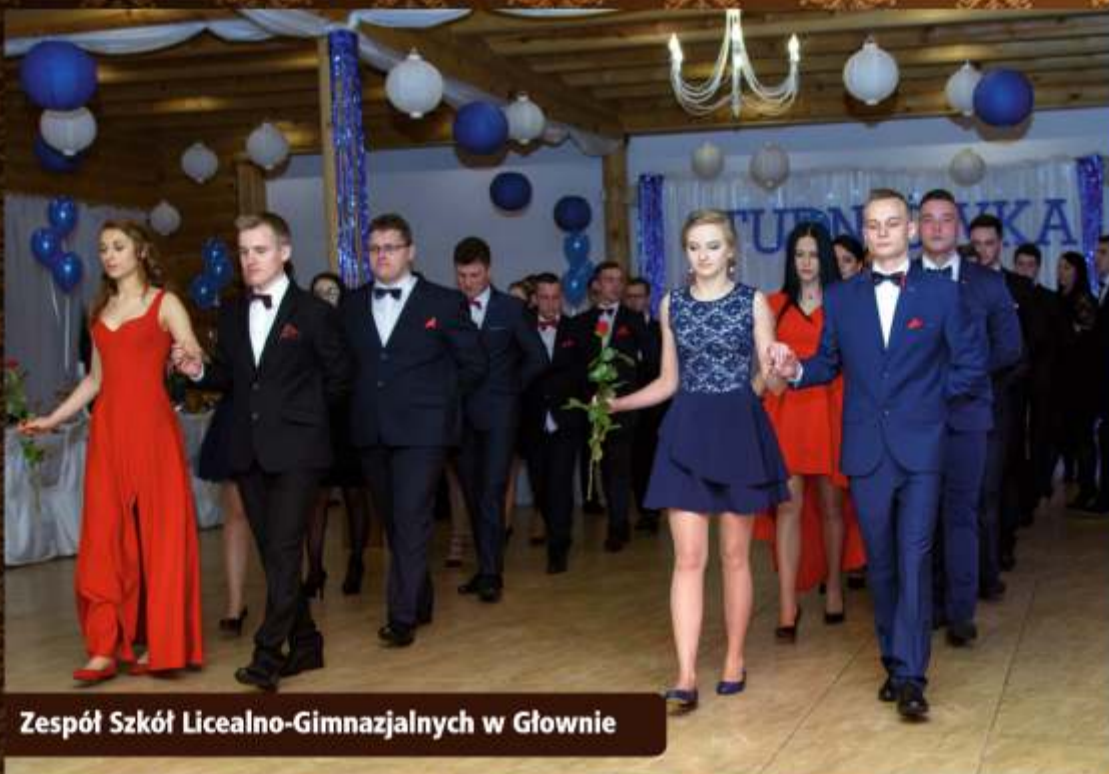
Zespół Szkół Licealno-Gimnazjalnych w Głownie