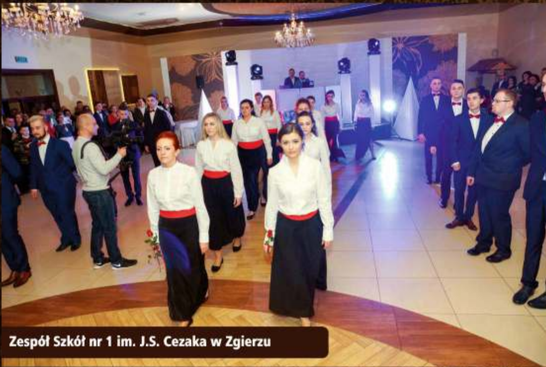
Zespół Szkół nr 1 im. J.S. Cezaka w Zgierzu