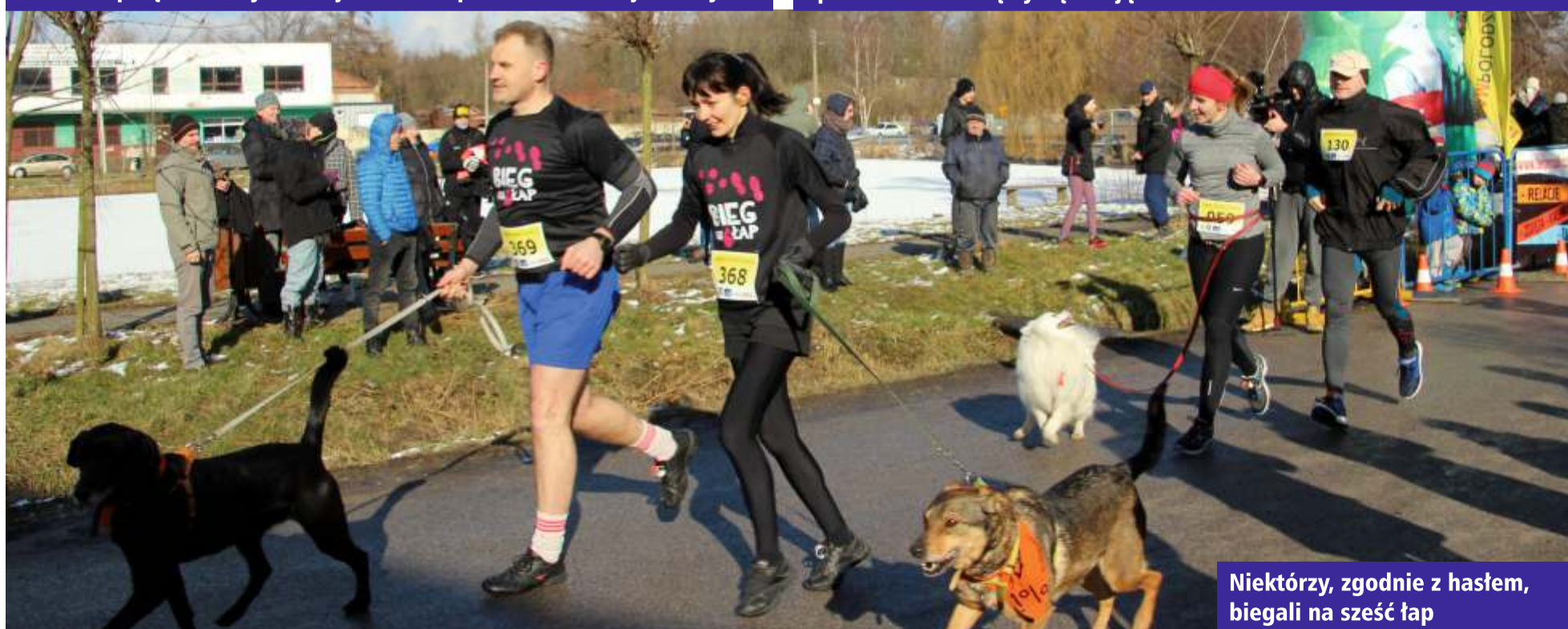
Niektórzy, zgodnie z hasłem, biegali na szczęście łap