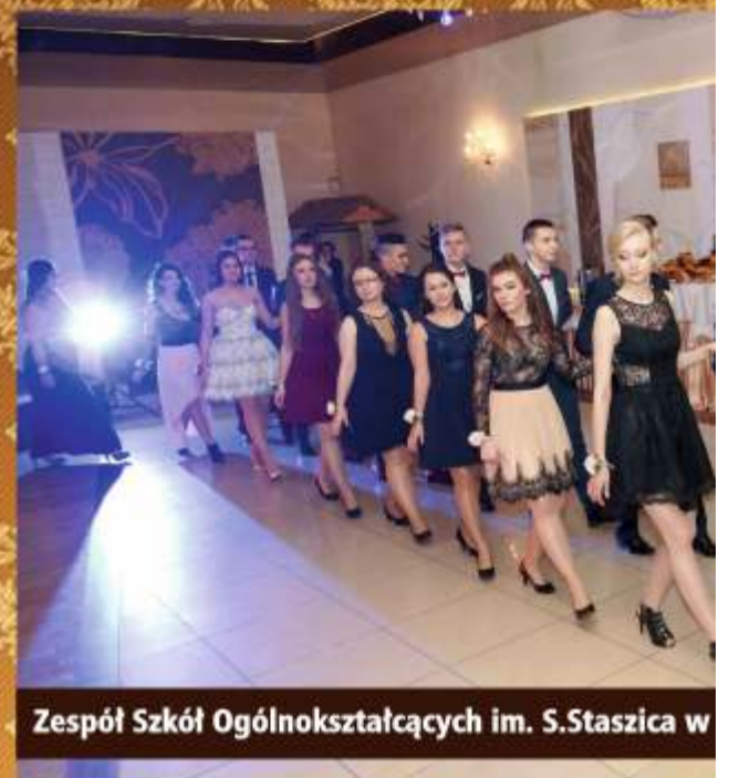
Zespół Szkół Ogólnokształcących im. S.Staszica w