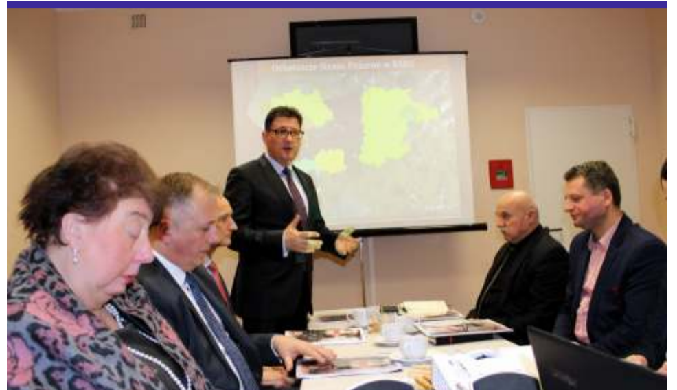
Straż pożarna coraz rzadziej wzywana jest do pożarów, coraz częściej zaś do wypadków drogowych

W 2016 r. na wyposażeniu powiatowej straży przybyło: działko wodno-pianowe, piła do drewna oraz dwie do betonu i stali. – Pamiętajmy, że ubiegły rok był też czasem sfinalizowania termomodernizacji budynku Komendy