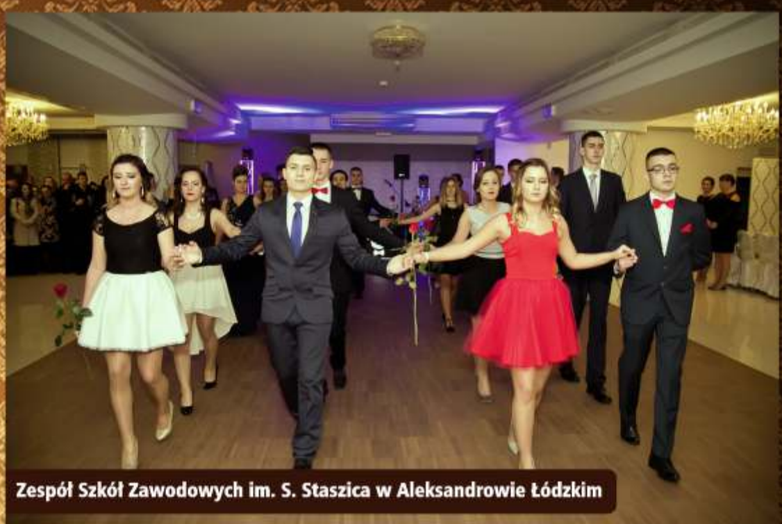
Zespół Szkół Zawodowych im. S. Staszica w Aleksandrowie Łódzkim