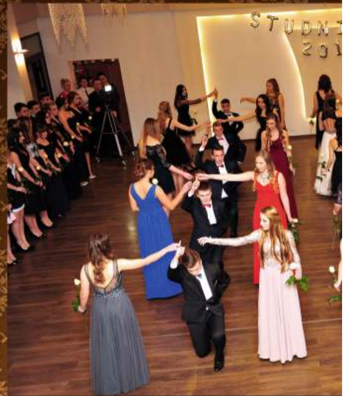
I Liceum Ogólnokształcące im. Stefana Żeromskiego w