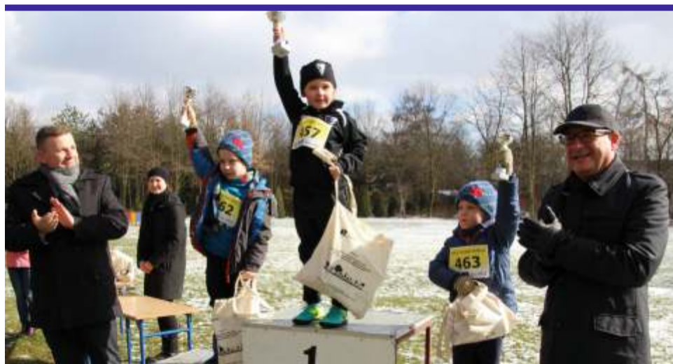
To DOBRE połączenie - rywalizacja i nauka o przeszłości dla najmłodszych