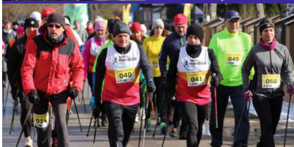
Po raz kolejny pogoda była łaskawa dla uczestników i zawody odbyły się w bardzo dobrych, jak na luty, warunkach