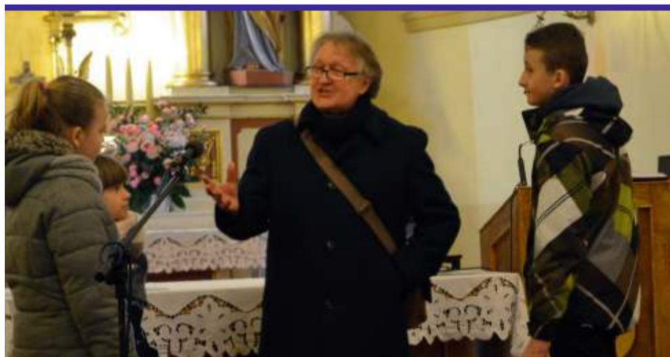
Spektakl okazał się żywą lekcją historii