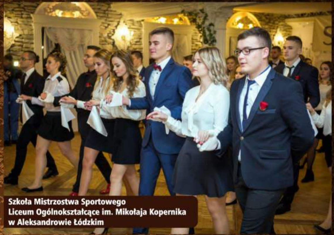
Szkoła Mistrzostwa Sportowego Liceum Ogólnokształcące im. Mikołaja Kopernika w Aleksandrowie Łódzkim