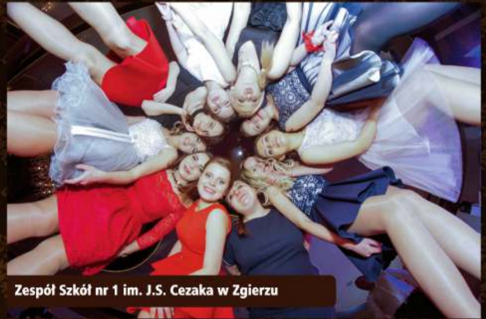
Zespół Szkół nr 1 im. J.S. Cezaka w Zgierzu