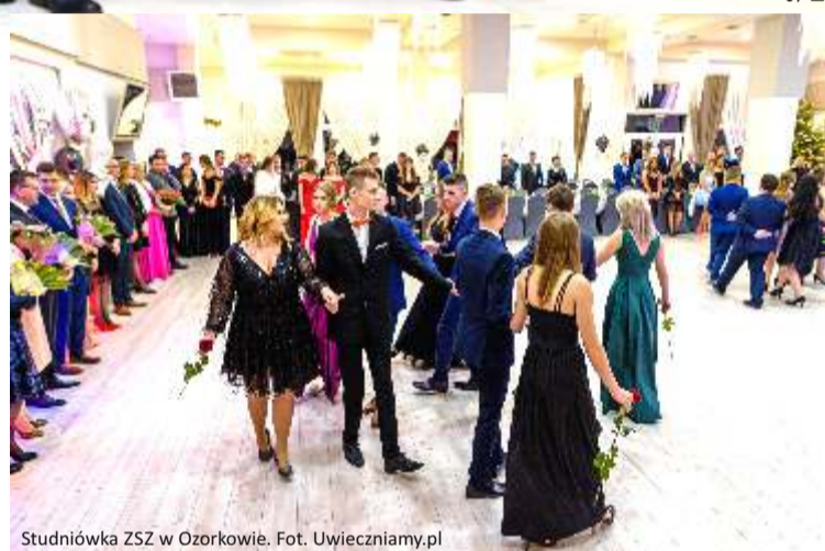
Studniówka ZSZ w Ozorkowie.