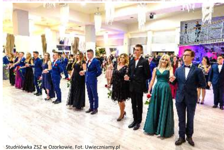
Studniówka ZSZ w Ozorkowie.