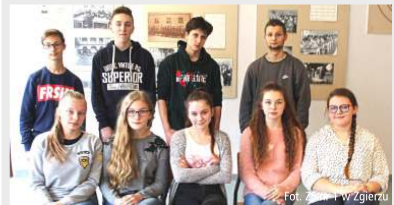
Fot. Z. W. 1 w Zgierzu

Każdy, kto zrealizuje swój projekt do końca marca, zostanie finalistą i otrzyma międzynarodowy certyfikat z zarządzania. Dla najlepszych projektów w Polsce, wyłonionych przez kapitułę złożoną z przedstawicieli biznesu, mediów i organizacji społecznych, przewidziano nagrody i status Złoty Wilków. [EWR]