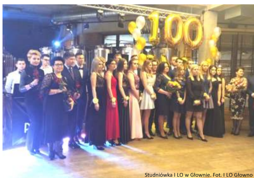
Studniówka I LO w Głownie.

W dniach 10-11 stycznia na studniówkach bawili się uczniowie klas maturalnych z: Zespołu Szkół Zawodowych w Ozorkowie, I Liceum Ogólnokształcącego w Głownie, I Liceum Ogólnokształcącego im. Stefana Żeromskiego w Ozorkowie i Zespołu Szkół nr 1 im. Jakuba Stefana Cezaka w Zgierzu.