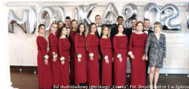
Bal studniówkowy zgierskiego „Cezaka”.