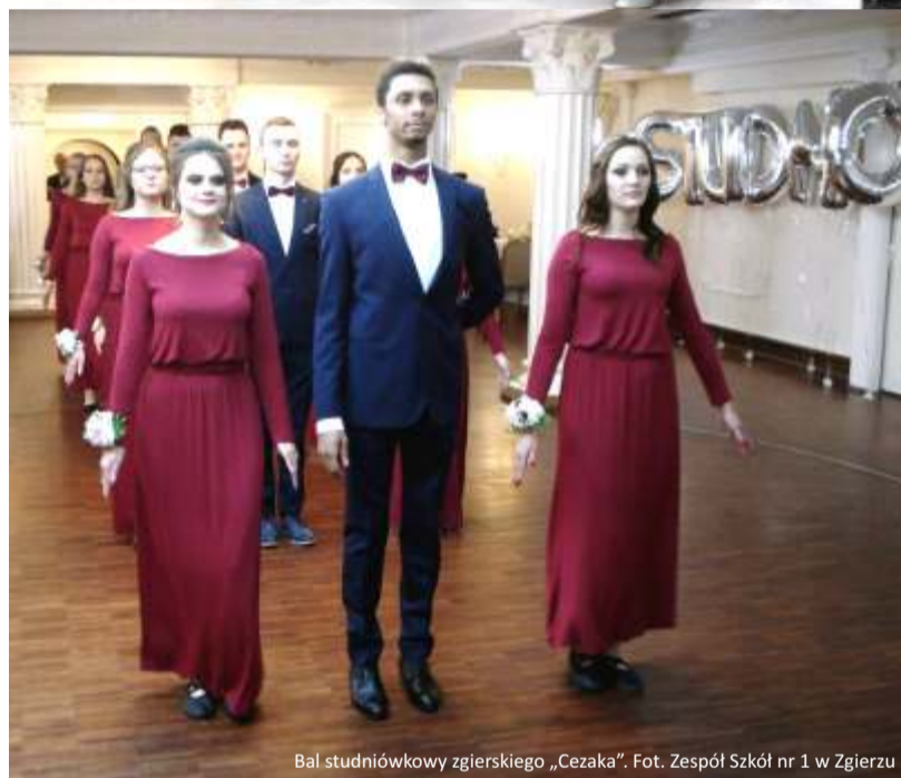
Bal studniówkowy zgierskiego „Cezaka”.

Studniówka I LO w Ozorkowie.