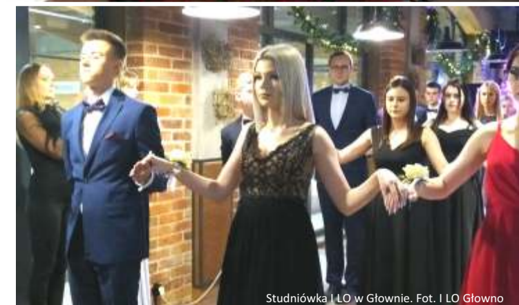
Studniówka I LO w Głownie.