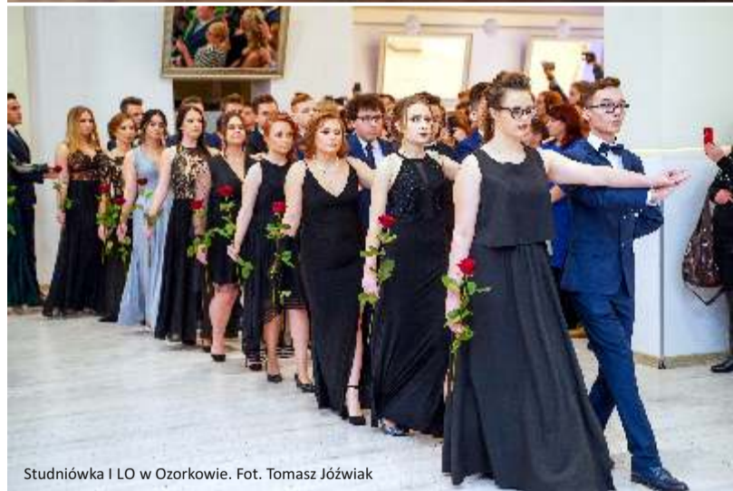
Studniówka I LO w Ozorkowie.