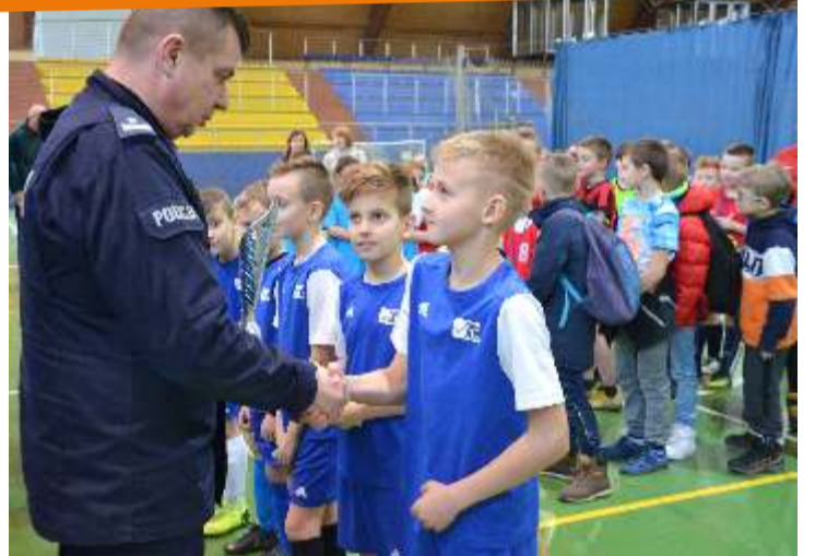
Zwycięzcy turnieju, czyli młodzi piłkarze ze Szkoły Podstawowej nr 6 w Zgierzu

W ceremonii nagrodzenia zwycięzców oraz laureatów miejsc II i III wzięli udział m.in. starosta zgierski Bogdan Jarota, który wręczył puchar wicemistrzom, a także udekorował drużyny medalami. [EWR]