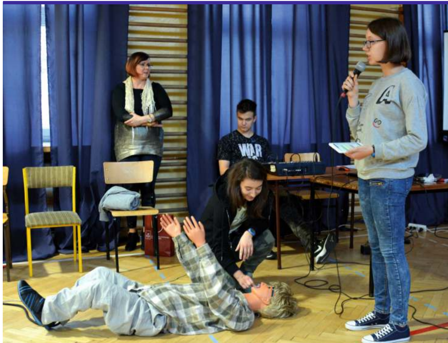
Dzięki Walentemu można zobaczyć jak przebiega atak padaczki oraz jak zachować się i pomóc choremu