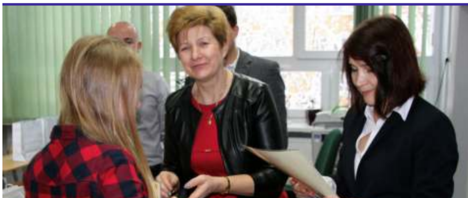
Fundatorem nagród dla uczestników konkursu był także powiatowy samorząd

Nadal istnieje wiele nieprawdziwych mitów na temat HIV i AIDS. To właśnie niewiedza każe nam bać się osób zakażonych, a tak naprawdę, przy zachowaniu kilku podstawowych zasad, jesteśmy bezpieczni żyjąc w otoczeniu chorego. Pamiętajmy, że nie zarazimy się przez podanie ręki, a nawet pocałunek. Istnieją jedynie trzy drogi zakażenia HIV: kontakty seksualne bez zabezpieczenia, przedostanie się skażonej krwi do naszego krwiobiegu i podczas ciąży, porodu i karmienia piersią matka może zarazić dziecko. [MT]