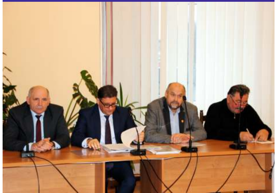
Podczas kolejnej debaty na temat zgierskich składowisk, uczestnicy próbowali opracować plan działania, aby w najbliższym czasie podejmować kolejne kroki zmierzające do rozwiązania trudnej, dla mieszkańców Zgierza i okolic, sprawy niebezpiecznych składowisk odpadów

Uczestnicy posiedzenia komisji zapoznali się także z opinią Wojewódzkiego Inspektora Ochrony Środowiska na temat stanu, w jakim znajdują się zgierskie składowiska. Poinformował, także że WIOŚ wystąpił do sądu o zmianę likwidatora spółki Eko-Boruta. Dyrektor Departamentu Rolnictwa i Ochrony Środowiska Urzędu Marszałkowskiego w Łodzi przyznał, że według niego, w sytuacji kiedy postępowanie egzekucyjne prowadzone przez Urząd Marszałkowski okaże się bezskuteczne, kompetencje w tym zakresie leżą po stronie władz Zgierza. Wiceprezydent potwierdził chęć rekultywacji składowisk przez miasto, pod warunkiem posiadania umocowania prawnego. [MT]