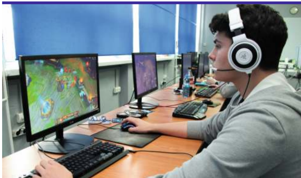
E-sport staje się coraz bardziej popularną dyscypliną, nic dziwnego, że również uczniowie „Cezaka” postanowili spróbować swoich sił w sporcie elektronicznym