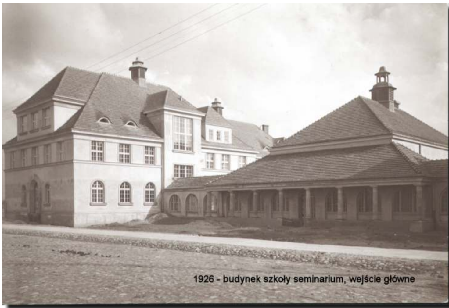
1926 - budynek szkoły seminarium, wejście główne

Mając taką nadzieję, pragniemy uczcić pamięć o tych, którzy w znaczący sposób wpłynęli na kształt i jakość lokalnej oświaty. Liczymy również na to, że w tych dniach dołączą do nas sympatycy edukacji i razem z nami będą celebrować mijające 100-lecie tej wyjątkowej placówki.