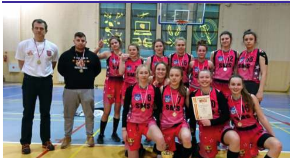
Aleksandrowianki będą również gospodarzem finałowego turnieju Mistrzostw Polski. Z elitą polskiej koszykówki szkolnej uczennice „Kopernika” zmierzą się w dniach 5-8 czerwca 2018 r