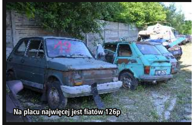
Na placu najwięcej jest fiatów 126p

zmierzające do odbioru pojazdu przez właściciela, a w przypadku gdy właściciel nie odbiera pojazdu, wniesić do sądu powszechnego wniosek o orzeczenie przepadku pojazdu na rzecz powiatu. Wobec powyższego, dopiero uzyskanie prawomocnego orzeczenia o przepadku pojazdu daje Powiatowi Zgierskiemu prawo do dysponowania nim, w tym do ewentualnej sprzedaży. Wszelkie informacje o sprzedaży pojazdów stanowiących własność Powiatu Zgierskiego publikowane są na stronie internetowej Biuletynu Informacji Publicznej Powiatu Zgierskiego w zakładce „Finanse i majątek Powiatu”. Wskazana strona internetowa jest jedynym źródłem informacji o możliwości nabycia mienia powiatu. [EWR]