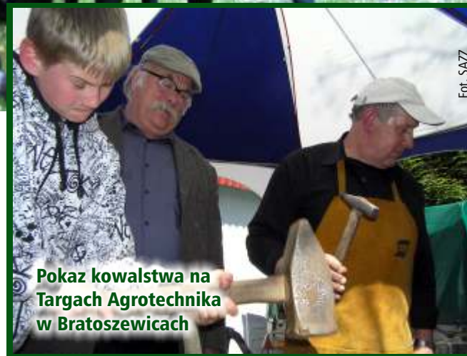
Pokaz kowalstwa na Targach Agrotechnika w Bratoszewicach

Członkowie Stowarzyszenia, na czele z prezesem, byli też pomysłodawcami i społecznymi realizatorami budowy tablicy informacyjnej i małej architektury w sąsiedztwie źródeł rzeki