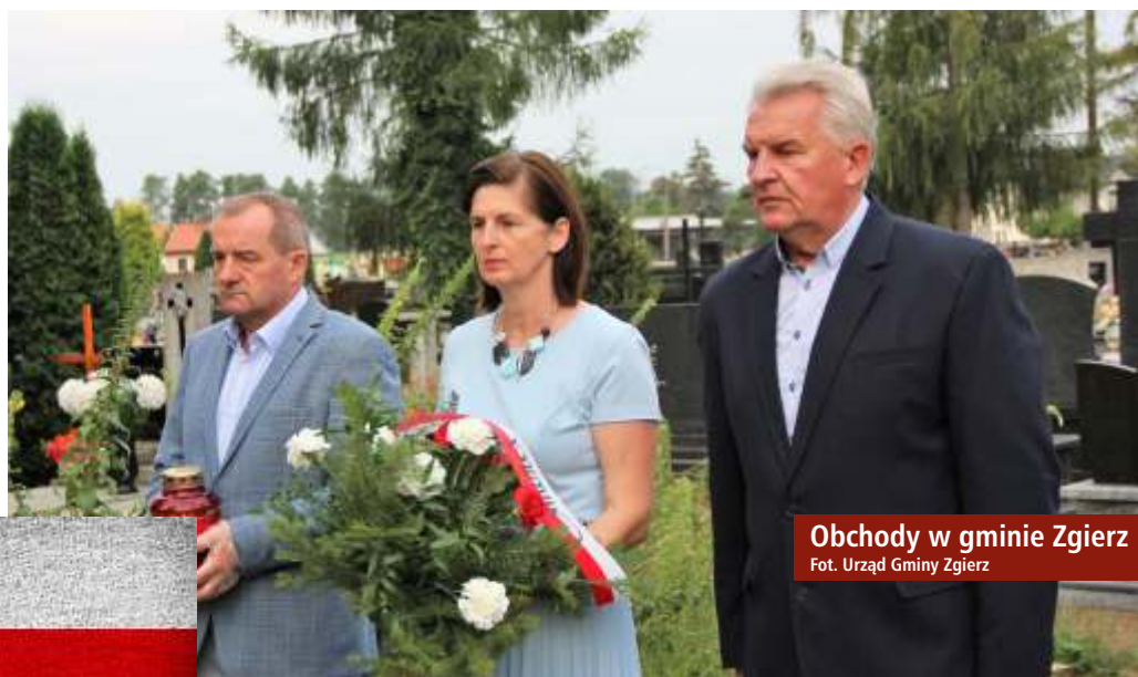
Obchody w gminie Zgierz