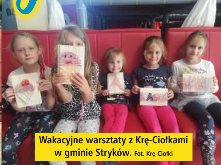
Wakacyjne warsztaty z Krę-Ciołkami w gminie Stryków.