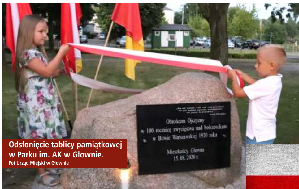
Odświadczenie tablicy pamiątkowej w Parku im. AK w Głownie.

[LR na podst. info. Urzędu Miejskiego w Głownie/Urzędu Gminy Zgierz/Urzędu Miasta Zgierza]