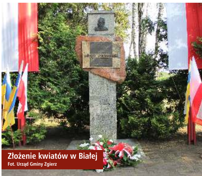
Złożenie kwiatów w Białej

Z okazji 100. rocznicy Bitwy Warszawskiej przygotowaliśmy internetowy quiz historyczny dotyczący wydarzeń i postaci wojny polsko-bolszewickiej. 15 sierpnia ogłosiliśmy go na profilu Powiat Zgierski na Facebooku.