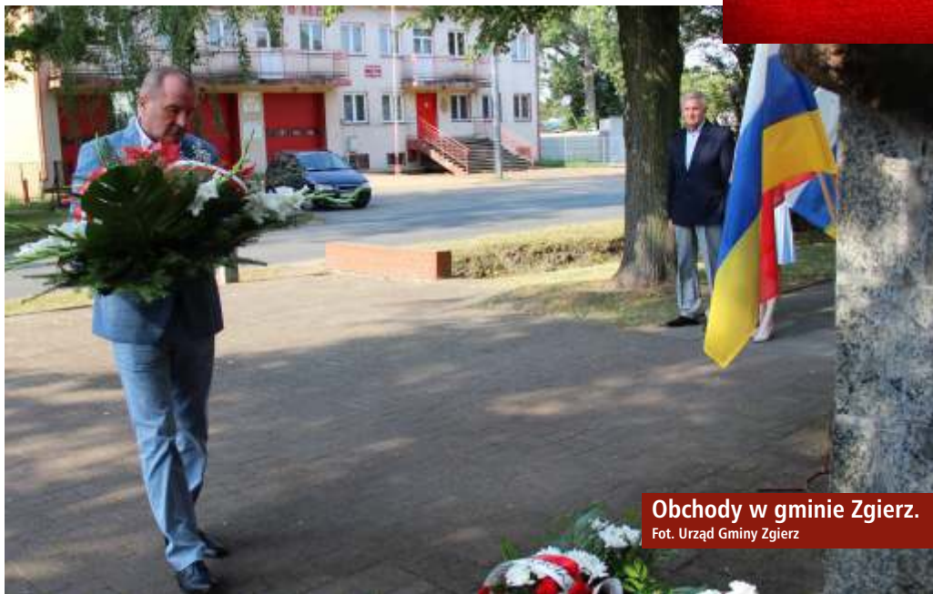
Obchody w gminie Zgierz.