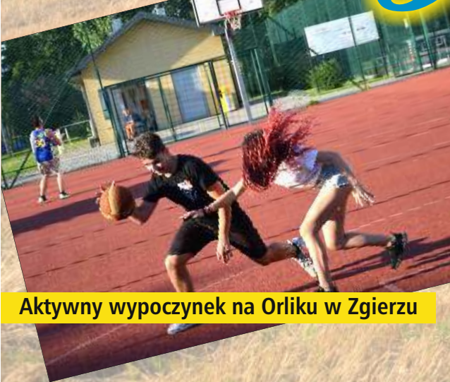
Aktywny wypoczynek na Orliku w Zgierzu