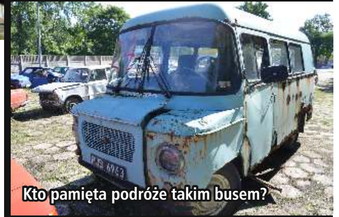
Kto pamięta podróżę takim busem?

Szanowni Państwo, po naszej internetowej publikacji w tej sprawie, otrzymaliśmy szereg pytań dotyczących możliwości zakupu pojazdów przechowywanych na placu przy ul. Konstanyńskiej. W odpowiedzi informujemy, że nie są one przeznaczone do sprzedaży. Pojazdy te zostały usunięte z dróg na podstawie ustawy Prawo o ruchu drogowym, zgodnie z którą Starosta Zgierski ma obowiązek przeprowadzić postępowanie