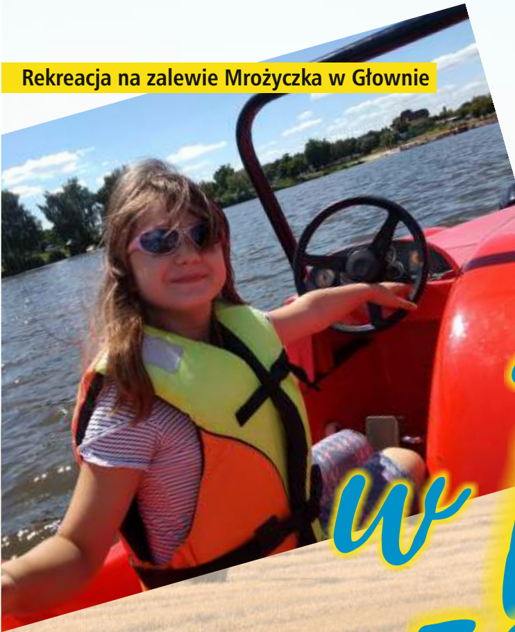
Rekreacja na zalewie Mrożyczka w Głownie