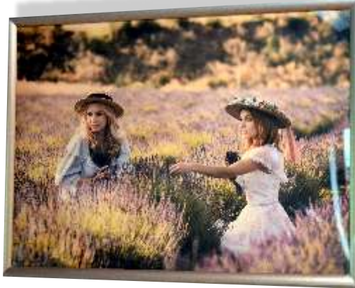
Wystawa „Popatrz na mnie” Artura Barczyńskiego

Na wystawie można było podziwiać zarówno prace kojarzące się z kobiecą siłą, jak i delikatnością. Szczególnie ciekawie prezentowały się te zdjęcia, które wydawały się igrzać z czasem, ukazując współczesne dziewczęta w stylizacjach dziewiętnastowiecznych - koronkowych sukniach, kapeluszkach, wśród wrzosów... Wszystkim zainteresowanym twórczością artysty polecamy jego stronę internetową www.artur.photography .