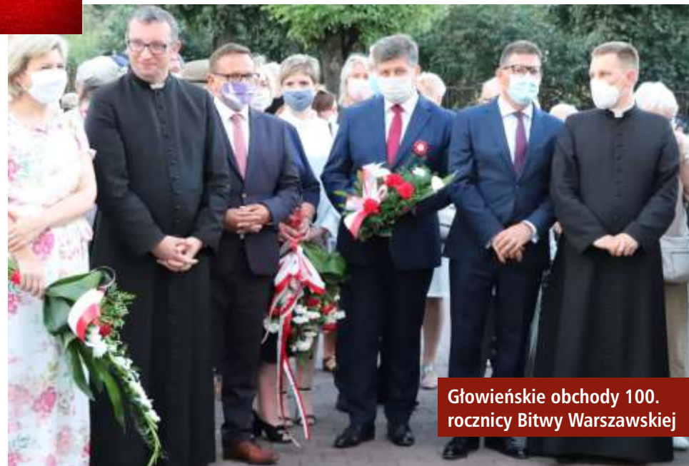
Głowieńskie obchody 100. rocznicy Bitwy Warszawskiej