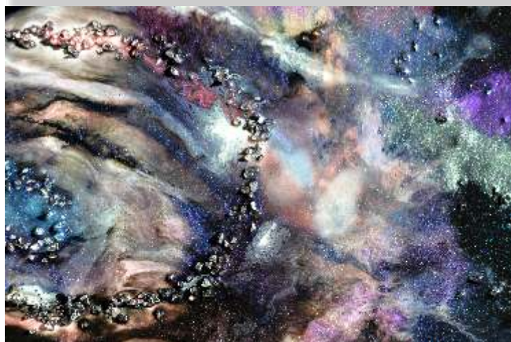
Wystawa „Skrzydła fantazji”. Praca Moniki Bileckiej