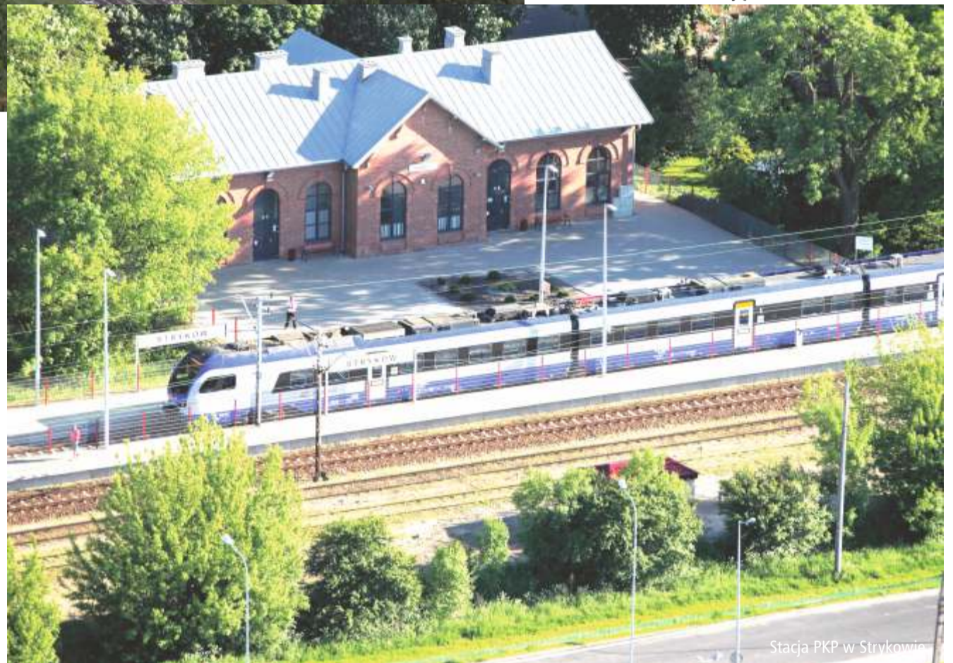
Stacja PKP w Strykowie

Działania w zakresie wykorzystania potencjału lokalizacyjnego przełożyły się na rosnący z roku na rok budżet Gminy Stryków. W 2020 r. osiągnął on rekordowy poziom 102.426.469 zł. Dokładając do tego działania w zakresie pozyskiwania środków