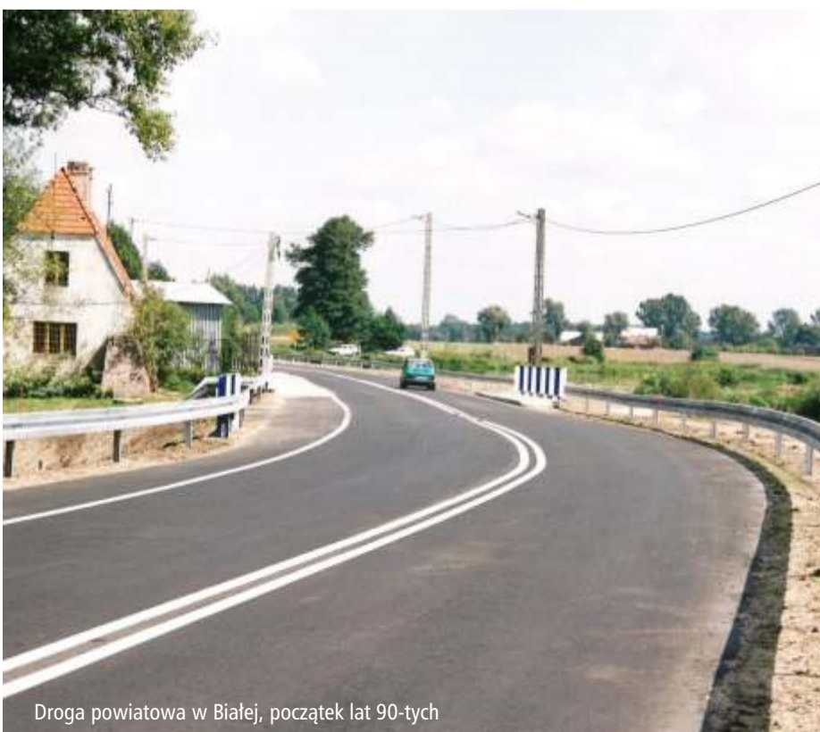
Droga powiatowa w Białej, początek lat 90-tych