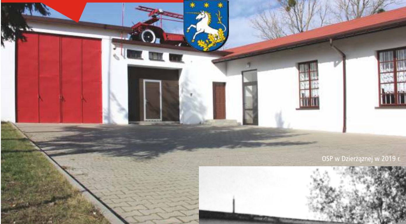
OSP w Dzierżąnej w 2019 r.