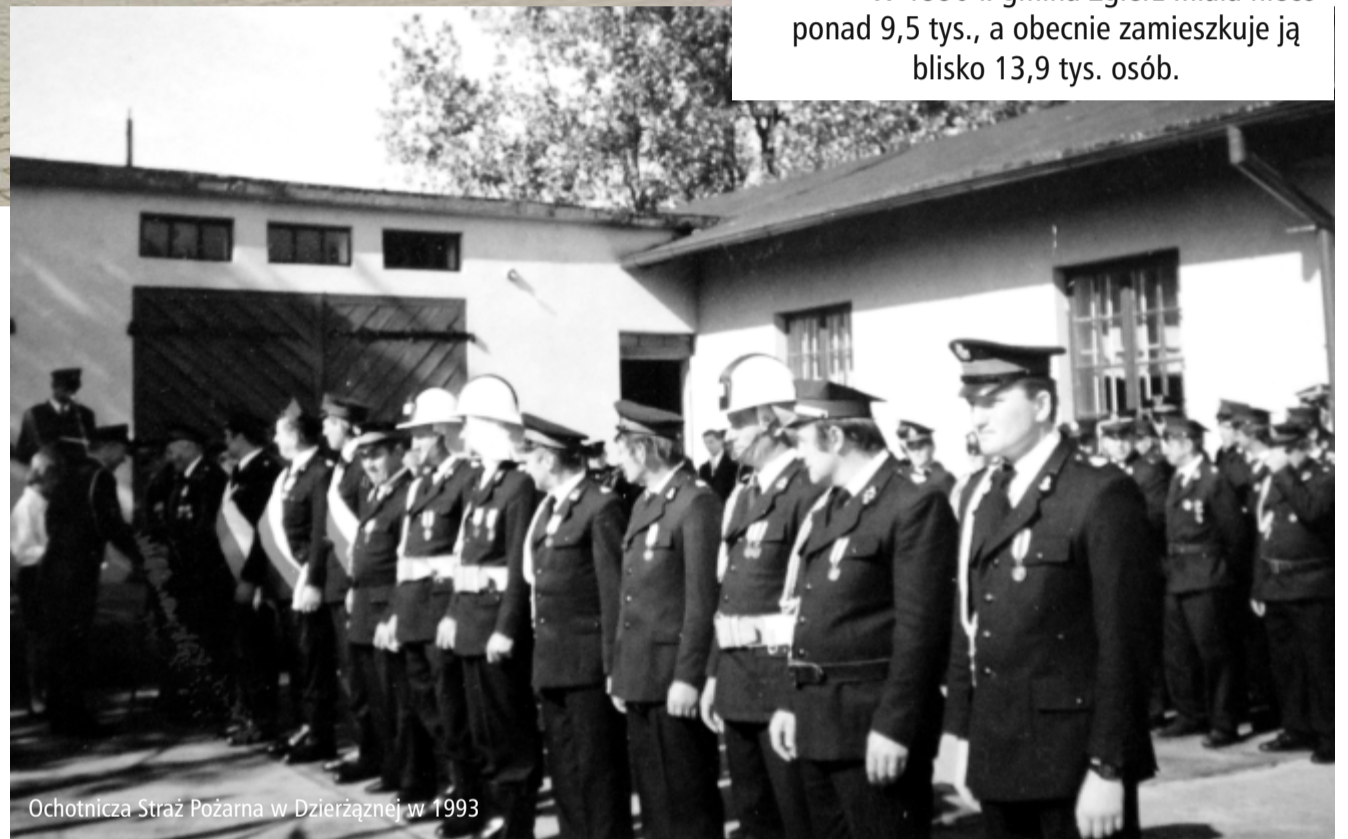
Ochotnicza Straż Pożarna w Dzierżąnej w 1993