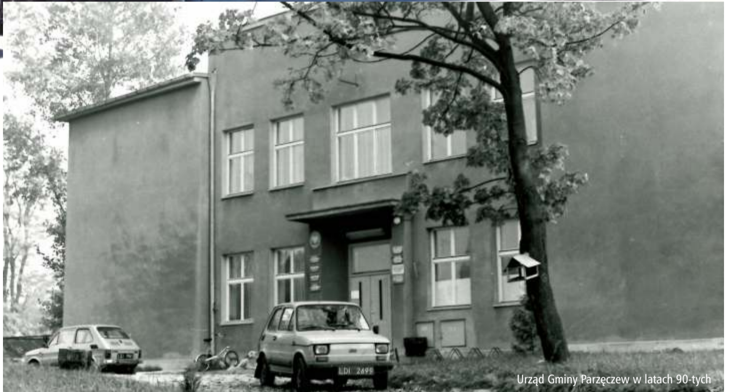
Urząd Gminy Parzęczew w latach 90-tych

Obecnie gmina Parzęczew jest gminą wiejską. Na jej terenie funkcjonuje 5 jednostek Ochotniczej Straży Pożarnej, samorząd prowadzi dwie szkoły podstawowe – w Parzęczewie i Chociszewie. W Parzęczewie działa Forum Inicjatyw Twórczych i Gminna Biblioteka Publiczna.