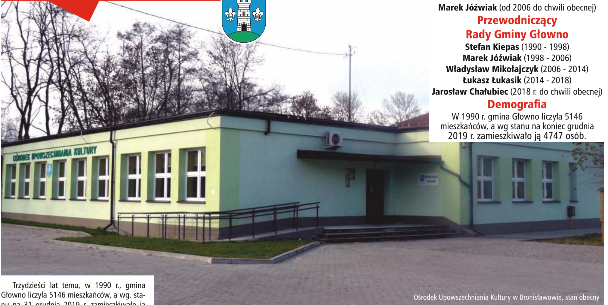
Ośrodek Upowszechniania Kultury w Bronisławowie, stan obecny

Trzydzieści lat temu, w 1990 r., gmina Głowno liczyła 5146 mieszkańców, a wg. stanu na 31 grudnia 2019 r. zamieszkiwało ją 4747 osób. Jest to gmina wiejska, w znacznym stopniu rolnicza, rozciągająca się na zachód i północ od Głowna.