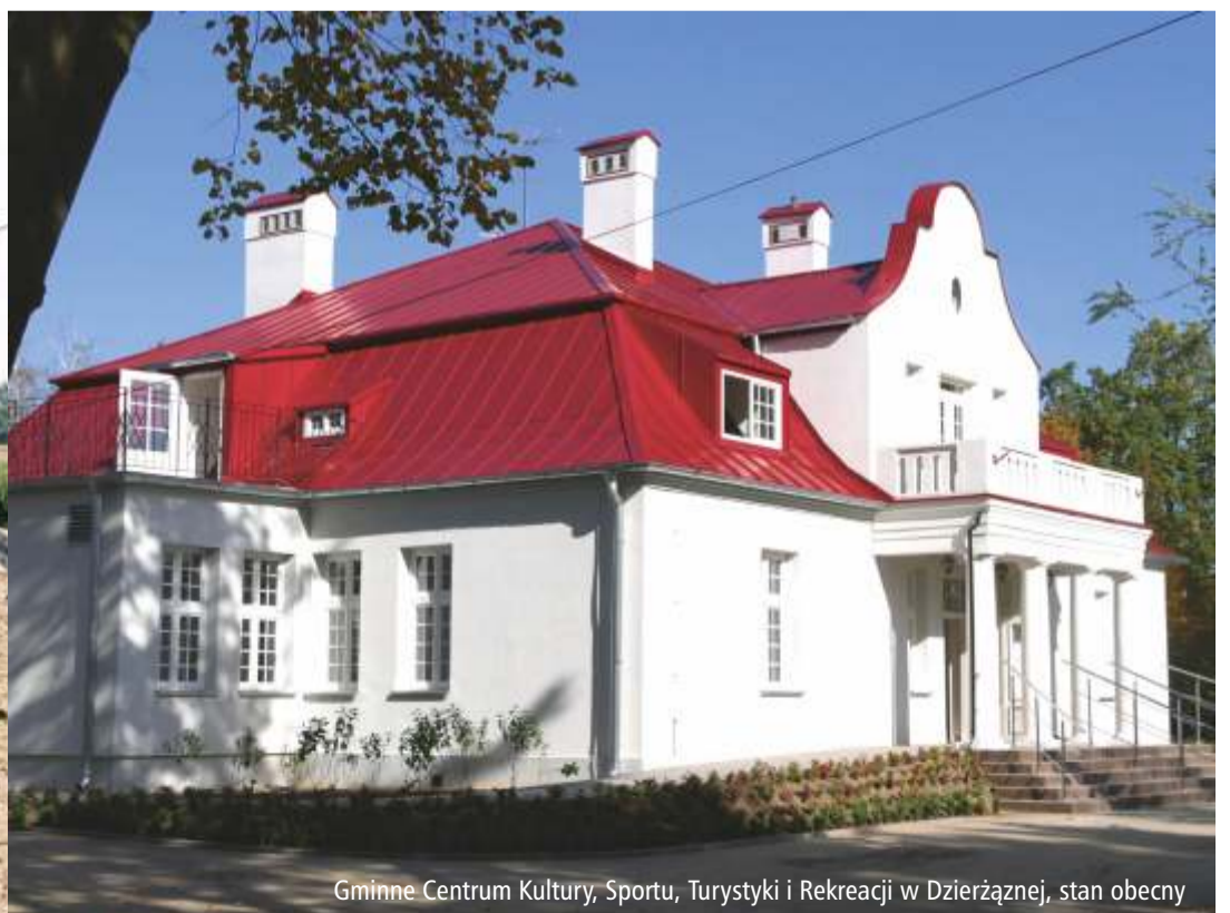
Gminne Centrum Kultury, Sportu, Turystyki i Rekreacji w Dzierżąnej, stan obecny