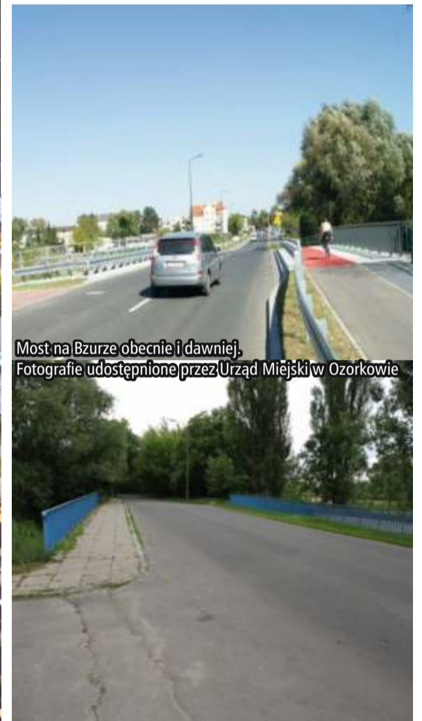
Most na Bzurze obecnie i dawniej.