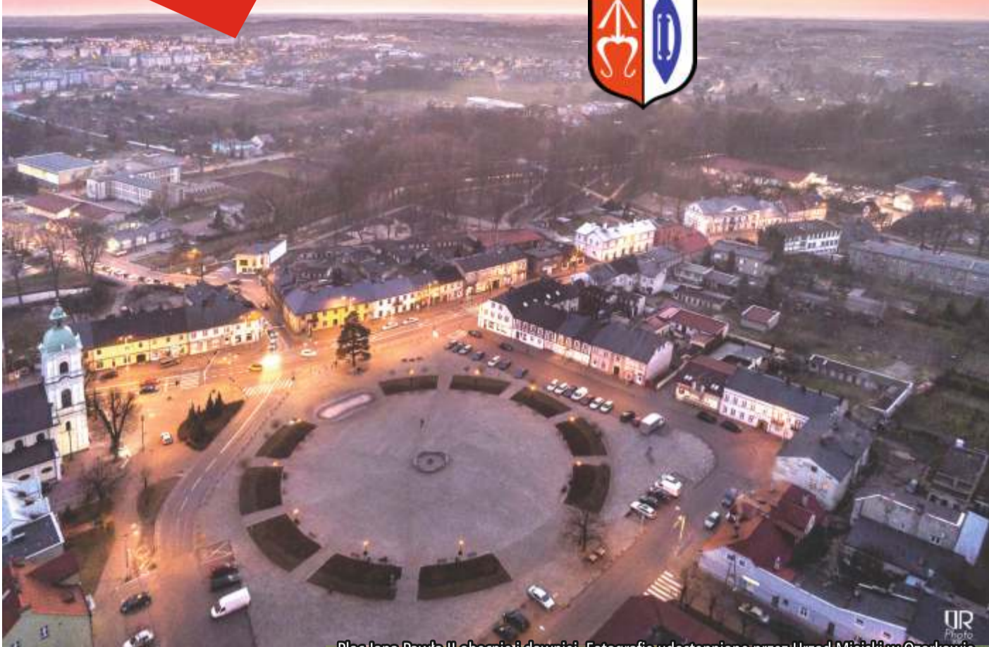
Plac Jana Pawła II obecnie i dawniej.

W latach 1980-1990 głównym przemysłem miasta Ozorkowa był przemysł włókienniczy i odzieżowy. Podobnie jak w innych ośrodkach włókiennictwa, również w Ozorkowie nastąpił regres rozwoju tego przemysłu i główne zakłady, stanowiące podstawowy filar zatrudnienia, przestały istnieć. Było to jedno z najpoważniejszych wyzwań, przed jakimi stanął samorząd na początku lat 90-tych ubiegłego wieku.