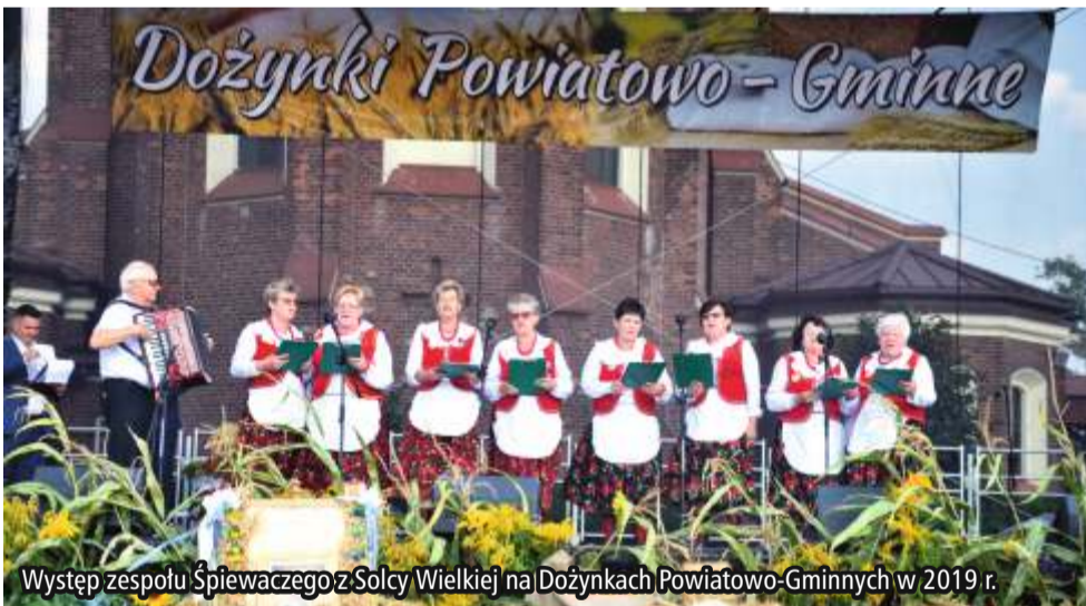
Występ zespołu Śpiewaczego z Solcy Wielkiej na Dożynkach Powiatowo-Gminnych w 2019 r.