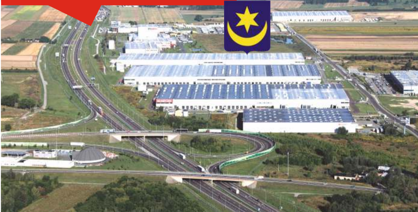
SEGRO Logistics Park Stryków

Z dostępnych źródeł statystycznych wynika, że na przestrzeni ostatnich 25 lat liczba mieszkańców Gminy Stryków wzrosła, ale nieznacznie. O ile na koniec 1995 r. wynosiła ona 11.902 osoby, to na koniec 2019 r. było to 12.421 osób.