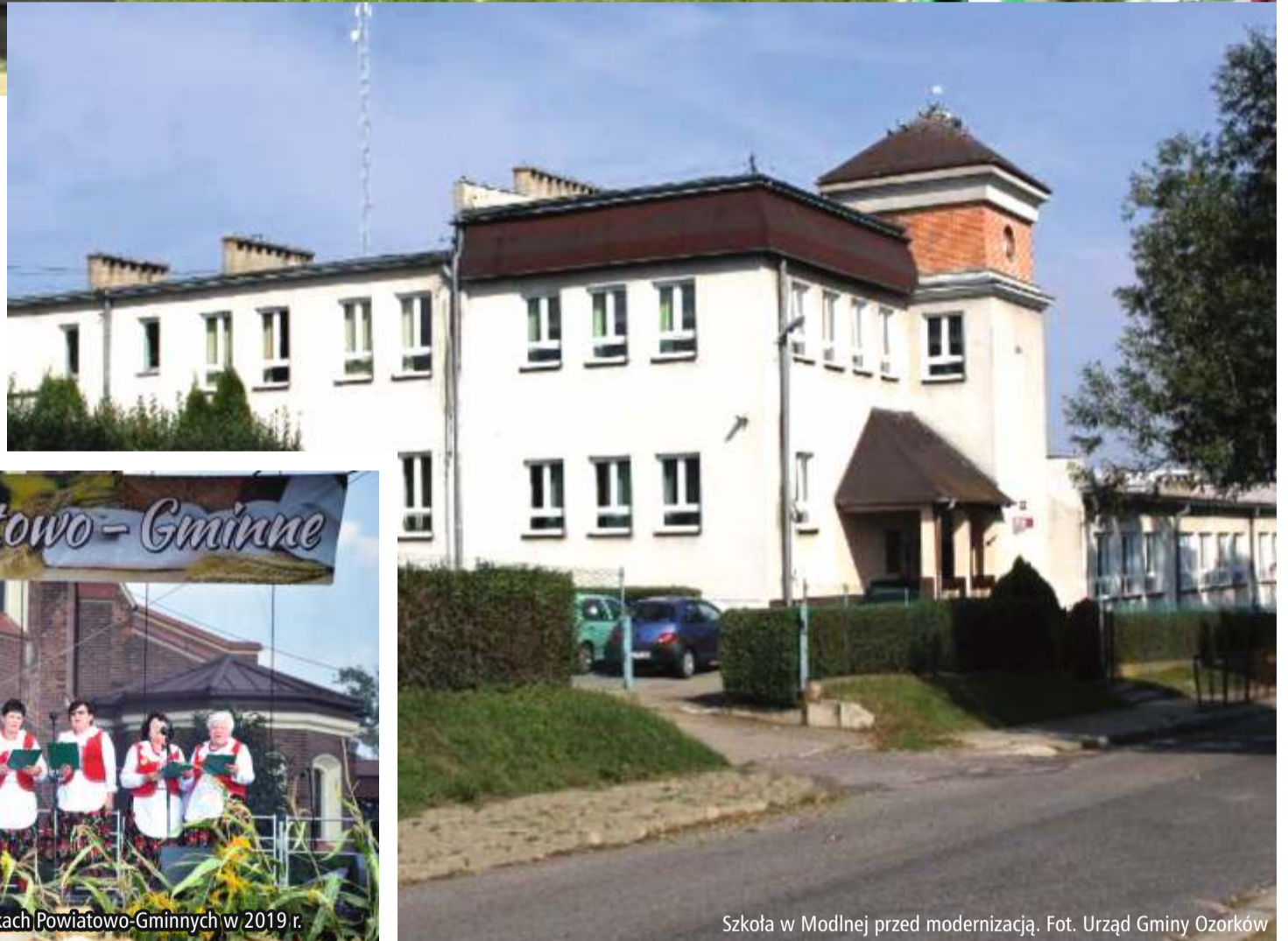
Szkoła w Modlnej przed modernizacją.

30 lat temu, w 1990 r., liczba mieszkańców gminy Ozorków wynosiła 5166 osób, a na dzień 31 grudnia 2019 r. zamieszkiwało ją 6928 osób. Jest to rolnicza gmina, położona w północno-zachodniej części województwa łódzkiego, w dolinie rzeki Bzury, sąsiadująca z miastem Ozorków. Gmina Ozorków jest organem prowadzącym dla szkół podstawowych w Leśmierzu, Modlnej i Solcy Wielkiej. Na jej terenie funkcjonują cztery jednostki Ochotniczej Straży Pożarnej. Prężnie działa Gminny Ośrodek Kultury w Leśmierzu.