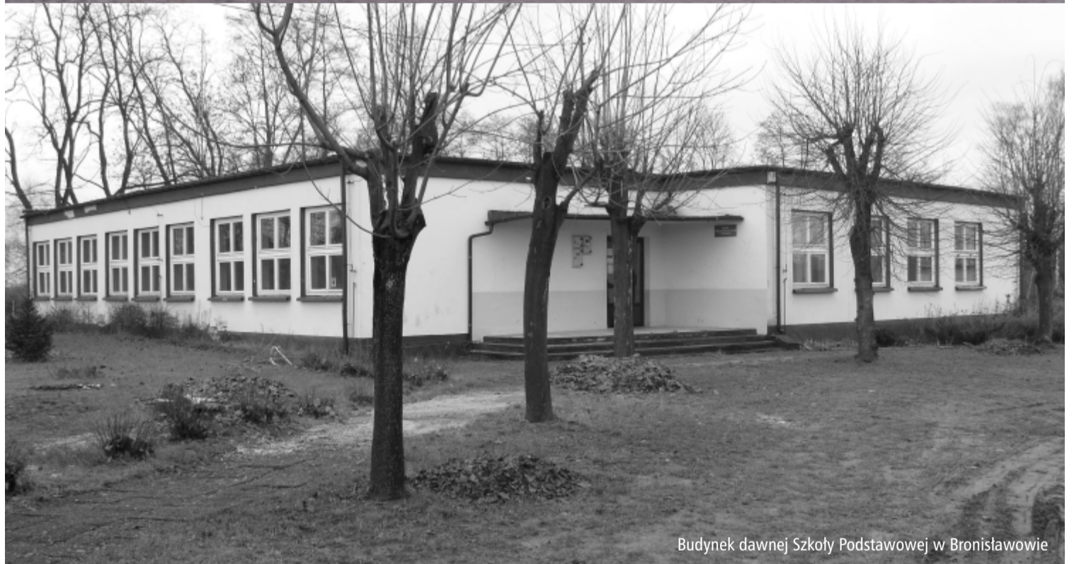
Budynek dawnej Szkoły Podstawowej w Bronisławowie