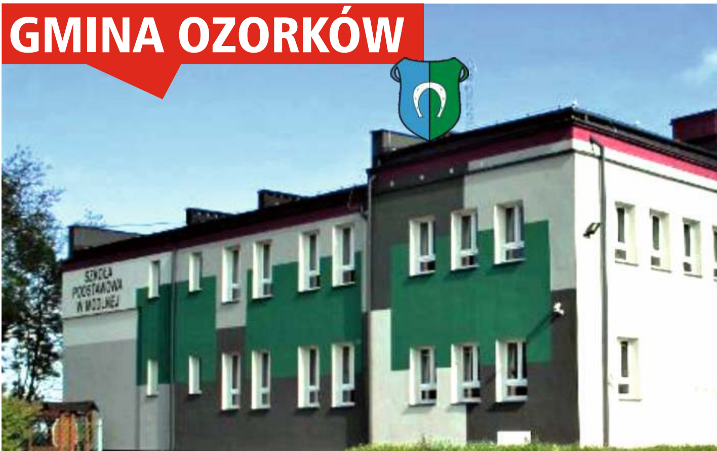
Szkoła w Modlnej po modernizacji.

30 lat temu, w 1990 r., liczba mieszkańców gminy Ozorków wynosiła 5166 osób, a na dzień 31 grudnia 2019 r. zamieszkiwało ją 6928 osób. Jest to rolnicza gmina, położona w północno-zachodniej części województwa łódzkiego, w dolinie rzeki Bzury, sąsiadująca z miastem Ozorków. Gmina Ozorków jest organem prowadzącym dla szkół podstawowych w Leśmierzu, Modlnej i Solcy Wielkiej. Na jej terenie funkcjonują cztery jednostki Ochotniczej Straży Pożarnej. Prężnie działa Gminny Ośrodek Kultury w Leśmierzu.