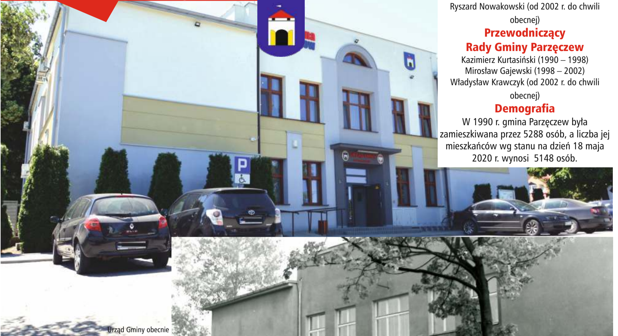
Urząd Gminy obecnie

Gmina Parzęczew w roku 1990 była zamieszkiwana przez 5.288 osób, a liczba jej mieszkańców wg stanu na dzień 18 maja 2020 r. wynosi 5.148 osób.