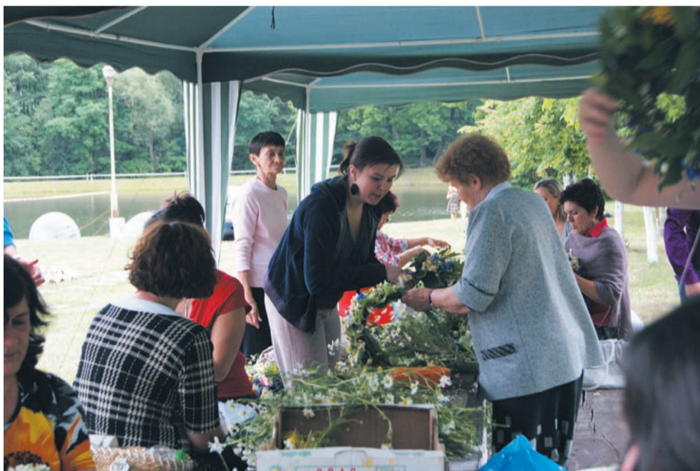
Mało kto wie, że Noc Świętojańska w Dierzążnej też jest przykładem realizacji projektu unijnego

„PRYM” (mający swoją siedzibę w Parzęczewie) wydał już ponad 615 tys. zł, realizując różnorodne inwestycje, w tym remonty wiejskich świetlic w gminach: