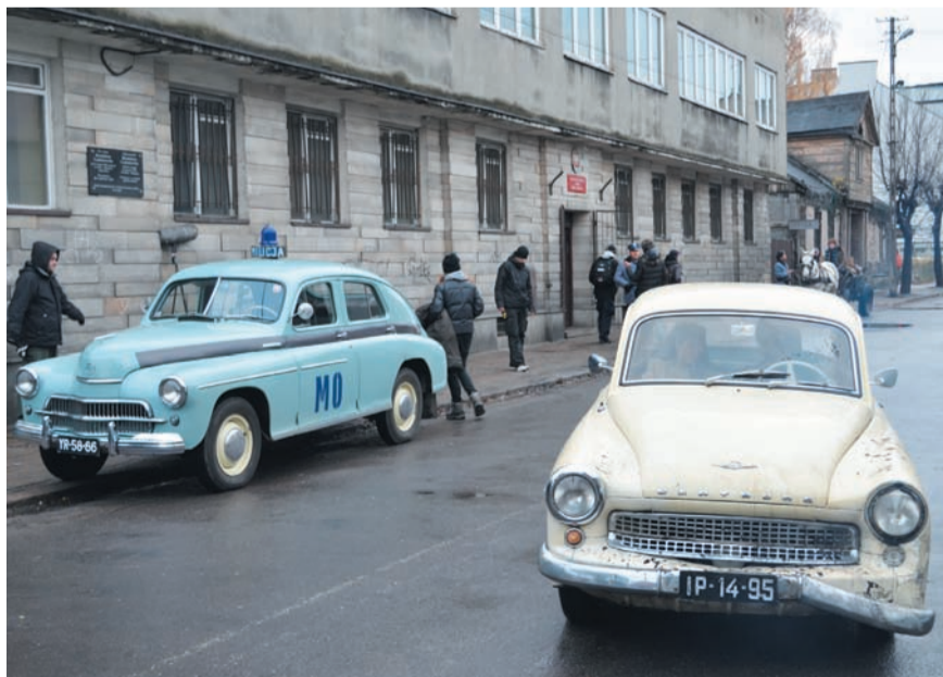
Ponieważ akcja filmu rozgrywa się pod koniec lat 60-tych ubiegłego wieku, wszystkie rekwizyty muszą pasować do tamtych realiów

W zeszłym tygodniu w Zgierzu ekipa filmowa kręciła ujęcia do nowego filmu Pawła Pawlikowskiego pt. „Siostra miłosierdzia”. Starostwo Powiatowe w Zgierzu przyczyniło się do tego, że zgierskie plenery zaistniały w filmie, który trafi do kin w przyszłym roku.