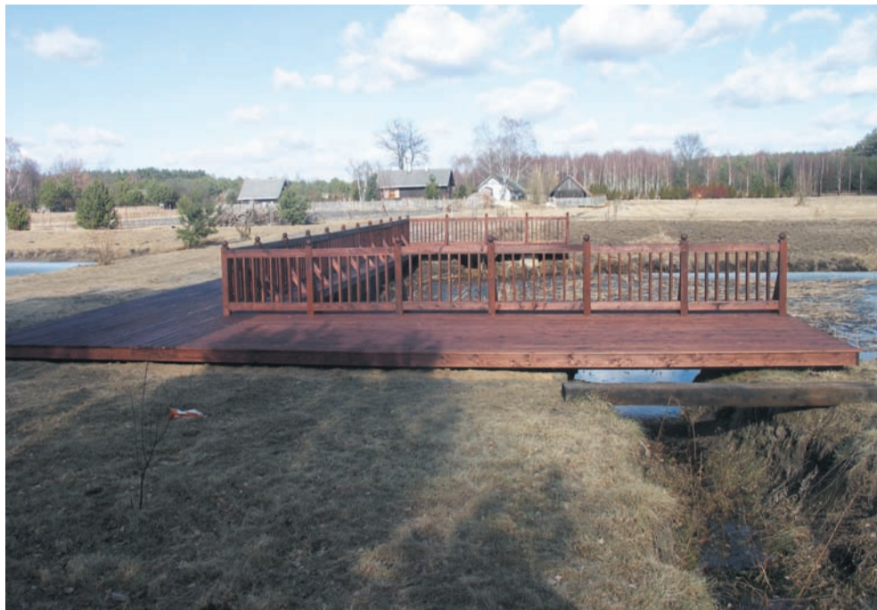
Dzięki „PRYM-owi” mieszkańcy uprawiający turystykę pieszą, rowerową i konną zyskali nową atrakcję – Synowcówkę w Tkaczewskiej Górze

Parzęczew (we wsi Orła, Opole i w samym Parzęczewie), Aleksandrów Łódzki (w Jastrzębiu Górnym) i Zgierz (w Jedliczu A); powstanie Centrum Kultury w Ustroniu, remont i wyposażenie dwóch bibliotek w gminie Parzęczew. Oprócz inwestowania w infrastrukturę kulturalno-oświatową postawiono także na wydarzenia kulturalne, i tak