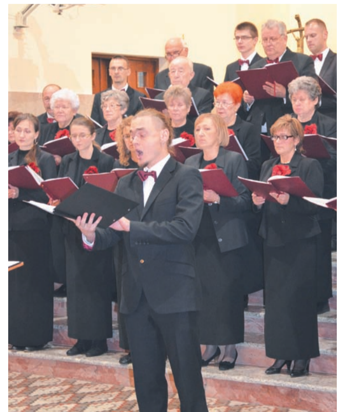
Artyści-amatorzy dali w pełni profesjonalny koncert

Należy podkreślić, że przez lata działalności zespół został uhonorowany wieloma nagrodami w kraju i zagranicą oraz odznaczeniami i tytułami. Wśród najważniejszych znalazły się: „Zasłużony dla Miasta Zgierza” (2002 r.), „Medal Polskiego Związku Chórów i Orkiestr” (1996 r.), „Złota Odznaka z Laurem” (1982 r.). KK