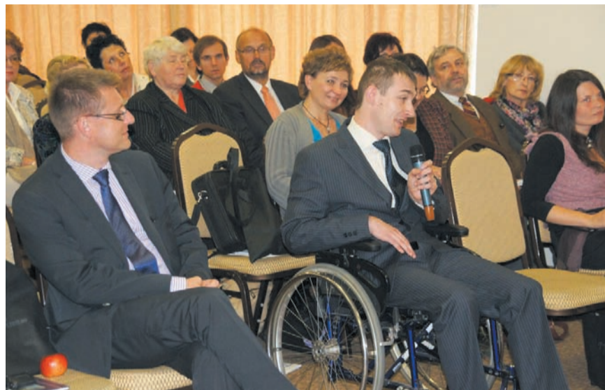
Ważnym głosem w debacie były wypowiedzi członków stowarzyszeń zrzeszających osoby niepełnosprawne

pryzmat ich niepełnosprawności, ale ich człowieczeństwa — mówiła otwierając konferencję Minister Agnieszka Kozłowska-Rajewicz.