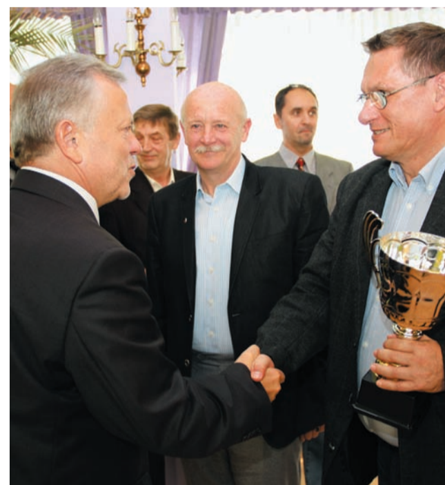
Liczymy, że w tym roku Powiat Zgierski, tak jak wielokrotnie w przeszłości, stanie na najwyższym stopniu podium

Ośrodka Sportu i Rekreacji w Zgierzu Witold Królewski. LR