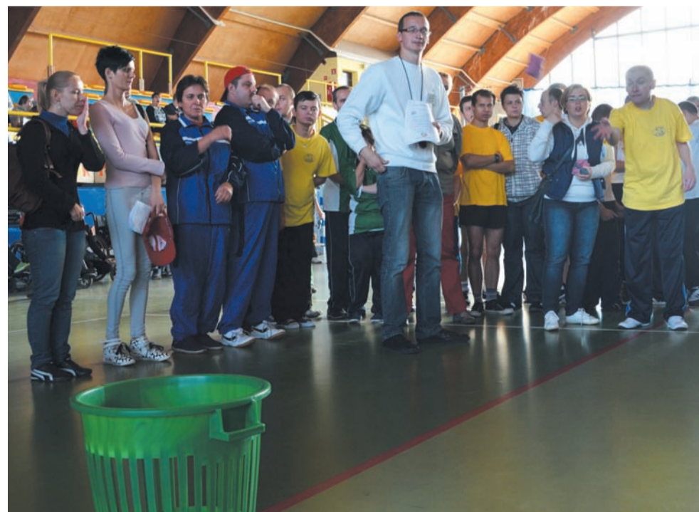
Pewna ręka, celne oko i dobra zabawa gwarantowana