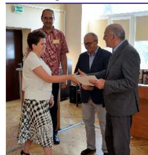
Nowa dyrektor I Liceum Ogólnokształcącego w Głownie, zna szkołę od podszewki, ponieważ od 11 lat uczy w szkole języka angielskiego

Miłym akcentem narady było wręczenie nagród jubileuszowych za wieloletnią pracę w zawodzie nauczyciela. Nagrody otrzymali: dyrektor Liceum Ogólnokształcącego im.