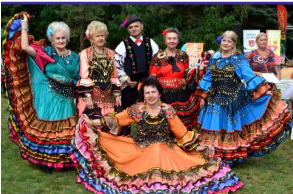
Ideą konkursu jest prezentowanie seniorów, jako ludzi aktywnych twórczo, pełnych pasji i wigoru