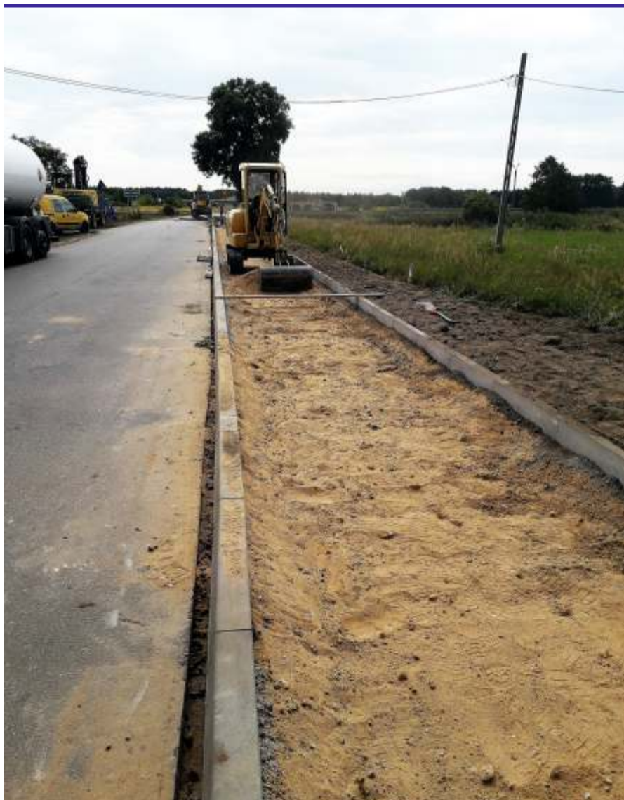
Budowa chodnika w pasie drogi powiatowej w Maszkowicach

granic powiatu w Waliszewie (gm. Głowno). Na blisko 1,5 km odcinku, drogowcy położą nowy asfalt, wymienią przepusty oraz wyremontują pobocza. Łączny koszt inwestycji to ponad 700 tys. zł. Znaczna część tej kwoty, blisko 685 tys. zł, pochodzi z budżetu Powiatu Zgierskiego, pozostałą część udało się pozyskać, dzięki dofinansowaniu z budżetu Województwa Łódzkiego. [LR]