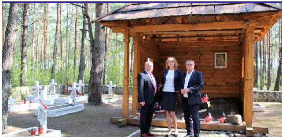
Wizyta powiatowej delegacji była okazją do złożenia hołdu tym, którzy ponad 100 lat temu, walczyli o naszą niepodległość

Cmentarz wojenny w Polskim Lasku w Kostiuchnówce na Ukrainie, tradycyjnie już, stał się miejscem obchodów świętowania ważnych rocznic i wydarzeń dla Polaków na Wołyniu. Tegoroczne uroczystości upamiętniające „Bitwę pod Kostiuchnówką”, połączone były z 21. edycją harcerskiej służby na Wołyniu.