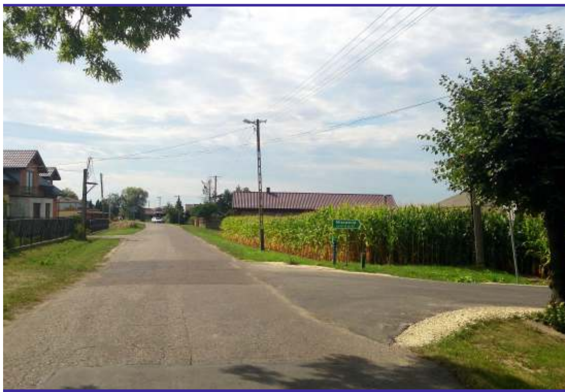
Droga powiatowa relacji Popów – Mięsośnia – do granic powiatu w Waliszewie (gm. Głowno)

PULS POWIATU - Miesięcznik Promocyjno-Informacyjny Powiatu Zgierskiego. Wydawca: Starostwo Powiatowe w Zgierzu. Redaktor naczelna: Małgorzata Tomczuk (tel. 42 288 81 60, promocja@powiat.zgierz.pl), redaktor Łukasz Roman. Adres redakcji: 95-100 Zgierz, ul. Sadowa 6a.