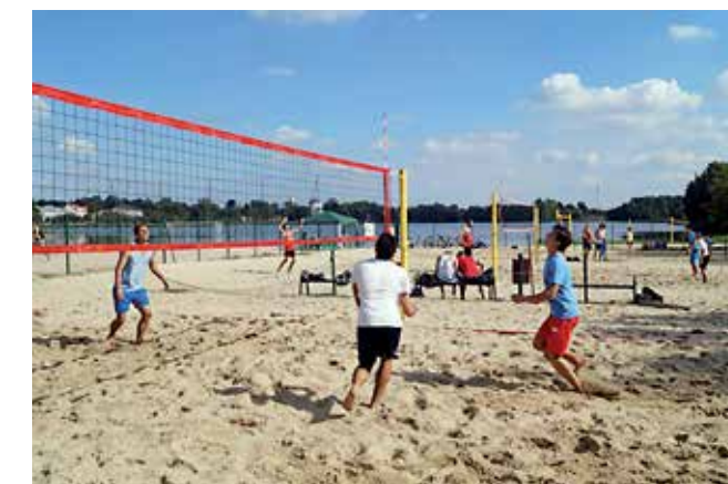
Pasję i zaangażowanie młodych radnych było widać także na boisku