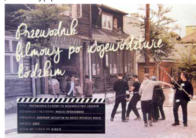
Książkę Macieja Kronenberga można kupić poprzez stronę internetową www.regiocentrum.pl

oscarowej „Idzie”. Najnowszym obrazem kręconym w Zgierzu jest serial o Eugeniuszu Bodo, w którym to Miasto Tkaczy „gra” Pabianice sprzed 100 lat. Pierwsze odcinki będzie można obejrzeć już na początku 2016 roku. MT