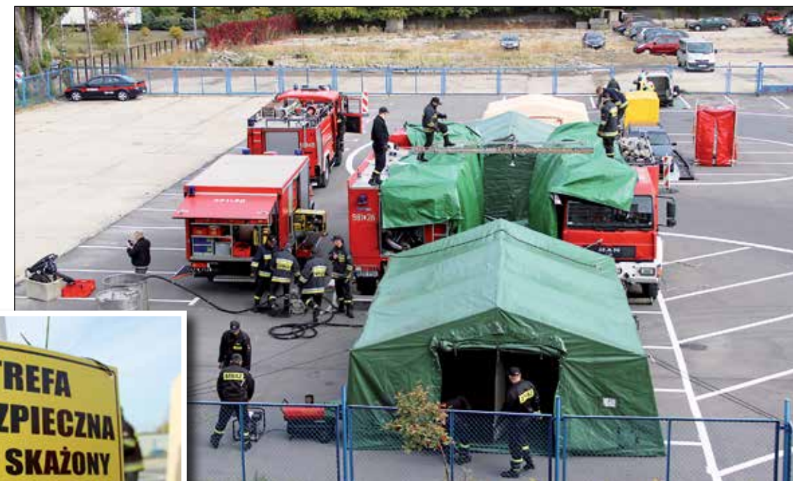
Na potrzeby ćwiczeń parking przy budynku starostwa stał się strefą skażoną

Aby na bieżąco i skutecznie informować mieszkańców gmin: Parzęczew, Ozorków, jak i miasta Ozorkowa, powiatowe służby stworzyły punkt informacyjny, skąd nadawały komunikaty do mieszkańców i mediów.