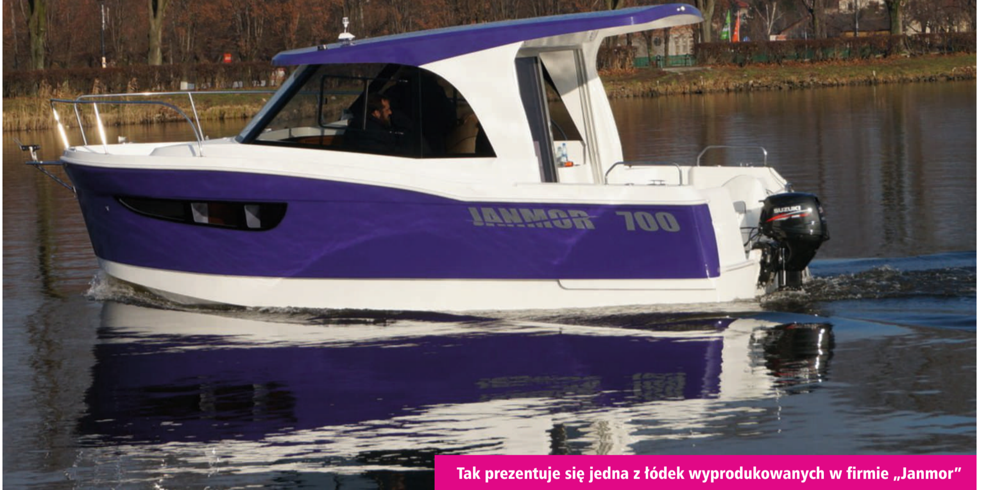
Tak prezentuje się jedna z łódek wyprodukowanych w firmie „Janmor”