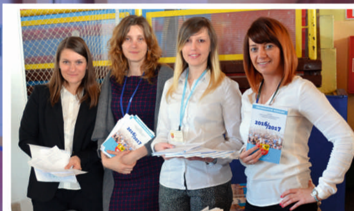
Od urzędniczek ze starostwa można było otrzymać przydatny informator szkolny

W naszej szkole i tu będziemy kontynuować naukę – w Zespole Szkół nr 1 im. J.S. Cezaka w Zgierzu. – Przekonała nas do tego atmosfera w naszej szkole, poziom nauczania i... wiele – dodają z uśmiechem gimnazjalistki. [MT]