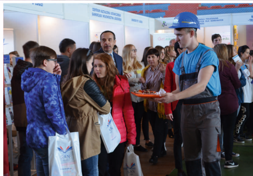
„Budowlańcy” tym razem kusili jedzeniem