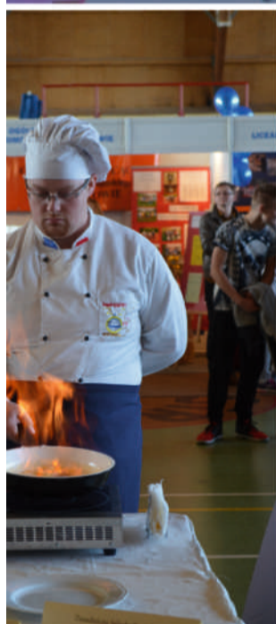
W tym miejscu oprócz tego, że robili kuchenki, nieźle wybornie smakowały