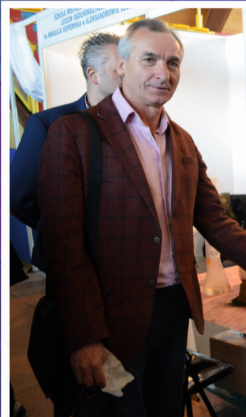
Mydélka wykonane na stoisku Zespołu Szkół Licealno-Gimnazjalnych w Głownie – członka Zarządu Powiatu