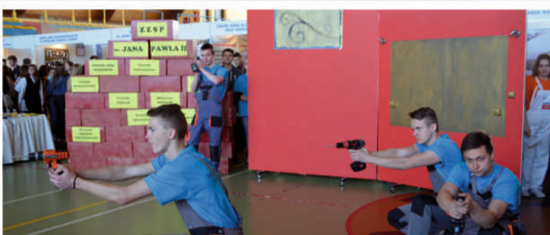
Film akcji? Spokojnie, to tylko pokaz wprawnego posługiwania się wiertarkami