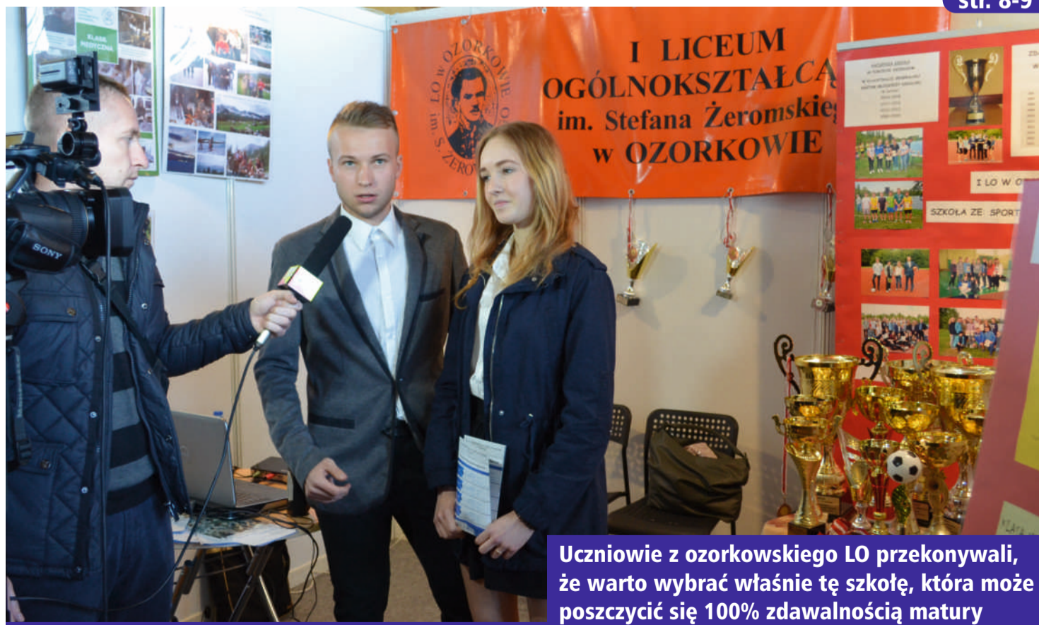
Uczniowie z ozorkowskiego LO przekonywali, że warto wybrać właśnie tę szkołę, która może poszczycić się 100% zdawalnością matury

26 kwietnia ponad 800 uczniów odwiedziło IX Targi Edukacyjne, organizowane przez Wydział Oświaty zgierskiego starostwa. Ci, którzy jeszcze nie zdecydowali, jaki kierunek dalszego kształcenia wybrać, mieli doskonałą okazję zapoznać się z ofertą szkół ponadgimnazjalnych, uczelni wyższych oraz placówek oświatowych z terenu powiatu zgierskiego i województwa łódzkiego. Każdy z dwudziestu pięciu wystawców starał się w ciekawy sposób zaprezentować swoją szkołę i przyciągnąć do siebie odwiedzających.