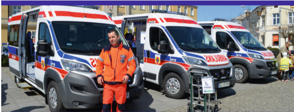
Nowe karetki wyposażone są na bardzo wysokim poziomie

Trzy nowe karetki typu „P” (podstawowe), zakupione za około 930 tys. zł przez samorząd województwa łódzkiego, zastąpią wysłużone pojazdy, które do tej pory stacjonowały w Zgierzu. W sumie w stolicy naszego powiatu będą, tak jak do tej pory, 4 karetki – trzy typu „P” i jedna „S” (specjalistyczna). Ta ostatnia nie wymagała wymiany, ponieważ ma mały przebieg.