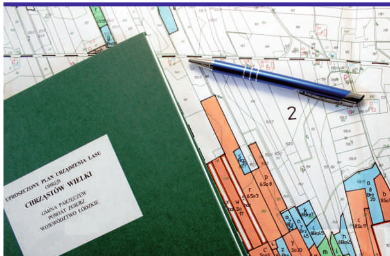
Uproszczony plan będzie dotyczył obszarów leśnych w gminach: Aleksandrów Łódzki, Parzęczew, Zgierz oraz Głowno

Całkowity koszt dokumentacji wynosi ponad 100 tys. zł. Połowę tej kwoty przekaże WFOŚiGW, resztę dołoży starostwo. [LR]