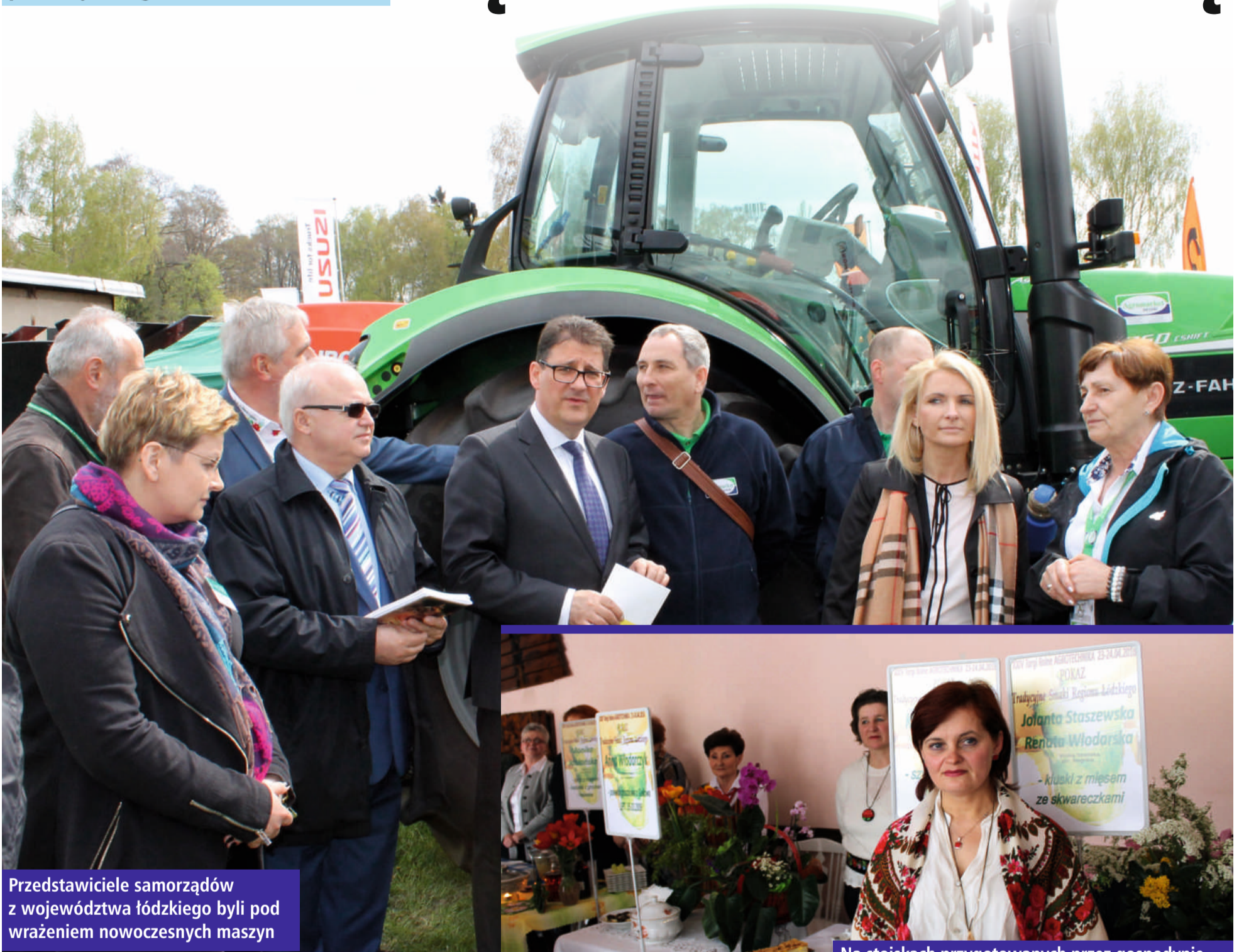
Przedstawiciele samorządów z województwa łódzkiego byli pod wrażeniem nowoczesnych maszyn