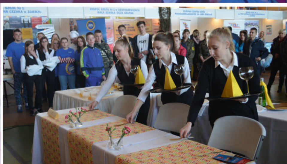
Pokaz kelnerski w wykonaniu uczennic z Zespołu Szkół nr 1 im. J.S. Cezaka w Zgierzu