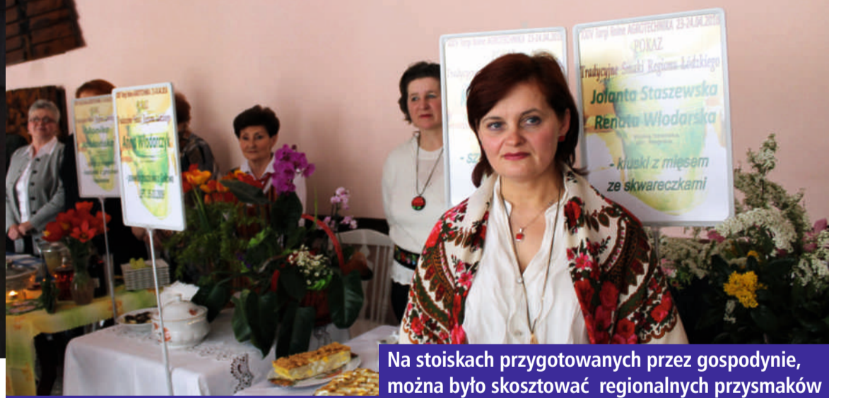
Na stoiskach przygotowanych przez gospodynie, można było skosztować regionalnych przysmaków