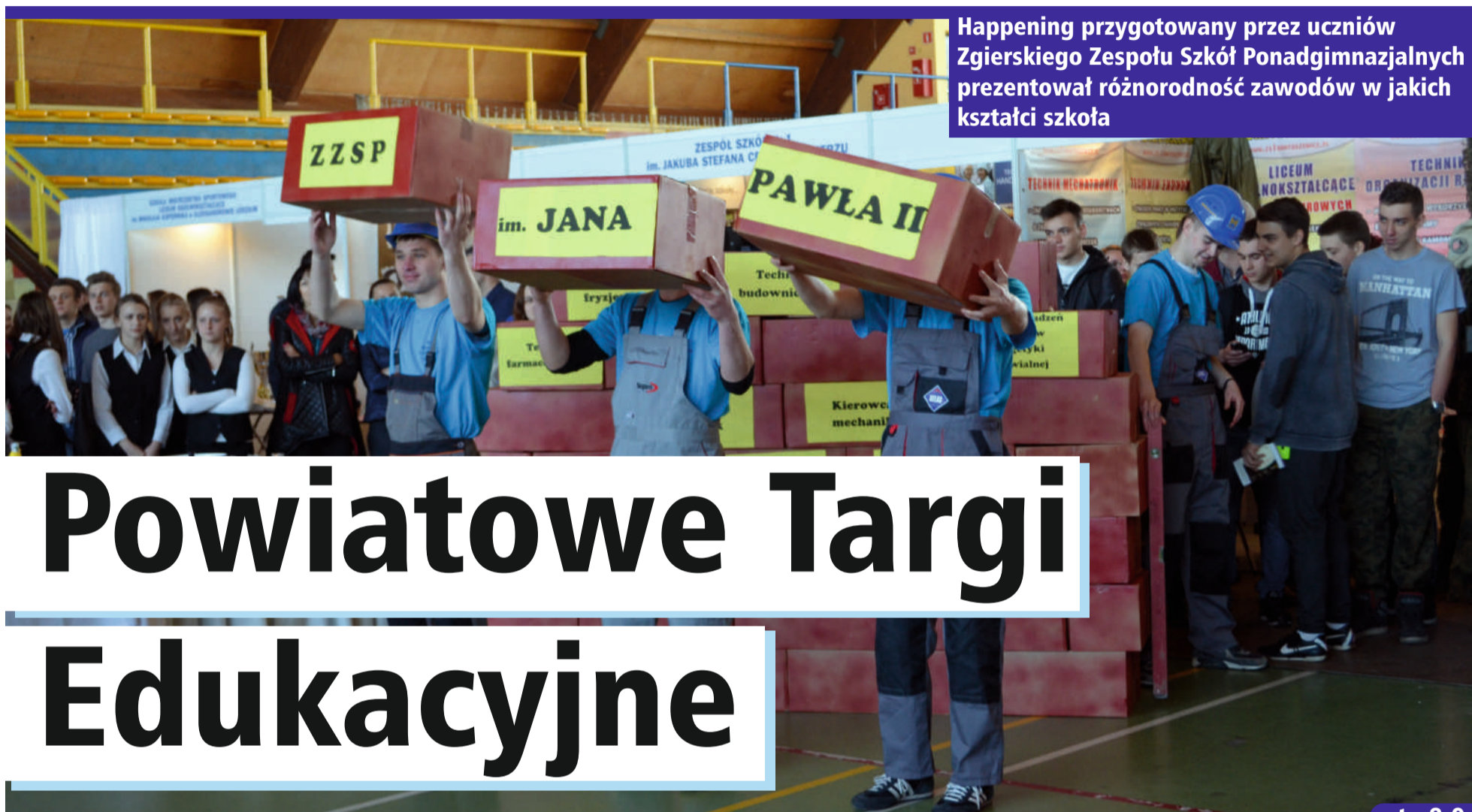
Happening przygotowany przez uczniów Zgierskiego Zespołu Szkół Ponadgimnazjalnych prezentował różnorodność zawodów w jakich kształci szkoła