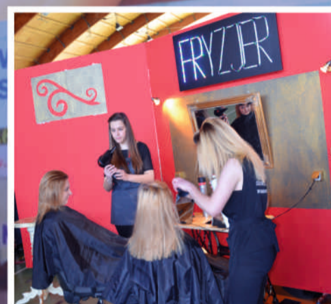
„Wyczesany” pomysł na promocję uczennic ze ZZSP im. Jana Pawła II