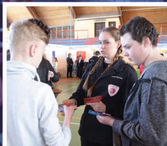
Dziewczyna w mundurze z powodzeniem zachęcała chłopaków do nauki w Mundurowym LO w Łodzi