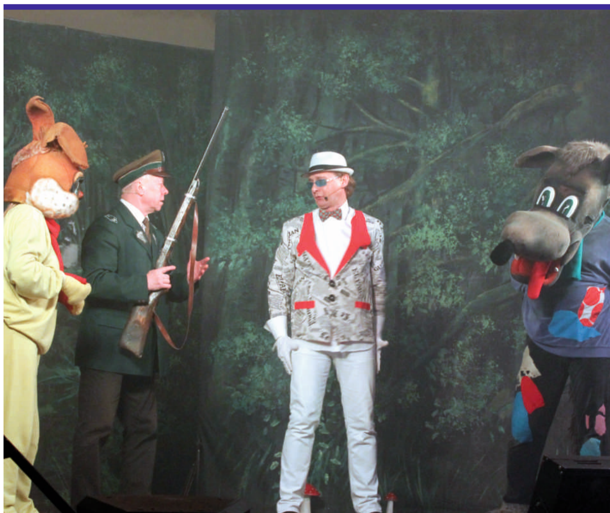
Pan Gajowy zostaje pilnować zwierząt w lesie, a wilk z zającem jadą z Mister Bajem robić karierę artystyczną

podopieczni Zespołów Szkół Specjalnych w Ozorkowie i Głownie oraz Przedszkola Miejskiego z Oddziałami Integracyjnymi nr 3 w Zgierzu otrzymają nowoczesny sprzęt. [JŁ]