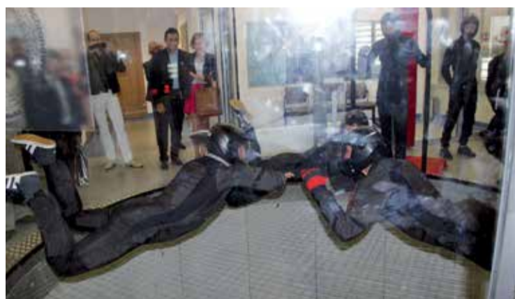
Prędkość w tunelu Ośrodka Szkolenia Aeromobilno – Spadochronowego wynosi prawie 200 km/h