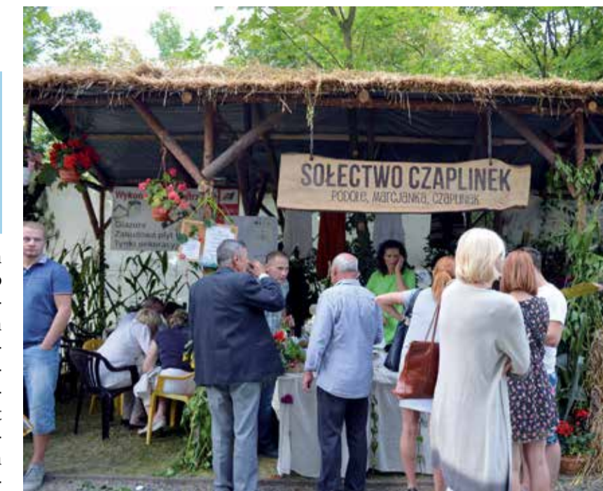
Przedstawiciele sołectwa Czaplinek budowali swoje stoisko już od wtorku

Nieodzownym elementem tamtejszych dożynek jest konkurs na „Najlepsze stoisko promocyjne sołectwa”. W tym roku zaprezentowało się 8 sołectw, a najlepszymi z nich okazały się te, które mają w swoich szeregach „młodą krew”. Na podium stanęły Czaplinek, który zachwylił samodzielnie zbudowanym stoiskiem, prezentacją zwierząt hodowlanych oraz pysznymi daniami i unowocześnionymi przetworami np. chutneyem oraz sołectwo Ciosny, witające odwiedzających chlebem i solą, karmiące gołąbkami, pierogami i smakowitą szynką odkrawaną od kości. MT