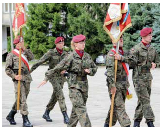
Kiedys się mówiło: „Za mundurem panny sznurem”, a teraz to też panowie mogą podziwiać panie w mundurach

Już tradycyjnie w przededniu Świąt Wojska Polskiego dowódca 1 dywizjonu lotniczego i 1 batalionu kawalerii powietrznej w Leźnicy Wielkiej zaprosili lokalnych samorządowców oraz gości, aby wspólnie oddać hołd bohaterom, nie tylko Bitwy nad Bzurą, ale także wszystkim żołnierzom, którzy służą w polskiej armii.