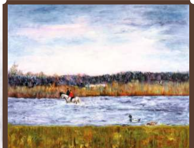
Helena Stępień Zgniłe Błoto