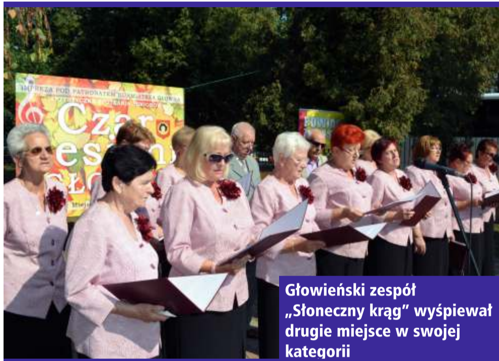
Głowiński zespół „Słoneczny krąg” wyśpiewał drugie miejsce w swojej kategorii

Jeszcze letnia, upalna aura towarzyszyła IX Artystycznym Spotkaniom Seniorów „Czar Jesieni 2016”. W sobotni poranek 10 września, w ogrodzie głowińskiego Miejskiego Ośrodka Kultury – organizatora przeglądu, ponad 50 zespołów artystycznych, solistów i gawędziarzy z całej Polski, prezentowało swoje umiejętności.