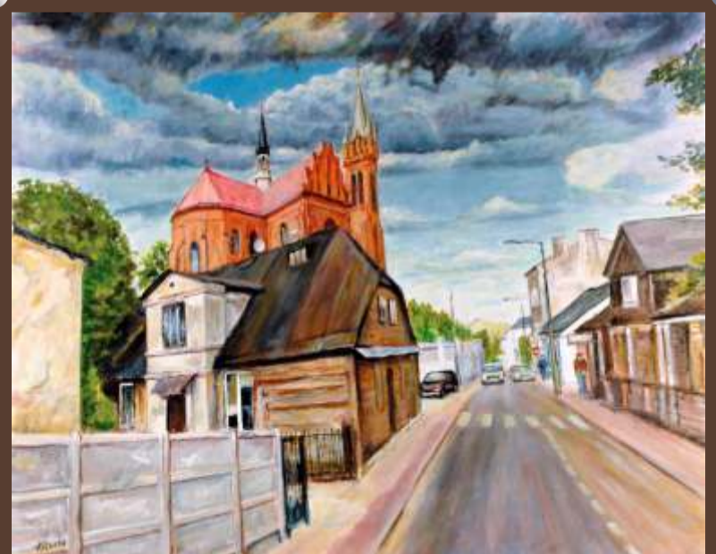
Ryszard Kowalczyk Stary Zgierz