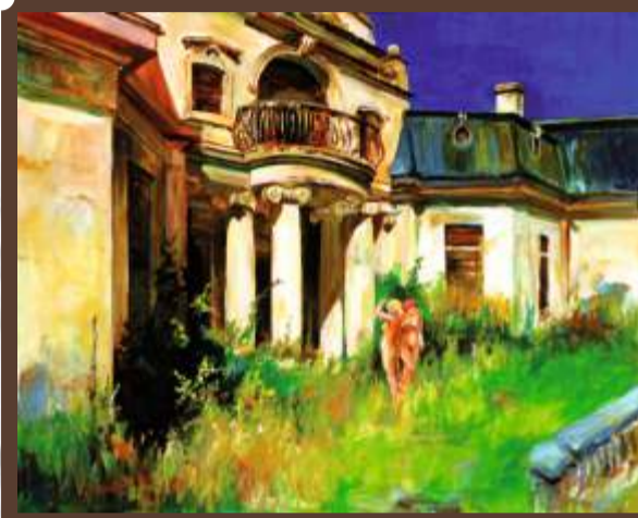
Jerzy Mieszalski Pałac Rzewuskich – Bratoszewice