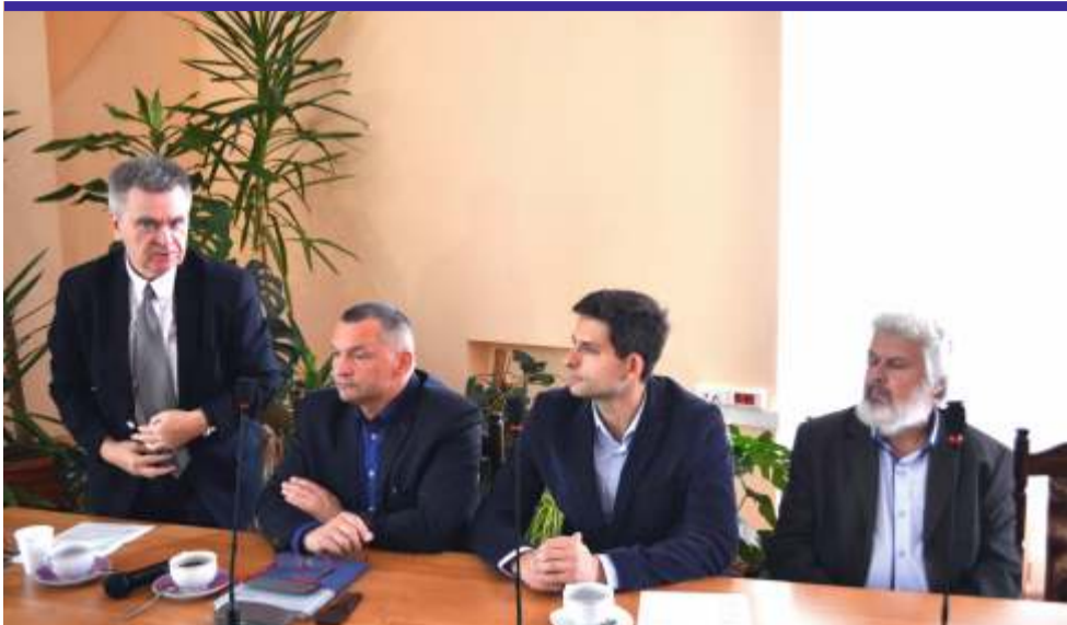
Naukowcy z Polskiej Akademii Nauk przedstawili efekty swojej wielomiesięcznej pracy nad tematem zasobów odnawialnych źródeł energii i możliwości ich wykorzystania

wiatr, bardzo nam sprzyja. Warunki wietrzne w powiecie zgierskim są bardzo korzystne, lepsze występują jedynie na Pomorzu. Niestety tego potencjału nie da się już przekuć w sukces, ponieważ Ustawa o inwestycjach w zakresie elektrowni wiatrowych z maja tego roku, wprowadziła takie obostrzenia, że postawienie farmy wiatrowej na terenie Polski, w tym również naszego powiatu, jest prak-