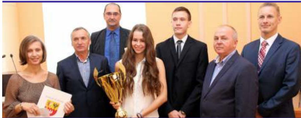
Triumf m.in. w siatkówce, tenisie stołowym i biegach przełajowych, zapewniło I LO w Ozorkowie zwycięstwo w Licealiadzie 2015/2016

Spośród szkół ponadgimnazjalnych bezkonkurencyjni okazali się sportowcy z I Liceum Ogólnokształcącego w Ozorkowie. Puchar za drugie miejsce odebrali uczniowie z Zespołu Licealno-Sportowego w Aleksandrowie Łódzkim. Na najniższym stopniu, podobnie jak w ubiegłym roku, znalazł się Zespół Szkół nr 1 w Zgierzu. Oprócz pucharów najlepsze