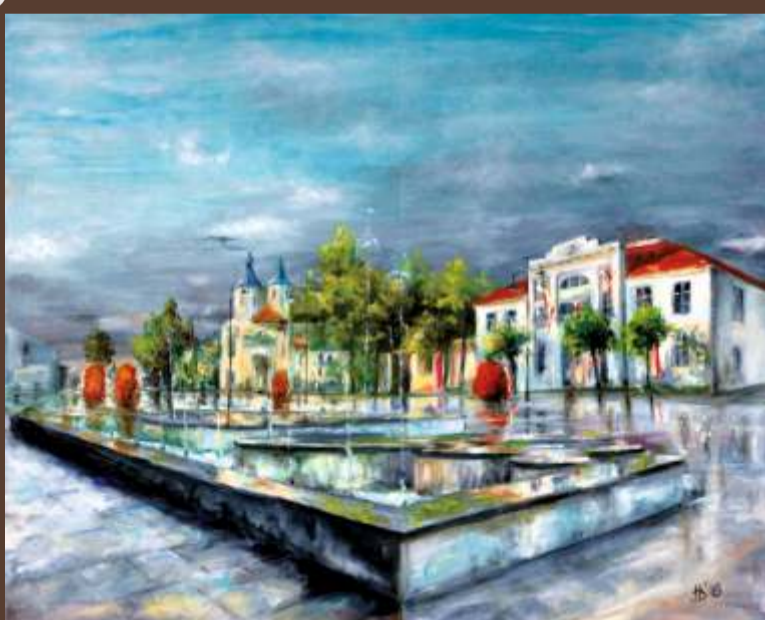
Beata Hankiewicz Po burzy