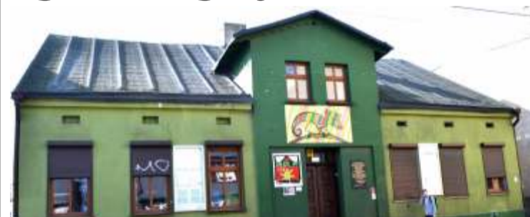
Powiat zgierski w przyszłym roku złoży wniosek o dofinansowanie projektu pod nazwą „Centrum Kultury Powiatu Zgierskiego”, który zakłada m.in. przebudowę siedziby placówki

1 października rozpoczęła działalność nowa samorządowa instytucja kultury, pod nazwą Centrum Kultury Powiatu Zgierskiego, która w przyszłości przejmie zadania Młodzieżowego Domu Kultury.