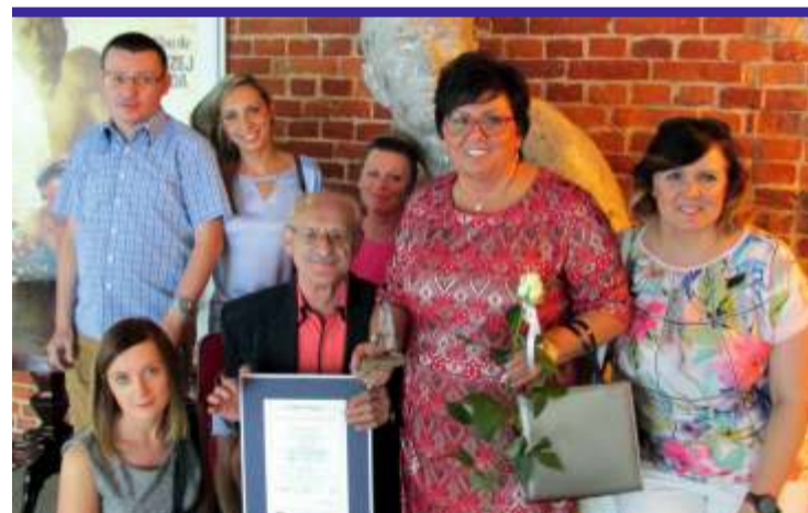
To już drugi taki tytuł w dorobku Polskiego Stowarzyszenia Ludzi Cierpiących na Padaczkę Oddział Łódzki w Ozorkowie - w 2014 r. stowarzyszenie otrzymało II miejsce w kategorii „Instytucja”

Polskie Stowarzyszenie Ludzi Cierpiących na Padaczkę Oddział Łódzki, z siedzibą w Ozorkowie, zostało jednym z laureatów XI –tej edycji konkursu „Lodołamacze 2016” w kategorii „Instytucja” organizowanego przez Fundację Aktywizacji Zawodowej Osób Niepełnosprawnych oraz Polską Organizację Pracodawców Osób Niepełnosprawnych.