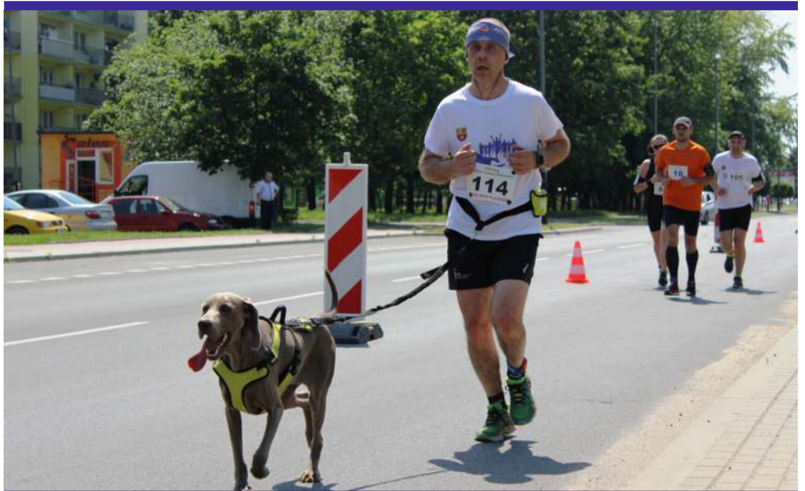
Niektórzy zawodnicy biegli na dwie nogi i cztery łapy

piero budzi się do życia – przekonuje biegacz.