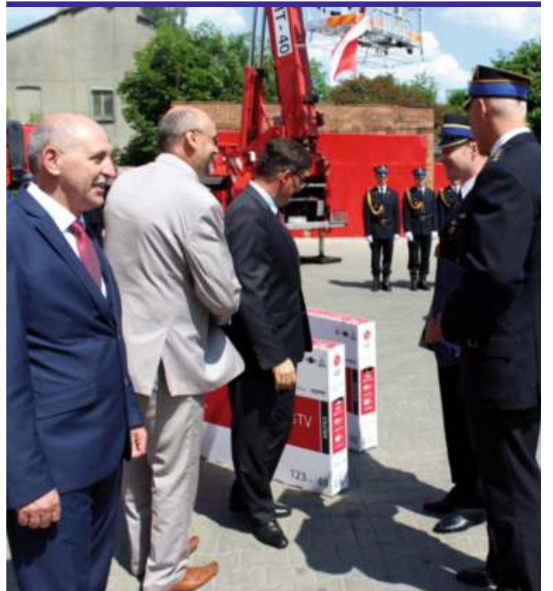
W imieniu wyróżnionych przez starostę zgierskiego strażaków, nagrody odebrali dowódcy jednostek w Ozorkowie i Strykowie

Kolejnym miłym akcentem strażackiej uroczystości był udział w niej zastępcy Komendanta Głównego Państwowej Straży Pożarnej st. bryg. Krzysztofa Hejduka, notabene mieszkańca powiatu zgierskiego, który zapowiedział, że w planach na lata 2017-2020 jest budowa nowej strażnicy w Strykowie i podwyżki dla polskich strażaków. [MT]