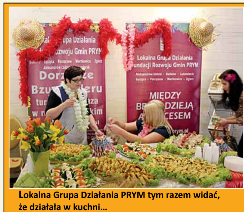
Lokalna Grupa Działania PRYM tym razem widać, że działała w kuchni...