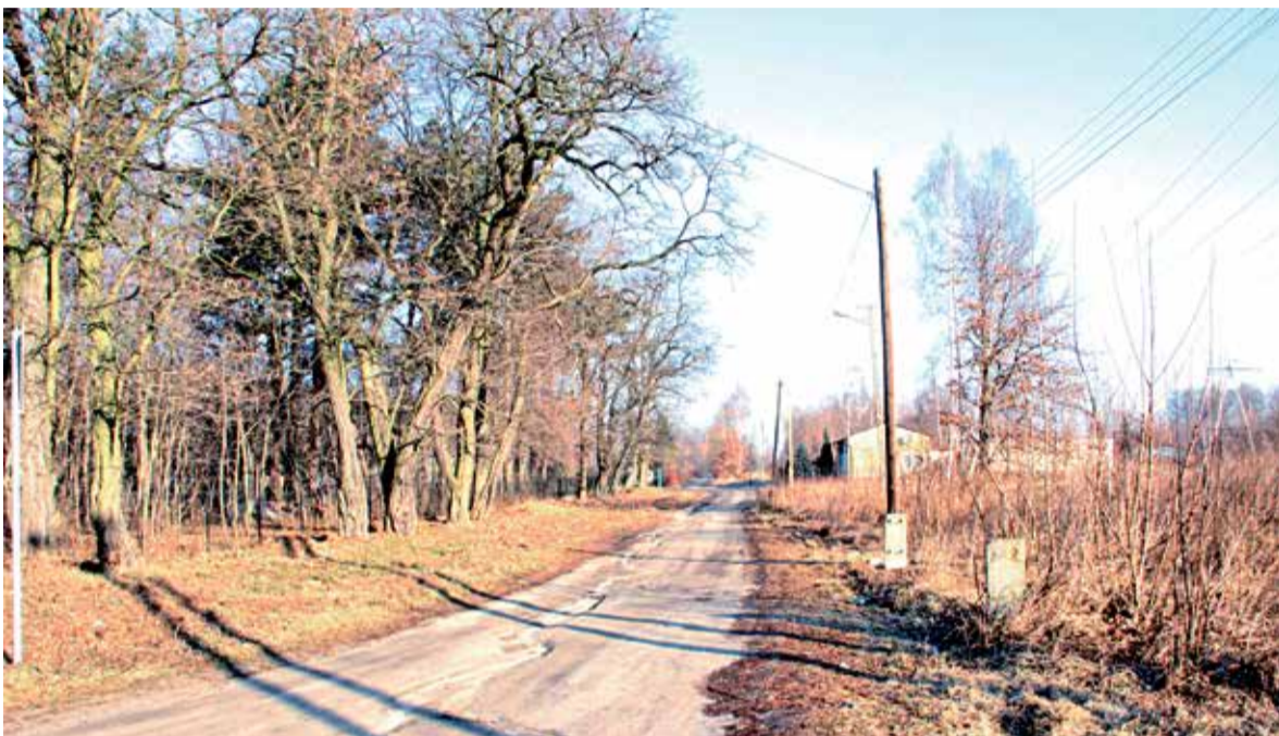
S14 ma przebiegać przez Os. 650-lecia w Zgierzu w pasie ul. Cegielnianej

Droga ekspresowa S14, czyli Zachodnia Obwodnica Łodzi, to długo wyczekiwana inwestycja, której znaczna część znajdzie się na terenie powiatu zgierskiego. W przyszłości połączy ona autostradę A2 (węzeł Emilia) z drogą ekspresową S8 (węzeł Róża) biegnącą po zachodniej stronie Łodzi, Zgierza i Pabianic. Łączna długość to ok. 41 km, z czego do tej pory powstało około 9 km, kolejne 4 km jest w budowie.