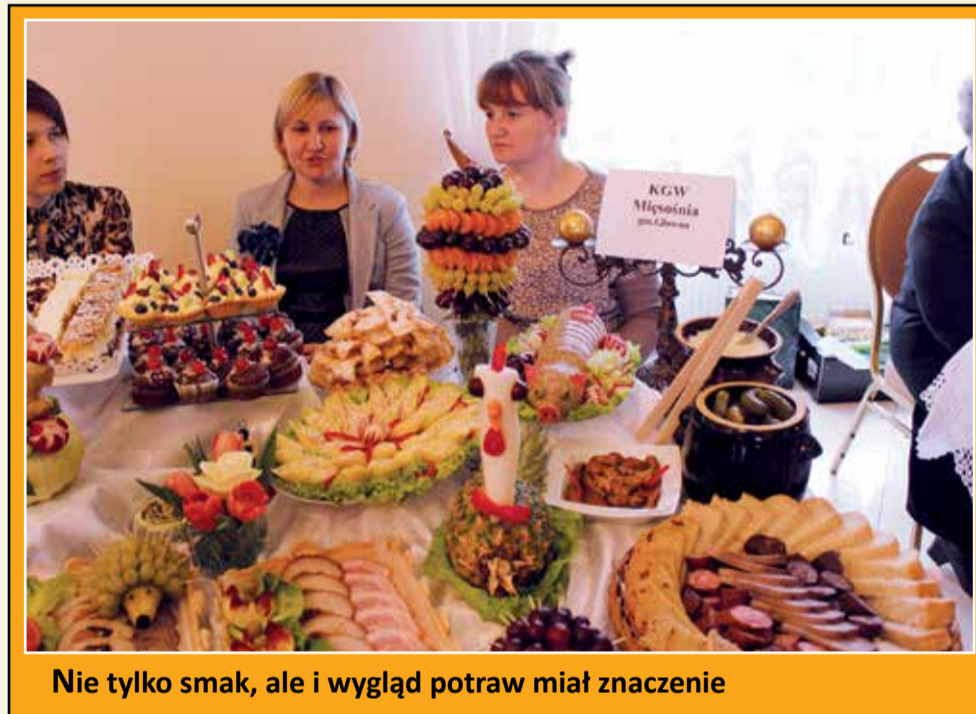
Nie tylko smak, ale i wygląd potraw miał znaczenie