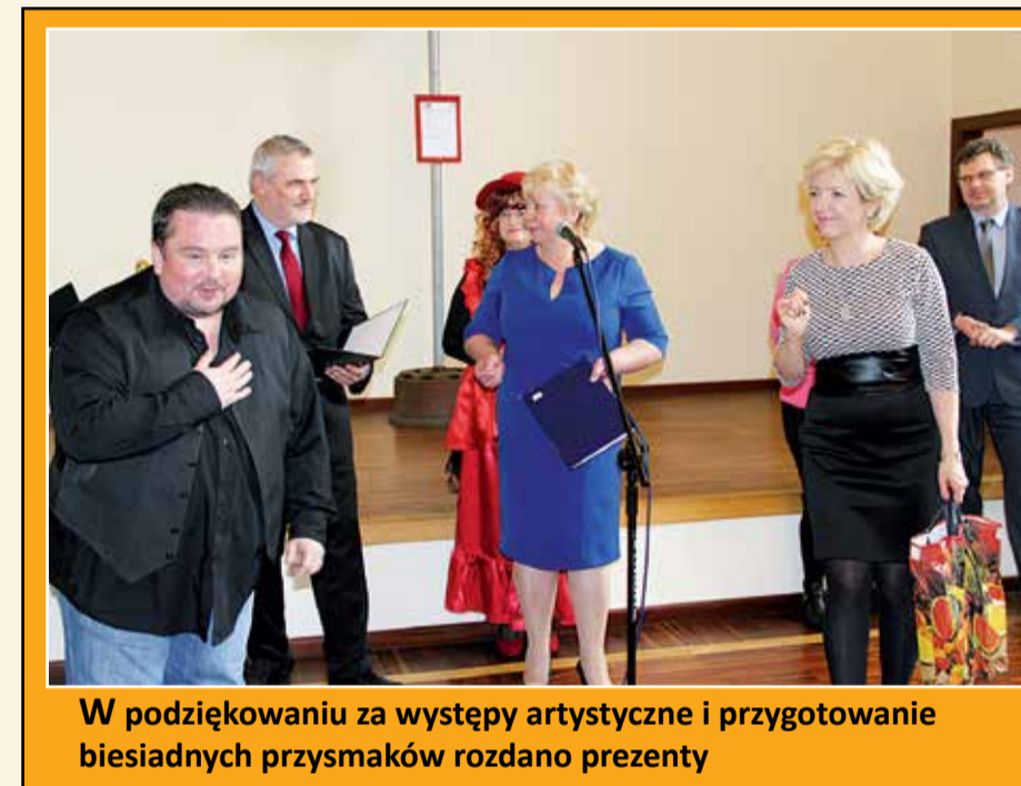
W podziękowaniu za występy artystyczne i przygotowanie biesiadnych przysmaków rozdano prezenty