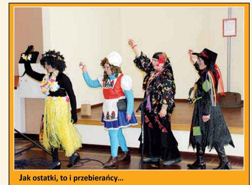
Jak ostatki, to i przebierańcy...