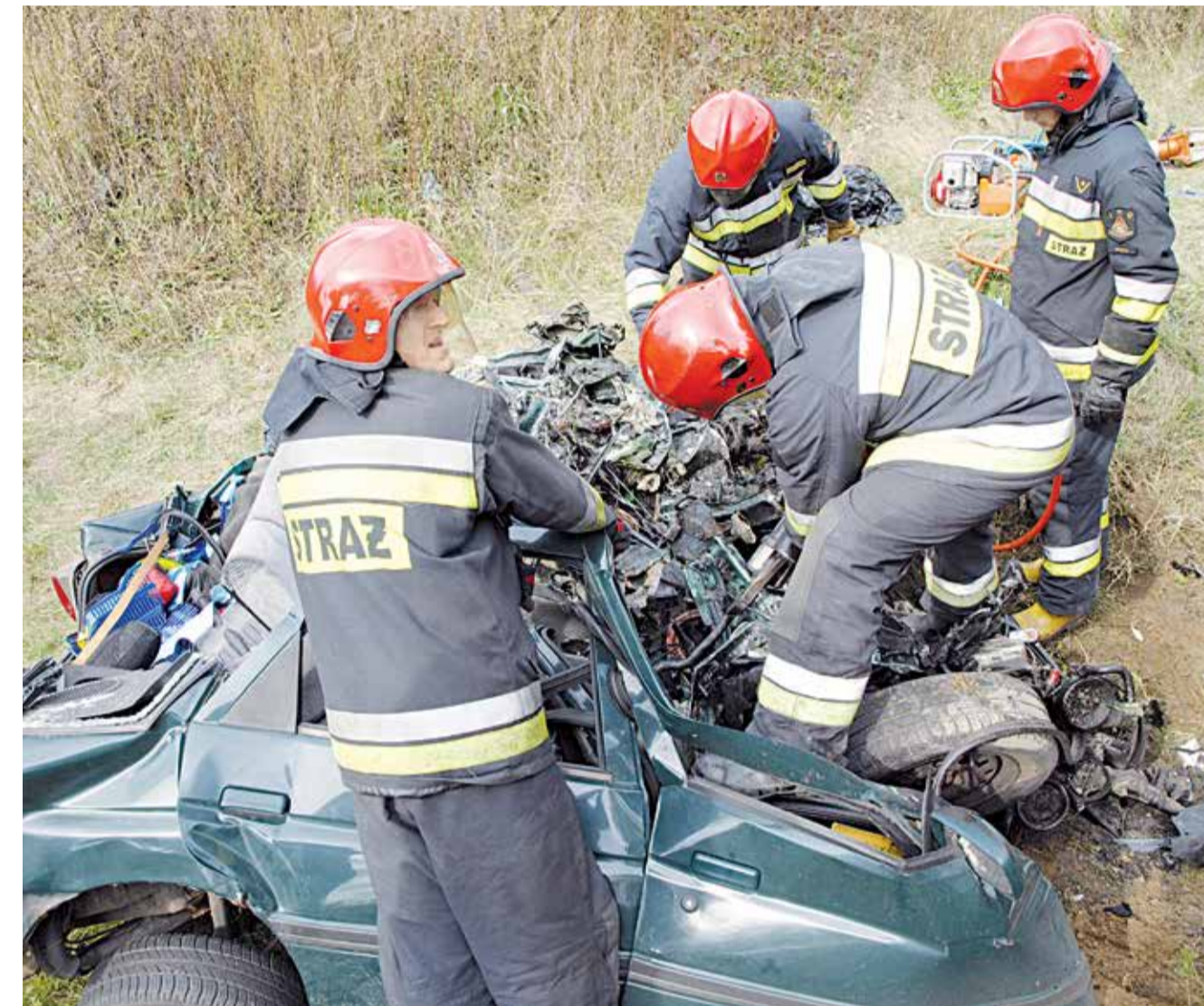
W 2013 roku 35 osób poniosło śmierć w wyniku miejscowych zagrożeń takich jak wypadki samochodowe

Pozytywne wnioski płyną również ze statystyk policyjnych. W 2013 roku o ponad 150 spadła liczba dokonywanych przestępstw. Najlepiej w tej statystyce wypada Zgierz oraz Głowno. Niestety najwięcej przypadków łamania prawa