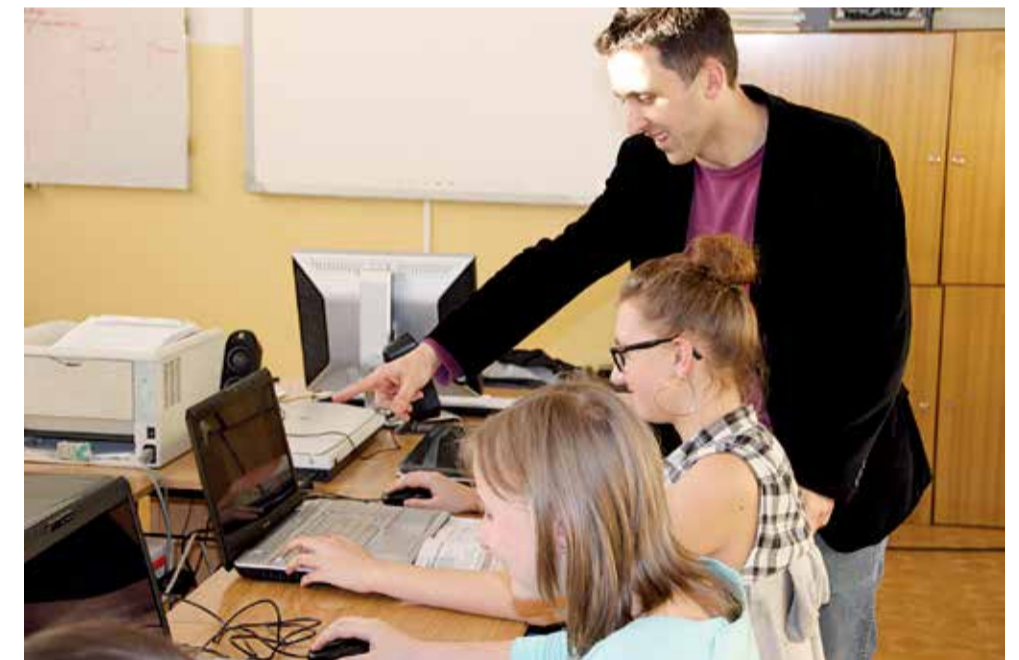
W trakcie zajęć uczennice z klasy Ia tworzą m.in. karty ocen w edytorze tekstu

Szkolna sieć wi-fi, z której w trakcie przerw między zajęciami korzystają uczniowie, dzięki nowemu routerowi powiększyła się i obejmuje swoim zasięgiem całą szkołę. Pierwsze lekcje w doposażonej pracowni informatycznej odbyły się na początku lutego. LR