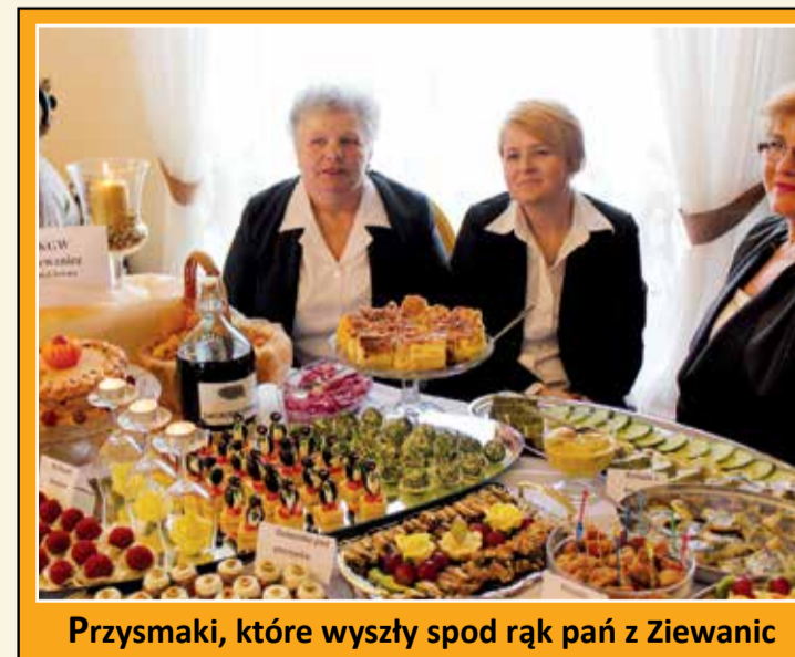
Przysmaki, które wyszły spod rąk pań z Ziewanic