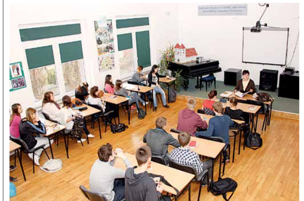
Doskonalenie powiatowych kadr nauczycielskich będzie trwało od sierpnia 2014 do czerwca 2015 roku

Ponadto projekt zakłada stworzenie czterech sieci współpracy między placówkami, opartych na internetowej platformie e-learningowej. Nauczyciele danej specjalności np. matematycy, przyrodnicy itp. będą mogli za jej pomocą wymieniać doświadczenia, a dyrektorzy placówek udostępniać sobie nawzajem materiały, opracowania itd. MT