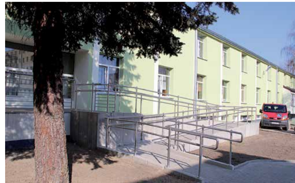
Wyremontowany budynek SOSW prezentuje się znakomicie. Kolejną tego typu inwestycją będzie termomodernizacja siedziby Zespołu Szkół Specjalnych w w Aleksandrowie łódzkim

Po czterech termomodernizacjach placówek oświatowych prowadzonych przez powiat zgierski, przyszła kolej na zakończenie i podsumowanie prac w Specjalnym Ośrodku Szkolno-Wychowawczym w Zgierzu. W placówce została wymieniona stolarka okienna i drzwiowa, ocieplono elewację i stropodachy oraz zbudowano podjazd dla niepełnosprawnych.