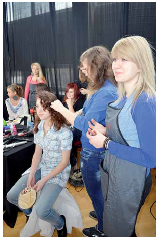
Po trzech latach nauki absolwenci zyskają zawód fryzjera, piekarza, cukiernika itp.

Dzięki temu, że nowe oddziały będą tworzone na zasadzie klas dla młodzieżowych pracowników, jej absolwenci będą mieć jednocześnie wykształcenie ogólne i kwalifikacje zawodowe. Co więcej, zakłady rzemieślnicze, które podpiszą umowę o pracę z uczniem takiej placówki dostaną dotację z urzędu miasta – ok. 8 tys. zł za ucznia, a uczniowie będą dostawać miesięczną pensję w kwocie ok. 1 344 zł netto. MT