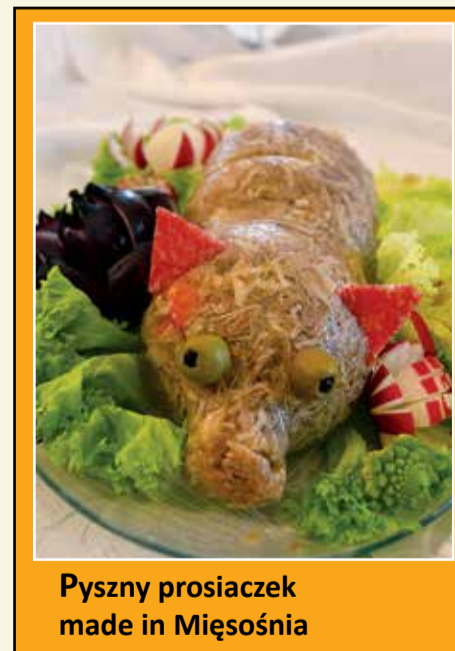
Pyszny prosiaczek made in Mięsośnia