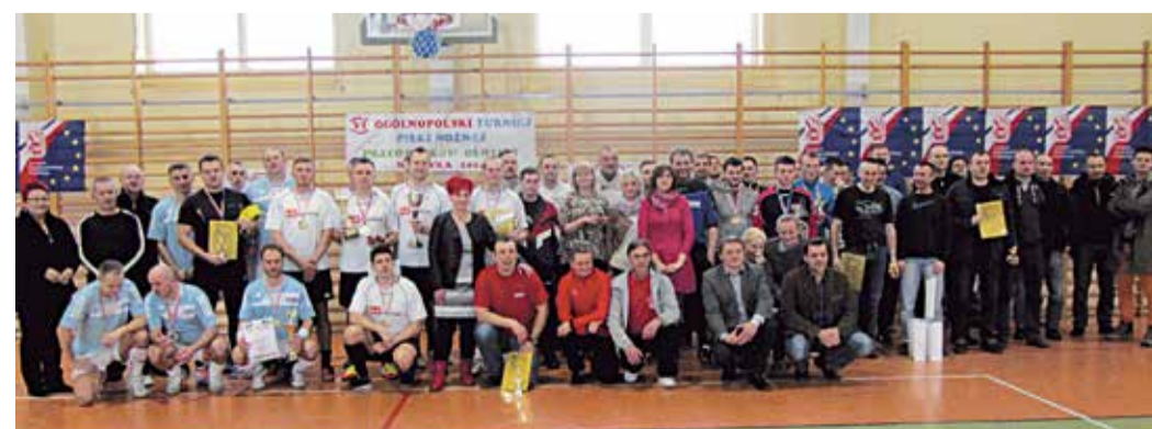
Coroczny turniej w Milówce jest doskonałą okazją do integracji środowiska pracowników oświaty

Już po raz szósty pracownicy oświaty z całego kraju spotkali się, aby rywalizować w Ogólnopolskim Turnieju Halowej Piłki Nożnej. Tradycyjnie zawody odbyły się w Gimnazjum w Milówce.