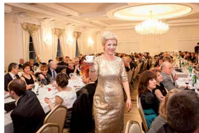
Filiżanka przekazana przez premiera Tuska została wycycylna za 6 tys. zł

Ręcznie malowana, pokryta 24-karatowym złotem porcelanowa filiżanka przekazana przez premiera Donalda Tuska, książki prof. Władysława Bartoszewskiego, kawałek dębu sprzed 22 milionów lat, akwarele przekazane przez marszałek Ewę Kopacz, naszyjnik wicepremier Elżbiety Bieńkowskiej – te i setki innych unikatowych rzeczy wycycyła 300 gości bawiących się w Białym Pałacu w Niesiecinie. Dzięki zebranym pieniądzom będzie można wyposażyć pracownię kardiologii (KTG) działającą na Oddziale Ginekologiczno-Położniczym w Wojewódzkim Szpitalu Specjalistycznym im. Marii Skłodowskiej-Curie w Zgierzu. Zakup specjalistycznej aparatury do KTG jest bardzo istotny, biorąc pod uwagę, że to właśnie dzięki temu badaniu możliwe jest wykrycie stanów zagrożenia płodu już we wczesnej fazie jego rozwoju. MT