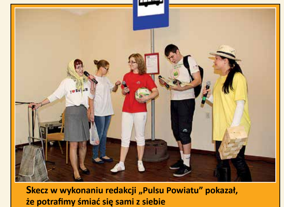
Skecz w wykonaniu redakcji „Pulsu Powiatu” pokazał, że potrafimy śmiać się sami z siebie