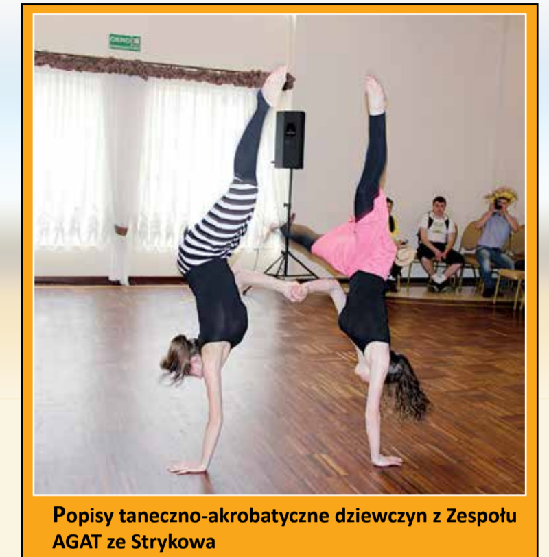
Popisy taneczno-akrobacyjne dziewczyn z Zespołu AGAT ze Strykowa