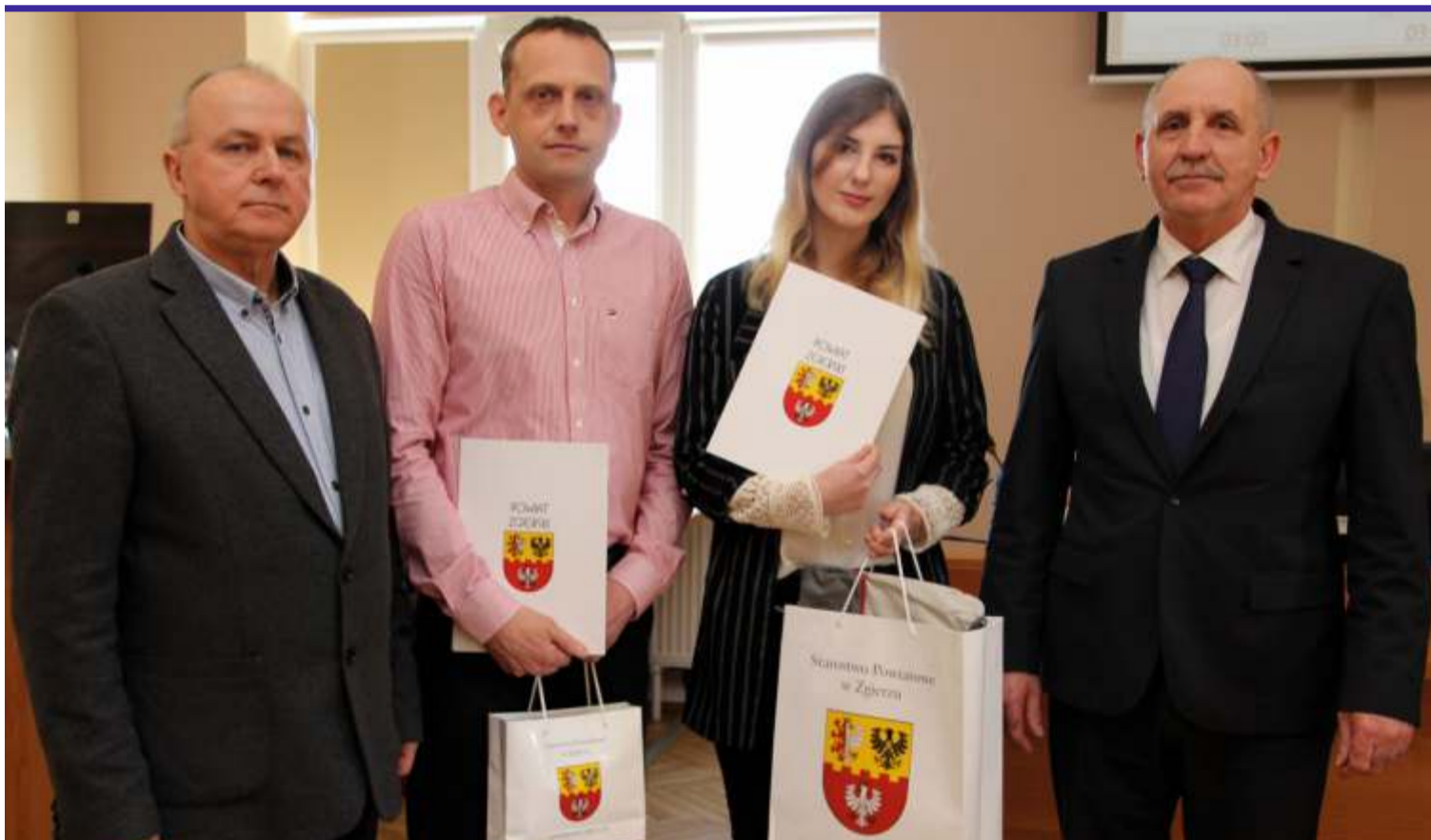
Najfajniejszy moment w strzelaniu, to ten podczas oddania strzału i świadomość, że był on dobry – przekonuje mistrzyni