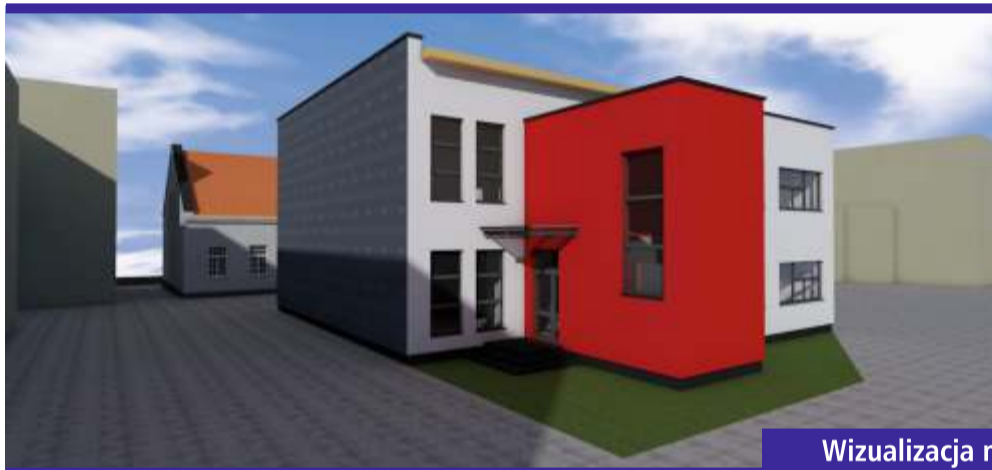
Wizualizacja nowej siedziby