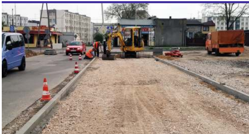
ul. Tkacka w Ozorkowie ma być oddana do użytku w połowie maja

Z nowego chodnika będą mogli niedługo korzystać mieszkańcy stolicy powiatu. Na ul. Piłsudskiego w Zgierzu trwają ostatnie prace, na ponad 300 metrowym odcinku, od ul. Piątkowskiej do ul. Andrzeja (po lewej stronie). Na tym nie koniec powiatowych inwestycji w mieście. Jeszcze w tym roku nowe chod-