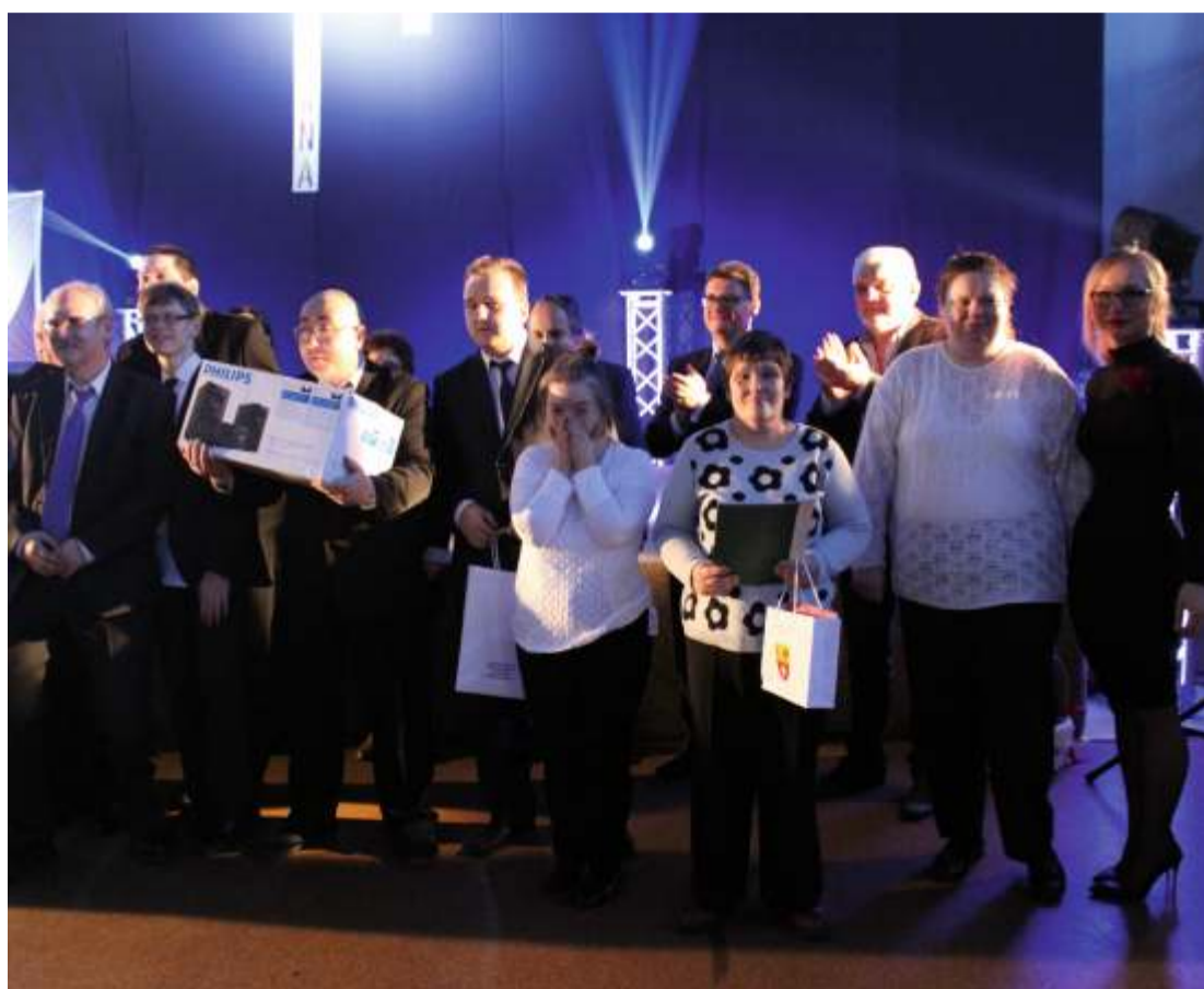
Tytułowy bohater przedstawienia „Mały Książę”, w wykonaniu aktorów ze zgierskiego koła PSONI, wiedziony ciekawością, przybył na ziemię aby poznać zachowania i uczucia ludzi