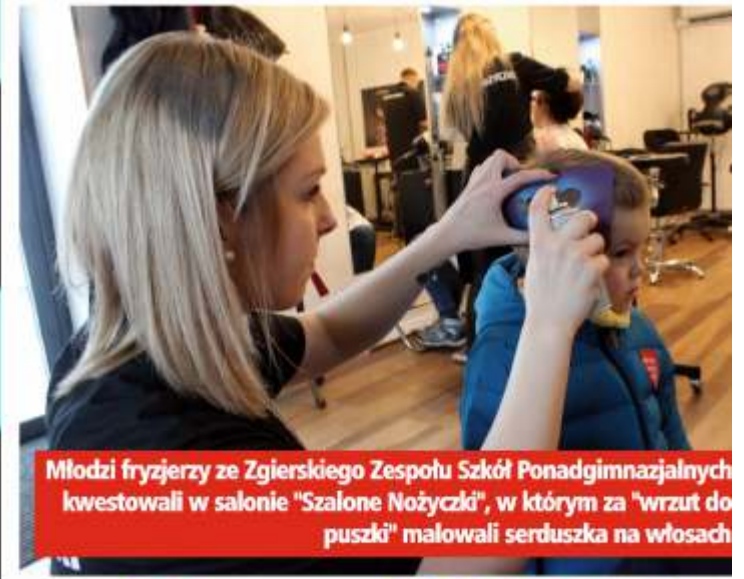
Młodzi fryzjerzy ze Zgierskiego Zespołu Szkół Ponadgimnazjalnych kwestowali w salonie "Szalone Nożyczki", w którym za "wrzut do puszek" malowali serduszka na włosach