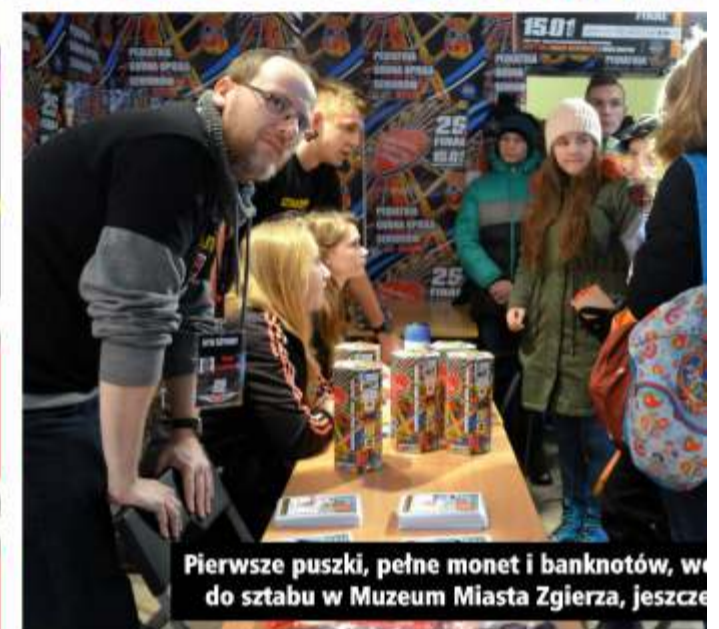
Pierwsze puszkę, pełne monet i banknotów, w do sztabu w Muzeum Miasta Zgierza, jeszcze