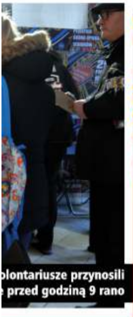
Wolontariusze przynieśli... przed godziną 9 rano