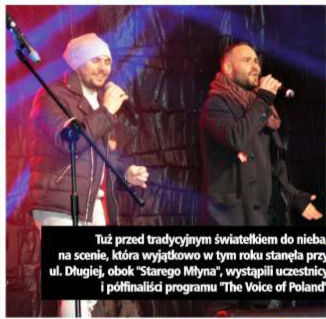
Tuż przed tradycyjnym światelkiem do nieba, na scenie, która wyjątkowo w tym roku stanęła przy ul. Długiej, obok "Starego Młyna", wystąpili uczestnicy i półfinałiści programu "The Voice of Poland"