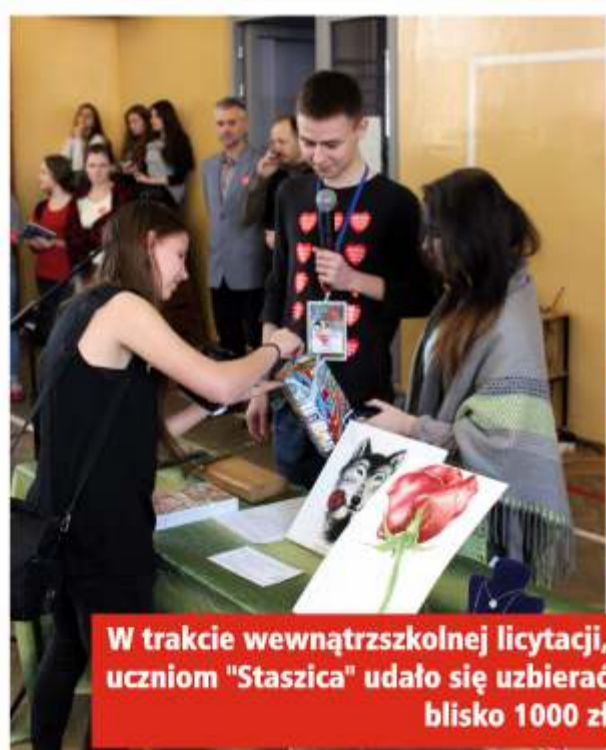
W trakcie wewnątrzszkolnej licytacji, uczniom "Staszica" udało się zbierać blisko 1000 zł