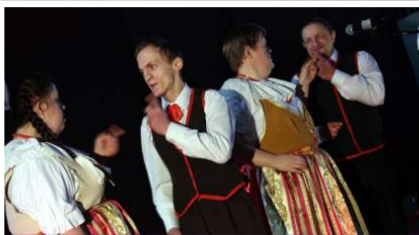
Zespół „Nowa Zorza” poprzez przyśpiewki, tańce i zabawy folklorystyczne przybliżył publiczności kulturę regionu śląskiego