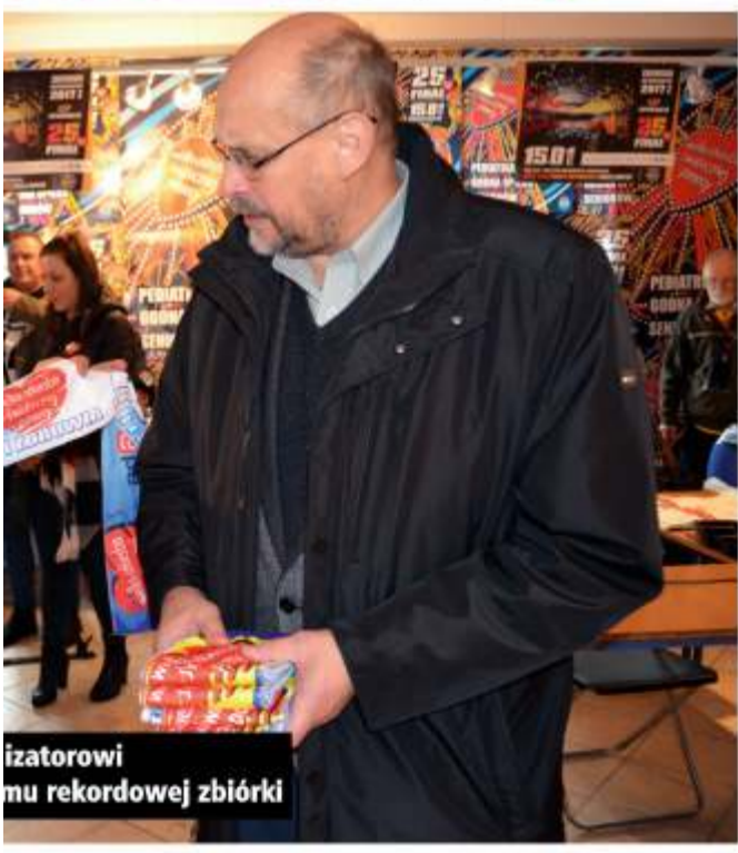
Organizatorowi... rekordowej zbiórki