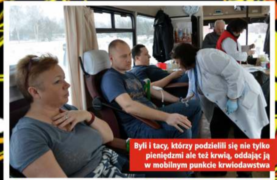
Byli i tacy, którzy podzielili się nie tylko pieniędzmi ale też krwią, oddając ją w mobilnym punkcie krwiodawstwa