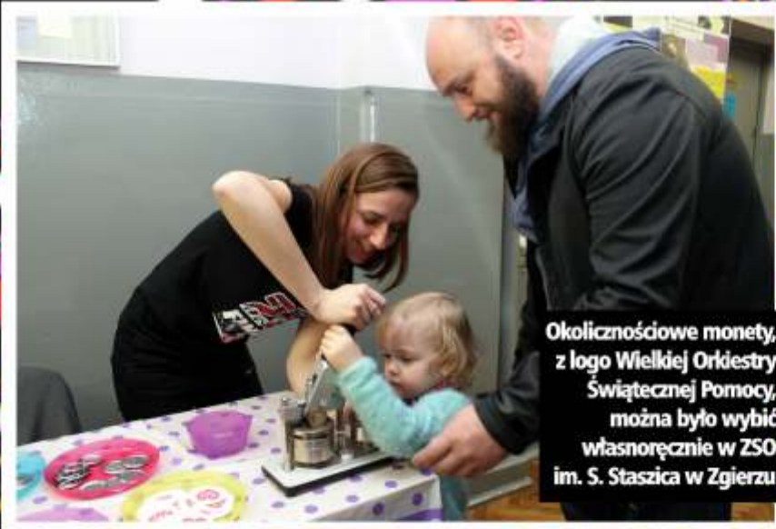
Okolicznościowe monety, z logo Wielkiej Orkiestry Świątecznej Pomocy, można było wybić własnoręcznie w ZSO im. S. Staszica w Zgierzu