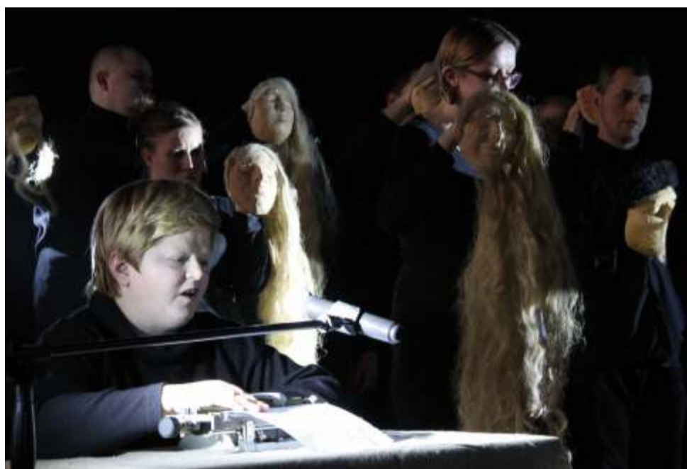
„Zaziulka” (z języka białoruskiego – kukłka) zapewniła zespołowi „Leśne Nuty” zwycięstwo i możliwość zaprezentowania swoich umiejętności podczas gali finałowej w Krakowie

Laureaci zgierskich eliminacji: 3 zespoły teatralne i solista pojedą do Krakowa na Galę do Teatru im. Juliusza Słowackiego, która odbędzie się w dniu 13 marca 2017 roku. [MT/ŁR]