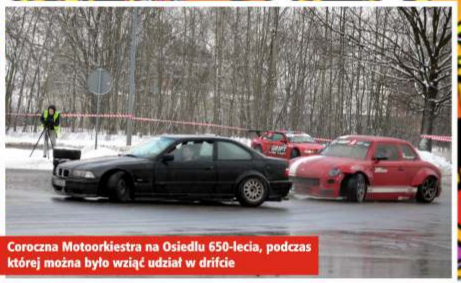
Coroczna Motoorkiestra na Osiedlu 650-lecia, podczas której można było wziąć udział w drifcie