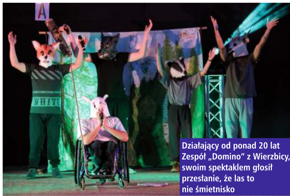
Działający od ponad 20 lat Zespół „Domino” z Wierzbicy, swoim spektaklem głosił przesłanie, że las to nie śmietnisko