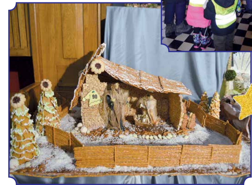
Smakowita szopka wykonana przez organizatorów konkursu – PSLCP w Ozorkowie