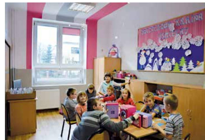
Wyremontowana świetlica w Zespole Szkół Specjalnych w Ozorkowie

- zainstalowano piec konwencyjno-parowy wraz z instalacją do kuchni szkolnej za 25 tys. zł; - wyremontowano kuchnię, klatki schodowe, stołówkę i świetlicę oraz zakupiono nowe meble do kuchni za kwotę ponad 34 tys. zł.