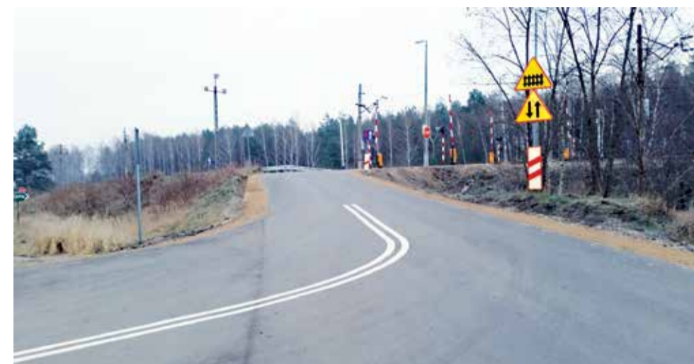
Przejazd kolejowy we wsi Orla z długo oczekiwaną nawierzchnią asfaltową

kwota umowna: 81 555,15 zł odcinek długości 0,190 km