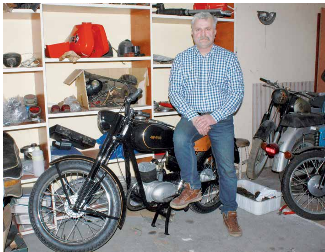
W kolekcji zgierzzanina znajduje się m.in. motocykl WFM M06 z 1956 r.