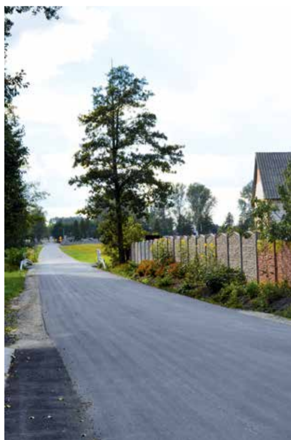
Droga w Solcy Wielkiej

kwota umowna: 269 087,17 zł powiat zgierski: 169 087,17 zł dotacja z Gminy Parzęczew: 100 000,00 zł odcinek długości 1,373 km