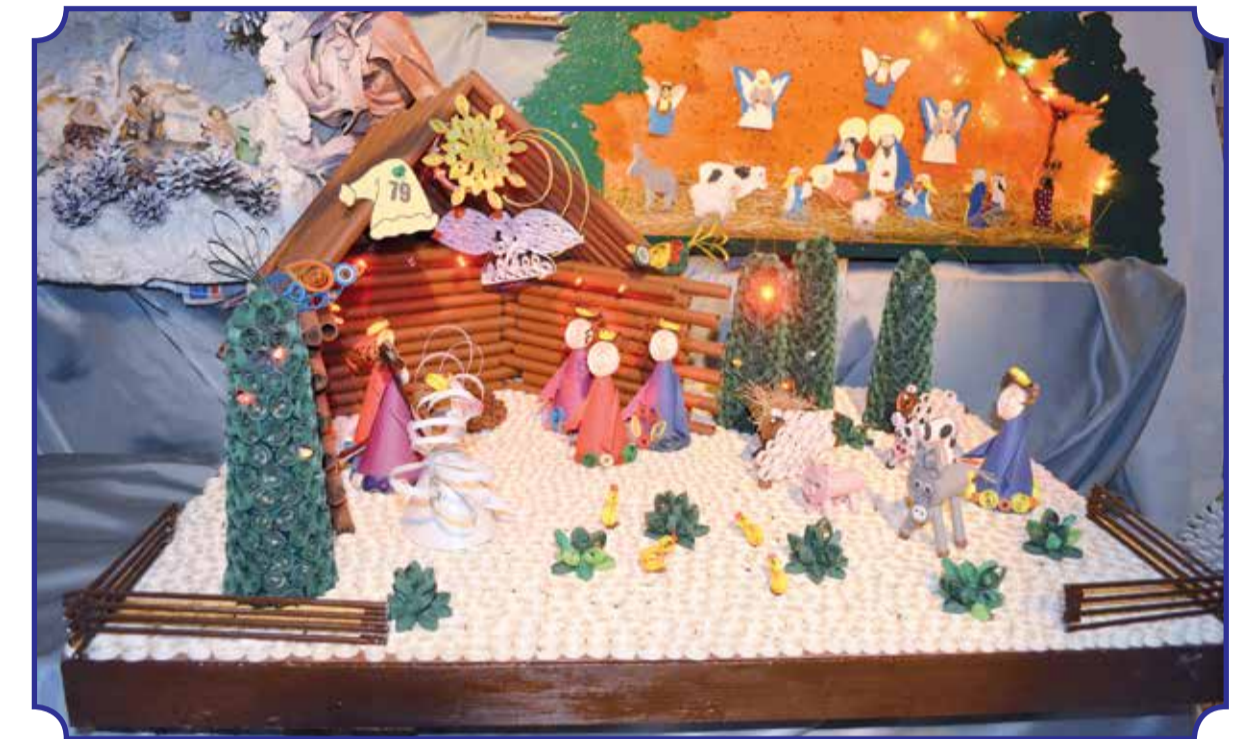
Praca wykonana metodą quillingu