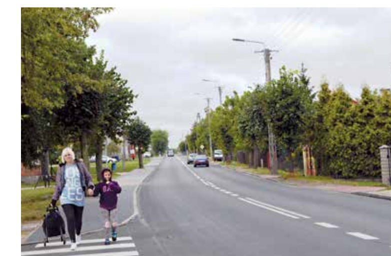
Ulica Konstytucji 3-go Maja w Ozorkowie

koszt zadania: 1 946 300,96 zł udział powiatu zgierskiego: 792 156,98 zł MT, JŁ