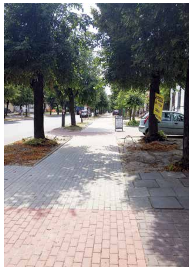
Ulica Swoboda w Głowniu

kwota umowna: 119 000,00 zł powiat zgierski: 74 000,00 zł dotacja z Gminy Miasta Głowna: 45 000,00 zł