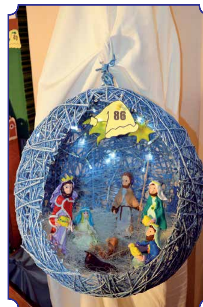
Szopka w wiklinowej kuli