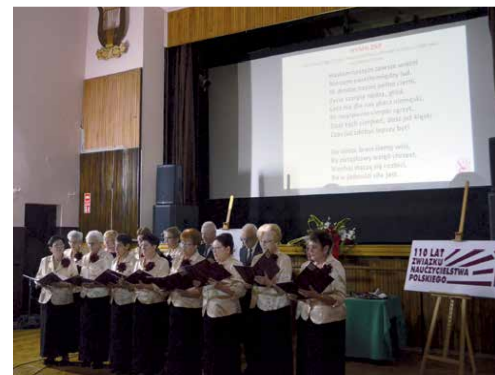
Głowieniecki chór Słoneczny Krąg odśpiewał Hymn ZNP, w którym przypomniane zostały słowa, że „w jedności siła jest”

Podczas uroczystości zgromadzeni goście obejrze- li prezentację multimedialną zatytułowaną „Związek Nauczycielstwa Polskiego – 110 lat w służbie polskiej oświaty”. Były to wyjątkowe chwile wzruszeń i wspomnień, zawierające archiwalne zdjęcia oraz przywołujące przełomowe chwile dla ZNP, zarówno tego zgierskiego, jak i głowienieckiego oddziału. Chwilą ciszy uczczono pamięć tych członków, którzy zginęli walcząc w obronie polskiej oświaty, zostali zamęczeni podczas II wojny światowej, czy tych, którzy już nie dożyli tych jubileuszów. JŁ