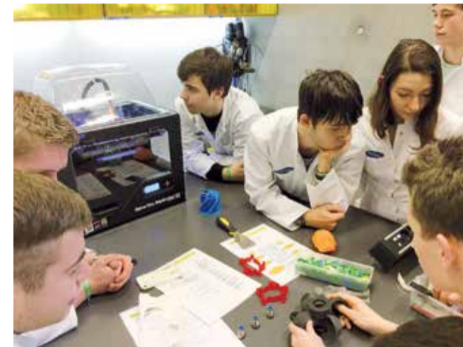
Uczniowie głowieńskiego „Cebertowicza” podczas zajęć w Centrum Nauki Kopernik

- zrealizowano projekt „Twój zawód – twoja przyszłość” o wartości 441,5 tys. zł (uczniowie szkoły odbywali zajęcia przygotowujące ich do egzaminów zewnętrznych oraz staże ułatwiające start do przyszłości zawodowej, zdobyli liczne certyfikaty, ukończyli szkolenia zewnętrzne), - oddano do użytku nową ekopracownię „EkoLab-Cebertowicz” wartą ponad 31,5 tys. zł.