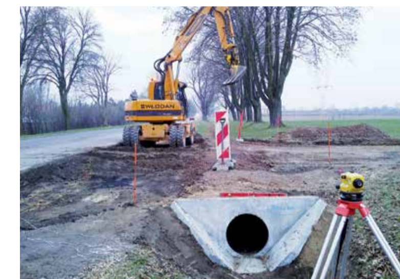
Prace na skrzyżowaniu drogi powiatowej relacji Glinnik – Klęk – Dobra – Dobieszków – Imielnik z drogą krajową Nr 71

koszt zadania: 12 890 109,81 zł udział powiatu zgierskiego: 2 500 000,00 zł * droga powiatowa Nr 5129 E: długość odcinka 10,49 km * droga powiatowa Nr 5130 E: długość odcinka 2,15 km * droga powiatowa Nr 5162 E: długość odcinka 0,50 km * droga powiatowa Nr 1150 E: długość odcinka 4,75 km