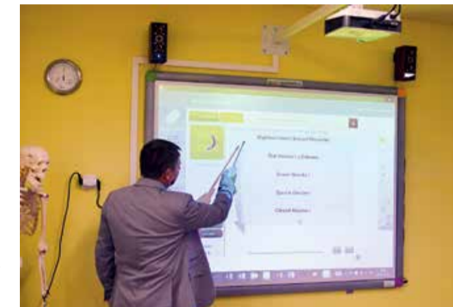
Dzięki tablicy interaktywnej, pierwszej w szkole, można w ciekawy sposób uczyć wszystkich przedmiotów

- zakupiono piec konwencyjno-parowy wraz z montażem i instalacją do kuchni szkolnej za 25 tys. zł i za ponad 11 tys. zł doposażono kuchnię; - oddano do użytku nową ekopracownię wartą 33,7 tys. zł;