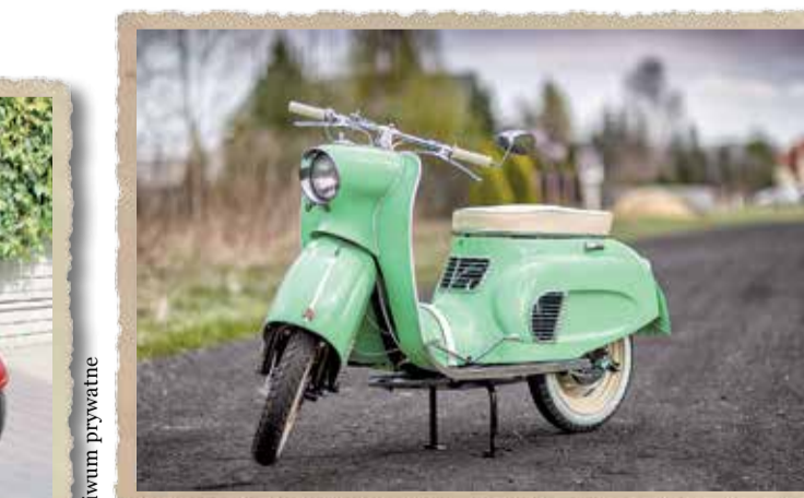
Odrestaurowana Osa M-52 to jedyny skuter produkowany seryjnie w PRL-u