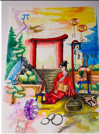
Kinga Matejko, klasa 1BC