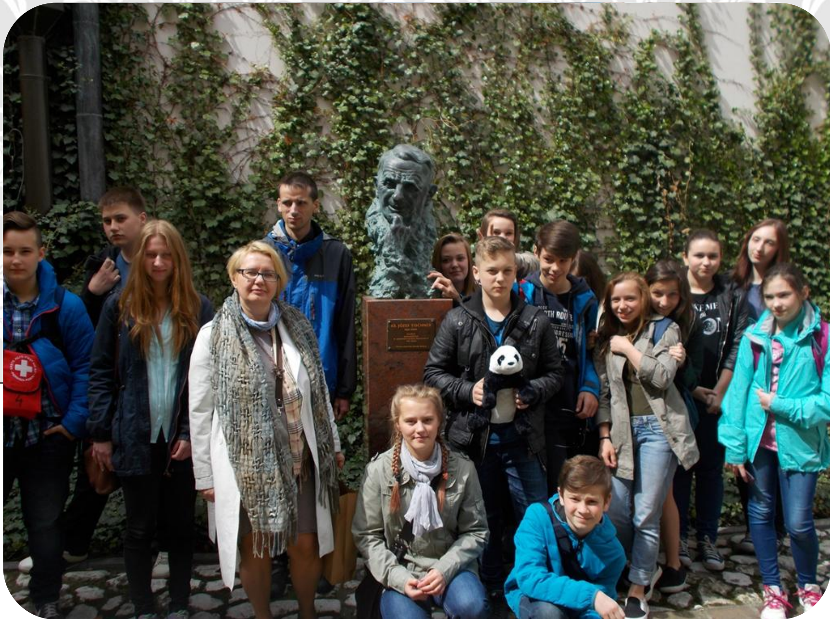
ZAŁĘK ESTREICHERA- RZEŹBA PRZEDSTAWIAJĄCA JÓZEFA TISCHNERA