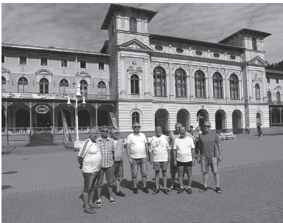
Uczestnicy przed starą pijalnią wód