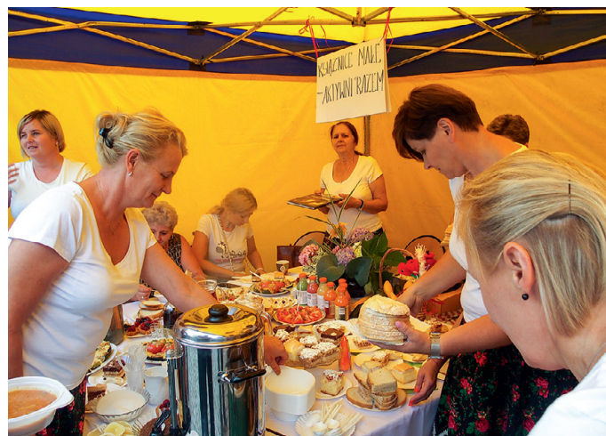
Panie ze Stowarzyszenia Kobiet Kreatywnych Wsi Rachwałowice oraz Stowarzyszenia Książnice Małe – Aktywni Razem podczas spotkania organizacji pozarządowych 6 lipca 2018 r.