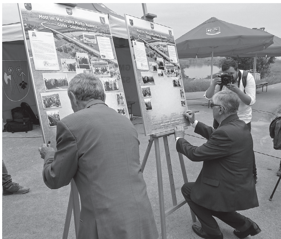
Wójtowie gmin Koszyce i Szczurowa składają podpisy na pamiątkowych tablicach

Most ma długość 426 m i szerokość 12,2 m. Realizacja tego zadania kosztowała ponad 20 mln zł. Most ten zapisał się w historii jako pierwszy zbudowany przez samorząd regionalny.