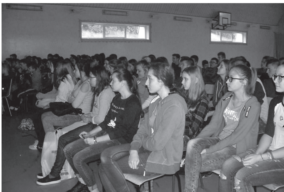
Młodzież biorąca udział w mityngu

W trakcie pierwszego mityngu w Centrum Oświatowym w Koszycach w obrazowy i wzbożony ćwiczeniami sposób przedstawiono całościowy obraz człowieka i relacji międzyludzkich. Przedstawiono młodzieży wagę okazywania sobie nawzajem szacunku. Podjęty został również problem zachowań agresywnych. Podczas drugiego mityngu została również przedstawiona wiedza na temat niekorzystnego wpływu środków psychoaktywnych. Program Archipelag Skarbów® nie kończy się w chwili zakończenia realizacji odbywającej się w szko-