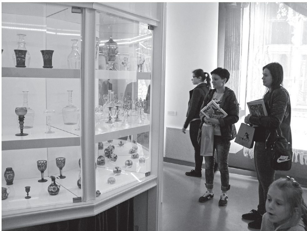
Centrum Szkła i Ceramiki w Krakowie

Warsztaty rozpoczęły się pokazem ręcznego formowania szkła w hali produkcyjnej, wpisanej na listę Krakowskiego Szlaku Tech-