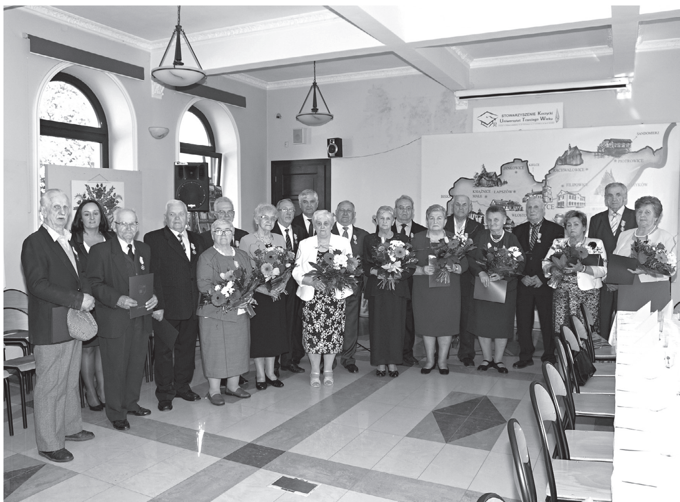
Wspólna fotografia uczestników uroczystości