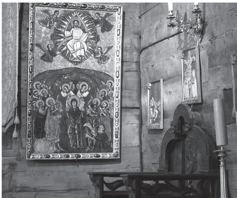
Stara ikona Pantokratora