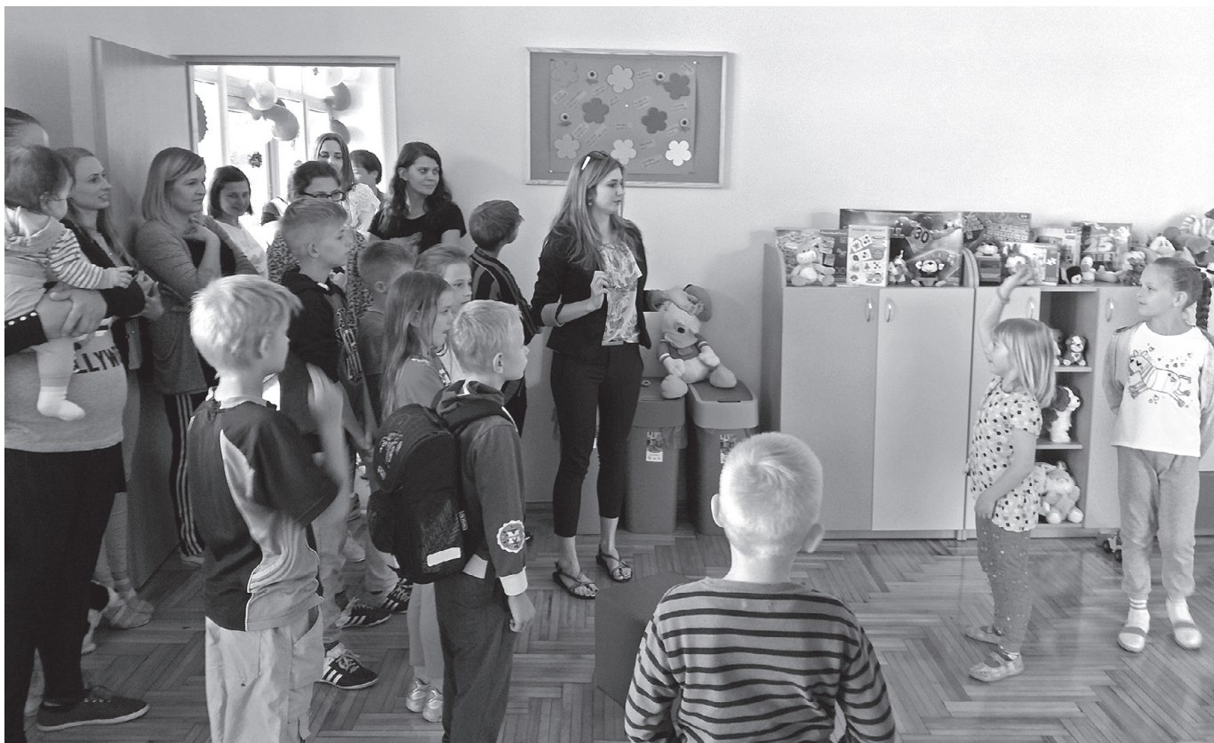
Spotkanie integracyjne w świetlicy środowiskowo-socjoterapeutycznej

skiego na lata 2014–2020, oś Priorytetowa 9. Region spójny społecznie, Działanie 9.2, Poddziałanie 9.2.1 uprzejmie poinformuje, iż w poniedziałek 21 maja 2018 r. w Domu Kultury w Przemykowie, gm. Koszyce miało miejsce pierwsze spotkanie w nowopowstałej placówce wsparcia dziennego – oczekiwanej