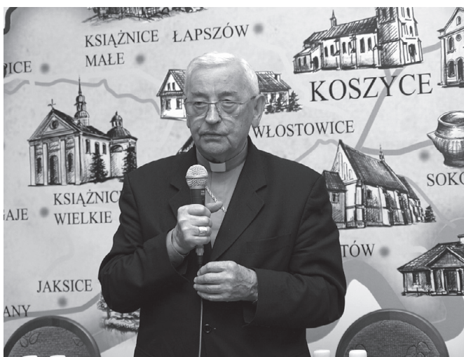
Ksiądz Biskup Tadeusz Pieronek