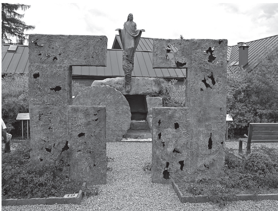
Symbolika Krzyża i Zmartwychwstania Chrystusa w Ogrodzie Biblijnym

ściennych zakrystii, co tylko w minimalnym stopniu pokazują załączone zdjęcia. Nieco mniej okazałe, ale też piękne, są cerkwie w pobliskim Jastrzębiku oraz w Muszynie-Złockiem, do których mozolnie dojechaliśmy na rowerach niezbyt stromymi, ale długimi podjazdami.