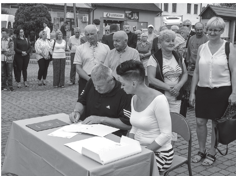
Radni Gminy Koszyce podpisują Akt Erekcyjny