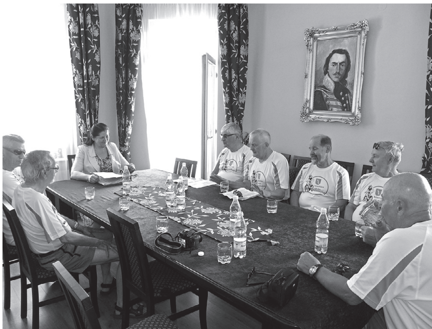
Grupa na spotkaniu w Urzędzie Miasta i Gminy Muszyna