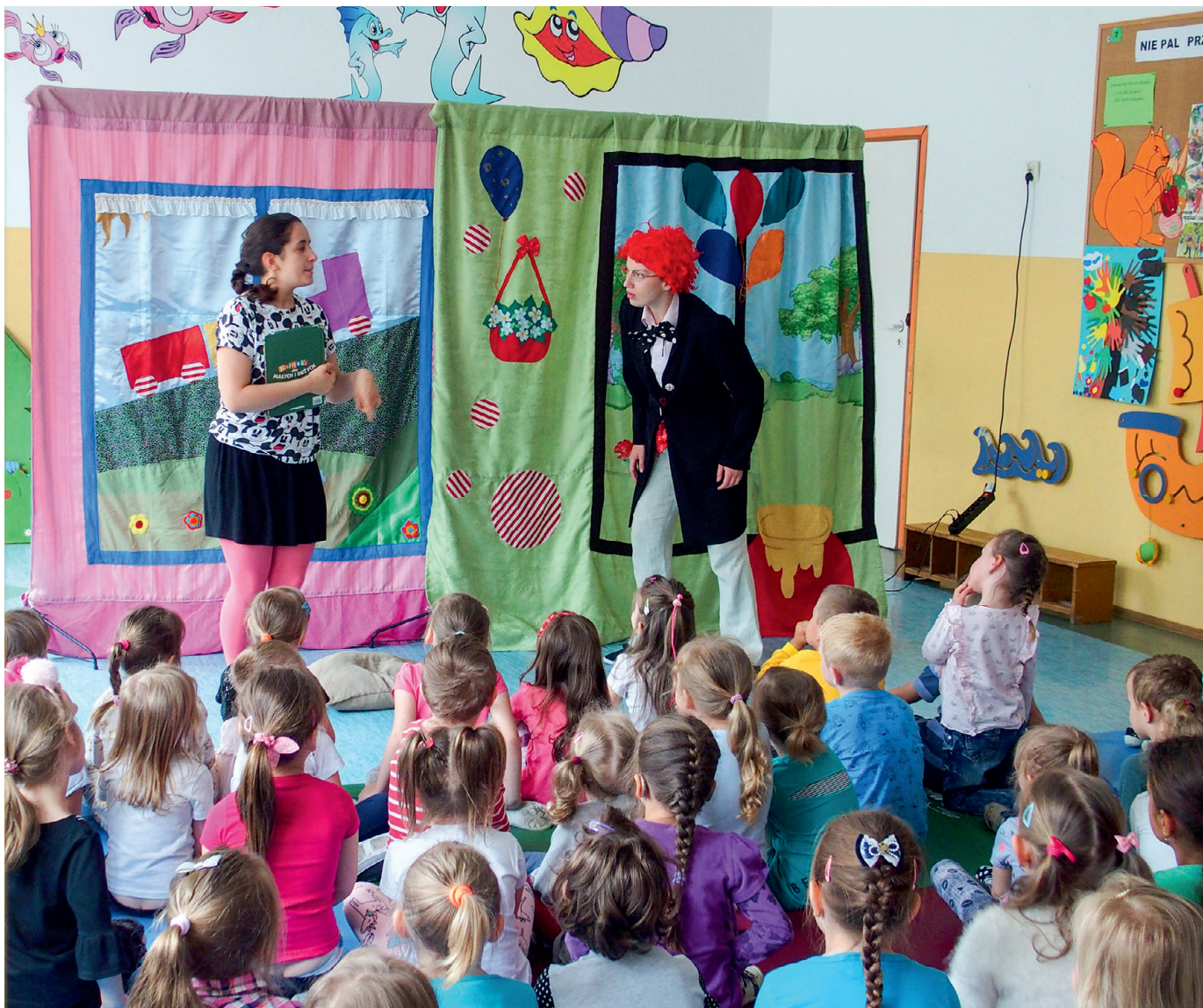
Artyści Teatru Edu-Artis