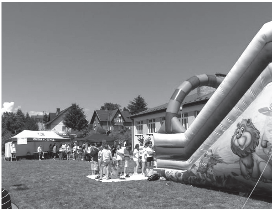
Atrakcje dla dzieci

Podczas pikniku można było zobaczyć pokaz pierwszej pomocy, dokonać pomiaru ciśnienia i poziomu cukru, porozmawiać z zaproszonymi gośćmi. Dla dzieci nie zabrakło również atrakcji – bawiły się na zjeżdźalni dmuchanej, wspinały się na ściankę wspinaczkową, malowały sobie twarze. Fani ciężkich motorów podziwiali zgromadzone przy Centrum Oświatowym motocykle Wolnej Grupy Motocyklowej „Sfora”. Mogliśmy także kibicować drużynom podczas meczu piłki nożnej uświetnionym tańcem szkolnych cheerleaderek. Oprócz zawodów i zabaw można było potać zumbę.