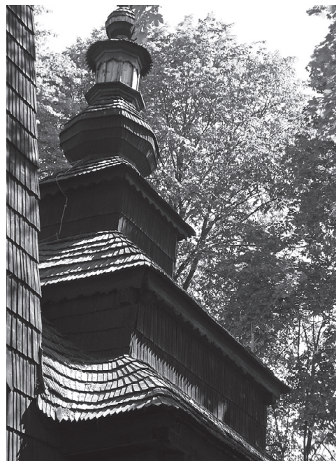
Wieża cerkwi w Powroźniku

Następnie ścieżką rowerową udaliśmy się do miejscowości Powroźnik, gdzie znajduje się zachowana w doskonałym stanie zabytkowa cerkiew łemkowska św. Jakuba z początku XIX wieku z dwoma różnej wysokości wieżami. Jednak najstarsza część cerkwi stanowiąca dzisiejszą zakrystię powstała w 1643 roku. Pierwotnie cerkiew stała tuż nad rzeką Muszynką, w związku z czym była narażona na zalewanie podczas powodzi. Próba przeniesienia cerkwi na znacznie wyżej położone miejsce nie w pełni się udało, ocalała tylko część (zakrystia i część ikonosta-