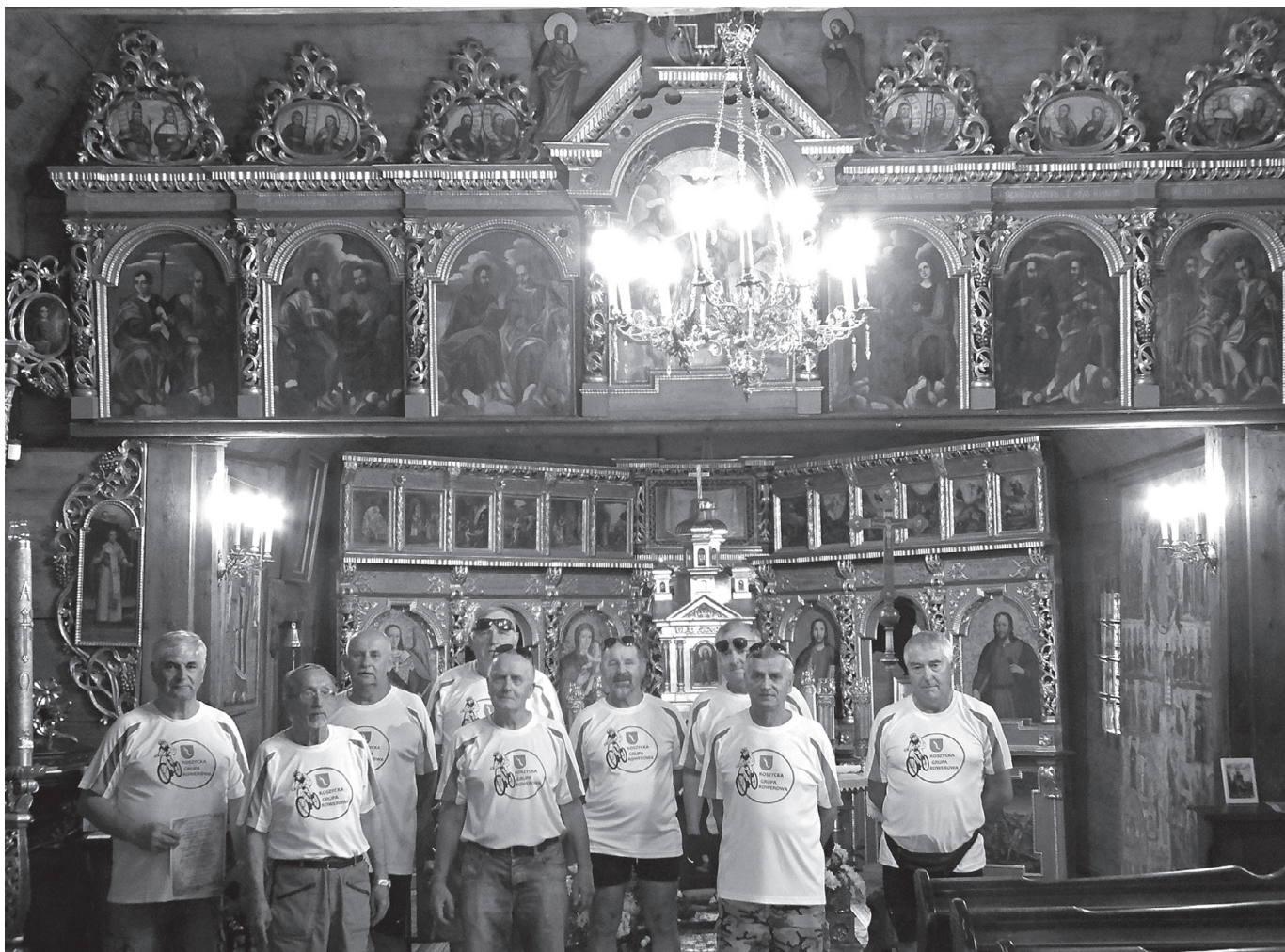
Uczestnicy wyjazdu na tle ikonostasu