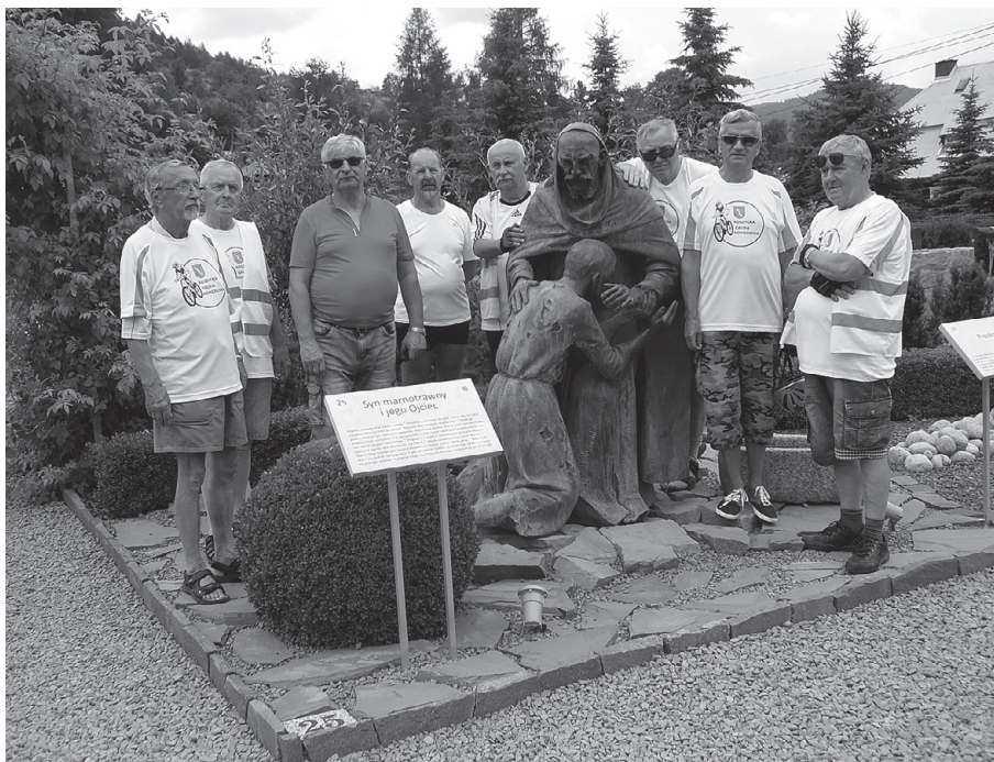
Grupa przy rzeźbie słynnej sceny powrotu marnotrawnego syna

A teraz czas na wyjaśnienie tajemnicy tytułu. W niedzielę po śniadaniu wyjechaliśmy rowerami do Krynicy. Wjeżdżając do miasta wyprzedzała nas okazja limuzyna na krakowskich numerach rejestracyjnych; kierowca zwolnił, otworzył szybę boczną i powiedział (mniej więcej) tak: „Pierwszy raz widzę tak dobrze zorganizowaną grupę rowerzy-