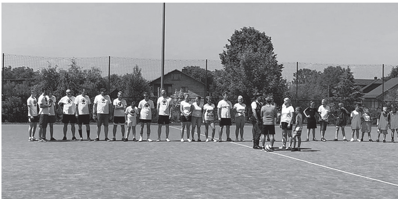
Mecz z udziałem motocyklistów

gości była Powiatowa Straż Pożarna, Stowarzyszenie „Amazonki”, Wolna Grupa Motocyklowa „Sfora”, Fundacja „Corde Canis”, a także studenci Akademii Medycznej.