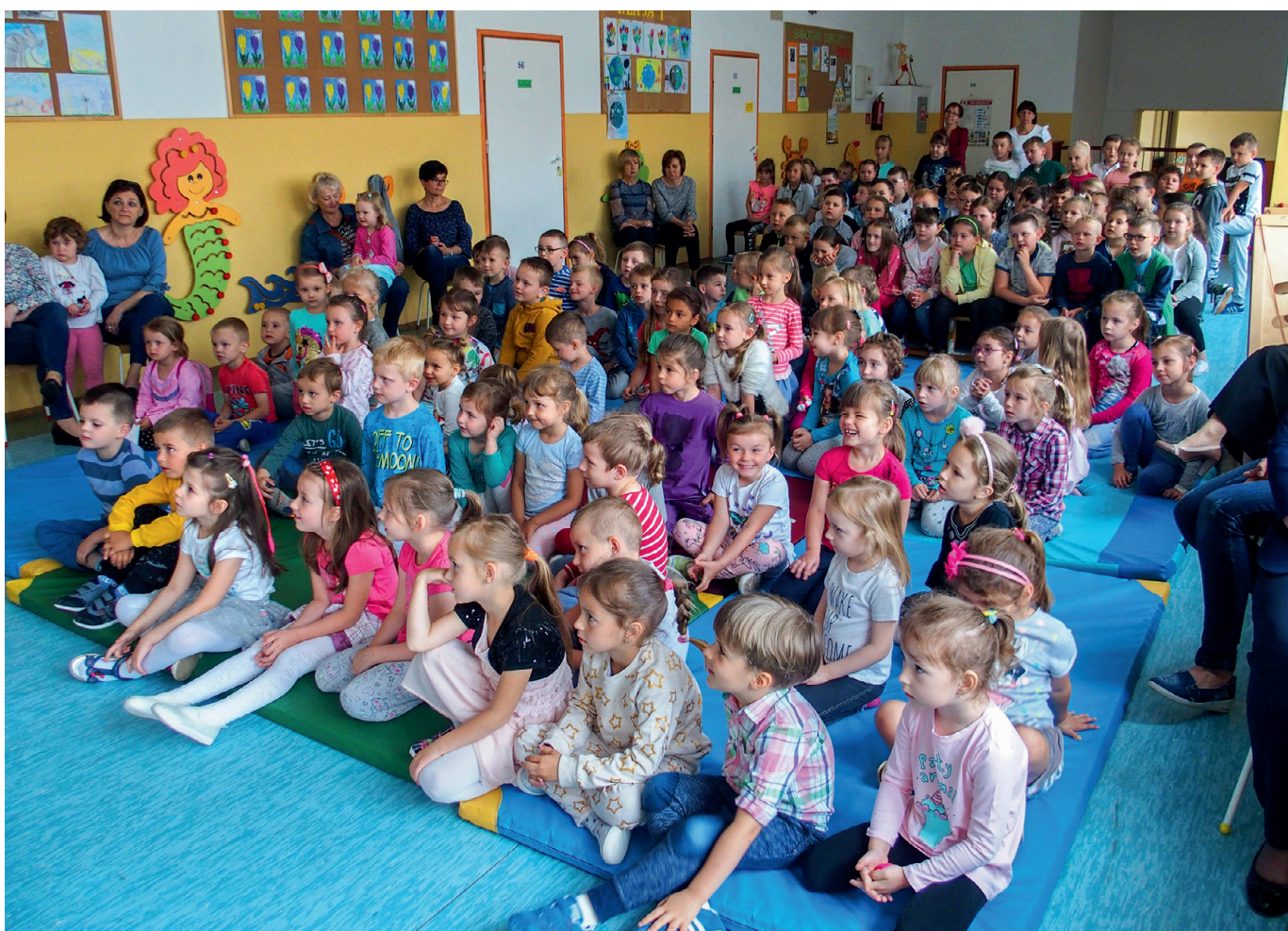
Dzieci uczestniczące w spektaklu