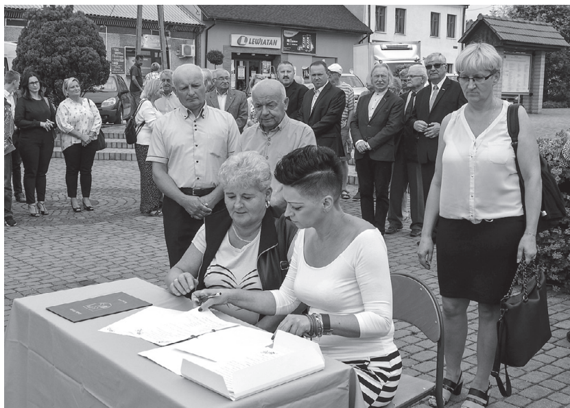
Radni Gminy Koszyce podpisują Akt Erekcyjny