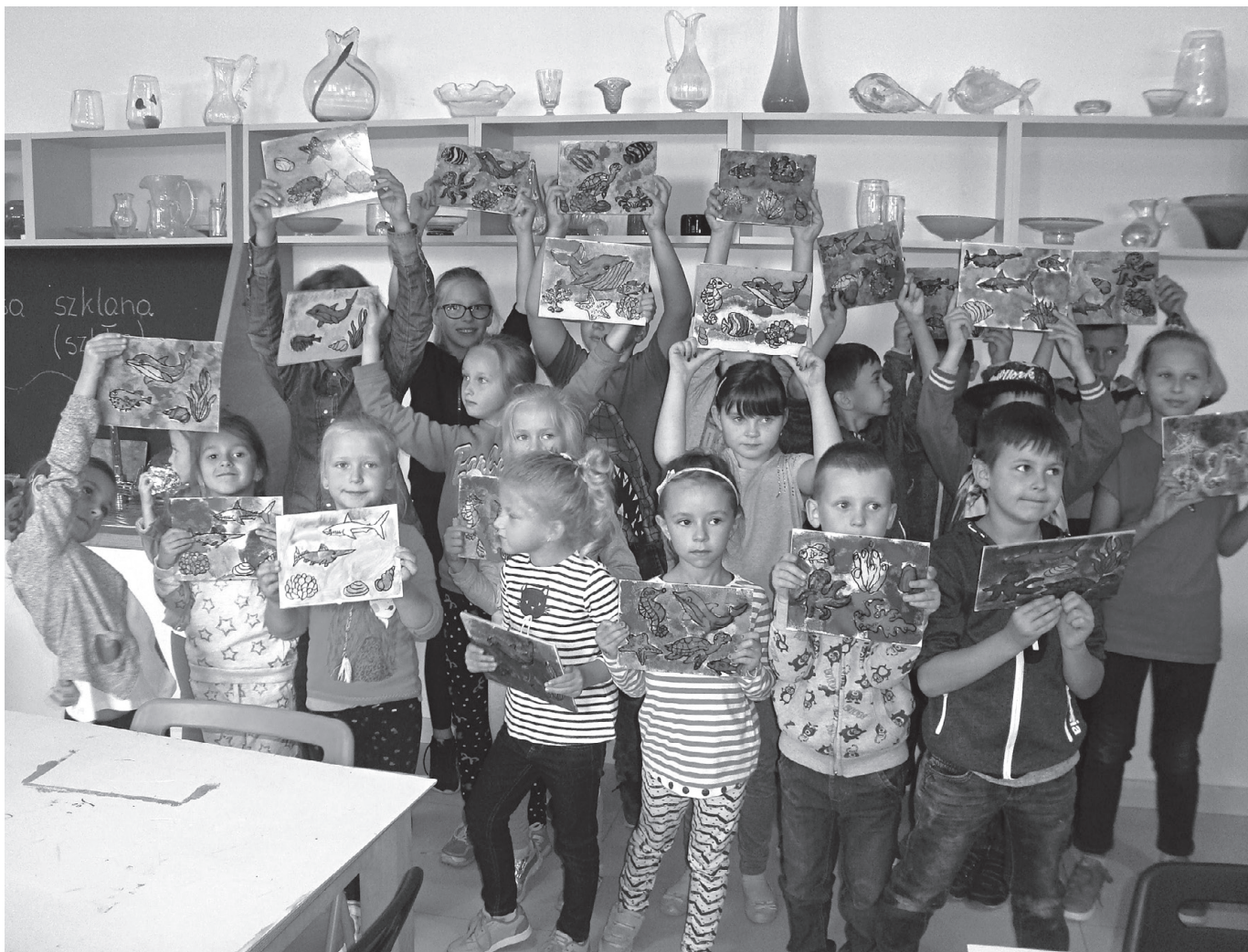
Warsztaty w Centrum Szkla i Ceramiki w Krakowie

niki. W trakcie pokazu hutnicy tworzyli na naszych oczach figurki zwierząt. Mogliśmy spróbować swoich sił w zawodzie hutnika – szklarza poprzez samodzielne dmuchanie w hutniczą piszczel. Po pokazie odbyły się warsztaty malowania na szkle z tematem przewodnim „Moje małe akwarium”. Każde dziecko miało okazję do rozwinięcia artystycznego talentu. Panie prowadzące były perfekcyjnie przygotowane, panowała serdeczna atmosfera, fascynacja i radość dzieci. W sklepie firmowym działającym tuż przy galerii mogliśmy zakupić wyroby szklane, ręcznie wykonane przez artystów hutników.