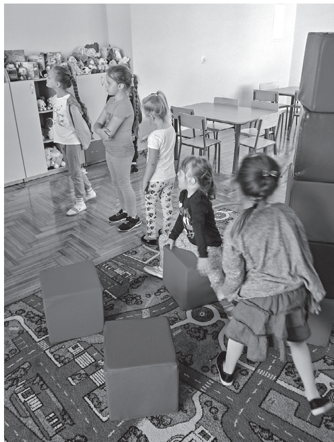
GOPS Zajęcia w świetlicy

Zajęcia w placówce odbywają się w dwóch grupach wiekowych (młodsze i starsze dzieci). Placówka funkcjonuje od poniedziałku do soboty, 4 godziny dziennie w tym w wakacje i ferie. Świetlica dysponuje 30 miejscami dla dzieci/młodzieży z terenu gminy Koszyce w wieku szkolnym – do 18 roku życia. Działania ukierunkowane są również na najbliższe otoczenie uczestników projektu – rodzice, rodziny. W ramach projektu realizowane będą zadania takie jak: wsparcie w formie dożywiania dla uczestników; dowóz dzieci i młodzieży do placówki; zajęcia w formie kompensacji braków w nauce, nauka języka angielskiego, nauka umiejętności informatycznych, warsztaty: profilaktyki uzależnień, sportowo-rekreacyjne, plastyczno-techniczne oraz zajęcia rewalidacyjno-socjoterapeutyczne. Część działań dedykowanych będzie dla całych rodzin m.in. warsztaty z psychologiem, spotkania integracyjne.