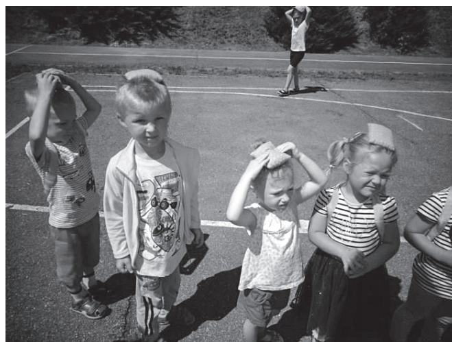
Zabawy z udziałem przedszkolaków