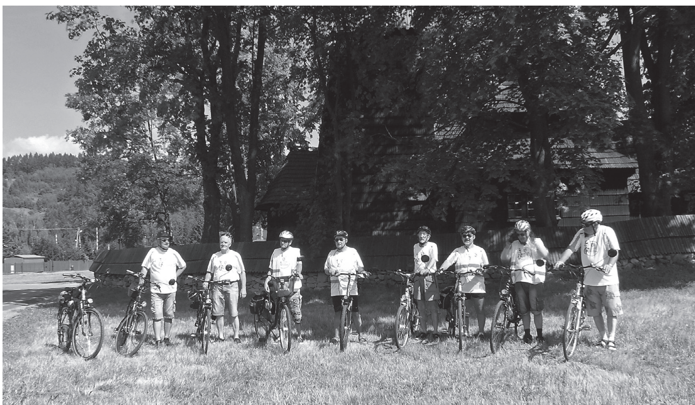
Zdjęcie przed cerkwią