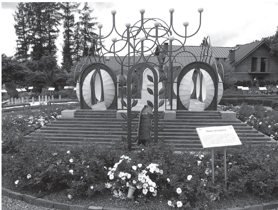
Ogród Biblijny – Nowa Jerozolima