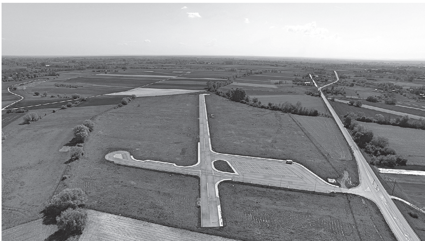
Koszycka Strefa Aktywności Gospodarczej z lotu ptaka