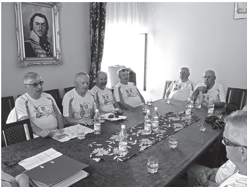
Grupa na spotkaniu w Urzędzie Miasta i Gminy Muszyna

czeń z zakresu działalności lokalnych organizacji pozarządowych, osiągnięć na niwie przeciwdziałania uzależnieniom oraz rozwoju sportu i turystyki. Na koniec otrzymaliśmy po kilka folderów i mapek promujących zabytki, atrakcje przyrodnicze i uzdrowiskowe gminy Muszyna.