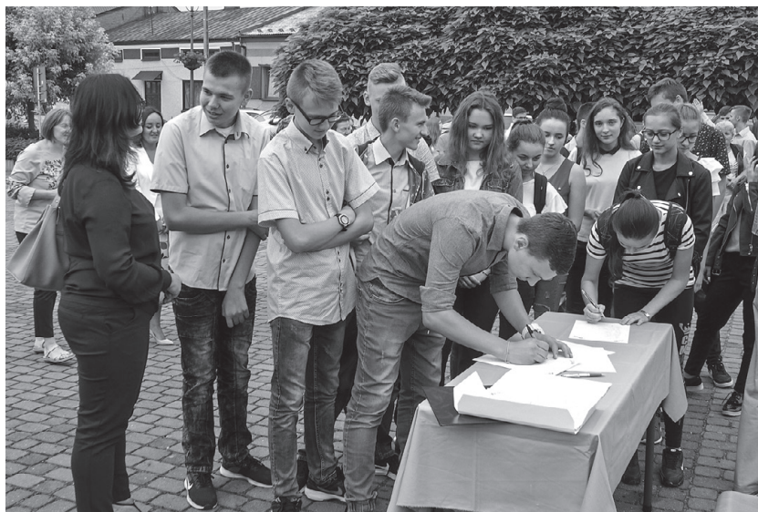
Akt erekcyjny podpisywany przez młodzież