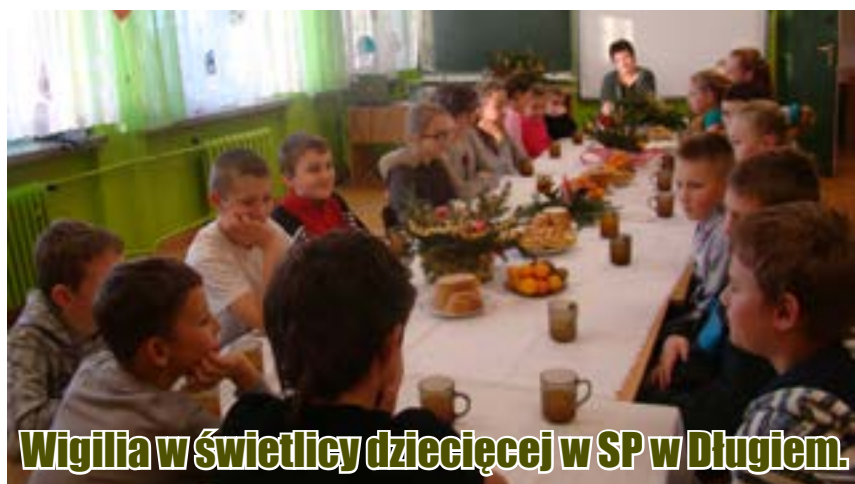
Wigilia w świetlicy dziecięcej w SP w Długiem.

Wigilia dla większości z nas to najpiękniejszy i najmilszy wieczór w roku. Jego obchodzenie wiąże się z wielowiekową tradycją i obyczajami.